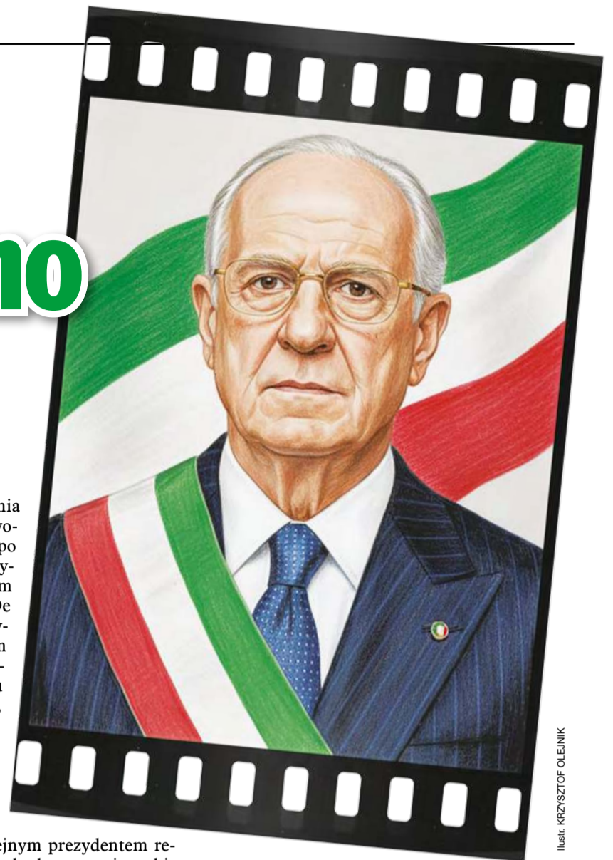
Ilustr. KRZYSZTOF OLEJNIK

kandydat na włoskiego prezydenta musi mieć co najmniej 50 lat. W praktyce jednak pięćdziesięcioletek na prezydenturę we Włoszech nie ma szans – gdy Napolitano obejmował urząd, miał lat 80; Mattarella tylko 73.