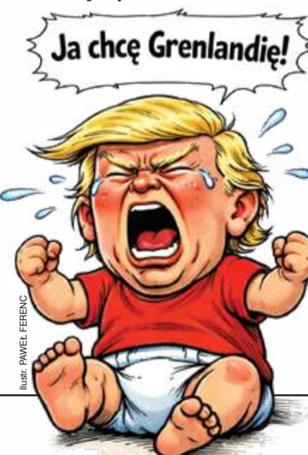
Ilustr. PAWEŁ FERENC