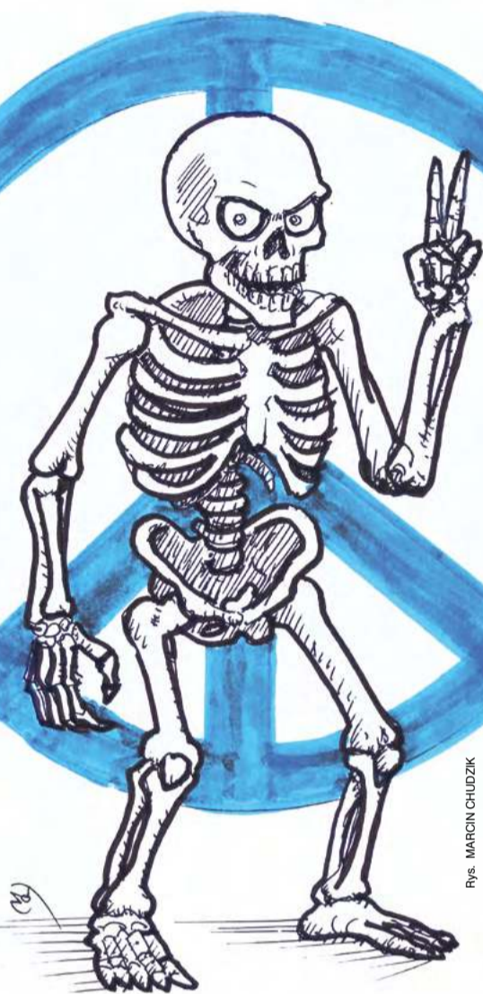
rys. MARCIN CHUDZIK

Zygmunt Bauman zwraca uwagę na podstawową różnicę, jaka w języku angielskim występuje między dwoma sposobami pojmowania bezpieczeństwa: terminami safety i security . To pierwsze