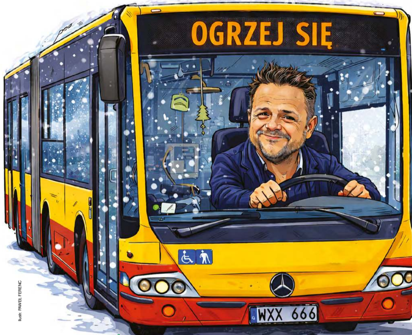
Ilustr. PAWEŁ FERENC