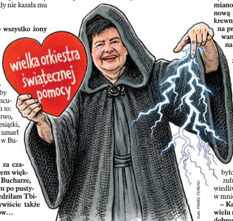
ILUSTRACJA: PAVEL FERENC

– Jestem pewna, że Czytelnicy „NIE” to wiedzą, ale z przyjemnością, zawsze to okazja, żeby coś napisać w niecenzuralnym języku. Bomż oznacza osobę „bez określonego miejsca żytelstwa” – czyli bez stałego miejsca zamieszkania – ale niekoniecznie bezdomnego. Hodża był wędrownym mędrcem, w książce zwanym „mąciwodą i wicherzycielem” – i jak przystało na bohatera radzieckiej literatury młodzieżowej, zwalczał religianstwo, bogaczy i głupich władców, ze szczególnym uwzględnieniem emira Buchary, skąd pochodził. Swoją drogą, średniowieczni twórcy legend o Nasreddinie – a już na pewno Sołowiowi, który 80 lat temu zaadaptował je na potrzeby radzieckiej młodzieży – przewidzieli Donalda Trumpa. Toczka w toczkę.