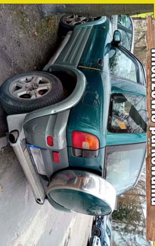
Szybki kurs parkowania „na skos”.