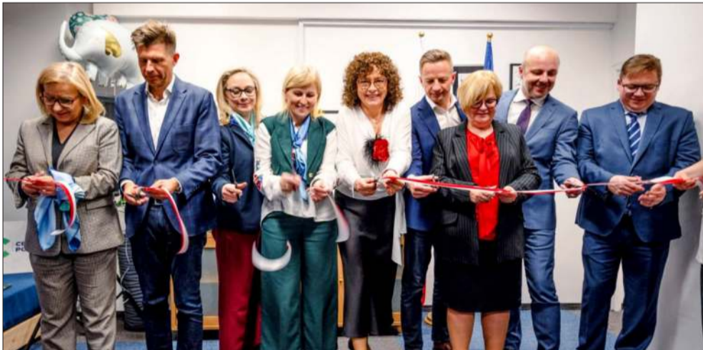
Wstęgę przecięło kilka znanych postaci

Zaledwie kilka tygodni temu poseł Elżbieta Burkiewicz opuściła Polskę 2050 i zmieniła barwy z żółtych na niebieskie. W zeszłym tygodniu otworzyła nowe biuro poselskie - tym razem w Rzeszowie.