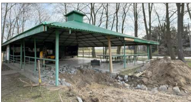
Remont już się rozpoczął.

tychczasowe lastryko zostanie zastąpione nową nawierzchnią z kostki betonowej, co znacząco poprawi zarówno estetykę, jak i funkcjonalność obiektu. Po zakończeniu prac „grzybek” ma ponownie służyć mieszkańcom jako bezpieczne i zadbane miejsce spotkań.