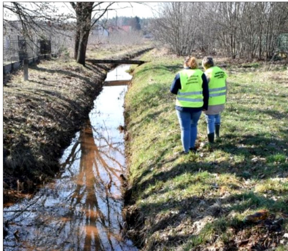
Zagadkowa substancja w Kanale Jaślańsko-Chorzelskim. Straż i WIOŚ w akcji