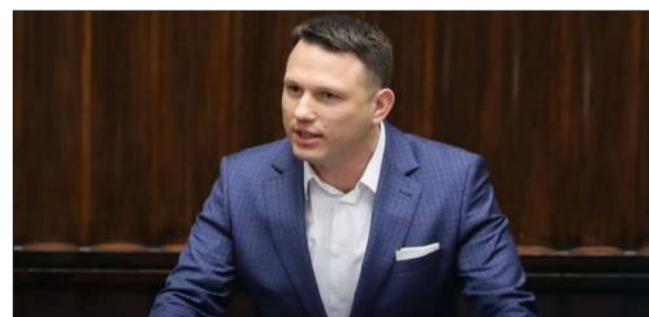
Mentzen ma odpowiedzieć na trudne pytania wyborców.

Jeden z liderów Konfederacji, prezes Nowej Nadziei, przedstawił właśnie plan spotkań, który obejmuje kilkanaście miast w Polsce. Jednym z miast na trasie jest Mielec.