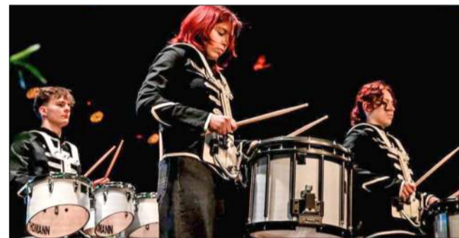
Żywiłowy występ Orkiestry Młodych Bębniarzy