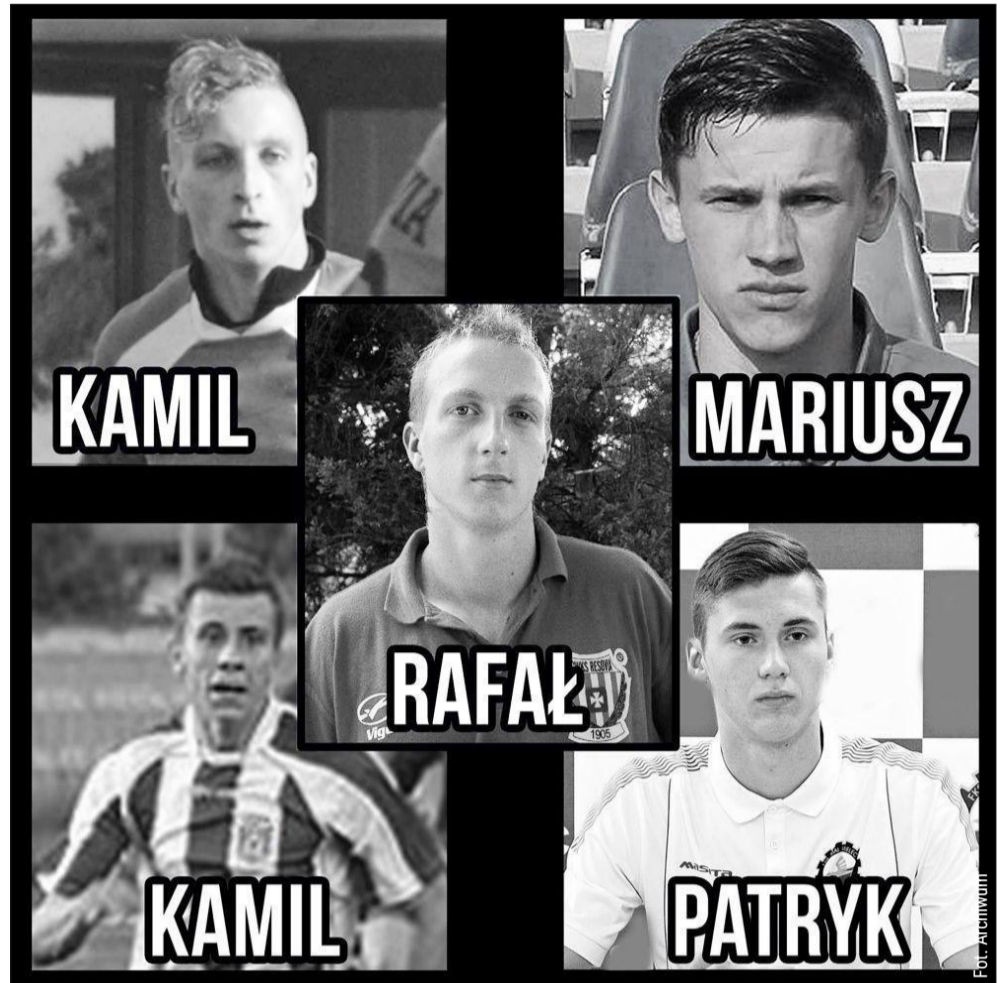
Dziesięć lat temu doszło do tragicznego wypadku w Weryni.