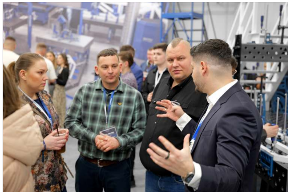
Podczas Dni Otwartych wiele się działo.

Co istotne, GPPH nie dostarcza tylko „mebli” warsztatowych. Firma oferuje kompleksowe oprzyrządowanie: precyzyjne narzędzia spawalnicze oraz dedykowaną chemię, która nie tylko ułatwia pracę, ale realnie wydłuża żywotność sprzętu. Fakt, że cały proces projektowy i produkcyjny odbywa się w Polsce, jest powodem do dumy i gwarancją pełnej kontroli nad każdym detalem.