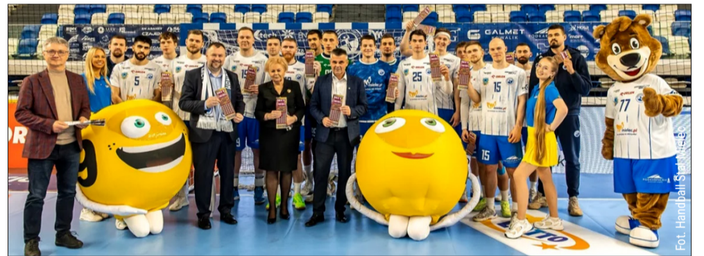
Handball Stal Mielec ma nowego sponsora.

Klub Handball Stal Mielec oficjalnie nawiązał współpracę partnerską z Totalizatorem Sportowym. W ramach tej umowy marka LOTTO stała się widoczna na strojach sztabu szkoleniowego, materiałach promocyjnych oraz w mediach społecznościowych klubu. Logotyp sponsora pojawił się również w przestrzeni reklamowej hali MOSiR w Mielcu podczas domowych spotkań ORLEN Superligi i Pucharu Polski, debiutując przy okazji meczu z MMTS-em Kwidzyn.