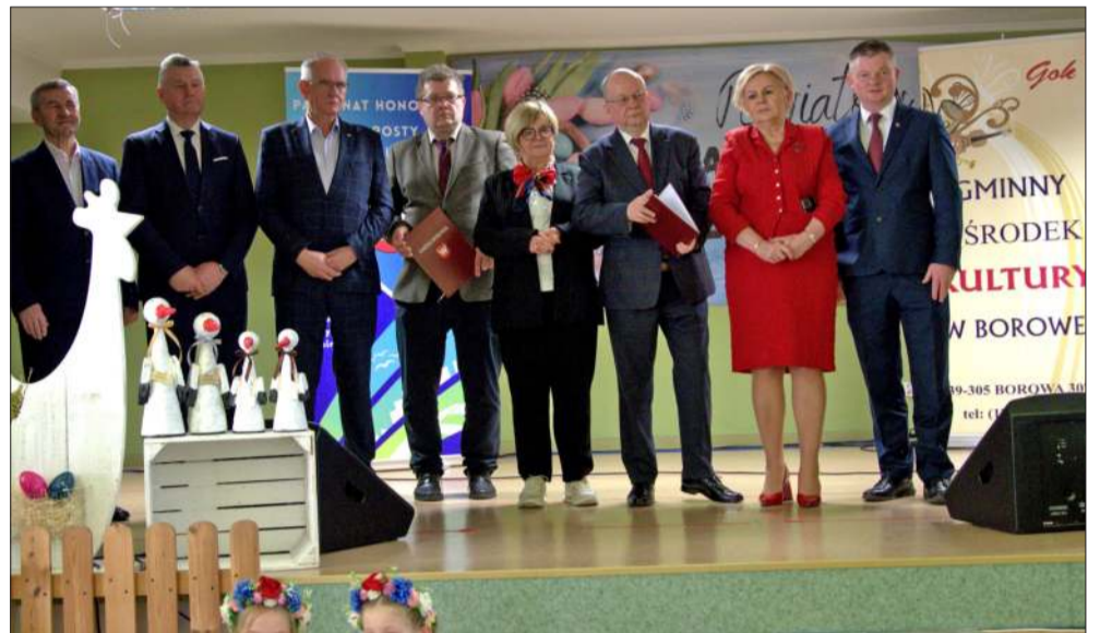
Jarmark to przede wszystkim święto lokalnych smaków i tradycji.