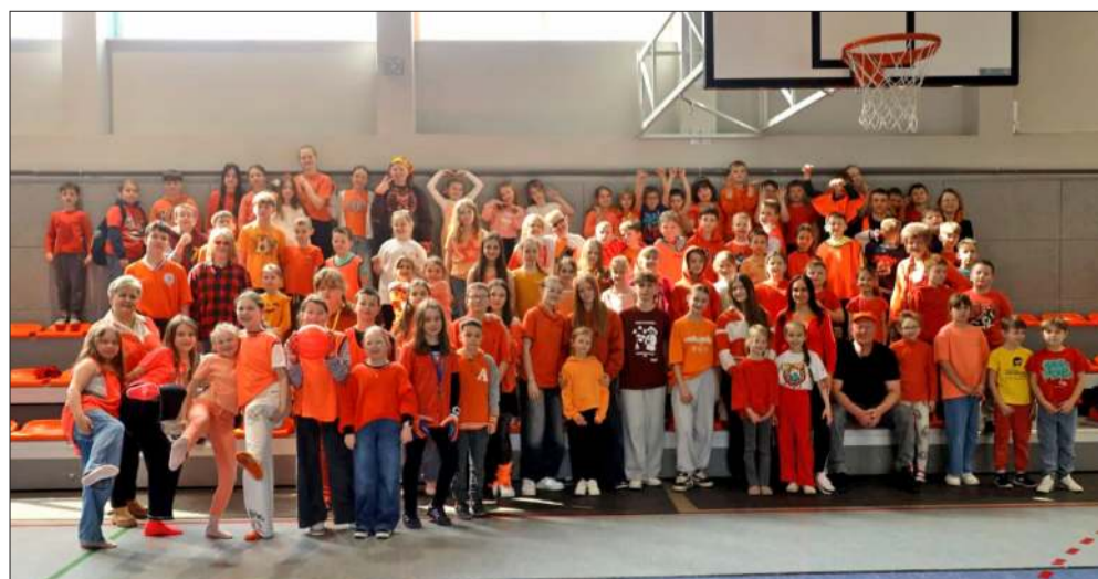
SP nr 3 zainicjowała akcję.