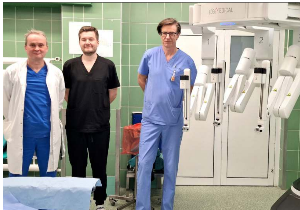
Nowoczesny system chirurgiczny w mieleckim szpitalu

Szpital Specjalistyczny w Mielcu zachęca pacjentów z chorobami prostaty, nowotworami pęcherza moczowego oraz guzami nerek do konsultacji w Poradni Urologicznej. jb