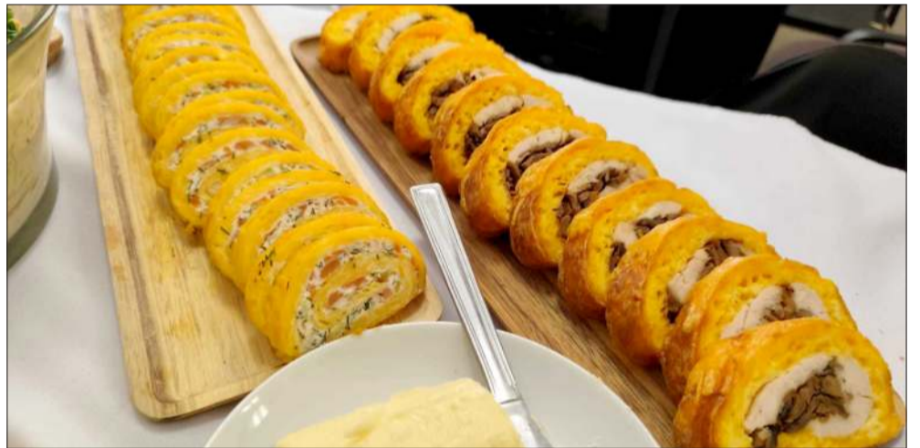
Co za pyszności!