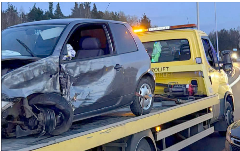
Szalony rajd mieszkańca powiatu kolbuszowskiego. Miał blisko 2 promile.