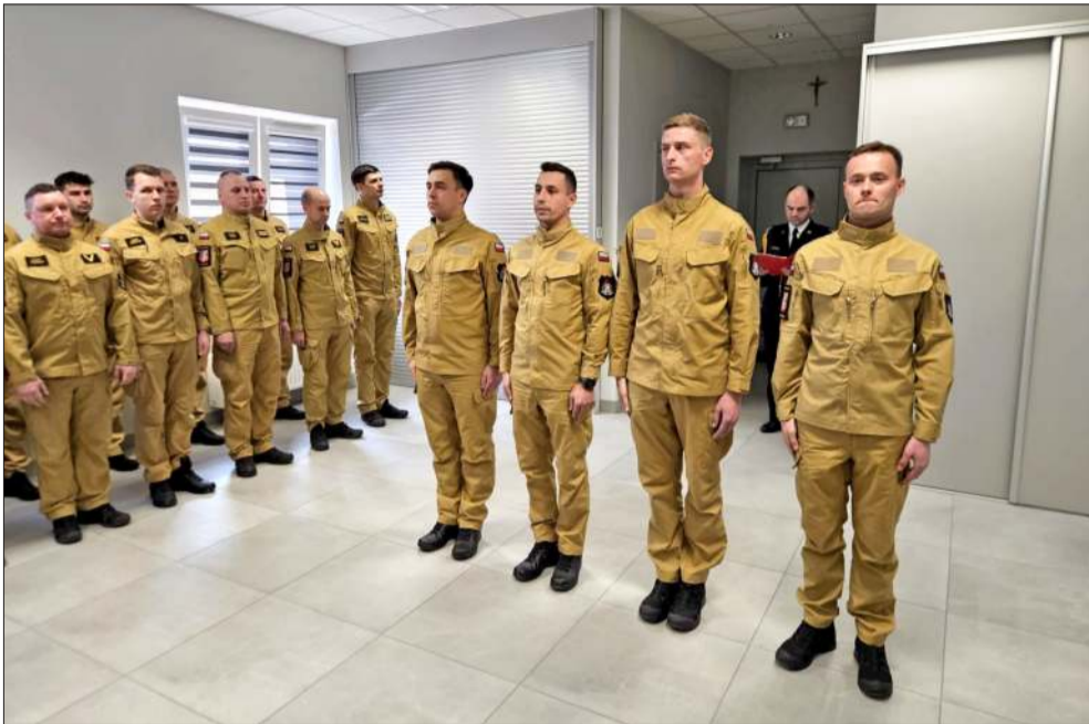
Uroczystość w mieleckiej straży pożarnej. Czterech młodych ludzi wstąpiło w szeregi PSP.

Szeregi Komendy Powiatowej Państwowej Straży Pożarnej w Mielcu oficjalnie się powiększyły. W siedzibie jednostki odbyła się podniosła uroczystość, podczas której czterech młodych adeptów pożarnictwa wypowiedziało słowa roty ślubowania. Od dziś ich życie to nie tylko zawód, ale przede wszystkim trudna i odpowiedzialna misja.