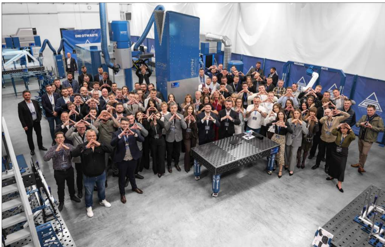
Architekci spawalniczego sukcesu.