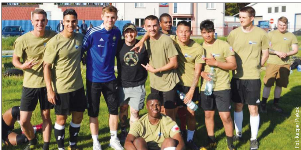
Amerykańscy żołnierze stacjonowali w Mielcu po wybuchu wojny na Ukrainie.