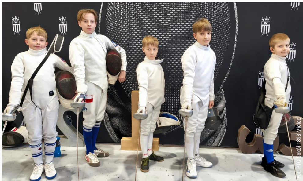
Sokół rywalizował w Warszawie.

W miniony weekend reprezentanci PTG Sokół 1893 Mielec wystąpili w XV edycji turnieju szpadowego Warszawa Syrenka 2026. Mielczanie zdobyli dwa złote medale, dwa miejsca na podium oraz szereg lokat w różnych kategoriach wiekowych.