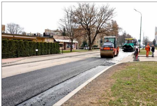
Ul. Ks. Piotra Skargi w remoncie.

Celem realizowanego remontu jest poprawa bezpieczeństwa