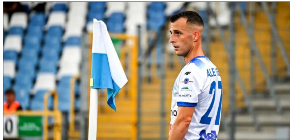
Kolejne zwycięstwo mielczan