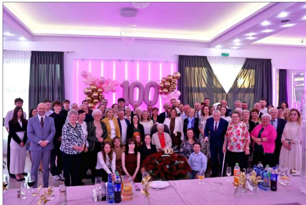
Piękna, pamiątkowa fotografia.