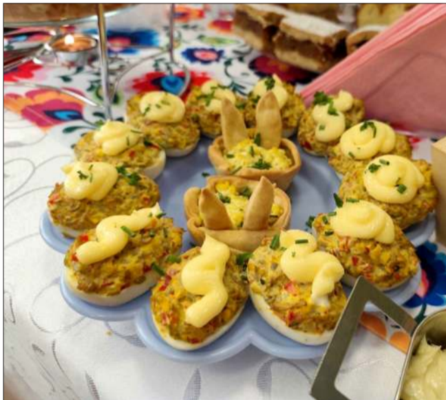
Jajka można przygotować na nieskończoną ilość sposobów

- W przyszłym roku, kiedy będziemy ten jarmark organizować na nowoczesnej hali sportowej, z obiektami sportowymi, będziemy mieli komfortowe warunki, aby wszystkie koła gospodyń mogły się pokazać z tej jak najlepszej strony, bo naprawdę jest co oglądać, jest co smakować, jest jak przygotować się do Świąt, aby ten smak poczuć już dzisiaj. Cieszę się bardzo, że wszyscy zaproszeni goście nam dopisali. Dziękuję Powiatowi Mieleckiemu, a szczególnie panu staroście, za patronat nad tą imprezą (...). Z tej też oka-