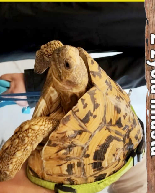
Żółw Panzseraust - zwiedzca wystawy i degustuje dania.