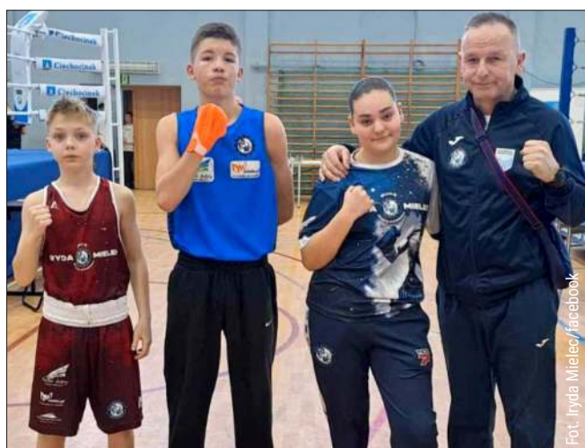
Cenne starty Irydy.

W dniach 12–15 marca reprezentanci Irydy Mielec wzięli