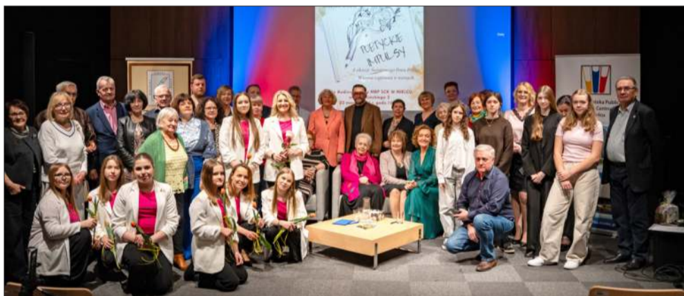
Wyjątkowe spotkanie pokoleń w bibliotece.

Wykładowca, felietonista „Gościa Niedzielnego” i pasjonat rowerowych wycieczek po Lubelszczyźnie, pokazał uczniom z Radomyśla, że humanista to człowiek wszechstronny i ciekawy świata. Warsztaty były dowodem na to, że o trudnych tekstach można rozmawiać w sposób dynamiczny, nowoczesny i przede wszystkim wartościowy dla młodego pokolenia. MW