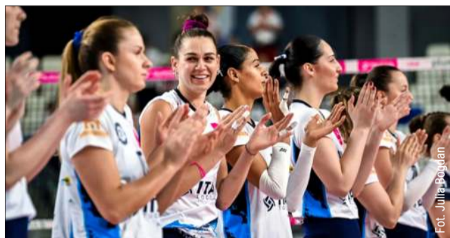
Siatkarki ITA TOOLS Stali Mielec rozpoczynają fazę play-off.