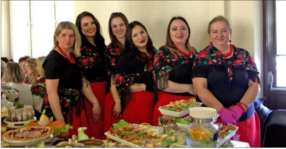
Goła Gospodyń Wiejskich jak zwykle stanęły na wysokości zadania - palce liczą!

Świąteczne jarmarki zrobiły u nas spektakularną karierę.