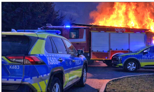
Pożar w powiecie mieleckim. Syn ratował ojca z płomieni, doszło do tragedii.

W chwili wybuchu pożaru w jednym z pomieszczeń przebywał starszy mężczyzna. Jego syn zdołał dotrzeć do ojca i wy dostać go z objętego ogniem