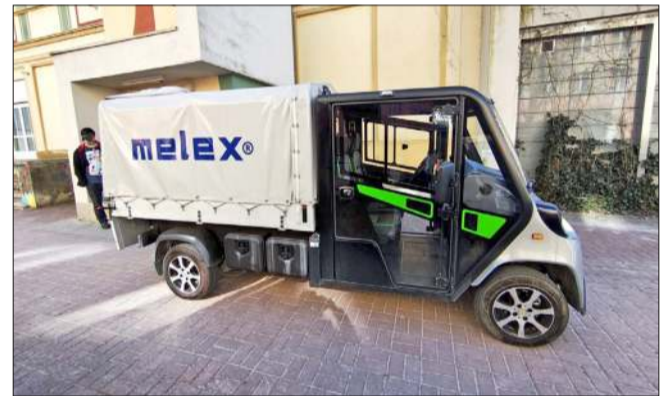
Melexy to nasz znak rozpoznawczy

Choć daleko Mielcowi do dużych metropolii i to w całym kraju możemy znaleźć produkty, które zostały wyprodukowane w naszych zakładach na strefie ekonomicznej i są znane Polakom. Poniżej kilka przykładów!