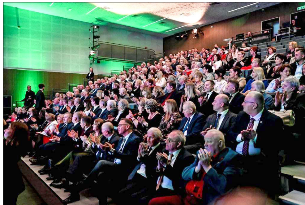
Wielkie święto LGD PROWENT w Przecławiu