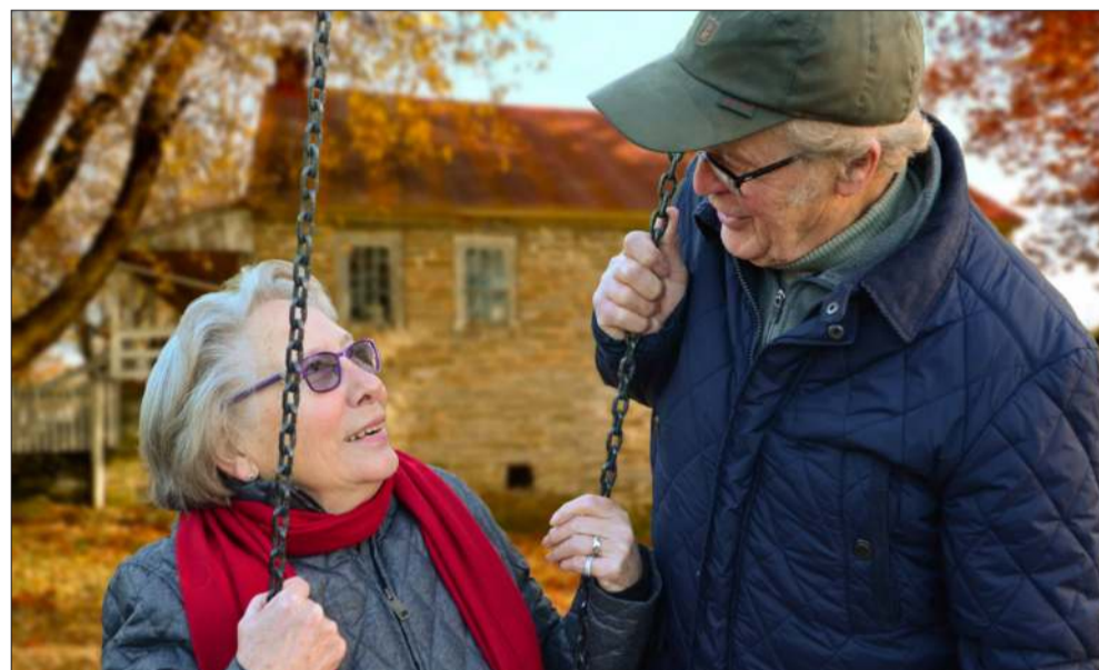
Nasze społeczeństwo gwałtownie się starzeje.