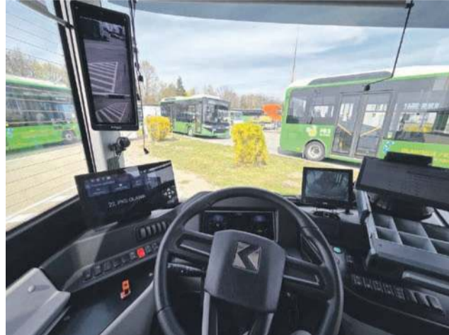
Dzięki wielu kamerom kierowcy mają podgląd nie tylko w to, co dzieje się w autobusie, ale też na przystankach

dziękował, że mogą być operatorem, który dysponuje tak dużą flotą autobusów elektrycznych i wyraził nadzieję, że to nie koniec, a początek rozwoju firmy i unowocześnienia jej taboru.