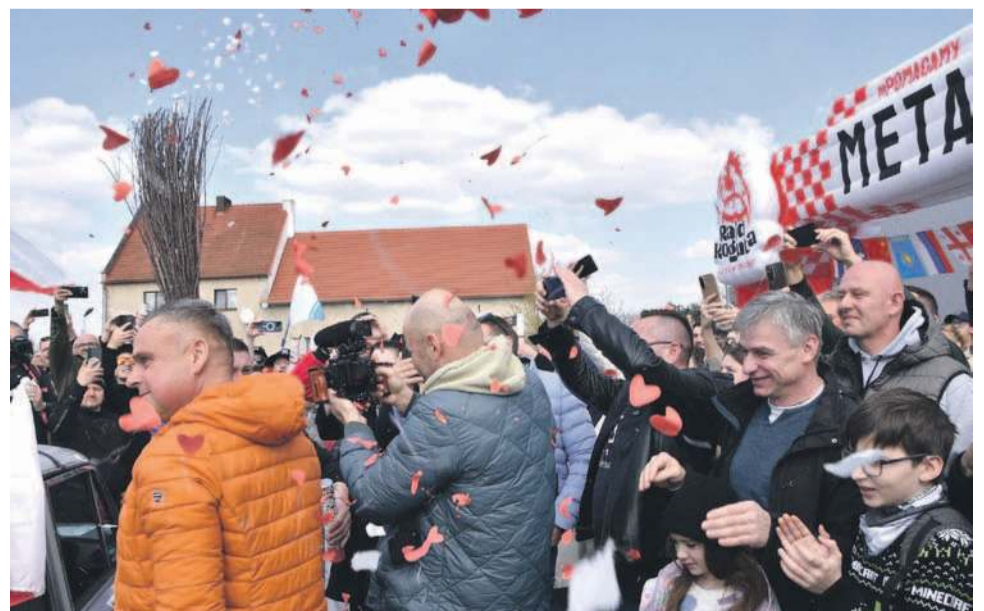
Ależ to były emocje!