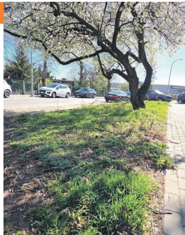
Ten skwerek też już jest dokładnie posprzątany, gałęzie usunięte, liście zgrabione