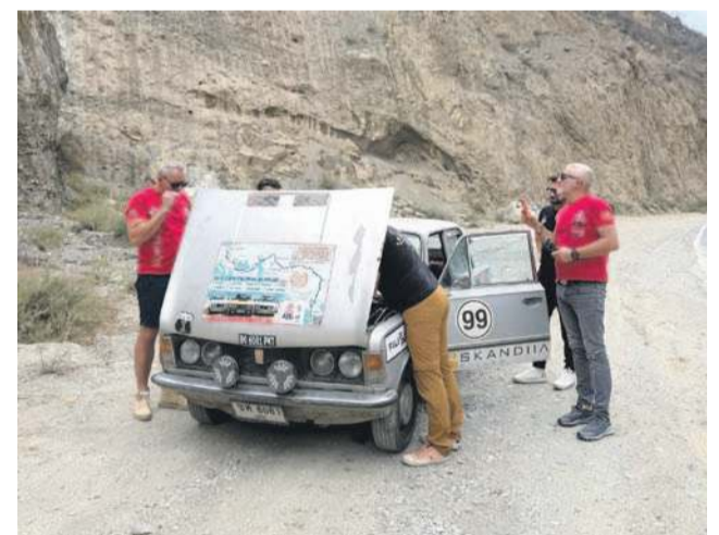
Nie zawsze było łatwo