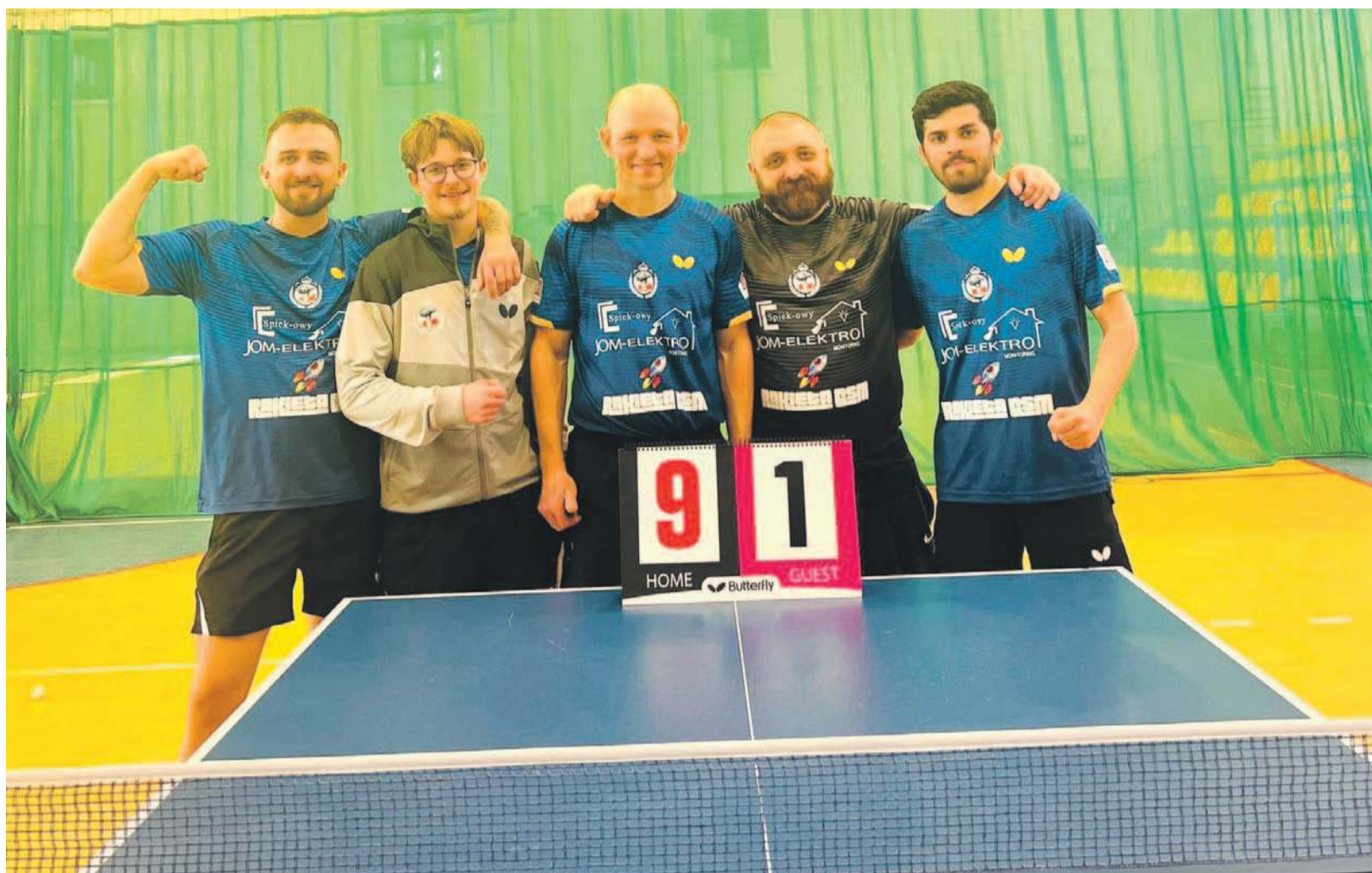
Drużyna „Jom-Elektro” Lizawice po efektownym zwycięstwie z KTS Wolbromek

Do rozegrania pozostały już tylko dwa mecze: 25 kwietnia KU AZS UE Wrocław zagra z KTS Wolbromek, a 9 maja „Jom-Elektro Orzeł” Lizawice zmierzy się z KU AZS UE Wrocław.