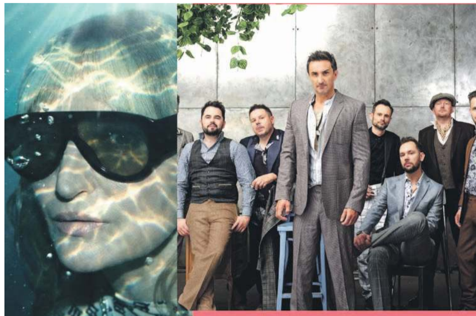
Najprawdopodobniej 5 września do Bystrzycy z koncertami przyjadą zespół Zakopower i Reni Jusis

- Przed nami sporo pracy, spotkań i ustaleń, ale energia do działania jest ogromna! -