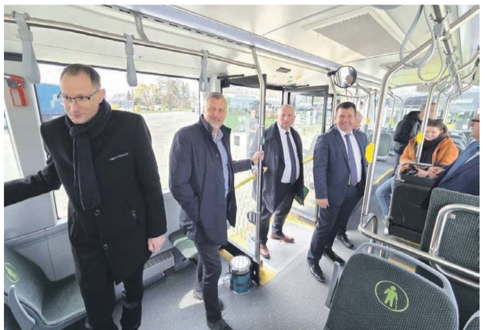
Uczestnicy piątkowego wydarzenia mieli okazję przejechać się elektrykiem i wyrazić swoje spostrzeżenia