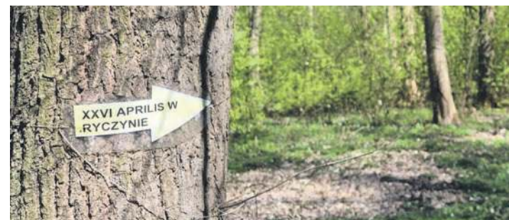
Są stare strzałki, ale wciąż aktualne. Nowe też będą