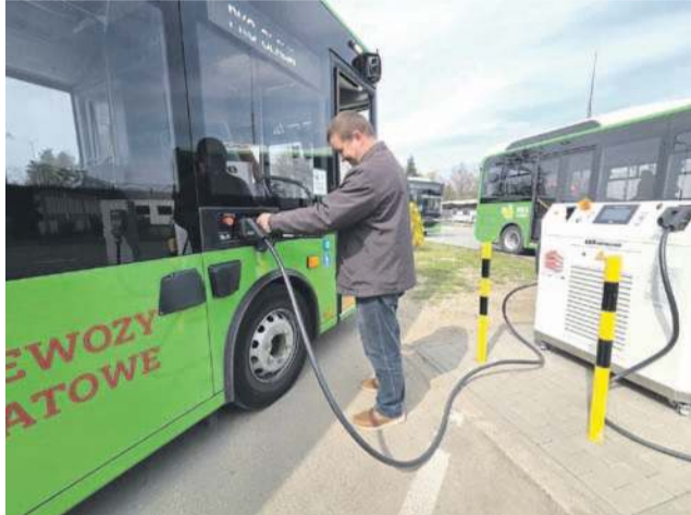
Nowe ekologiczne autobusy na jednym ładowaniu jeżdżą przez cały dzień pracy.