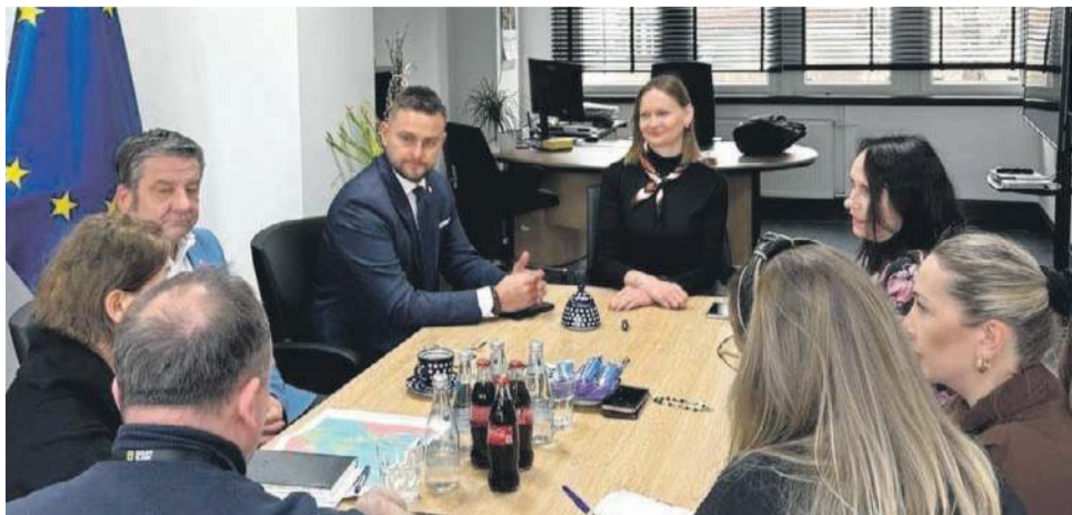
Rozpoczęto oficjalne przygotowania do tegorocznych dożynek wojewódzkich, które odbędą się w Bystrzycy