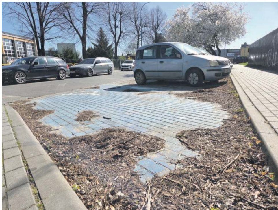
Jeszcze kilka dni temu tak wyglądał parking przy ul. Kamiennej