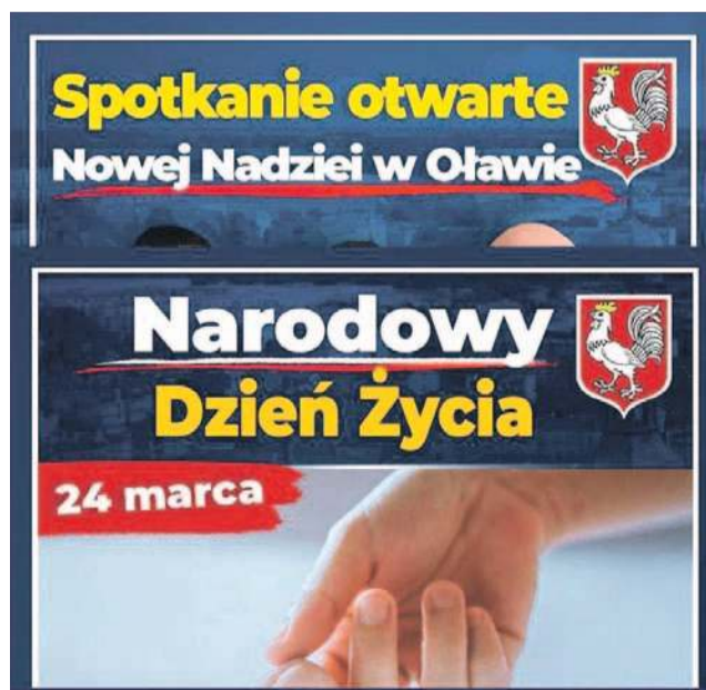
Przykłady wykorzystania herbu do celów politycznych