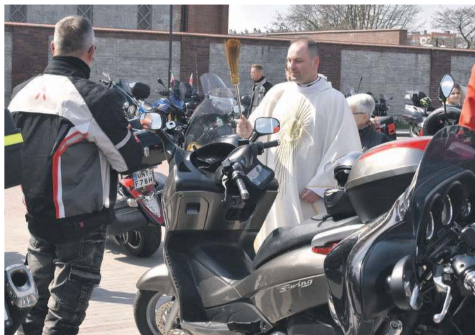
Święcenie motorów na rozpoczęcie sezonu to modlitwa o bezpieczne powroty do domu