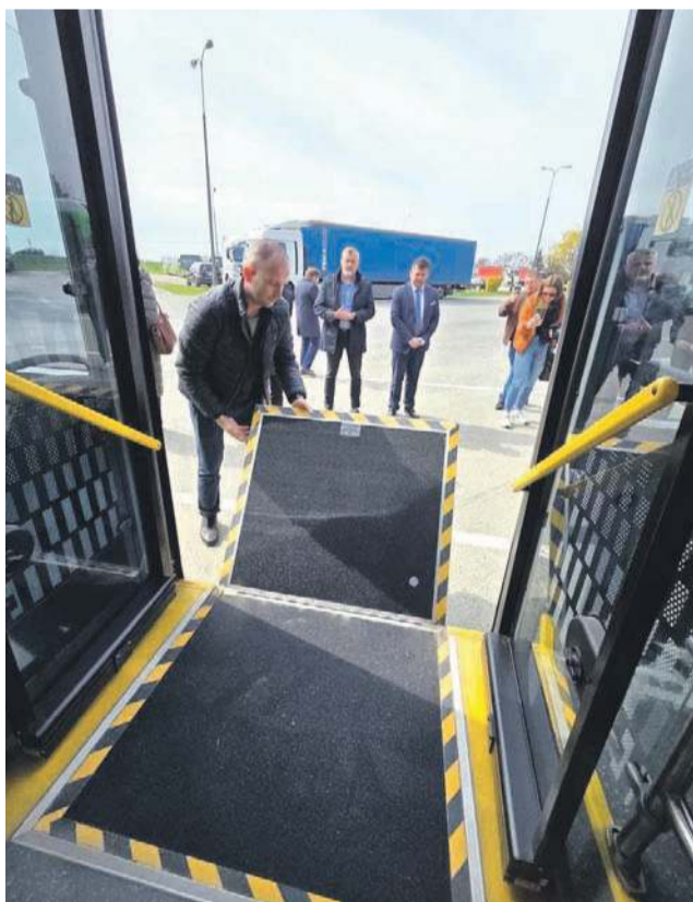
Każdy autobus elektryczny jest niskopodłogowy, ma automatyczną możliwość obniżenia wysokości autobusu, a dodatkowo rozkładaną platformę dla wózków

gdy rozpoczynają kurs, do godz. 23.00, gdy kończą pracę. Wszystkie są niskopodłogowe, z tzw. przykłękami, czyli możliwością obniżenia podłogi od strony drzwi. Dzięki temu osoba na wózku inwalidzkim, mama z wózkiem dziecięcym czy osoby starsze, bez problemu mogą do niego wsiąść czy wysiąść, bez konieczności rozkładania platformy, chociaż taka opcja też istnieje. W autobusach są ładowarki USB do ładowania telefonu czy laptopa, a także ekrany z informacjami o kierunku jazdy. Niestety, obecnie nie pokazują się na nich nazwy przystanków, i - jak zauważyli samorządowcy podczas jazdy próbnej - należy to zmienić. Pojawiły się też głosy, by wprowadzić informacje głosowe o danym przystanku, bo obecnie tego brakuje. Są natomiast nowe kasy fiskalne, więc bilet można kupić w autobusie płacąc zarówno gotówką jak i kartą płatniczą. Nie ma już też problemu z ładowaniem wszystkich autobusów jednocześnie, bo ładowarki zostały w końcu podłączone do sieci energetycznej i można z nich korzystać. Przypomnijmy, że jeszcze w marcu był z tym problem - wciąż czekano na ostateczną decyzję firmy Tauron, tymczasem wszystkie autobusy były w Oławie już pod koniec stycznia 2026, choć wykonawca miał czas do końca marca.