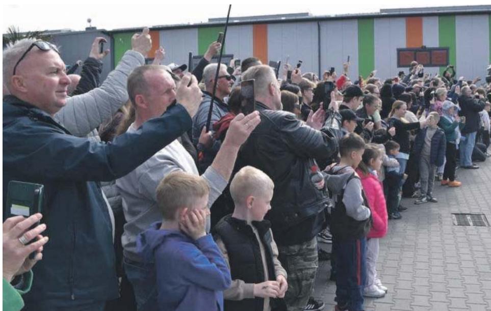
Czekał na nich tłum ludzi