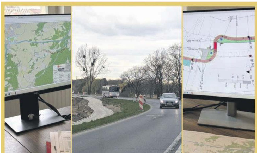
Już wiadomo, po której stronie drogi pobiegnie, co wcale nie jest takie oczywiste