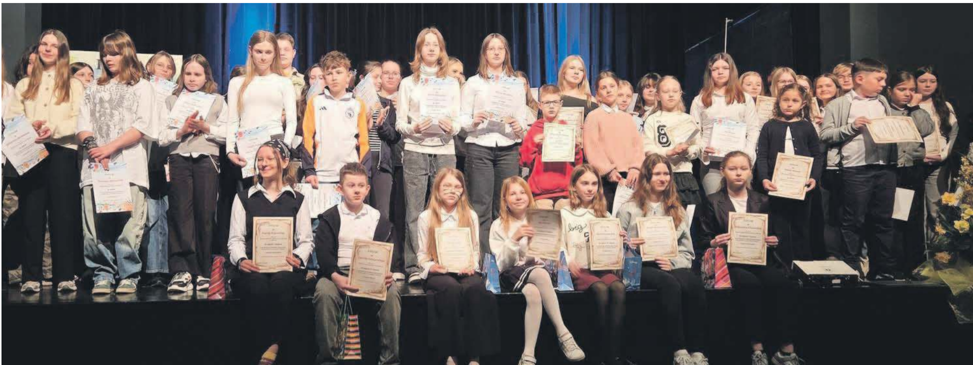
W tegorocznym konkursie plastycznym wzięło udział 84 uczniów