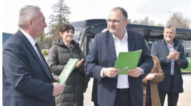
Związek międzygminny Oławskie Przewozy Gminno Powiatowe oficjalnie przekazał autobusy elektryczne PKS Oława