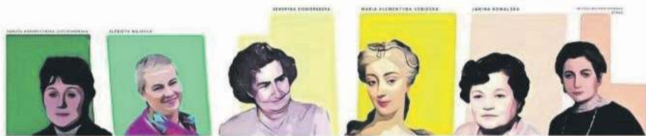
Niebawem ma powstać mural z podobiznami wyjątkowych Oławianek