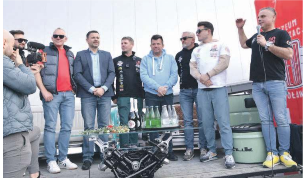
Uczestnicy wyprawy z burmistrzem Oławy i prezydentem Zamościa

- To było na granicy, opuszczaliśmy Gruzję. Turecki strażnik był podejrzliwy, bo nasze auta były na tajskich papierach. Mówię mu - panie, ja z Polski, polski mam paszport, z Oławy jestem. A on mówi, że nie, że pan zavraca