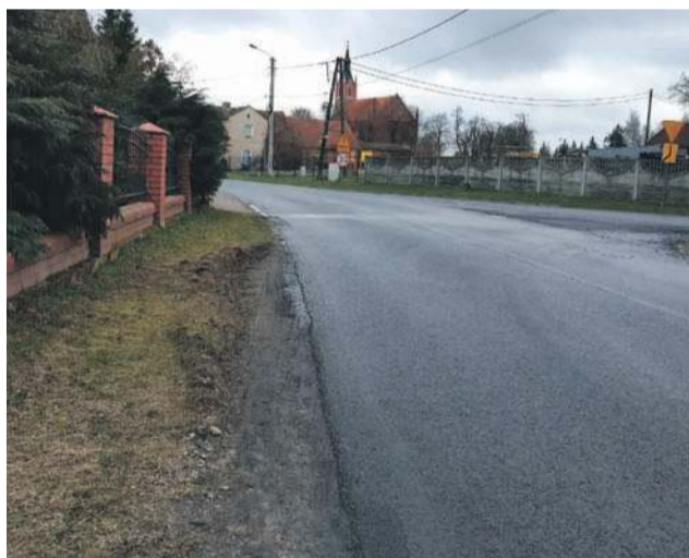
Ulica Kościuszki w Minkowicach Oławskich

razie jedyny efekt, który przyniosły moje interwencje i apele mieszkańców. Ludzie także wysyłali pisma do PZD, ale otrzymywali odpowiedź, że póki co żadne działania nie zostaną podjęte. Potrzeb w całym powiecie jest dużo, ograniczeniem są również kwestie finansowe. Wierzę jednak, że gdyby chodziło wyłącznie o pieniądze, to gmina Jelcz-Laskowice byłaby gotowa, aby współdziałać z powiatem, partycypując w kosztach. Warunkiem jest