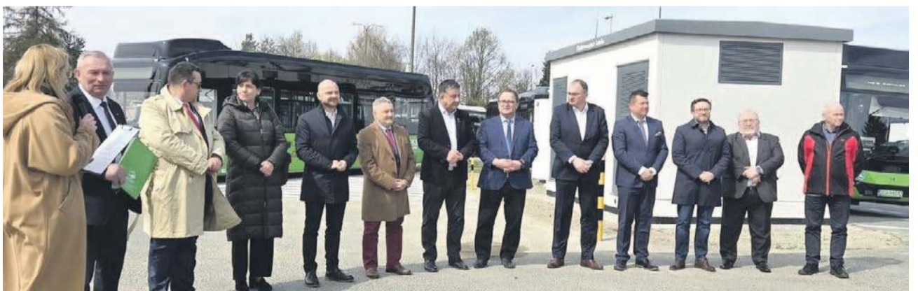
W obecności przedstawicieli samorządów, które włączyły się do programu zakupu autobusów elektrycznych, nowe pojazdy przekazano przewoźnikowi - PKS Oława