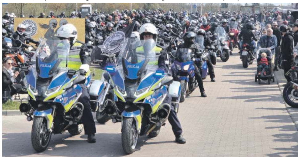
Motocyklową paradę ulicami miasta poprowadzili policjanci z oławskiej drogówki