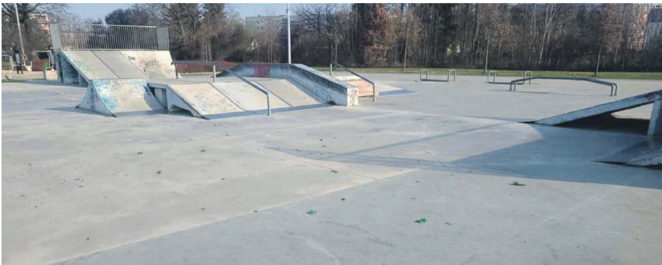
O porozbijanym szkłe pisała też jedna z mieszkank w mediach społecznościowych. Do swojego wpisu zamieściła takie zdjęcie