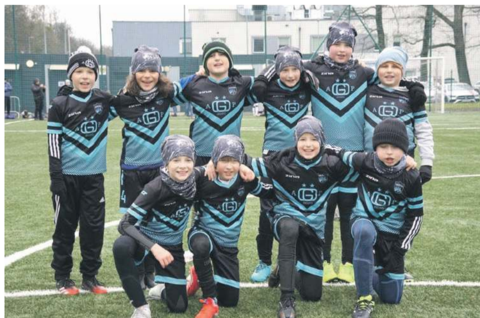
Drużyna AP „Galacticos” Oława z rocznika 2016, która wywalczyła drugie miejsce we Wrocławiu