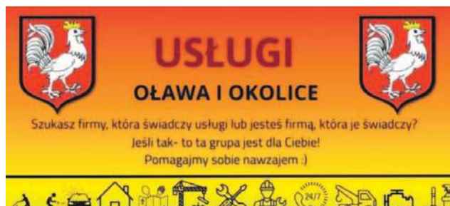
Oławski herb bez stosownej zgody bywa wykorzystywany w wielu miejscach internetu