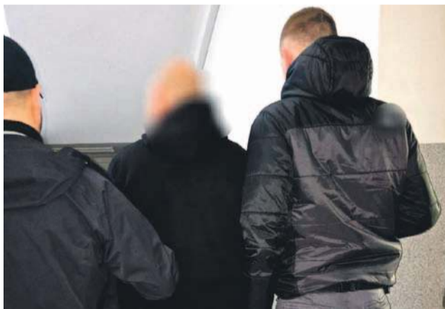
Mężczyzna został zatrzymany w niedzielę 5 kwietnia

Sprawą zajęli się funkcjonariusze oławskiego Wydziału Kryminalnego. Dzięki pracy operacyjnej szybko ustalili miejsce pobytu podejrzanego, który po dokonanych przestępstwach ukrywał się przed Policją. Mężczyzna został zatrzymany w niedzielę 5 kwietnia. Po wykonaniu czynności procesowych 44-latek