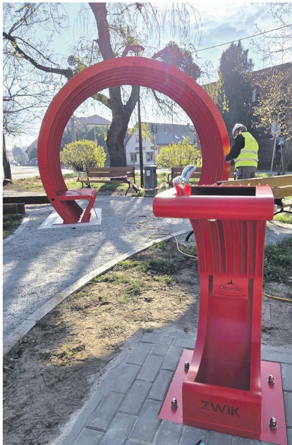
Poidelko i kurtyna wodna już stoją na Skwerze Praw Kobiet

Dyrekcja, Pracownicy i cała Społeczność Liceum Ogólnokształcącego Nr I im. Jana III Sobieskiego