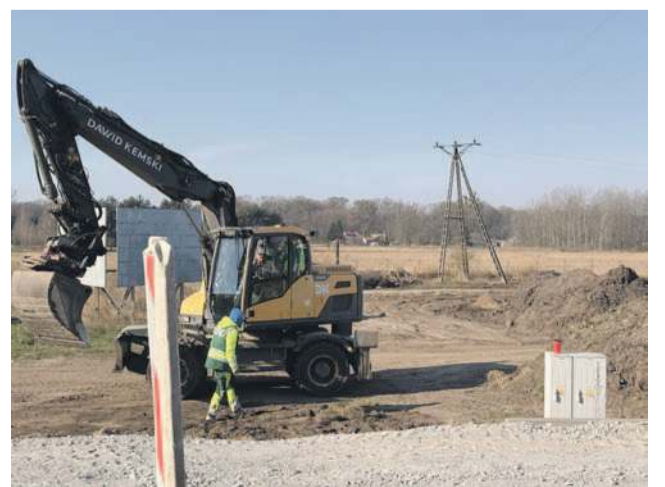
Budowa ścieżki rowerowej trwa