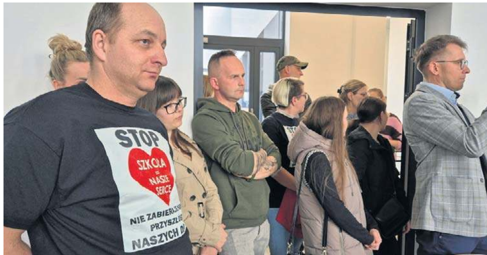
Obecność rodziców podczas sesji samorządu nie miała wpływu na decyzję radnych. Podobnych sytuacji można spodziewać się niebawem w innych samorządach.

Po przegłosowaniu niepopularnych, restrukturyzacyjnych uchwał, kolejnym formalnym krokiem samorządu będzie odwołanie dotychczasowych dyrektorów przedszkola i szkoły w Żyrowej oraz szkoły podstawowej w Januszkowicach. W ich miejsce rozpisane zostaną zupełnie nowe konkursy na stanowiska dyrektorskie w zmienionych już strukturach.