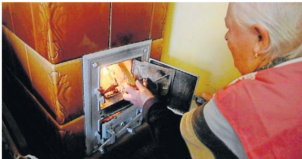
Klienci firmy PV Technik mieli mieć wymienione stare piece, wykonane termomodernizację domów. A mają jedynie wielki problem finansowy/zdjęcie ilustracyjne