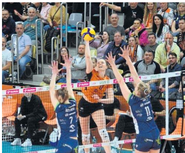
Tym razem w ataku drużyna z Opola zaprezentowała się gorzej od zawodniczek BKS BOSTIK ZGO Bielsko-Biała