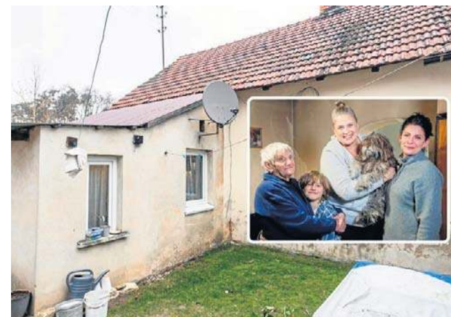
Premiera nowego odcinka cyklu „Nasz nowy dom” w czwartek (23 kwietnia) o godz. 21.30 w Polsacie.

Kobieta postanowiła ratować siebie oraz dziecko i, jak