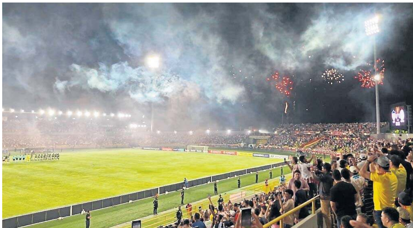
Atmosfera na meczach Copa Libertadores jest niepowtarzalna, inna niż podczas spotkań piłkarskich w Europie