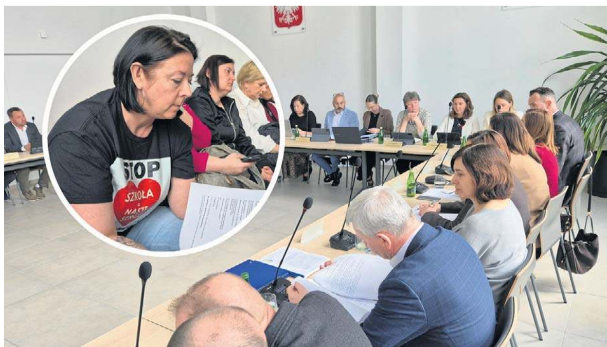
Protesty rodziców na nic się zdały, radni przyjęli projekt zmian w organizacji oświaty w gminie.

Wielkie pieniądze dla kluczborskiej kultury. To będzie modernizacja, która zmieni wszystko str. 4