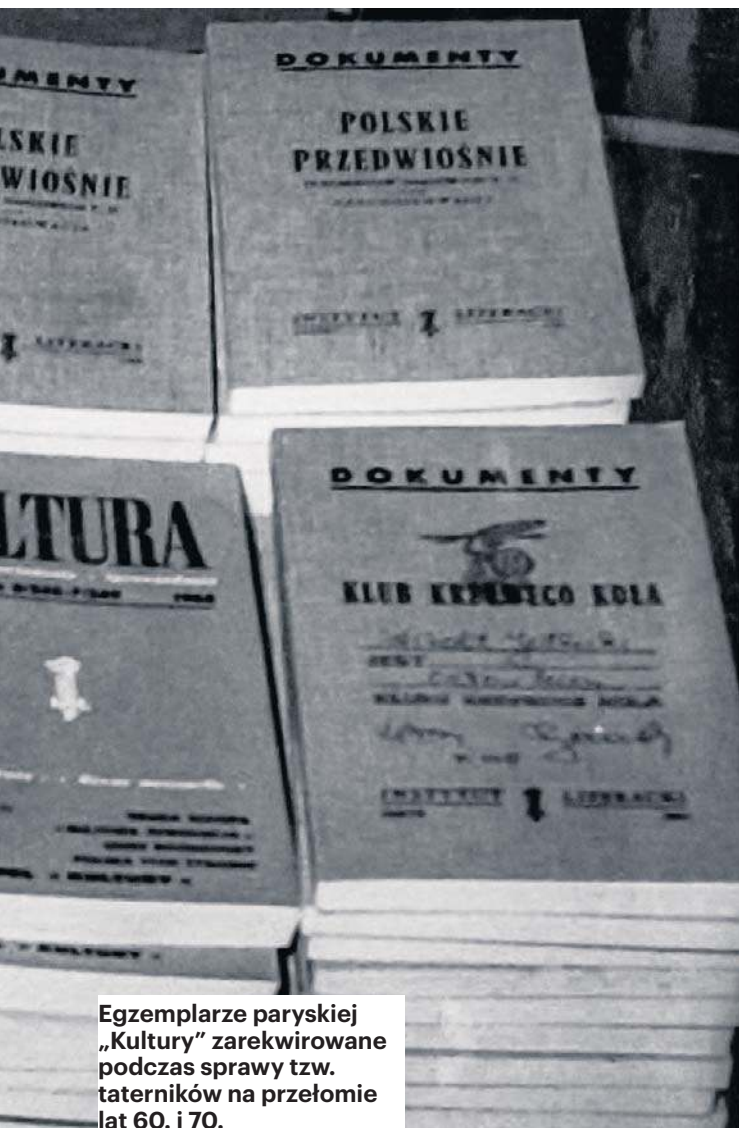
Exemplarze paryskiej „Kultury” zarekwirowane podczas sprawy tzw. taterników na przełomie lat 60. i 70.

do lat 80. wielokrotnie współprowadził wymierzone w Michnika i byłych „komandosów” sprawy, bywał też „konsultantem” innych esbeków od opozycji demokratycznej w PRL.