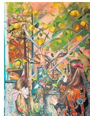
Jedna z prac z Salonu Wiosennego 2025.

- Do tegorocznej edycji napłynęło 121 zgłoszeń. Jury wybrało 67 propozycji, które zostaną zaprezentowane na wystawie. Wybrane prace tworzą przekrój tematów, wrażliwości i języków artystycznych obecnych dziś w lokalnym środowisku. Salon ma charakter otwarty i przeglądowy, pozwala wybrzmieć różnorodności i indywidualnym narracjom, budując obraz współcze-