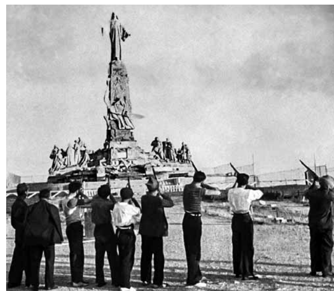
Komuniści strzelają do figury Chrystusa - jedno ze zdjęć nadesłanych przez Pruszyńskiego z Hiszpanii