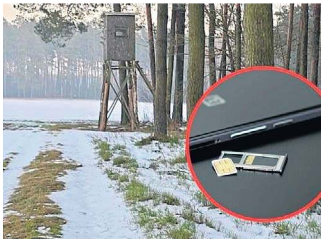
Nieodpowiedzialne zachowanie sprawcy mogło utrudnić służbom przyjscie z pomocą komuś potrzebującemu.

- Jak się okazało, mężczyzna połączenia wykonywał z dwóch telefonów komórkowych, bez użycia karty sim, wykorzystując opcje połączenia „tylko alarmowe”. Urządzenia te zostały zabezpieczone jako materiał dowodowy w sprawie - mówi asp. Marek Kotara.