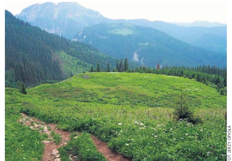
Żleb pod Wyranki