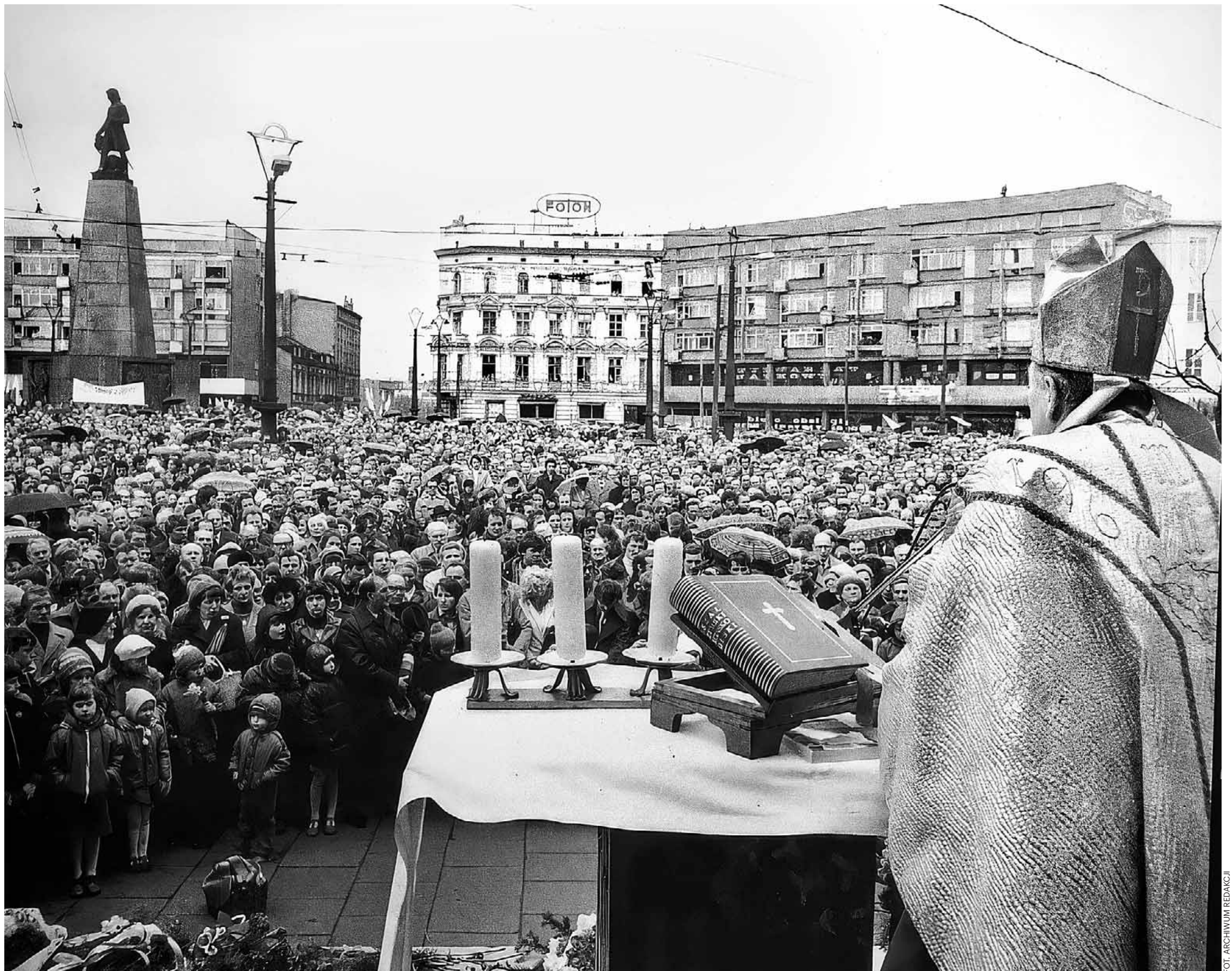
Msza odprawiana na placu Wolności w Łodzi, w którym tłumnie brali udział strajkujący

Po strajku na spokój z pewnością nie mogli liczyć organizatorzy akcji protestacyjnej. Bezpieka zidentyfikowała te osoby i poddała je kontroli operacyjnej. Robotnicy ci musieli się też liczyć z tym, że przy najmniejszej niesubordynacji w przyszłości zostaną zwolnieni z pracy.