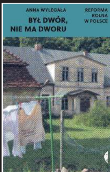
Anna Wylegała, „Był dwór, nie ma dworu. Reforma rolna w Polsce”, Czarne, Wołowiec 2022