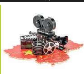
Jak KPCh pokonała Hollywood / 78