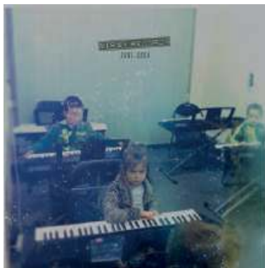
Różni wykonawcy, Sissy Records 2001–2004, Sony Music