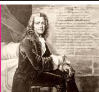
Wolter. Świecki papież oświecenia / 64