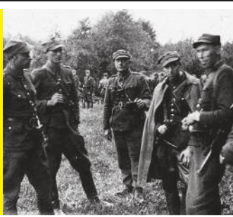
„Przepraszam, co głowa nadużył” / 36