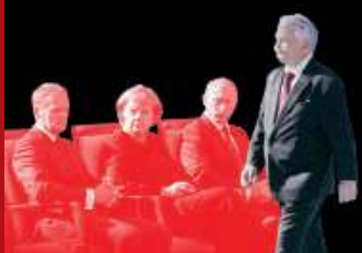
Oby Zachód posłuchał ostrzeżenia Lecha Kaczyńskiego / 4