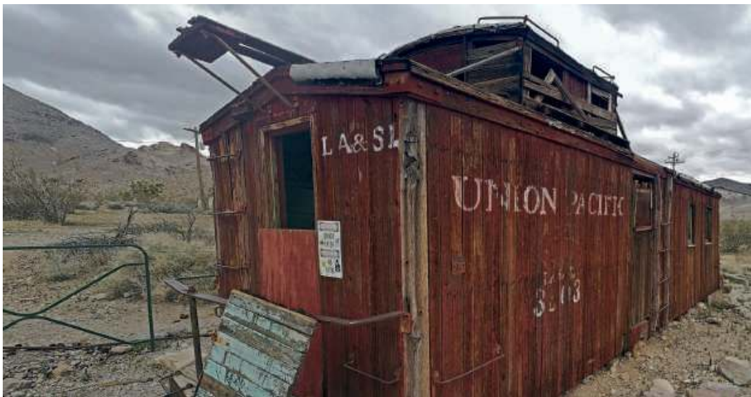
Kolejny świadek uporczywej i cierplivej walki człowieka z naturą