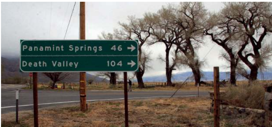
Charakterystyczne skrzyżowanie dróg międzystanowych w małej wiosce Olancho. Skręcając na wschód, dojedziemy do Doliny Śmierci. Jadąc prosto na północ – do północnych rubieży Owens Valley

– Dziękuję pani... – rzucam na koniec, szykując się do wyjścia.