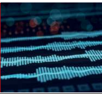
Pegasus, roszczenia i Polska 26