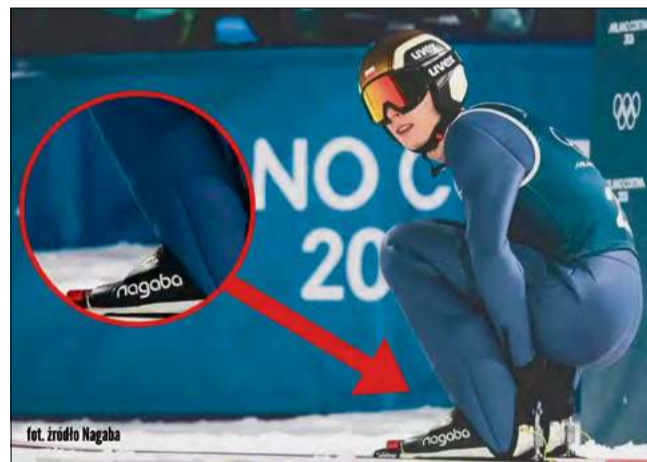
Medal został wyskakany m.in. w opolskich butach.

A dokładnie do pobliskich Krapkowic. To właśnie tu, w rodzinnej firmie Nagaba przy ulicy Kilińskiego, od 2019 roku powstaje specjalistyczne obuwie dla polskiej kadry. Ręcznie szyte, skórzane, dopasowywane do każdego zawodnika indywidualnie. W świecie, w którym o wygranej decydują centymetry i ułamki