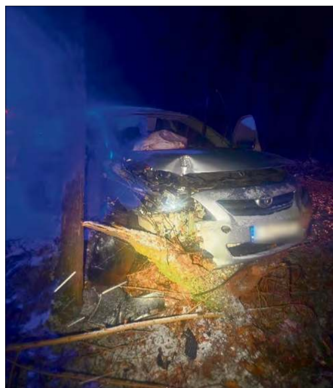
Dzięki rozwadze kierujących można ograniczyć liczbę niebezpiecznych zdarzeń na drogach regionu.

Opolscy funkcjonariusze apelują do kierowców o zachowanie szczególnej ostrożności. Zimowa aura, opady