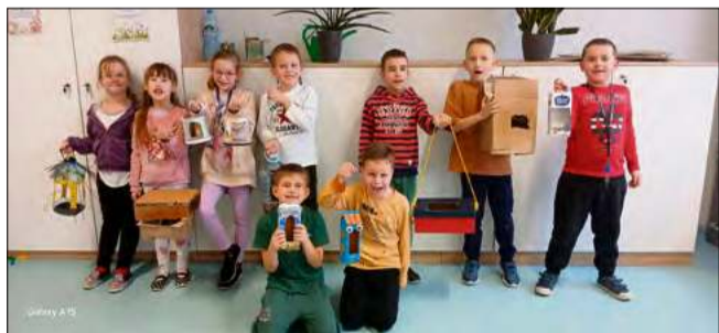
To były cenne warsztaty dla najmłodszych.

Z wielkim zapałem i zaangażowaniem pierwszoklasiści przystąpili do pracy, by własnoręcznie stworzyć kar-