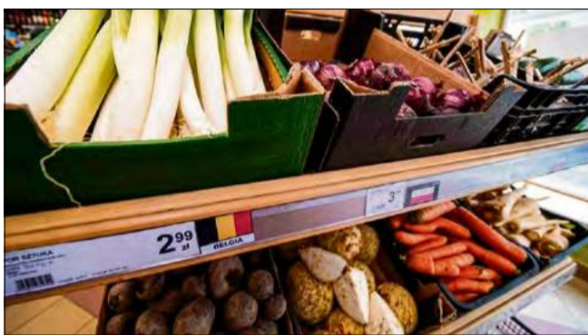
Państwowe flagi w warzywniakach mają podkreślać pochodzenie owoców i warzyw.

Wydając takie rozporządzenie Ministerstwu Rolnictwa chodzi bardziej o czytelną informację dla klientów, którzy mają prawo do informacji jaki produkt kupują. Do tej pory sklepy ograniczały się do informacji słownej, zresztą nie do końca precyzyjnej, bo często informacja miała charakter alternatywny.