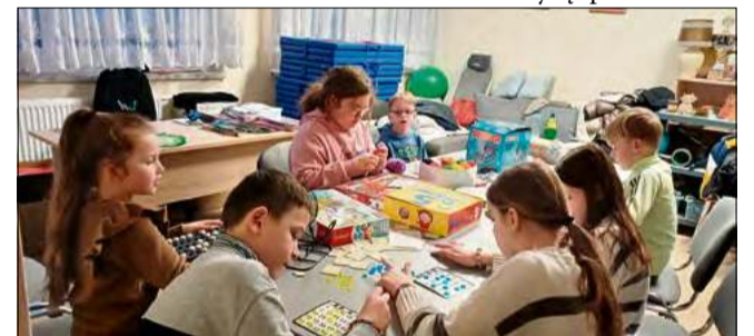
...oraz bibliotecznych zajęciach.

zajęcia literacko-plastyczne pod hasłem „Kocie opowieści”. Uczestnicy wysłuchali opowiadań, rozwiązywali zagadki oraz tworzyli prace plastyczne inspirowane tematyką spotkania. Nie