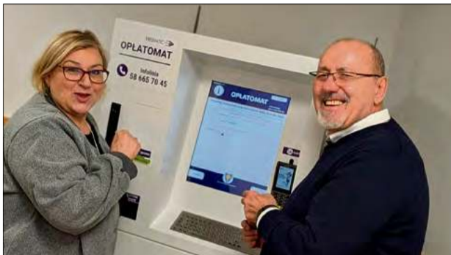
Nowy oplatomat umożliwi szybkie i wygodne regulowanie opłat – gotówką lub kartą.

Bo to nie koniec udogodnień. Jeszcze w tym roku, po aktualizacji oprogramowania, na rachunkach pojawią się kody kreskowe, które będzie można zeskanować przy wpłacie. System sam uzupełni dane,