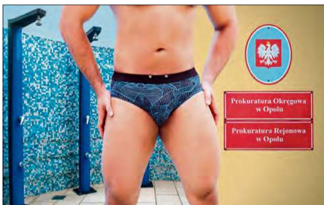
49-latek w basenowej łazni oddawał się czynnościom autoerotycznym w obecności małoletniego.

5 lutego podejrzany został zatrzymany przez funkcjonariuszy. Prokurator przedstawił mu zarzut popełnienia przestępstwa z art. 202 § 1 Kodeksu karnego,