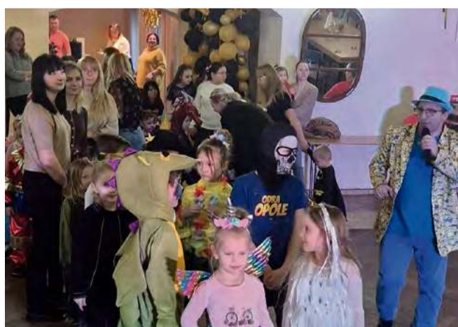
Fundacja BONUS zorganizowała kolorowy bal karnawałowy dla dzieci w Przysieczu.

mie Hanka”. Rok 2025 obejmował również realizację projektów w ramach programów „Odnowa Wsi” oraz „Opolskie ze Smakiem”.