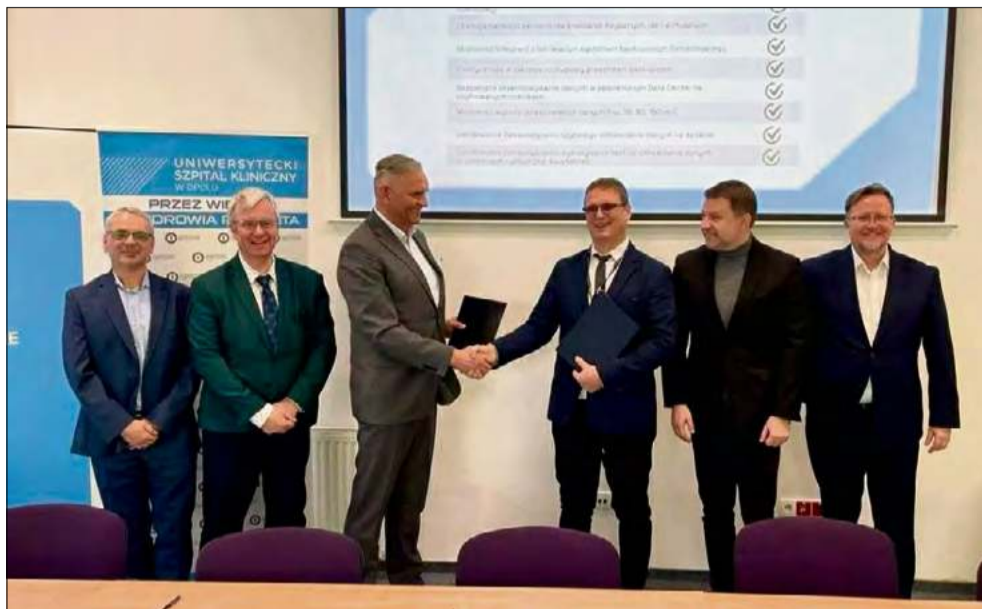
Ilość cyfrowych danych gromadzonych przez szpital lawinowo wzrasta z roku na rok.

Umowa obejmuje zabezpieczenie danych administracyjnych i systemów medycznych, od których zależy sprawne funkcjonowanie szpitala i bezpieczeństwo pacjentów. Zabezpieczenie danych będzie obejmowało m.in. wyniki badań laborato-