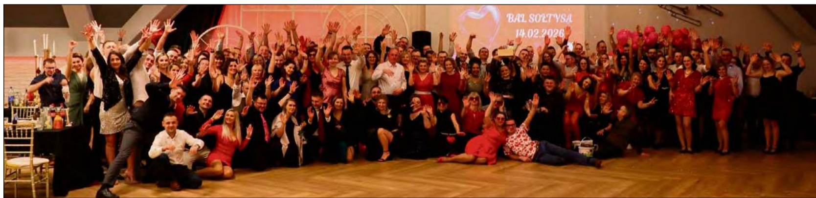
Charytatywny Bal Sołtysów obfitował w takie atrakcje jak licytacje, gry i zabawy.

Fundacja „BONUS” podsumowała swoją działalność w 2025 roku. W ciągu dwunastu miesięcy organizacja zrealizowała szereg przedsięwzięć, które cieszyły się dużym zainteresowaniem. Do najważniejszych z nich należały m.in. „Spotkanie z historią”, przybliżające lokalne dzieje oraz spektakl „Mianujom