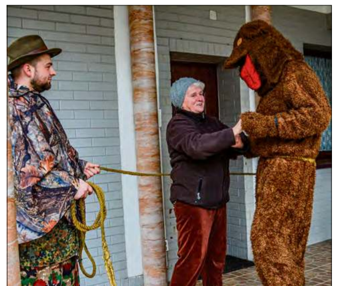
Tradycyjny taniec niedźwiedzia z gospodynią.