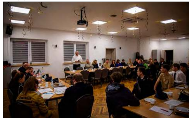
Kluczowym punktem spotkania były zmiany w strukturach zarządczych.

ny rok. Szczególne słowa uznania kierujemy do ustępującego zarządu za ich zaangażowanie, służbę i nieocenioną pracę na rzecz jednostki - dziękując druhowie z OSP Dębska Kuźnia.