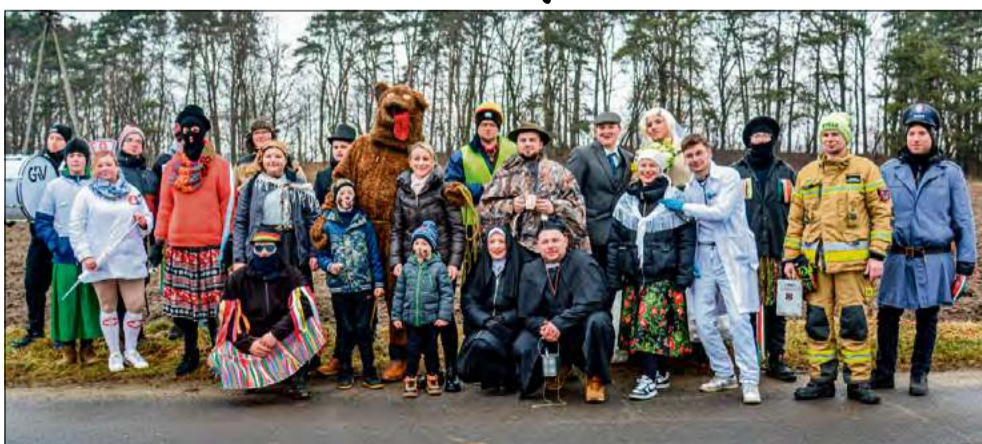
W Naroku wodzenie niedźwiedzia zorganizowali tutejsi strażacy - ochotnicy.

- W naszym korowodzie zawsze obecny jest także ko-