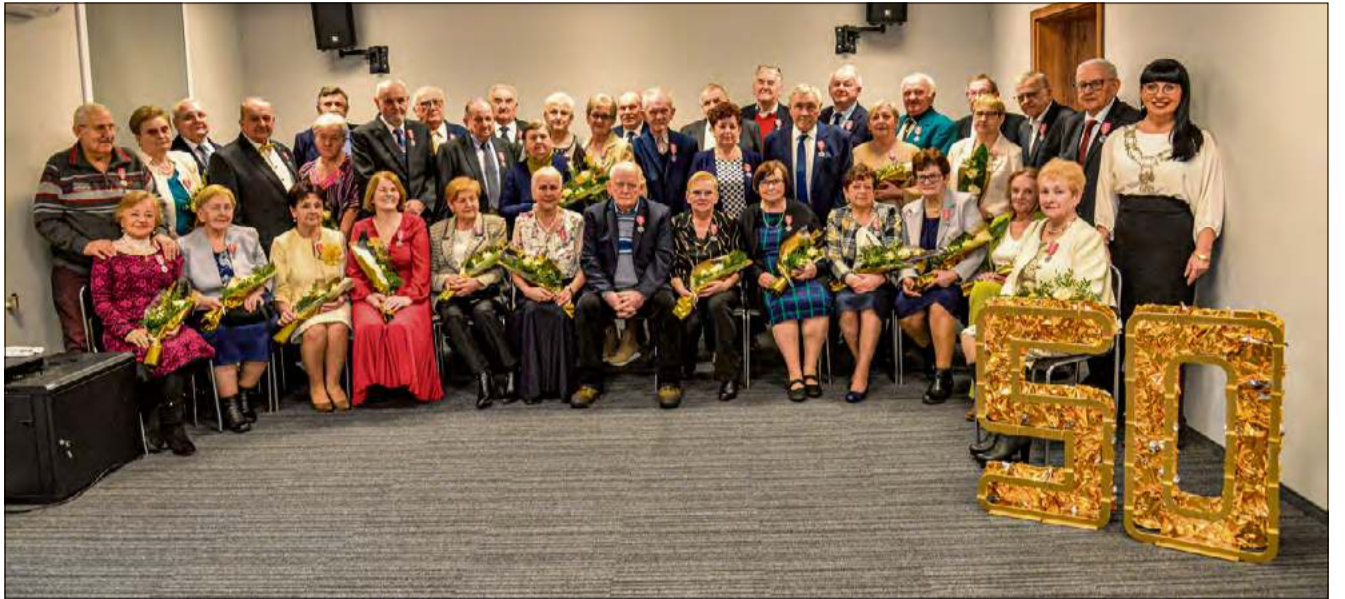
Jubilaci podkreślali, że o udane małżeństwo trzeba się postarać.