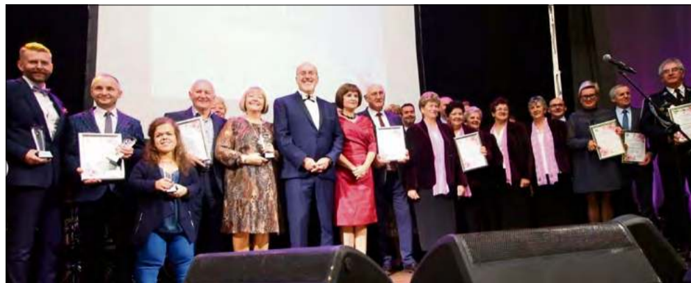
Symboliczne statuetki ponownie trafią do osób i instytucji zasłużonych dla regionu – zgłoszenia przyjmowane są do 20 kwietnia.

Po przerwie wraca jedno z najbardziej rozpoznawalnych wyróżnień w regionie. „Magnolie Powiatu Opolskiego” ponownie zagospzczą w kalendarzu najważniejszych wydarzeń samorządowych. Tym razem w odświeżonej formule i z nowymi kategoriami, które mają jeszcze lepiej oddać potencjał lokalnej społeczności.