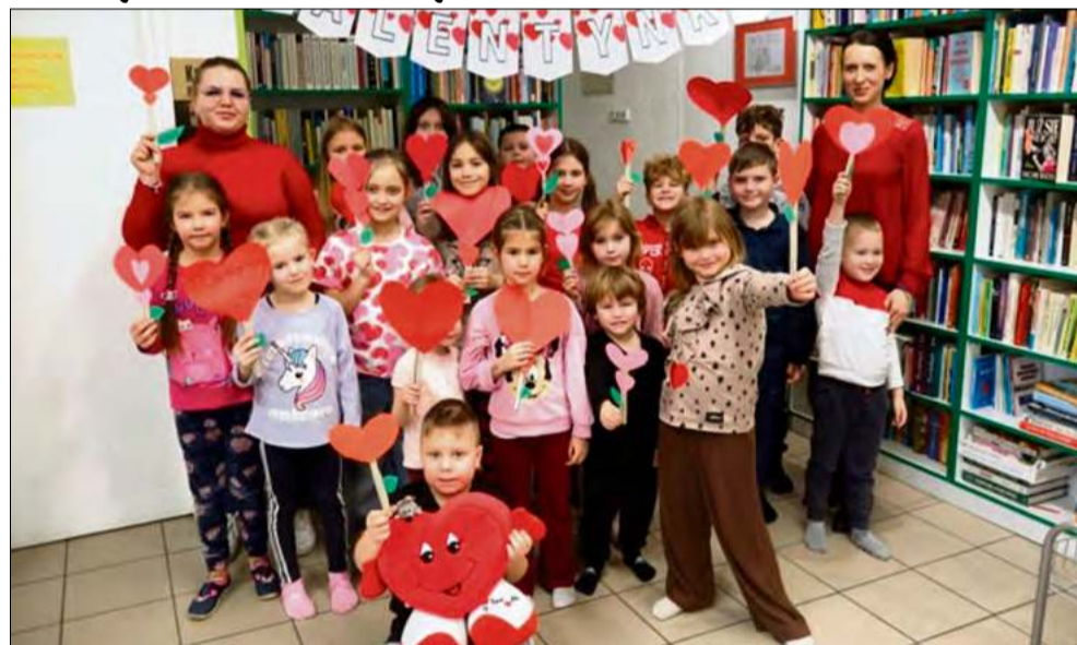
Ferie zimowe w Gminnej Bibliotece Publicznej w Tarnowie Opolskim zakończyły się w walentynkowym nastroju.

Gminna Biblioteka Publiczna w Tarnowie Opolskim podsumowuje drugi tydzień ferii zimowych. Dla najmłodszych czytelników przygotowano program, w którym znalazły się zarówno warsztaty plastyczne, jak i proste eksperymenty naukowe. Zajęcia cieszyły się dużym zainteresowaniem, a ich zwieńczeniem było walentynkowe spotkanie.