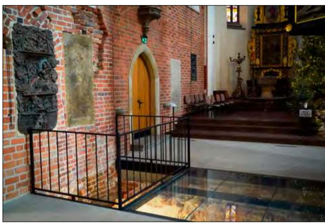
Pod przeszkloną powierzchnią widać fragmenty murów romańskiej kolegiaty.

– Zdziwienie było ogromne, kiedy okazało się, że mamy do czynienia z monumentalną