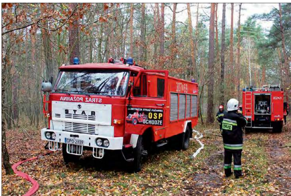
Na profilu społecznościowym jednostki pojawiła się informacja o sprzedaży starego, czterdziestoletniego samochodu.

Przypomnijmy, obecnie jednostka dysponuje samochodem marki STAR 244, który ma już czterdzieści lat. Jego stan techniczny i możliwości odbiegają od dzisiejszych standardów przeprowadzenia akcji ratowniczo-gaśniczych. Gdy się zepsuje - a do awarii ze względu na wiek pojazdu zaczyna dochodzić coraz częściej - pojawiał się problem ze znalezieniem części zamiennych. Strażacy szukali ich w internecie czy na złomowiskach.