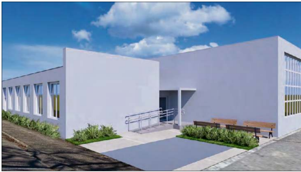
Wizualizacja budynku Dziennego Domu Pobytu dla seniorów, który powstanie w Ozimku w latach 2026-2027.

Dla gminy Ozimek kluczowym przedsięwzięciem w tym zakresie jest utworzenie Dziennego Domu Pobytu dla osób starszych. Warto pod-