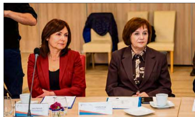
W obradach Konwentu uczestniczyli także przedstawiciele powiatu opolskiego, aktywnie włączając się w dyskusję nad Wojewódzkim Planem Transformacji.

Wojewódzki Plan Transformacji to kluczowy dokument planistyczny, oparty na Mapach Potrzeb Zdrowotnych. Jego celem jest lepsze dopasowanie działań organizacyjnych i inwestycyjnych do realnych potrzeb mieszkańców województwa. W praktyce oznacza to m.in. rozwój infrastruktury medycznej, wzmocnienie kadry medycznej oraz większy nacisk na profilaktykę.