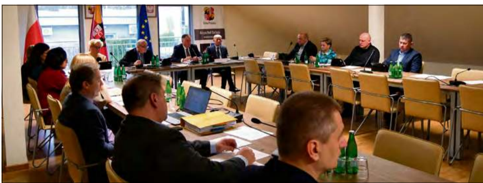
Podczas sesji dużo miejsca poświęcono inwestycjom drogowym.

Radni wyrazili zgodę na zawarcie porozumienia pomiędzy województwem opolskim a gminą Prószków, dotyczącego budowy ścieżki pieszo-rowerowej wzdłuż drogi wojewódzkiej