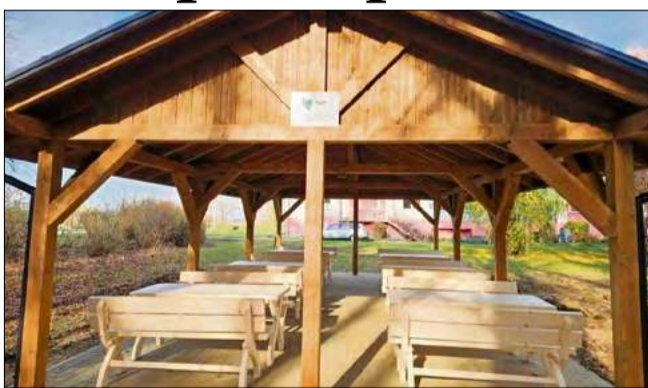
Nowo utworzona „Pracownia pod chmurką” w Zespole Szkół im. Józefa Warszawicza w Prószkowie.

Realizacja przedsięwzięcia była możliwa dzięki środkom