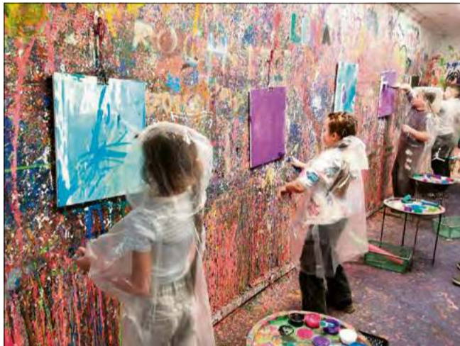
Uczestnicy zimowego wypoczynku brali udział w ciekawych warsztatach...