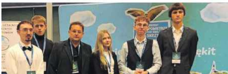
■ Młodzież ze Skalnej w trakcie szkolnych działań i projektów.

powiedzialności i funkcjonowania w międzynarodowych zespołach. W ramach edukacji szkolnej młodzież rozwijała kompetencje językowe, społeczne i kulturowe, otwierając się na różnorodność i świat. Skalna coraz wyraźniej zaznaczała swoją obecność w świecie sztuki i kultury. Wyjazdy do teatrów stały się stałym elementem szkolnej rzeczywistości – uczniowie nie tylko oglądali spektakle, ale uczyli się interpretacji, rozmowy o emocjach i wrażliwości na słowo oraz obraz. To pomagało w przygotowaniach do egzaminów maturalnych i w realizacji podstawy programowej - dodaje pani dyrektor.