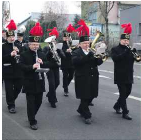
■ Obchody „Barbórki” w Pszowie

REGION Górnicze tradycje mogą przetrwać, nawet bez aktywnie działającego zakładu. Udowadniają to górnicy z Rybnika-Niewiadomia, Pszowa i Żor, gdzie kopalnie już dawno przestały funkcjonować, ale z ludzkiej świadomości tak naprawdę nigdy nie zniknęły.