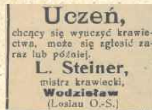
■ Ogłoszenie z Nowin Raciborskich z 1913 roku

Podobno, w dniu 22 maja, ciężarówka prowadzona przez niemieckiego żołnierza podjechała pod dom wcześniej rano. Zanim inni mieszkańcy Wodzisławia wstali, obie Żydówki były już w drodze do Rybnika. Kilka godzin spędziły, cały czas nadzorowane, czekając na pociąg. Szczęście w nieszczęściu – to był jeszcze zwykły osobowy, a nie