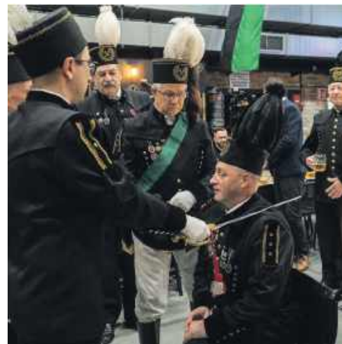
■ „Gwarki na Hoymie”.