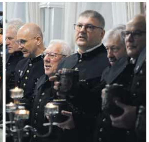
■ „Gwarki Wypędzonych” w Żorach

ta w Pszowie to jednak nie wszystko. Po niej, już nieoficjalnie, chętni spotykają się przy kołoczku, aby wspominać. W minionych latach spotkania odbywały się w sali domu kultury, jednak w 2025 roku było inaczej. Po raz pierwszy od zamknięcia kopalni „Brac górnicza kopalni Anna” - bo taką nazwę przyjęła grupa byłych pracowników, miała okazję spotkać się w rewitalizowanych wnętrzach po zakładzie. Oddana bowiem niedawno do użytku nowa biblioteka, mieści się w budynku byłej łaźni. Nowoczesna przestrzeń przywodzi na myśl dawne czasy, bo znaleźć tu można m.in. starą maszynę wyciągową i odrestaurowane suwnice. A jeszcze niedawno była to niszcząca ruina.