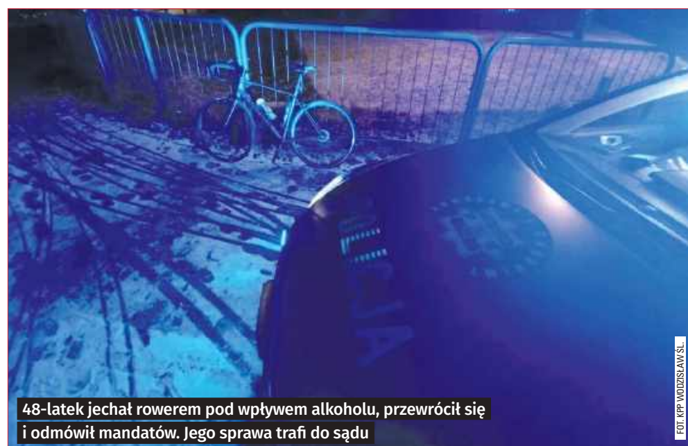
48-latek jechał rowerem pod wpływem alkoholu, przewrócił się i odmówił mandatów. Jego sprawa trafi do sądu