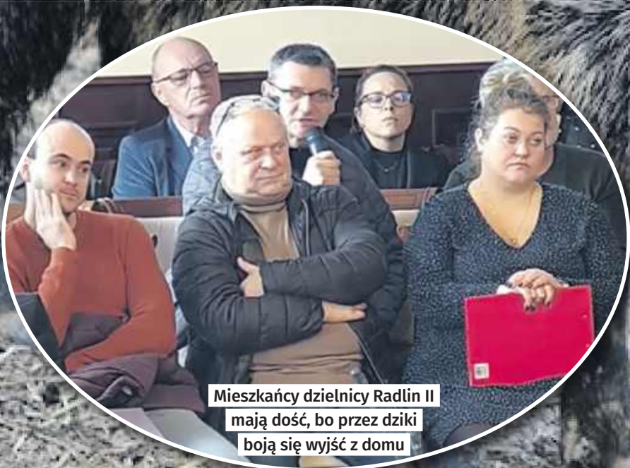
Mieszkańcy dzielnicy Radlin II mają dość, bo przez dziki boją się wyjść z domu

Problem dzików w Wodzistawiu Śląskim nie ustępuje. Zwierzęta coraz częściej pojawiają się na terenach zurbanizowanych, zostawiając ślady zniszczeń i budząc obawy o bezpieczeństwo ludzi i ich majątku. Mieszkańcy nadal czekają na konkretne rozwiązania i interwencję władz.