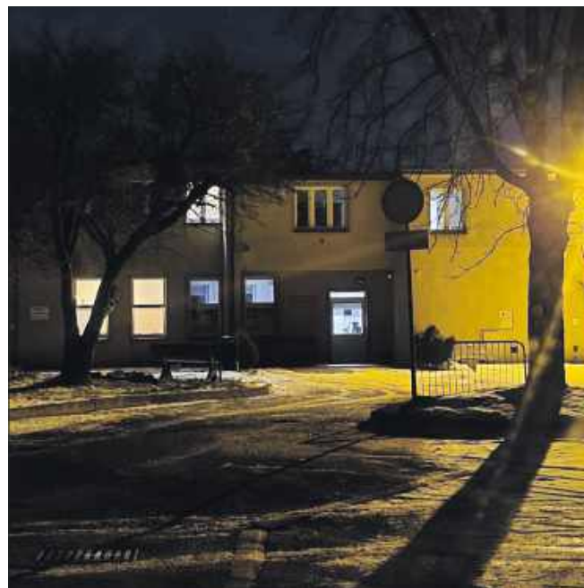
■ Ogrzewalnia znajduje się w tym samym budynku, co siedziba wodzisławskiej Straży Miejskiej.

W swojej interpelacji rozwija on wątek dokumentów, które są podobno wymagane od bezdomnych. – Jako powody wskazywane są m.in. „brak miejsc” lub brak bliżej nieokreślonego „skierowania” bądź „papieru z MOPS”. Jednocześnie analiza dokumentów regulujących funkcjonowanie ogrzewalni – Specyfikacji Warunków Zamówienia, Szczegółowego opisu przedmiotu zamówienia oraz projektowanych postanowień umowy – nie wskazuje, aby posiadanie takiego dokumentu było warunkiem skorzystania z ogrzewalni. Z informacji dostępnych publicznie wynika również, że Miejski Ośrodek Pomocy Społecznej nie wydaje dokumentów, które mogłyby pełnić rolę takiego „skierowania” – zaznacza radny, zadając urzędnikom szereg pytań, m.in. o wskazane „skierowanie”, limit miejsc czy nadzór nad ogrzewalnią.