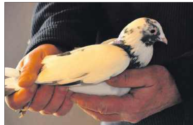
■ Jak sam mówi hodowca, młodość do gołębi wysał z mlekiem matki