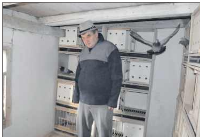
■ Hodowca w swoim gołębniku