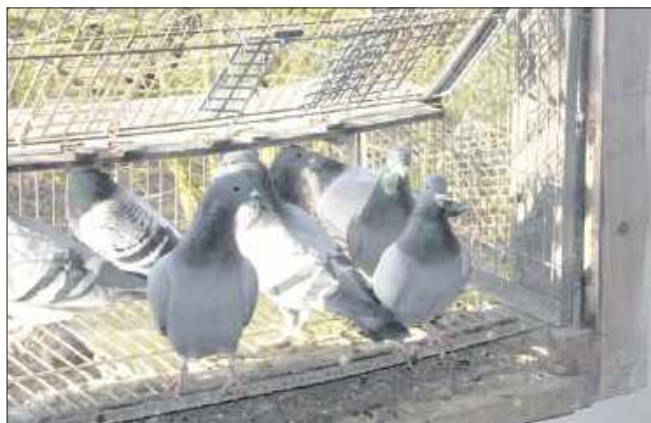
■ Obecnie gołębie są zamknięte i nie latają. Jest to związane z ich bezpieczeństwem