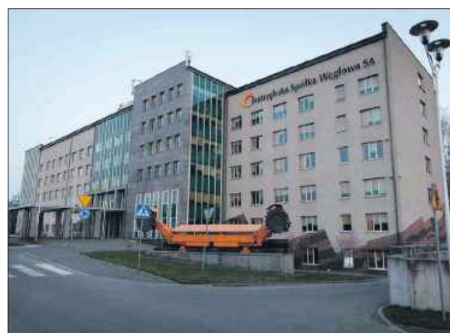
■ Oczekiwane przełomu nie było. Rozmowy w JSW zakończyły się bez wspólnego stanowiska.

JSW podkreśla także, że dalsze funkcjonowanie w sytuacji, w której koszty przewyższają przychody, nie jest możliwe. Optymalizacja kosztów pracy została wskazana jako jeden z podstawowych warunków zapewnienia dalszego dzia-