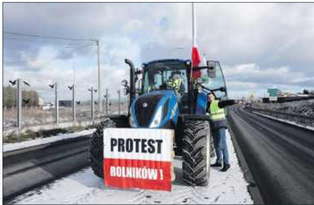
■ Ogólnopolski protest rolników. Manifestacja także przy A1 w Świerklanach.

umowa z Mercosurem oznaczałaby nierówną konkurencję dla europejskich producentów. W ich ocenie produkcja w krajach Ameryki Południowej odbywa się według znacznie mniej restrykcyjnych zasad.