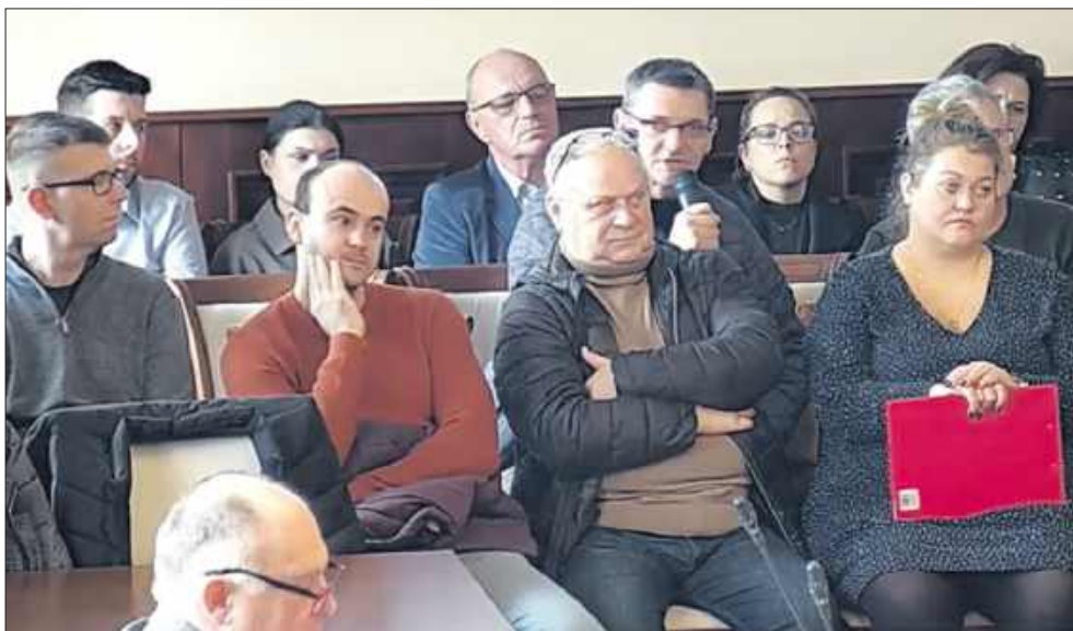
■ Mieszkańcy Radlina II obecni na posiedzeniu Komisji Prawa, Porządku Publicznego i Spraw Społecznych

– Zwracaliśmy się do urzędu miasta z dwoma pismami o jakąkolwiek reakcję. Uzyskaliśmy po monicie odpowiedź kilku stronicową od pana prezydenta – masło maślane, nie podpisałbym się pod tym.