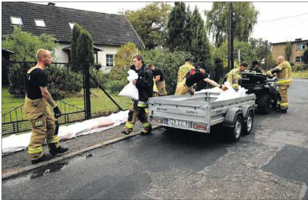
■ O tym, jak bardzo potrzebne są środki na działania kryzysowe, przypomniała powódź z 2024 roku. To właśnie doświadczenia z tamtych wydarzeń – podobnie jak innych sytuacji kryzysowych – pokazały, jakiego sprzętu najbardziej brakuje gminom.

Jak dodaje, to właśnie służby gminne i pracownicy