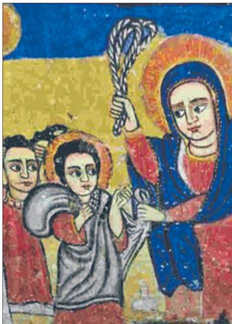
Maryja karząca Jezusa, Fresk w klasztorze Bahar Dar (w Etiopii)

Do najstarszych gatunków dydaktycznych należą bajki i baśnie. Czy to nie to samo? Otóż nie. Bajka to krótki utwór (wierszowany najczę-