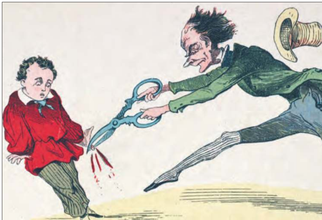
Ilustracja z tomu „Złota różdżka” H. Hoffmana, 1885

Już z Biblii wiemy, że 12-letni Jezus zniknął rodzicom na kilka dni w czasie ich powrotu z Jerozolimy do Nazaretu. Okazało się, że został znaleziony po trzech dniach w Świątyni Jerozolimskiej, jak siedział między mędrcami, rozmawiał z nimi i zadawał mądre pytania. Aż trudno sobie wyobrazić, co