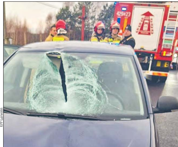
W miejscowości Słup Pierwszy z ciężarówki spadła bryła lodu, która przebiła szybę czołową volkswagena i raniła pasażerkę

Z ciężarówki spadła bryła lodu, która przebiła szybę czołową volkswagena. W wyniku uderzenia pasażerka osobówki doznała obrażeń twarzoczaszki i została przetransportowana do szpitala