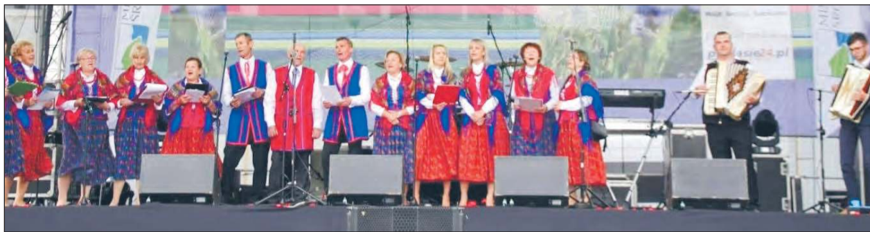
KGW Trojanów na scenie

Koło Gospodyń Wiejskich w Trojanowie, które powstało w 1931 roku, nieustannie łączy tradycję z nowoczesnością, angażując społeczność w różnorodne inicjatywy kulturalne, edukacyjne i charytatywne