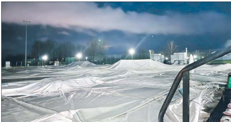
Awaria agregatu i silny wiatr doprowadziły do uszkodzenia nowoczesnej hali pneumatycznej w Miętnej

Awaria agregatu i silny wiatr doprowadziły do uszkodzenia nowoczesnej hali pneumatycznej w Miętnej. Naprawa „balonu” ma rozpocząć się już 15 stycznia