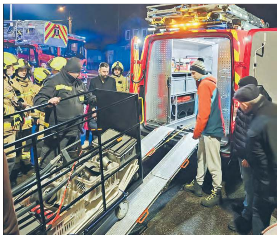
➤ Druhowie z Ochotniczej Straży Pożarnej w Garwolinie świętowali przybycie nowego, lekkiego samochodu rozpoznawczo-ratowniczego. Nowy samochód, przystosowany do różnorodnych działań ratowniczych

Koszt pojazdu wyniósł ponad 734 tys. zł, z czego aż 90% pokryto z funduszy unijnych. Resztę sfinansowano ze środków Krajowego Systemu Ratowniczo-Gaśniczego oraz budżetu Garwolina. - Tego typu projekty są doskonałym przykładem tego, jak fundusze europejskie mogą służyć poprawie jakości życia mieszkańców regionu - zauważyła marszałek Janina Ewa Orzełowska .