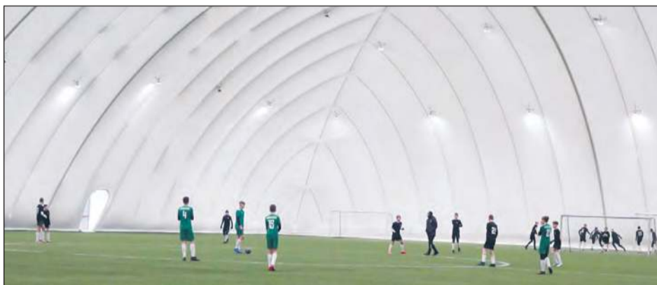
Hala pneumatyczna została oficjalnie otwarta 30 stycznia 2023 roku i od tamtej pory służyła sportowcom z powiatu jako całoroczna, zadaszona przestrzeń treningowa

Hala pneumatyczna, potocznie nazywana „balonem”, to jeden z zaledwie dwudziestu tak dużych obiektów tego typu w Polsce. Została oficjalnie otwarta 30 stycznia 2023 roku i od tamtej pory służyła sportowcom z powiatu jako całoroczna, zadaszona przestrzeń treningowa. Obiekt o wymiarach 100 x 65 metrów, przykrywający boisko piłkarskie, należy do kompleksu sportowego zarządzanego przez Powiatowy Ośrodek Sportu - Hotel Miętne.