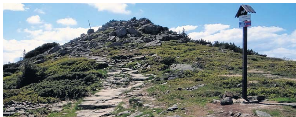
Gówniak w Beskidzie Żywieckim