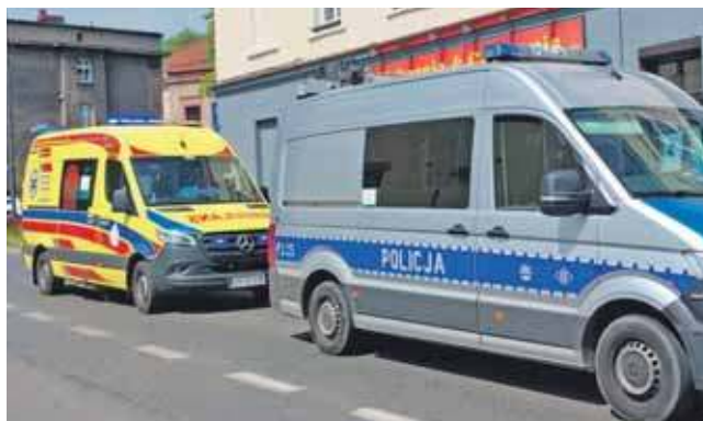
15-latka została przebadana przez zespół ratownictwa medycznego

Sprawczyni została ukarana mandatem w wysokości 2,5 tys. zł oraz 15 punktami karnymi. (MIR)