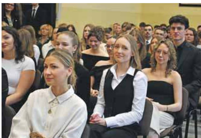
Choć zakończenie nauki w liceum to ważne wydarzenie, przed młodzieżą stoi jeszcze jedno wyzwanie – egzamin maturalny