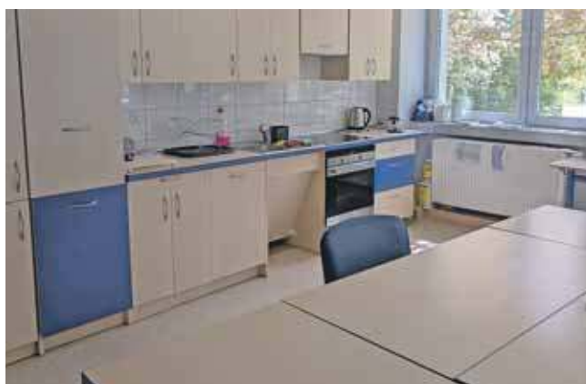
Kuchnia? I tak, i nie. Tak wygląda pracownia życia codziennego w GCR „Repty”. Wykonywanie codziennych czynności to także rehabilitacja. Pracownię ufundowała Fundacja Księcia Donner-smarcka

Niezależnie od planu dnia, wszyscy dziennikarze byli też w pracy, a gospodarze chcieli się pochwalić osiągnięciami i działalnością. GCR „Repty” należy do samorządu województwa śląskiego (podlega sejmikowi). To dzisiaj nowoczesna placówka, stale moderni-