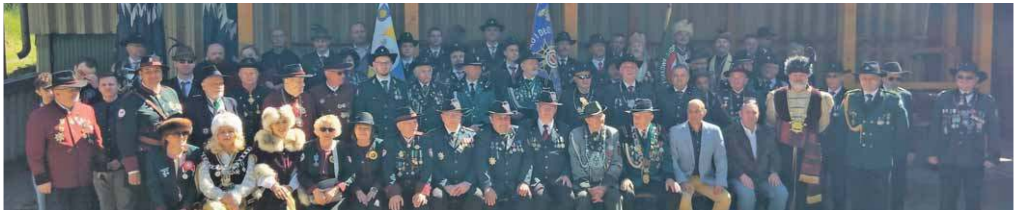
Turniej zgromadził około siedemdziesięciu uczestników