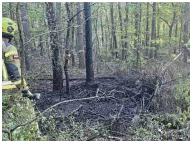
Czy w Tworogu grasuje podpalacz?

Pożary nie były duże i szybko je ugaszono. Jednak strażacy przypuszczają, że las ktoś podpalił. Sprawą zajmuje się policja. (ESP)