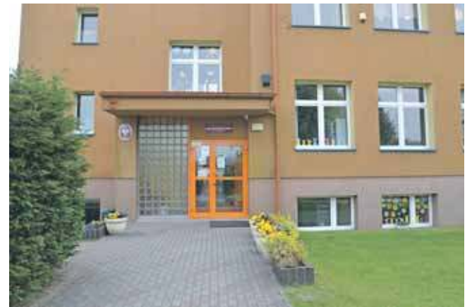
Szkoła w Potępie, jej przyszłość jeszcze nie jest przesądzona

Przed sesją oświadczenie wydał też wójt Gołębiowski. Podkreślał, że jeszcze nie zapadła żadna decyzja, a projekty uchwał dotyczą jedynie zamiaru rozpoczęcia procesu zmian i otwarcia formalnej drogi do szerokich kon-