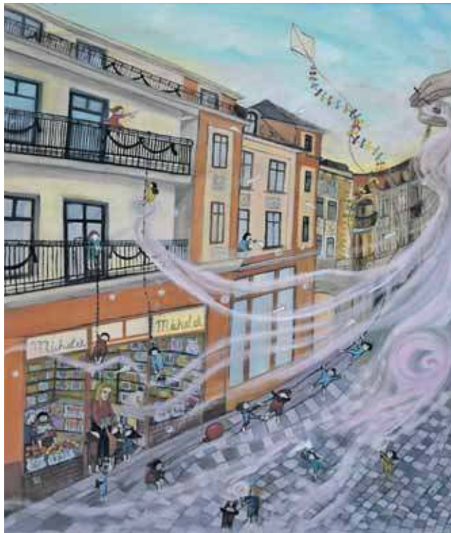
Sklep ze stodyczami „Michałek” na ulicy Krakowskiej. Praca B. Mróz

meldunku”, wydany przez Almaz, którego próżno już szukać w księgarniach - cały nakład wyprzedano. Znalazł się w nim dotychczasowy cykl prac o Tarnowskich Górach, m.in. kosmos, do którego wysłała Miasto Gwarków, grzybek z miejskiego parku, synagoga, targ kartoflany,