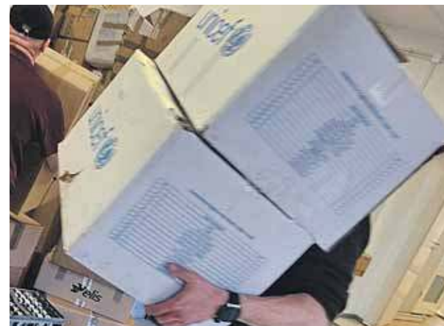
Na razie rzeczy przetransportowano do magazynu

Jeżeli ktoś jest w potrzebie, to mimo chwilowego braku siedziby punktu, może liczyć na pomoc. Wystarczy kontakt telefoniczny, a wolontariusze dostarczą rzeczy