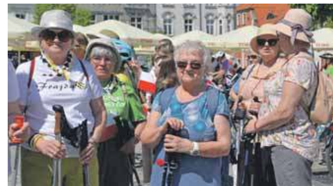
Aktywni seniorzy potrafią radośnie świętować