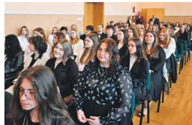
Jeszcze tylko matura