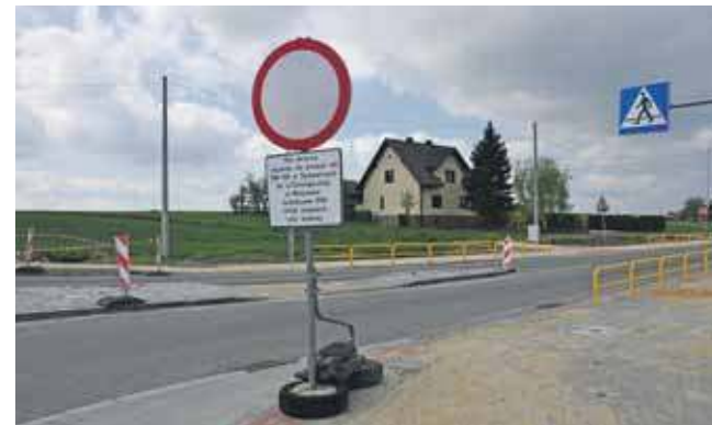
Drogą wojewódzka mogli jeździć tylko mieszkańcy i służby