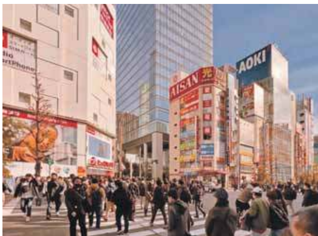
Japońska kultura zachwyca Europejczyków