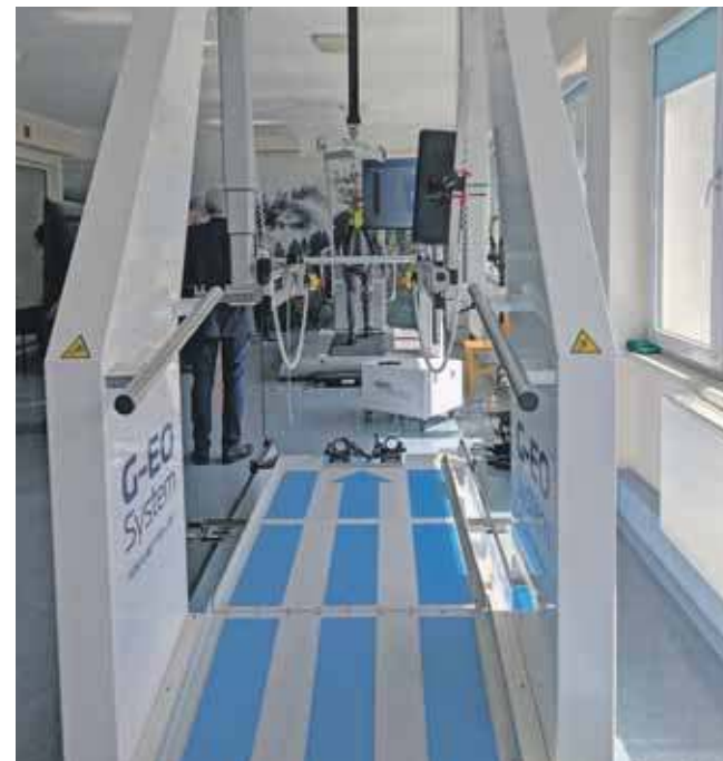
Roboty do nauki chodu