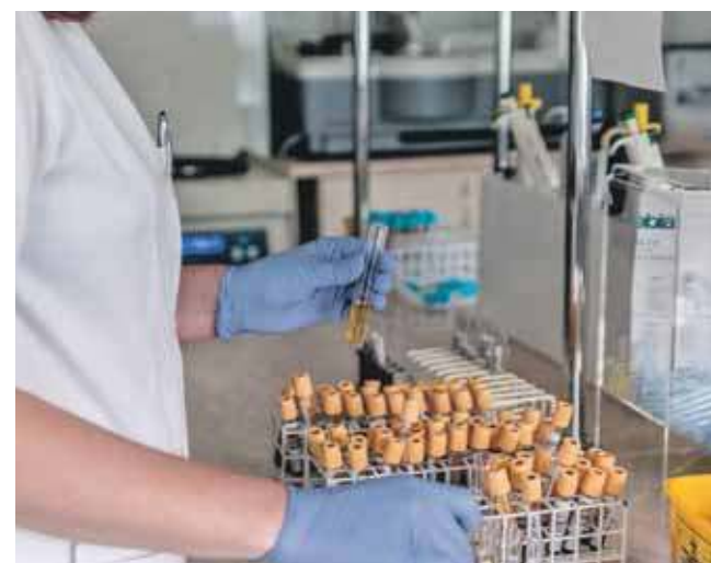
Od maja można skorzystać z nowego programu zdrowotnego, w ramach którego wykonamy badania diagnostyczne