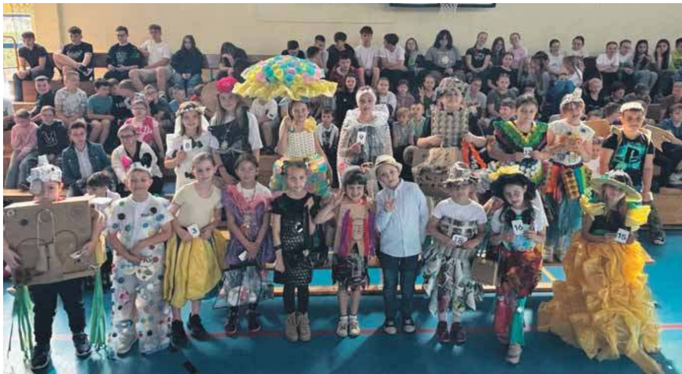
Hitem okazał się pokaz mody ekologicznej

W Szkole Podstawowej w Ożarowicach w kwietniu zorganizowano Gminny Konkurs Ekologiczny „Segregacja odpadów – nasza wspólna sprawa”.