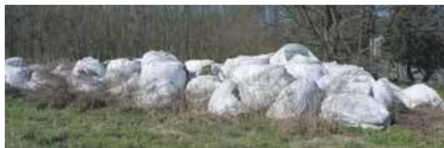
Bioodpady leżą w okolicy ul. Przyjaźni już długo, są nawet na zdjęciach na mapach Google

Czytelnik z Nakła Śląskiego alarmuje: – Od dawna leżą u nas worki po nawozach z jakimiś bioodpadami w środku i nikt nic z tym nie robi.