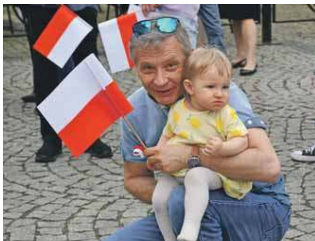
Królowały biało-czerwone flagi

le pw. św. Apostołów Piotra i Pawła w Tarnowskich Górach. Później przy Dzwonnicy Gwarków wystąpiły dzieci z Przedszkola nr 1 „Wesoła Jedyneczka”, były przemówienia i składanie kwiatów. Oprawę muzyczną zapewniła