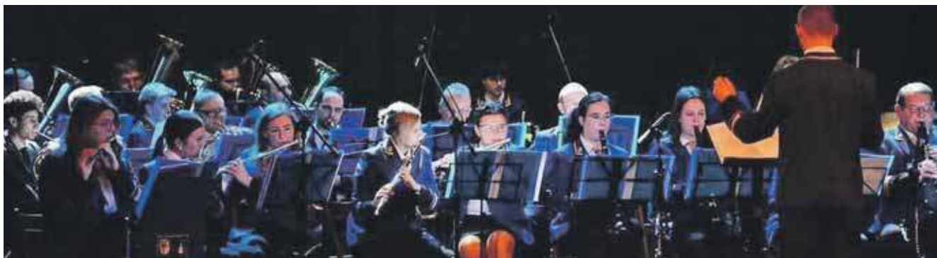
Orkiestra wystąpi w TCK