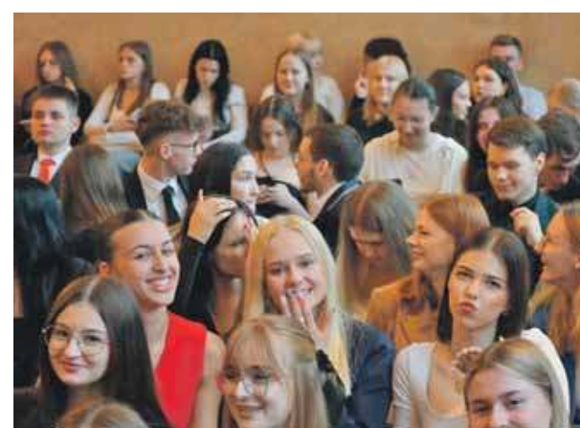
Szkołę kończy 86 absolwentów