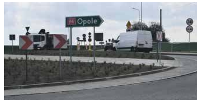
Pod koniec kwietnia rondo było częściowo przejezdne

Podstawowe parametry techniczne po rozbudowie: