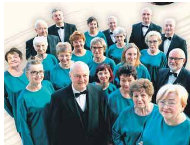
Chór ma już 105 lat