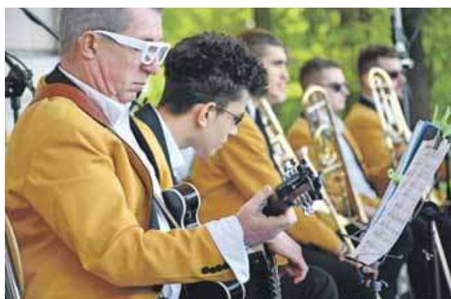
W czwartek, 1 maja, w świerkłańskim parku zagrał TG Big Band

Kto szuka pomysłu na to, dokąd się wybrać w czasie wolnym, niech rozważy ten kierunek. Tym bardziej warto, że parkowe fontanny już działają. (EKA)