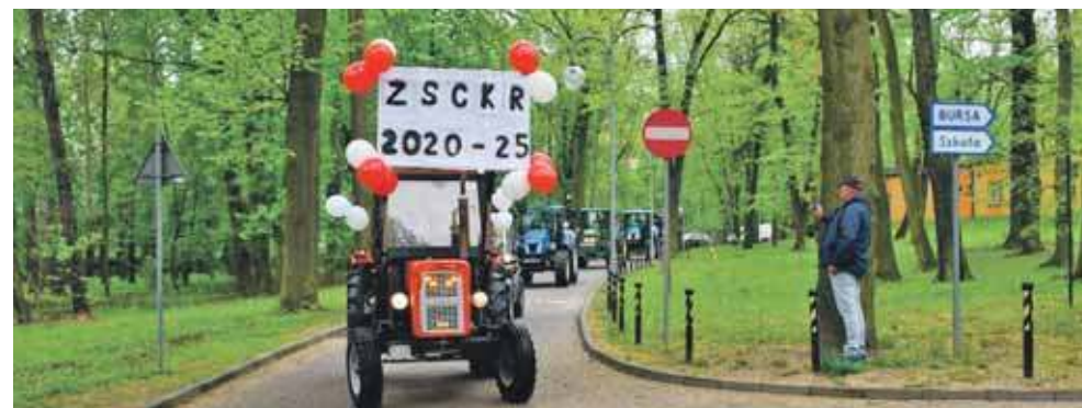
Podtrzymano wieloletnią tradycję wjazdu traktorów