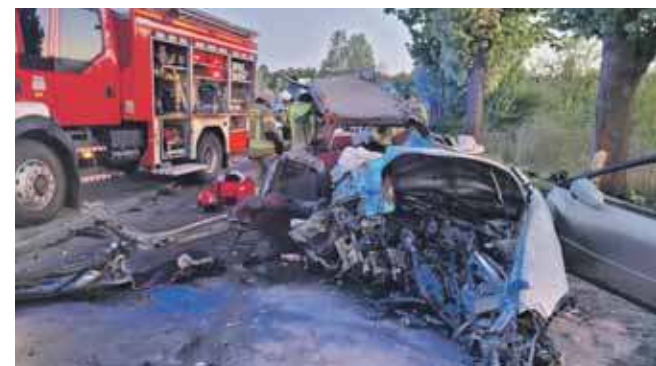
W wypadku zginęło dwóch młodych mężczyzn