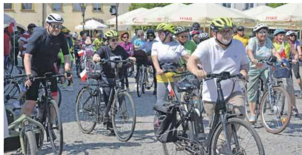
Rowerzyści mieli do przejechania około 10 km

Osoba, która chce skorzystać z powiatomatu, deklaruje to w starostwie w chwili składania wniosku o wydanie danego dokumentu. (EKA)