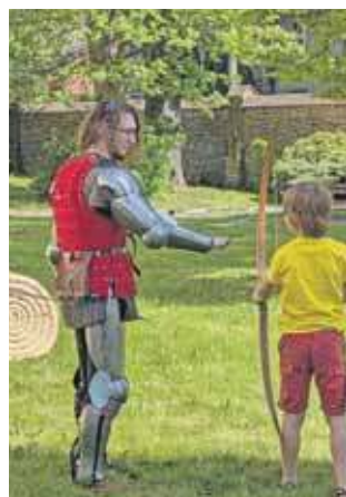
Jedną z atrakcji było strzelanie z łuku

Za nami majowy weekend. Jedną z ciekawszych propozycji była Rycerska Majówka w malowniczym Kompleksie Zamkowym w Starych Tarnowicach.