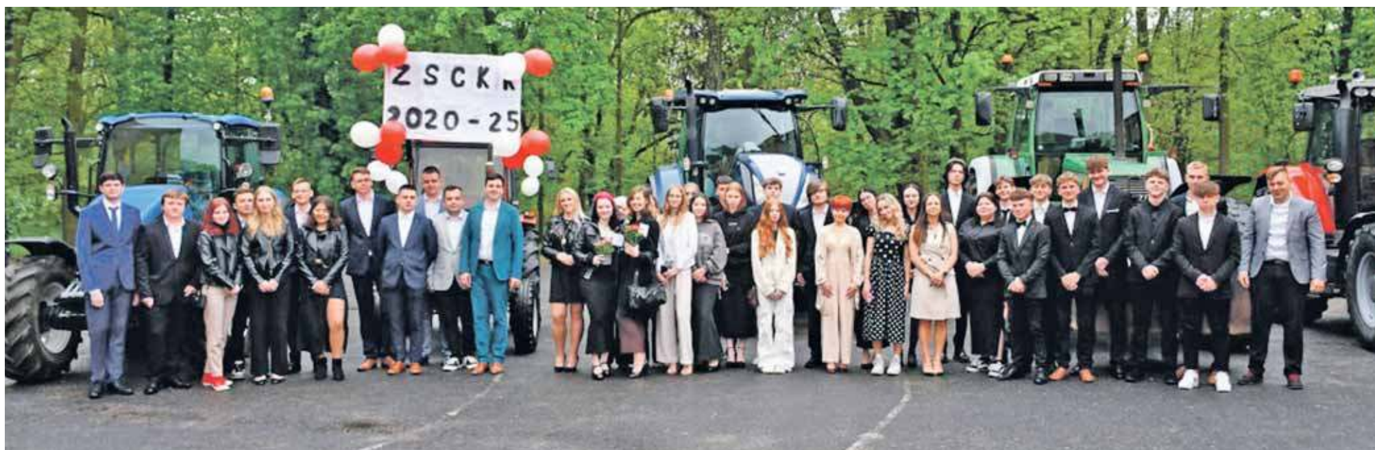
W tym roku szkołę ukończyło 47 absolwentów