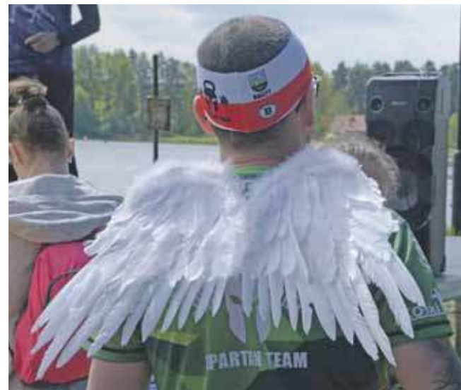
Wings for Life World Run to bieg organizowany w kilkudziesięciu państwach, ma na celu gromadzenie pieniędzy na badania nad metodami leczenia przerwanego rdzenia kręgowego

– Pomysł zorganizowania biegu w Kaletach pojawił się zaledwie miesiąc temu. W tym roku nie udało nam się zarejestrować, zabrakło