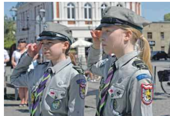
Asysta harcerzy przy wciąganiu flag na maszty