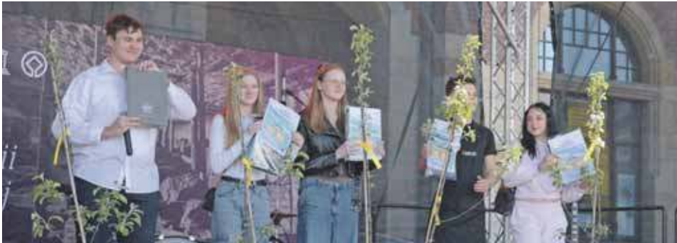
Zwycięcy i wyróżnieni w konkursie kulinarnym dla młodzieży

Tarnowskie Góry są jednym z niewielu miast w Polsce, które mogą poszczycić się swoją odmianą jabłoni. Piękna z Rept ma swoje święto, w tym roku obchodzono je po raz czwarty.