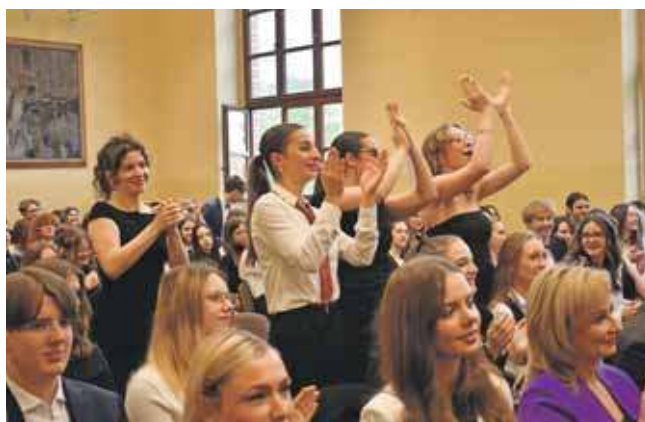
Emocji nie brakowało

Życzymy wszystkim absolwentom powodzenia na egzaminach. (EKA)