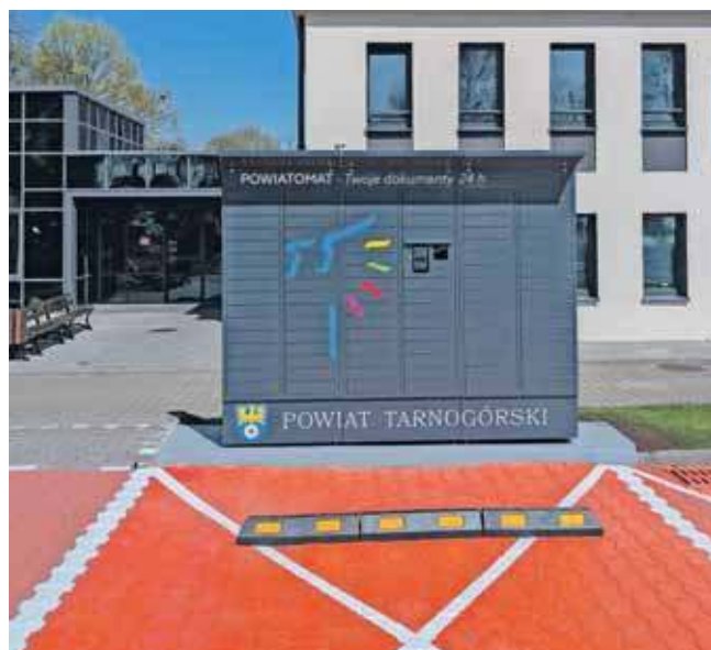
Urządzenie stanęło na parkingu przy starostwie na Karłuszowcu

Największą zaletą urządzenia jest jego dostępność – dokumenty można ode-