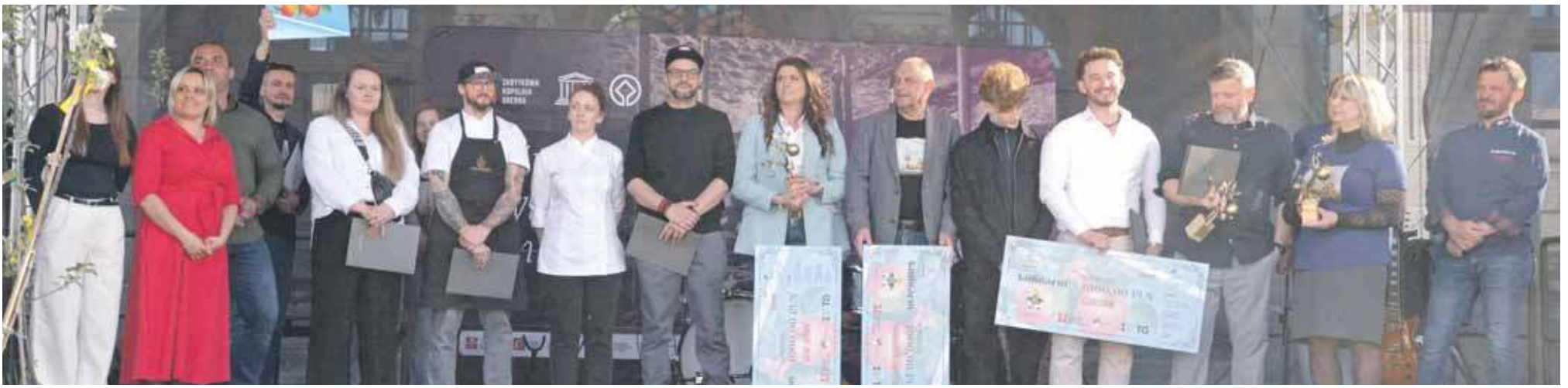
Co roku restauratorzy mają okazję zaprezentować swoje potrawy, w których przygotowaniu wykorzystywana jest Piękna z Rept