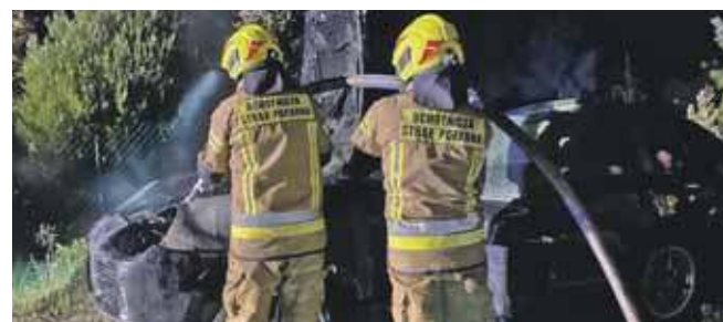
W akcji gaszenia porsche cayenne uczestniczyły dwa zastępy JRG Tarnowskie Góry i 1 OSP Pniowiec