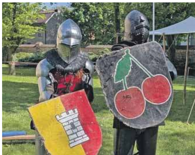
Po pokazie walki rycerskiej

Na uczestników, przede wszystkim dla dzieci, czekało sporo atrakcji – w progra-