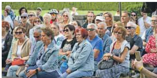
Koncert przebojów przyciągnął do parku liczną publiczność, ale nie tylko koncert