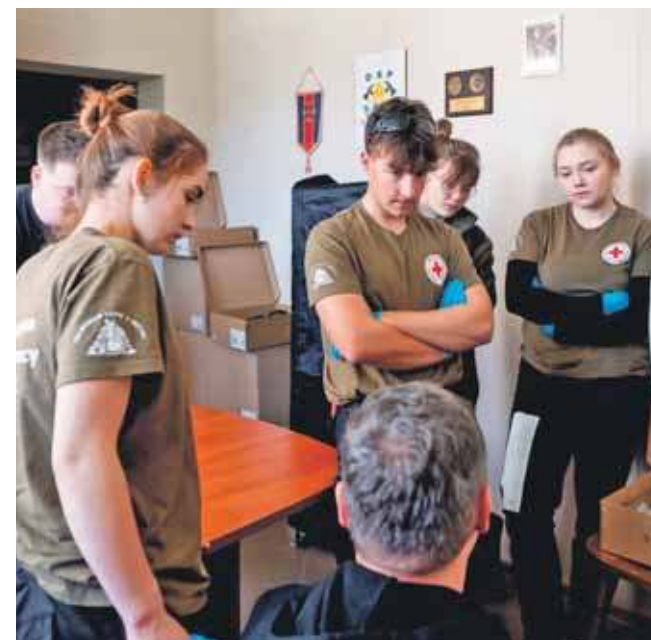
Wygrała drużyna z Zespołu Szkół Leśnych i Ekologicznych w Brynku