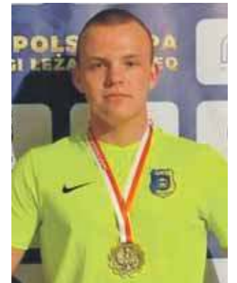
Kolejny sukces naszego mieszkańca

– Szykuję się na kolejne zawody jesienią. Szukam też sponsorów, którzy mnie wesprą w przygotowaniach do rywalizacji na szczeblu międzynarodowym z wyciskania