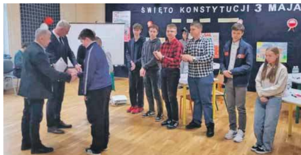
Wygrała reprezentacja Nowego Chechła