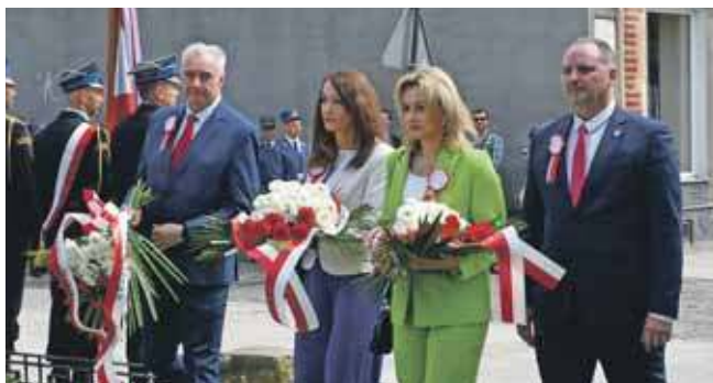
Tym razem kwiaty składano pod tablicami przy Dzwonnicy Gwarków

Msza święta, występy przedszkolaków, wspólne śpiewanie. Za nami oficjalna część uroczystości trzeciomajowych.