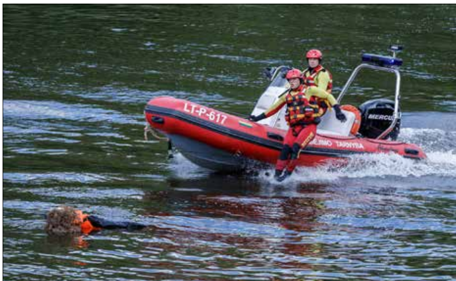
W szczególnie upalne dni dyżury ratowników na kąpieliskach są przedłużane do godziny 22:00.