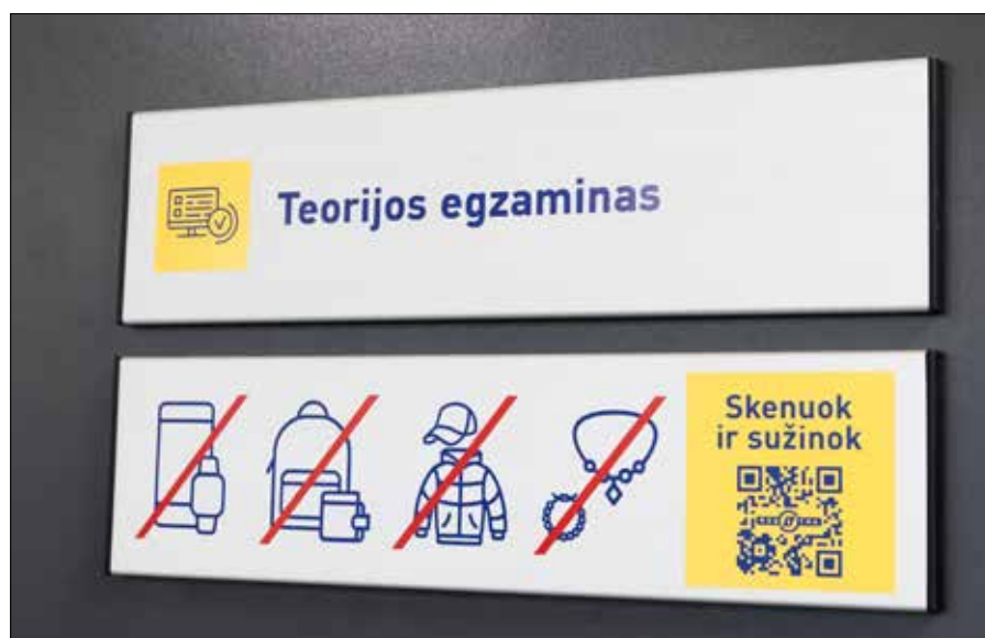
Od stycznia na Litwie istnieje możliwość zdawania egzaminu na prawo jazdy w języku polskim.