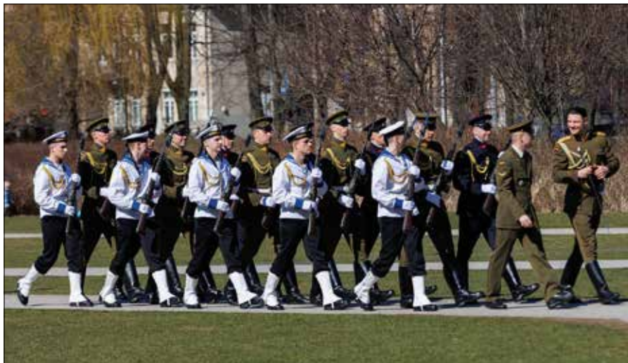
Zgodnie z nowymi przepisami młodzi ludzie są wzywani do odbycia służby wojskowej zaraz po ukończeniu szkoły

— Przed podjęciem takich decyzji należy się odpowiednio przygotować i zapewnić naszym żołnierzom