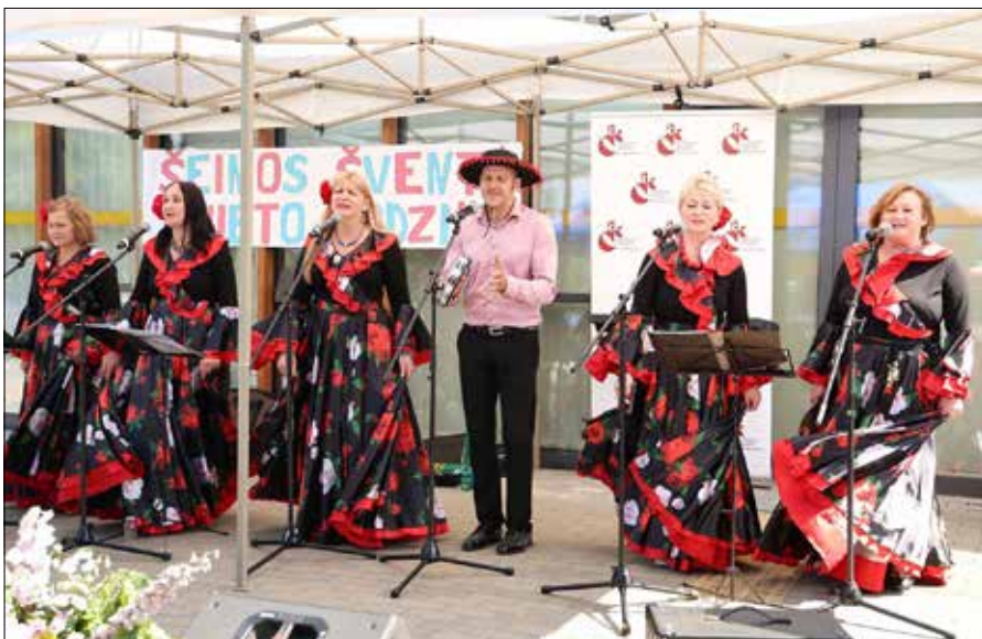
Publiczność miała okazję obejrzeć piękny koncert i wesoło się bawić z artystami