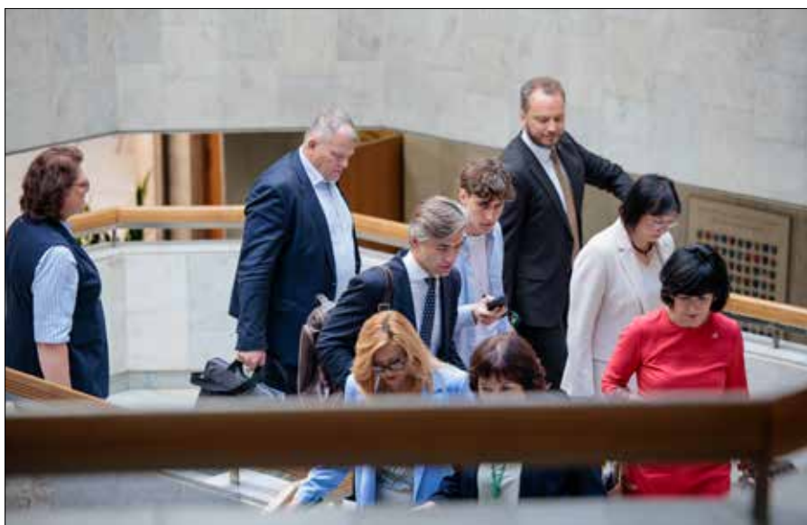
■ Po dziewięciu miesiącach XX rząd podał się do dymisji

W ubiegłym tygodniu frakcje parlamentarne Litewskiej Partii Socjaldemokratycznej, Związku Demokratów „W imię Litwy”, Związku Chłopów, Zielonych i Rodzin Chrześcijańskich podpisały umowę koalicyjną i zgłosiły na stanowisko premiera przewodniczącego socjaldemokratów Mindaugasa Sinkevičiusa.