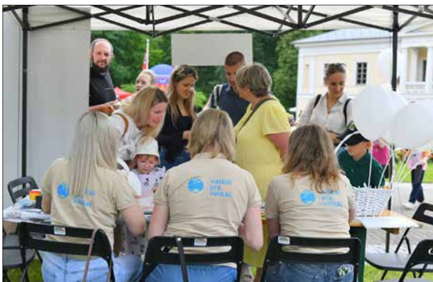
W akcję wpisuje się też letni festiwal promujący opiekunstwo „Dzieci są dziećmi”