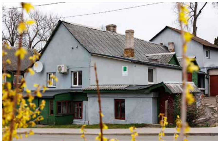
„Domek Konwickiego” stoi w malowniczej Kolonii Wileńskiej

Na podstawie: twórczość Tadeusza Konwickiego , „KW”, „Rzeczpospolita”, inf.wł., „Polityka”, mat. pras., Sejm RP, NAC