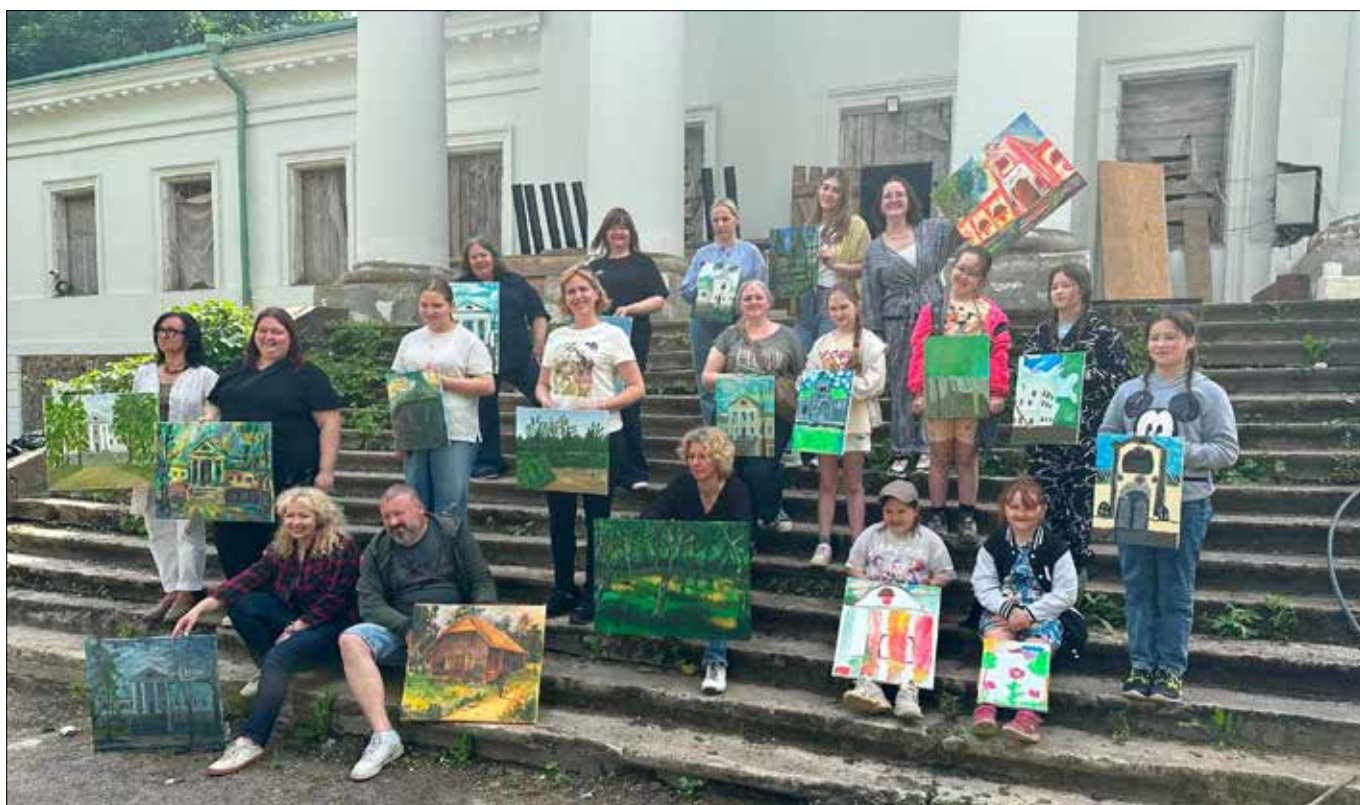
■ Tegoroczny plener malarski został zorganizowany przy dworze w Niemieżu