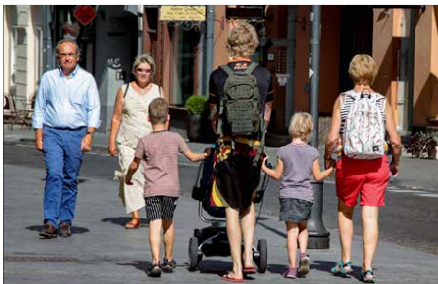
Panuje przekonanie, że po rozwodzie alimenty płaci się nie dziecku, lecz byłemu małżonkowi

Jeżeli parlament przyjmie proponowane zmiany, nowe sankcje zaczęłyby obowiązywać od 1 listopada. ■