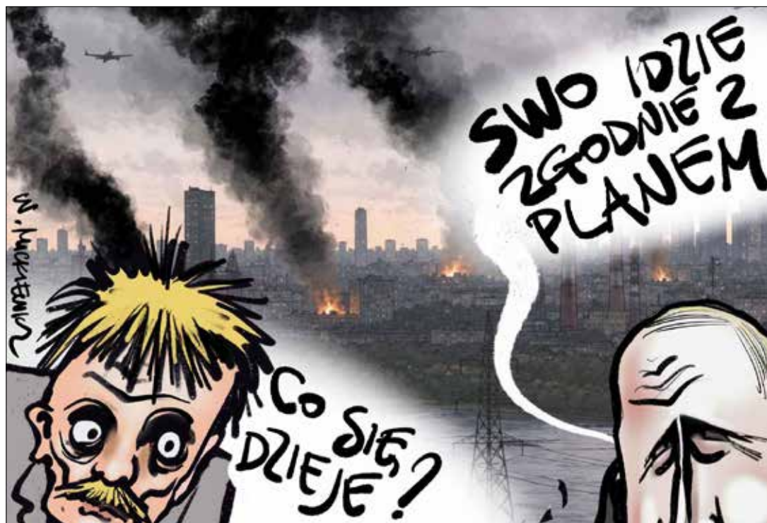
■ Rys. Władysław Mickiewicz