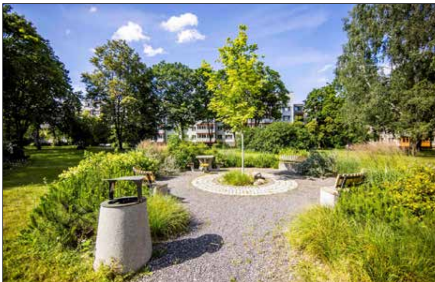
Odnowiona przestrzeń między blokami to efekt inwestycji realizowanych przy udziale mieszkańców

„Podwórka bloków w Wilnie przez długi czas należały do najbardziej zaniedbanych przestrzeni publicznych miasta, dlatego systematycznie inwestujemy w ich odnowę. W latach 2023-2025 uporządkowaliśmy ponad 250 podwórek, a znaczną ich część odnowiliśmy wspólnie ze społecznościami lokalnymi w ramach Programu »Sąsiedztwa«. Widzimy, że ten model działa — inicjatywy mieszkańców przekładają się na konkretne działania, dlatego nie tylko kontynuujemy program, ale także go wzmacniamy. W tym roku planujemy w jego ramach odnowić około 70 podwórek, a łącznie w ramach