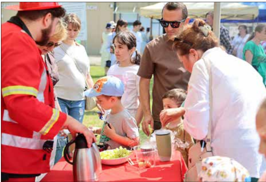
Na przybyłych gości czekało popołudnie pełne wrażeń

Na święto do Sawiczun przybyli również dostojni goście: radna Samorządu Rejonu Wileńskiego Ma-