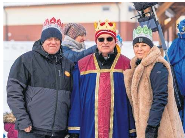
Wspólne kolędowanie, przepiękne stroje i radość na twarzach