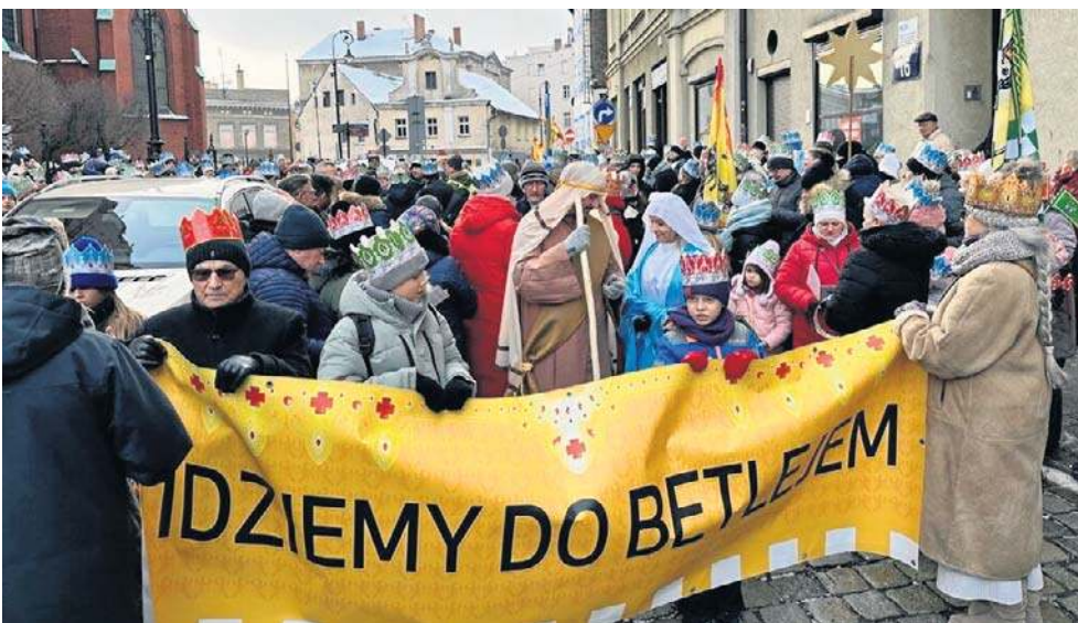
6 stycznia pod kościołem Aniołów Stróżów w Wałbrzychu zjawili się prawdziwe tłumy