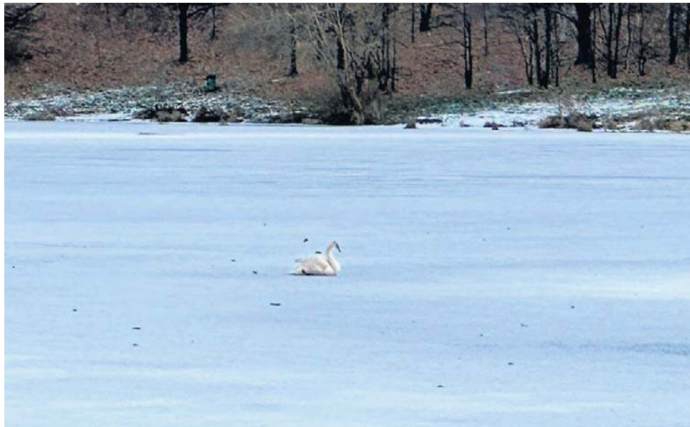
Na zamrożonym Zalewie Witoszówka został tylko młody łabędź, kaczki wyniosły się do sąsiedniego parku

I opowiada, że strażacy za każdym razem czekają, aż ptak wykona jakiś ruch, bo nie wiadomo, czy wchodzić na lód