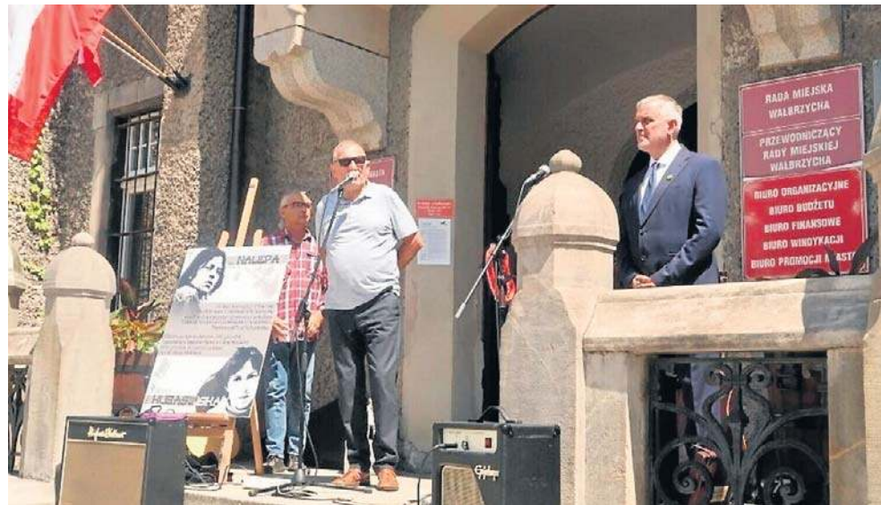
Tablica upamiętniająca ślub Kubasińskiej i Nalepy od czerwca 2022 roku znajduje się w wałbrzyskim ratuszu

Mira Kubasińska i Tadeusz Nalepa przyjechali do Wałbrzycha w styczniu 1964 roku jako członkowie kabaretu „Porfirion”, który w tamtym czasie