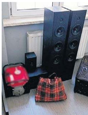
Policjanci odzyskali skradzione mienie

Warto skontaktować się z Komisarzatem Policji II w Wałbrzychu pod numerem telefonu 47 87 579 00 lub Komendą Miejską Policji w Wałbrzychu pod numerem telefon 47 87 513 60.