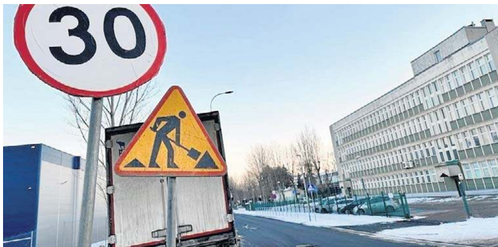
Stanęły prace na kilku ważnych budowlach, naprawy dróg muszą poczekać

- Ogrodowej (termin zakończenia realizacji to sierpień 2026 roku)