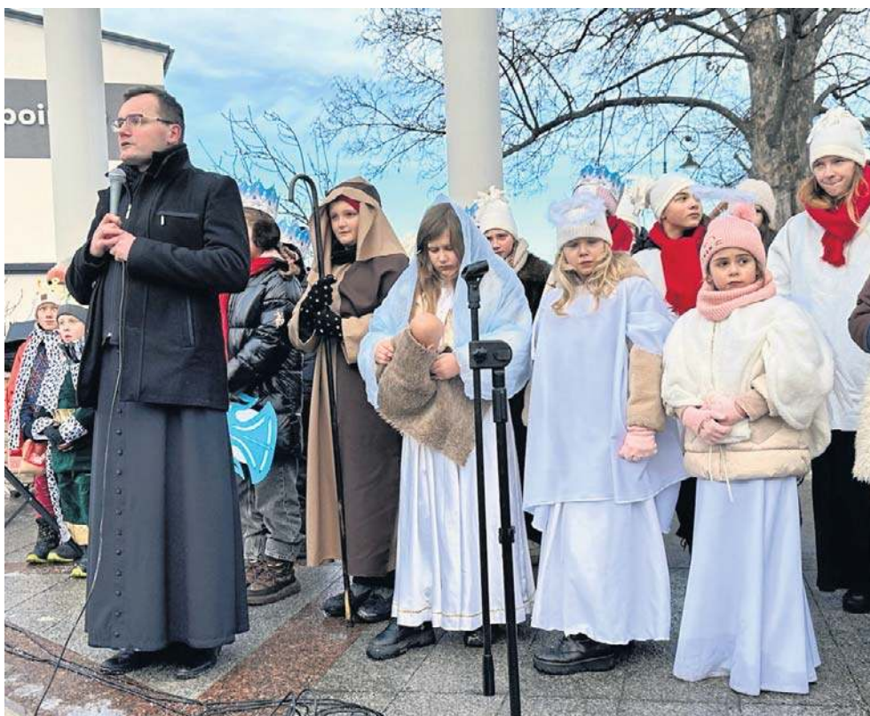
Jasełka w amfiteatrze przygotowali uczniowie ze Szkoły Podstawowej nr 28