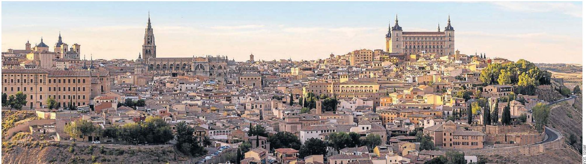
Hiszpańskie miasto Toledo było w średniowieczu jednym z najważniejszych światowych centrów wymiany handlowej