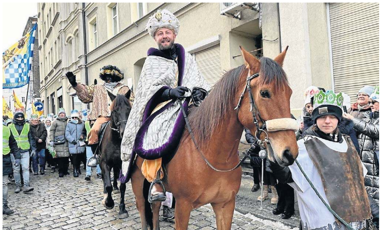
Największą świąteczną inscenizację organizują rodziny katolickie