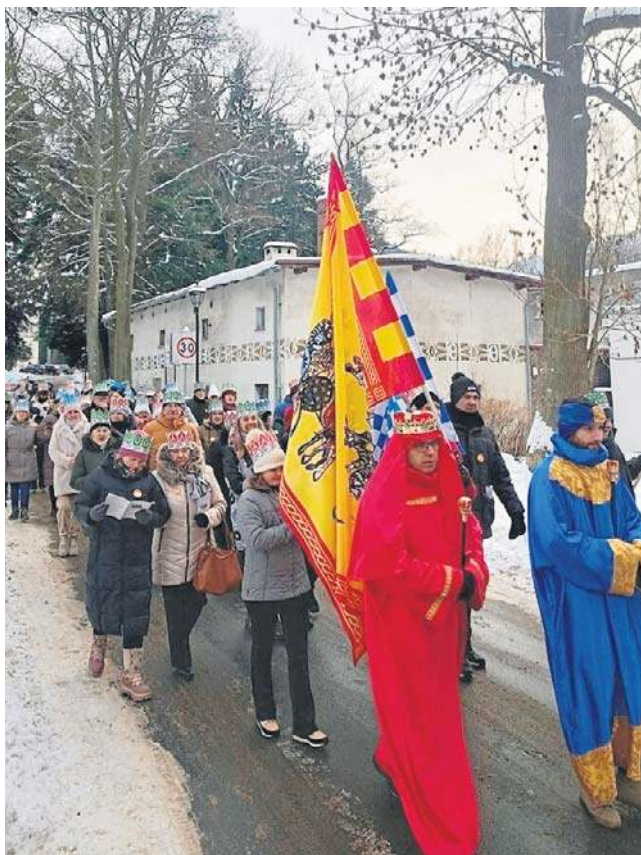
Mroźna pogoda nie zniechęciła starszych i młodych, było radośnie i barwnie