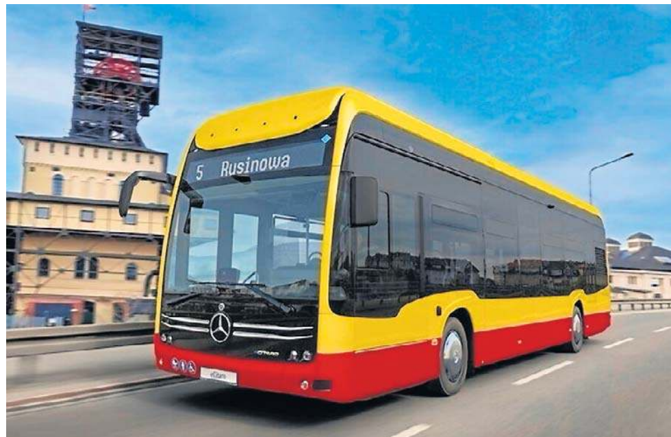
Mercedes łączy moc baterii trakcyjnych z paliwowym ogniwem wodorowym, tworząc zaawansowaną, zeroemisyjną hybrydę nowej generacji