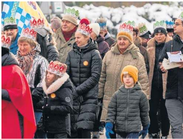
Tradycyjny orszak świąteczny powędrował ulicami Mieroszowa i Sokołowska.