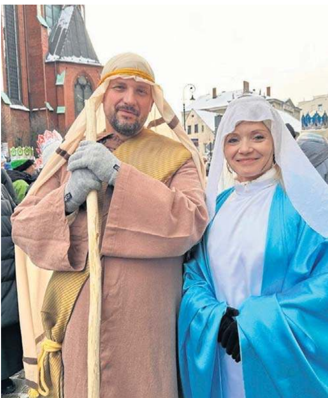
Wszyscy zgodnie twierdzą, że przychodzą, bo lubią atmosferę towarzyszącą temu wydarzeniu