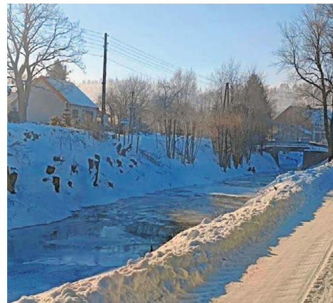
Jawiszów w powiecie kamiennogórskim, to najbardziej mroźna miejscowość w regionie

Instytutu Meteorologii i Gospodarki Wodnej podaje także, że w czwartek o godz. 6 rano w Jeleniej Górze temperatura wynosiła - 20,5 stopni Celsjusza. Jeżów Sudecki podał, że - 22. Na Hali Izerskiej zanotowano - 30, na Śnieżce - 11.