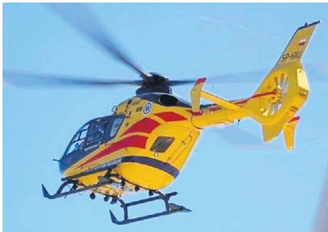
Dziecko zabrano z Nowej Rudy Lotnicze Pogotowie Ratunkowe do szpitala we Wrocławiu