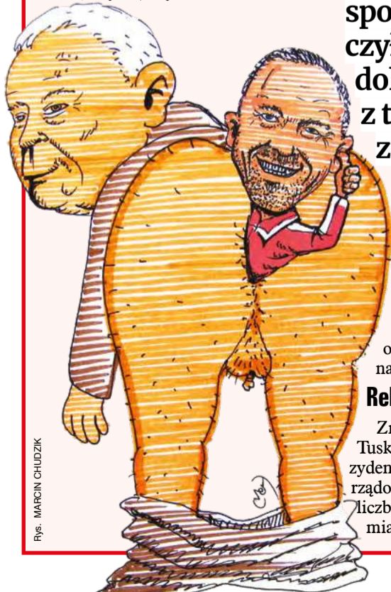
rys. MARCIN CHUDZIK

Zmiany w swym rządzie premier Tusk zapowiadał jeszcze przed prezydenckimi wyborami. W sferach rządowych mówiło się o zmniejszeniu liczby wiceministrów i ministrów, co miało poprawić rządową sprawność.