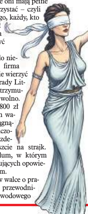
ILLUSTRACJA: PAVEL FERENC