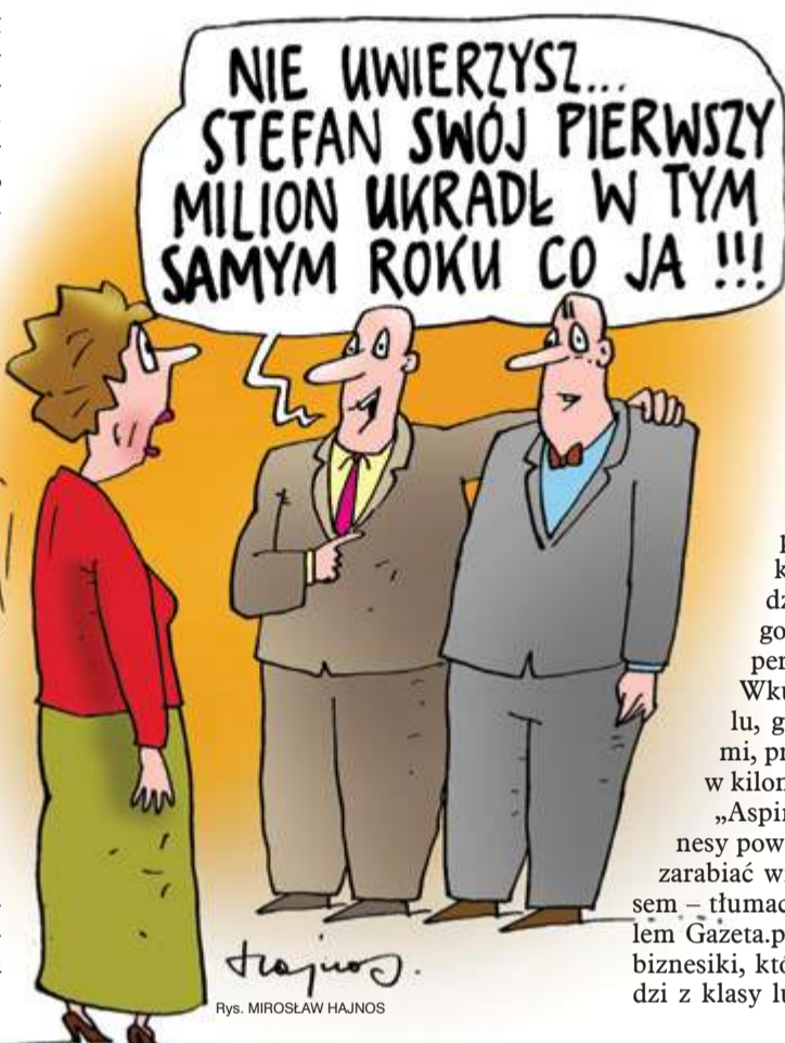
Rys. MIROSLAW HAJNOS

Zresztą, niejedni „biznesmeni” to realnie pracownicy na etacie, wypchnięty na działalność jednoosobową przez pracodawcę – zyskujący na tym podatkowo, lecz tracący prawa socjalne. Barberzy, kierownicy czy manikierzy pracują na umowach „biznes dla biznesu”, niekiedy wynajmując samochody czy fotele, na których sadzają klientów. To skądinąd prosta droga do hipersamowyzysku.