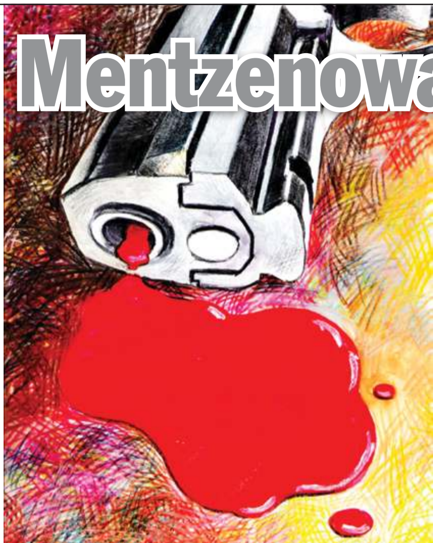
Rys. TOMASZ WOŁOSZYN

W Stanach Zjednoczonych, gdzie prawo do posiadania broni jest poprawką do konstytucji, broni jest więcej niż ludzi. Efekt? 40 tys. zgonów rocznie. Rocznie! Z tego setki to dzieci i młodzież. Wskaźnik zabójstw z użyciem broni palnej wynosi tam 6,1 na 100 tys. osób. Dla porównania – w Polsce to 0,7–0,8. Różnica, której nie da się zignorować. Statystyki pokazują jedno: więcej broni to więcej trupów.