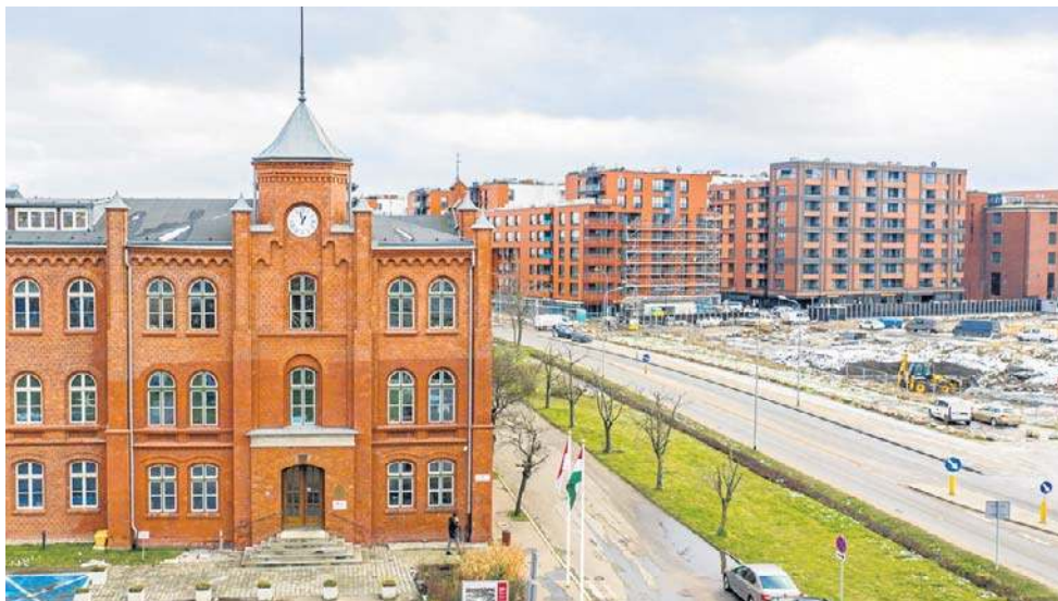
Czy na mapach Gdańska pojawi się dzielnica Młyniska-Młode Miasto?

- W ostatnich latach doszło jednak do gwałtownego rozwoju Młodego Miasta jako dzielnicy metropolitalnej - czytamy w uzasadnieniu Rady Dzielnicy Młyniska. - Na tym terenie znalazły się nowe lub zrewitalizowane obiekty kulturalno-historyczne o znaczeniu europejskim, np. Europejskie Centrum Solidarności, czy Sala BHP-dawny magazyn torped, a także sama Stocznia Gdańska, która była przedmiotem wniosku o wpis na listę światowego dziedzictwa UNESCO. Obiekty te, jakkolwiek integralnie stanowiące część zwartej przestrzeni stoczniowej, odczuwalnie wyodrębnionej ze Śródmieścia, nie były częścią historycznych Młynisk. Obok nich powstaje nowa dzielnica docelowo mająca liczyć więcej mieszkańców niż stare Młyniska, z budynkami projektowanymi jako ikony metropolii.