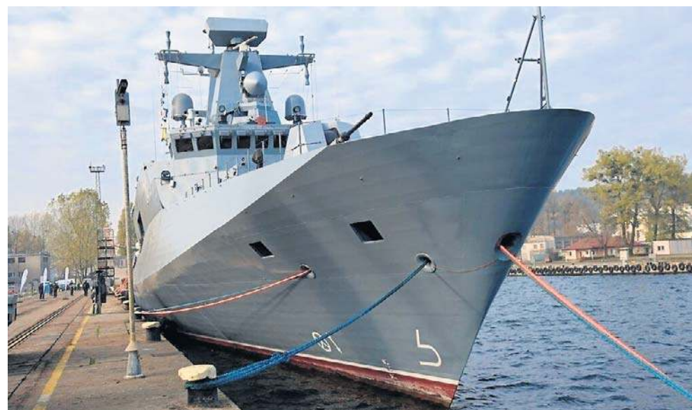
ORP „Ślązak” służy w Marynarce Wojennej od roku 2019

Ostatecznie Ślązak został ukończony pod koniec października 2019 roku, a podniesiono na nim banderę tradycyjnie, 28 listopada, w Święto Marynarki Wojennej RP. Przed oddaniem do służby okręt przechodził intensywne testy -