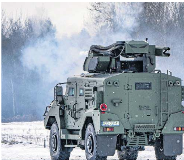
Fundusze z programu SAFE mają trafić do niemal 900 podmiotów na Pomorzu

- To są inwestycje w każdym praktycznie powiecie w Polsce - podkreślała parlamentarzystka. - Na Pomorzu te inwestycje będą związane z działalnością blisko dziewięciuset podmiotów. Trzy największe, bo nie o wszystkich jeszcze możemy mówić, to jest Polska Grupa Zbrojeniowa Stocznia Wojenna, Ośrodek Badawczo-Rozwojowy Centrum Techniki Morskiej oraz Stocznia Remontowa Nauta w Gdyni. To są podmioty, które będą beneficjentami tego programu. Rząd premiera Donalda Tuska zrobi wszystko, żeby te pieniądze trafiły do polskich przedsiębiorstw.