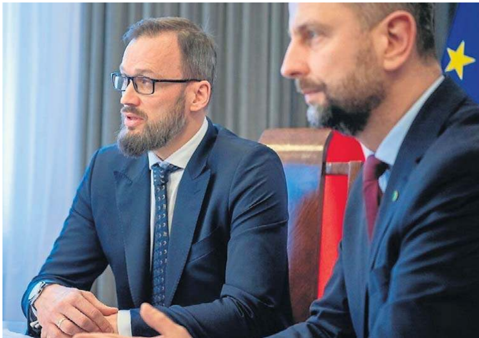
Maciej Samsonowicz i Władysław Kosiniak-Kamysz zapowiadają obecność w Gdyni

Zaznaczmy, ogłoszona w zeszłym roku koncepcja Zielonego Okręgu Przemysłowego „Kaszubia”, swego rodzaju strefy ekonomicznej, zakłada rozwój przemysłu (w tym obronnego oraz dual use), energetyki i infrastruktury krytycznej na terenie m.in. województwa pomorskiego. Obok wspomnianych wyżej inwestycji Kongsberga planowana jest budowa centrum dronowego, bazy danych.