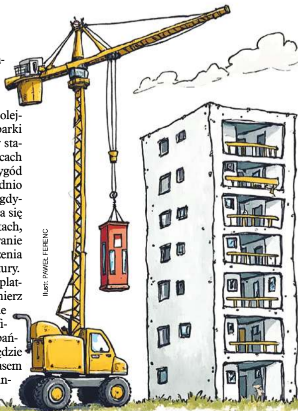
ILUSTR. PAVEL FERENC

W 2017 r. świeżo wystrugany premier Mateusz Morawiecki zapowiedział plany dotyczące poprawy jakości życia na osiedlach z wielkiej płyty, w tym pomysł na dobudowę wind – szczególnie zewnętrznych – co miało ułatwić życie poturbowanym przez grawitację i własne zdrowie. Temat zdechł śmiercią naturalną, żeby pojawić się w kampanii w 2023 r. Morawiecki na konferencji