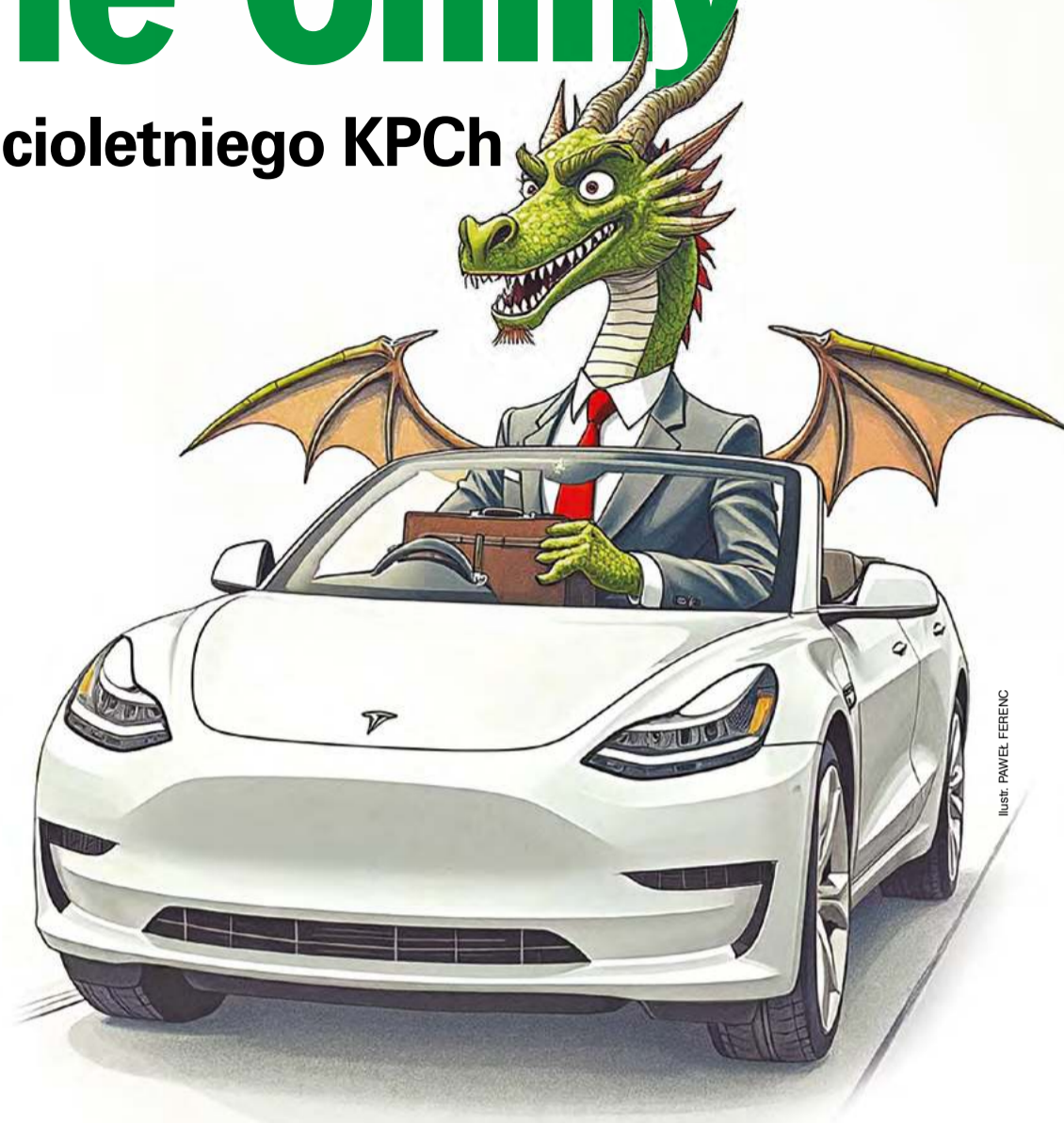
ILLUSTRACJA: PAWEŁ FERENC

Przykład Chin pokazuje nam dwie rzeczy. Po pierwsze, da się mieć i zieloną politykę, i roz-