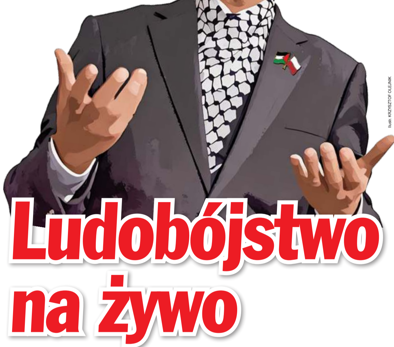
ILUSTRACJA: KRYSZTOF OLEJNIK