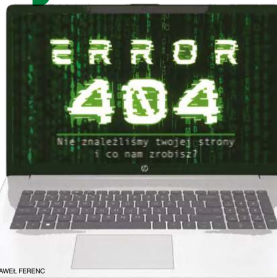
Ilustr. PAWEŁ FERENC

Od tej pory niech sobie każdy gada, co chce. A nam przecież chodzi o kasę i władzę, która nam ją zabezpiecza. Bierzmy media! Zróbmy media prywatne. Będzie ich tyle, że żadne nie utrzyma się wyłącznie ze sprzedaży informacji i publicystyki. Będą musieli sięgnąć po pieniądze z biznesu. Tak! Niech żyją głównie z reklam. Tych od rządu lub wprost od biznesu. To ich dostatecznie od nas uzależni. Nie będą przecież narzekać na fir-