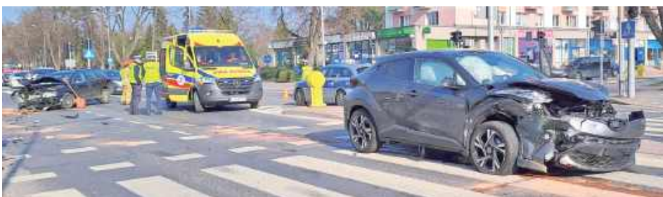
Osobowa Toyota chciała skręcić w lewo, ale nie zdążyła, bo z naprzeciwka nadjechał Volkswagen i doszło do zderzenia

Dwoje mieszkańców powiatu łukowskiego trafiło do szpitala po zderzeniu Toyoty i Volkswagena, do którego doszło w miniony piątek w centrum Puław.