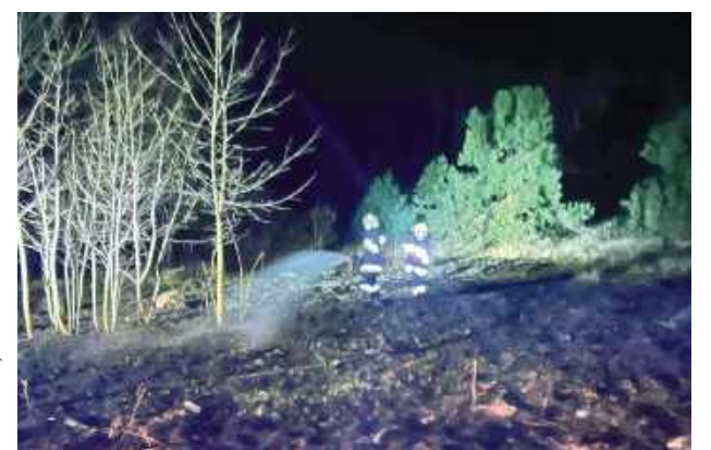
Strażacy z OSP Zgórnica w akcji