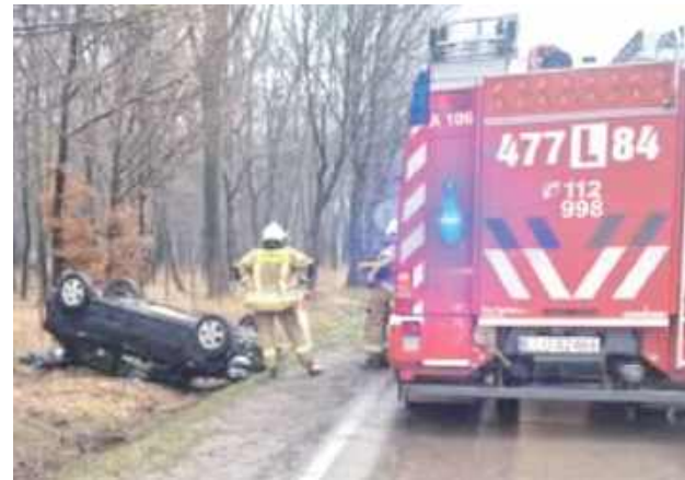
24 marca w Jarczewie doszło do groźnego zdarzenia drogowego

Po przybyciu na miejsce strażacy zastali samochód w przydrożnym rowie. Działania ratowników skupiły się na udzieleniu pomocy osobom poszkodowanym, zabezpieczeniu pojazdu oraz miejsca zdarzenia.