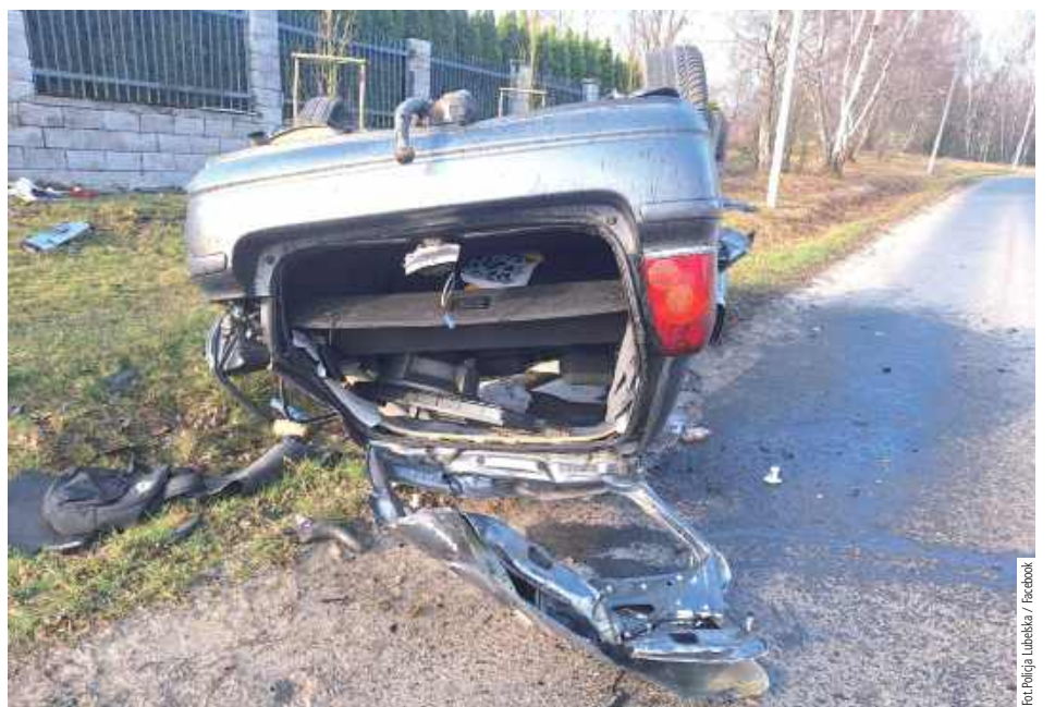
Samochód, którym podróżowali nastolatki, nagle zjechał z drogi. Uderzył w słup latarni

W niedzielę (30 marca) policjanci z Chełma poinformowali o wypadku nastolatków. Kierujący 19-latek miał dwa promile alkoholu. Śmierć poniosły na miejscu dwie z dziesięciu osób, które jechały autem.