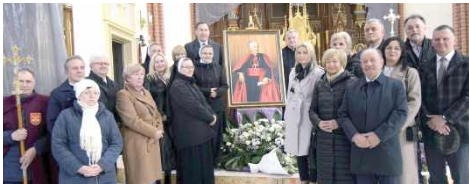
W uroczystej mszy św. wzięły udział Siostry z założonego przez Biskupa Zgromadzenia św. Teresy od Dzieciątka Jezus z Podkowy Leśnej, przedstawiciele władz gminy i miasta Stoczek Łukowski oraz dyrektorzy i kierownicy jednostek organizacyjnych