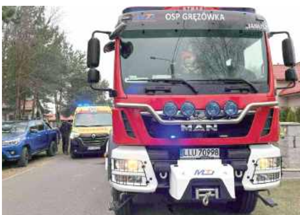
Dzięki wzorowej postawie rodzeństwa, członków naszej MDP, którzy szybko zaalarmowali służby, pożar nie rozprzestrzenił się i został opanowany w zarodku

Zgłoszenie wpłynęło o godz. 16.05. Do akcji ruszyły dwa zastępy straży pożarnej z Łukowa, jednostka OSP KSRG Grzędówka, a także pogotowie ratunkowe i po-