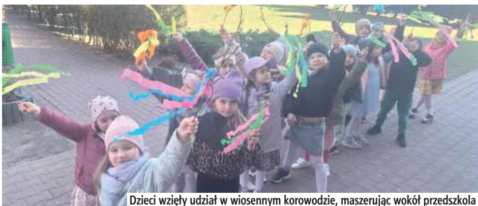
Dzieci wzięły udział w wiosennym korowodzie, maszerując wokół przedszkola