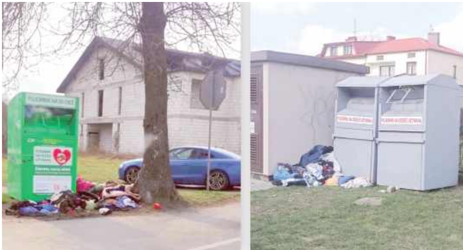
Przy większości kontenerów na używaną odzież w Łukowie jest taki bałagan. Zdjęcia nadesłali nam Czytelnicy

ŁUKÓW: W minionym tygodniu dostaliśmy od Czytelników kilka zdjęć z przepelnionymi kontenerami na używaną odzież. Kontenery stoją w różnych częściach Łukowa i ostatnio ich właściciel - zewnętrzna firma spoza Łukowa - nie nadąża z odbiorem ubrań. Dlaczego?