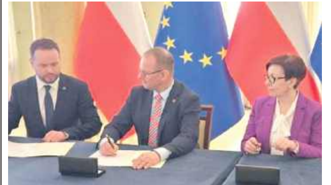
Planowo prace mają potrwać do maja 2026 r.