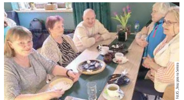
Po wiosennych porządkach ekipa z klubu seniora wybrała się do kina i na pizzę