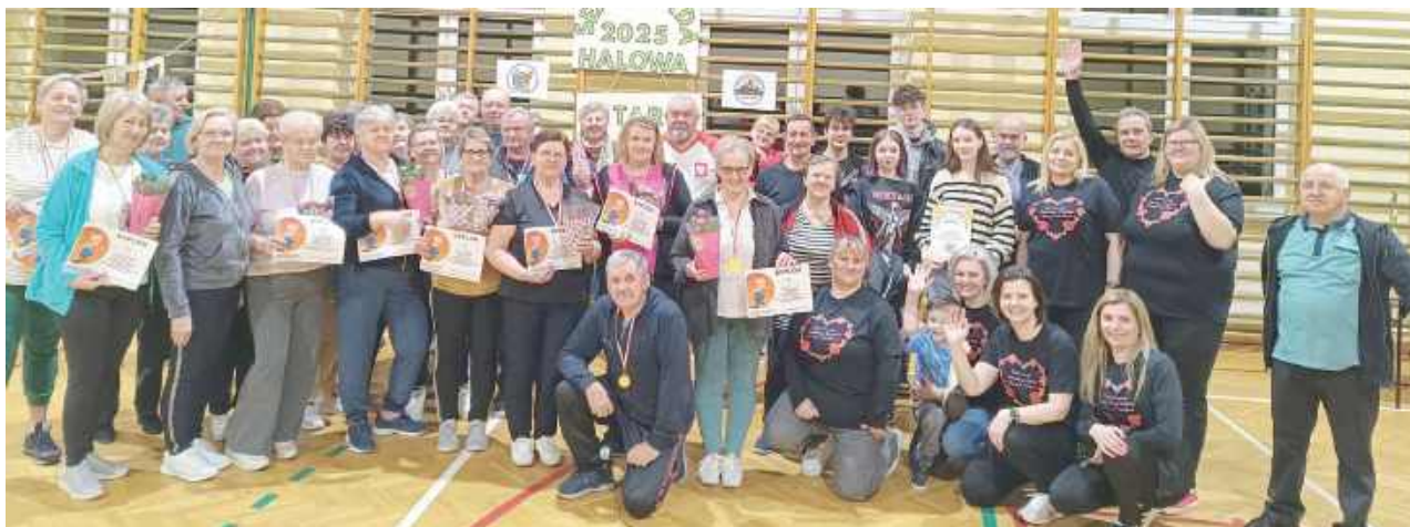
To była nie tylko rywalizacja, ale i świetna zabawa dla wszystkich uczestników Senioriady