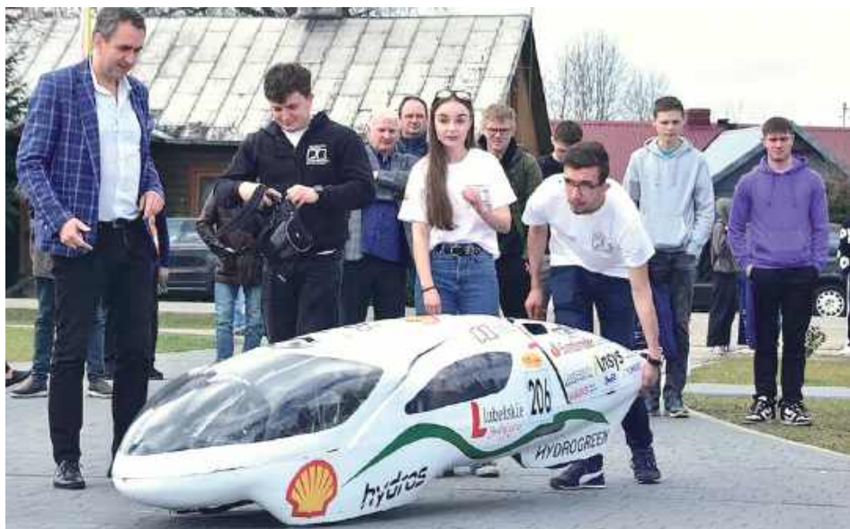
Szczególną atrakcją była prezentacja bolidu Hydros – ważącego 34 kg innowacyjnego pojazdu, który zbudowali studenci z Koła Naukowego Hydrogreen z Politechniki Lubelskiej

ŁUKÓW: W Branzowym Centrum Umiejętności przy Zespole Szkół nr 1 im. H. Sienkiewicza w Łukowie 25 marca odbył się Ogólnopolski Konkurs Wiedzy Technicznej.