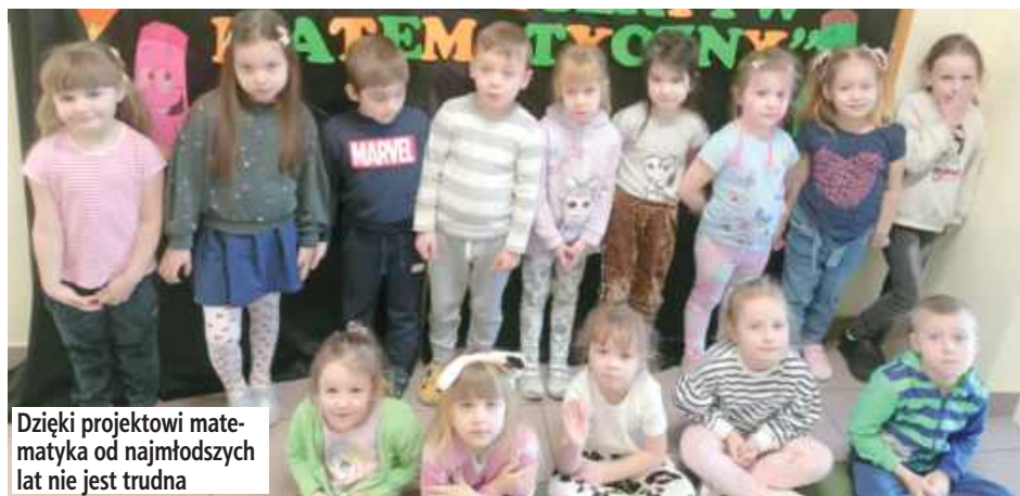
Dzięki projektowi matematyka od najmłodszych lat nie jest trudna

Matematyka to nie tylko liczby i działania, ale także fascynująca przygoda, którą można rozpocząć już od najmłodszych lat. Doskonałym przykładem jest program grantowy „Rosną z matematyką”, który z powodzeniem realizowany jest w oddziale przedszkolnym już drugi rok. Dzięki niemu najmłodszy mają szansę na odkrywanie matematycznego świata poprzez zabawę i kreatywne działania. Program „Rosną z matematyką” ma na celu rozwijanie kompetencji matematycznych dzieci w wieku przedszkolnym poprzez