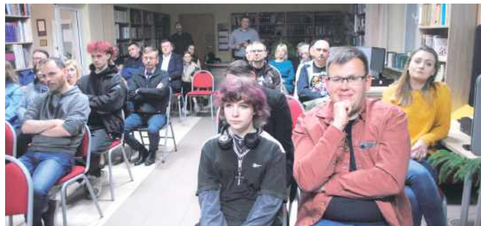
Publiczność na spotkaniu z autorem książki „Porozmawiajmy o muzyce”