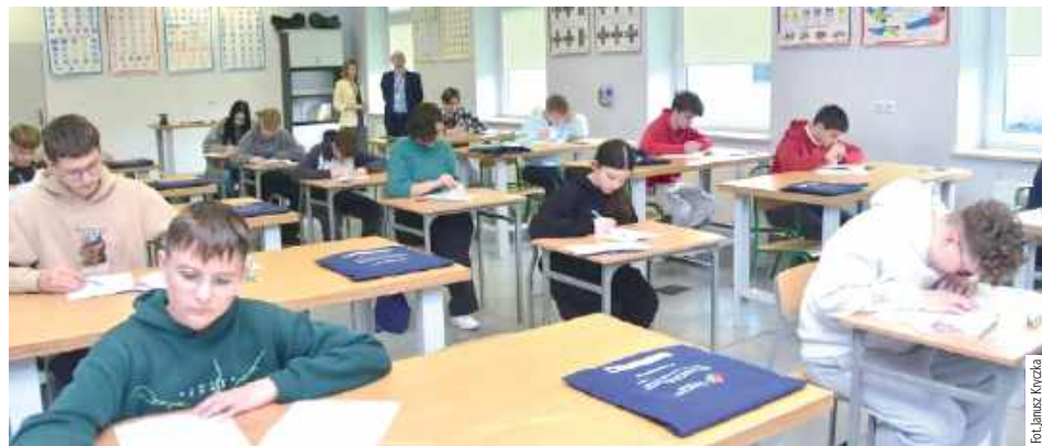
Uczniowie rywalizowali w dwóch kategoriach – szkoły podstawowe (klasy VII i VIII) oraz szkoły średnie, kształcące w zawodach związanych z branżą obróbki metali

Konkursowi towarzyszyły warsztaty dla uczniów klas 7 i 8 szkół podstawowych, na których mieli okazję zgłębić tajniki mechaniki, fizyki, elektryki i mechatroniki w prak-