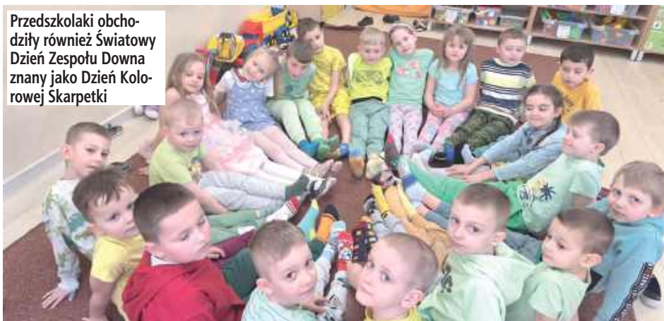
Przedszkolaki obchodzą również Świątowy Dzień Zespołu Downa znany jako Dzień Kolorowej Skarpetki

W Przedszkolu w Dębownicy uroczyste powitano Pierwszy Dzień Wiosny. Dzieci wzięły udział w wiosennym korowodzie, maszerując wokół przedszkola. Zimą pożegnano muzycznym akcentem, a wspólna zabawa stała się okazją do świętowania nadejścia cieplejszych dni.