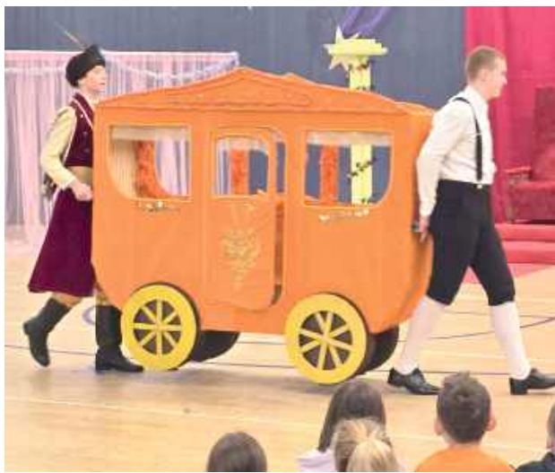
mo W bajce nie mogła zabraknąć karocy z dyni - ta była świetna!