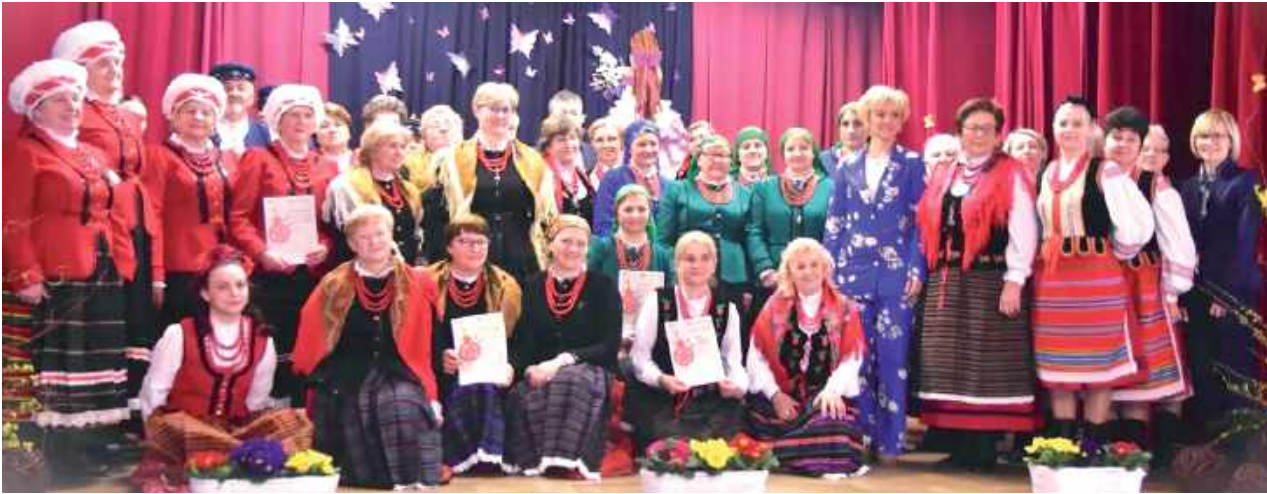
Międzypowiatowy Przegląd Kapel i Śpiewaków Ludowych w Stoczku Łukowskim

W Stoczku Łukowskim spotkały się zespoły ludowe.