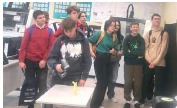
Uczniowie samodzielnie tworzyli cyfrowe modele przy użyciu skanera 3D

tyczny sposób. Samodzielnie tworzyli cyfrowe modele przy użyciu skanera 3D, uczyli się sterowania obrabiarkami CNC, programowali ruchy robota przemysłowego oraz montowali układy elektropneumatyczne.