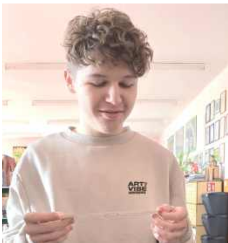
W bibliotece pojawił się także słój z cytatami znanych ludzi o poezji i jej znaczeniu w życiu - można było losować i zabrać je ze sobą na pamiątkę

21 marca w bibliotece szkolnej lukowskich Alej świętowano podwójnie - nadejście wiosny oraz Świątowy Dzień Poezji. To wyjątkowe połączenie przyniosło wiele atrakcji, które pozwoliły uczniom odkrywać poezję w różnych formach i eksperymentować ze słowem. Na czytelników czekała wystawa tomików poezji. Każdy mógł wybrać wiersz, wyrecytować go na głos i w nagrodę otrzymać słodkiego pierniczka oraz zakładkę - tym razem oczywiście poetycką.