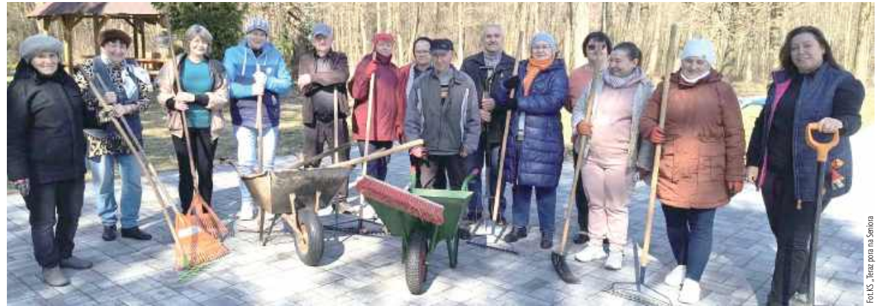
Seniorzy wzięli się za sprzątanie terenu wokół świetlicy wiejskiej

Pierwsze dni wiosny to czas porządków. Seniorzy z Klubu Seniora „Teraz pora na Seniora” w Klimkach postanowili zadbać o otoczenie swojej świetlicy wiejskiej.