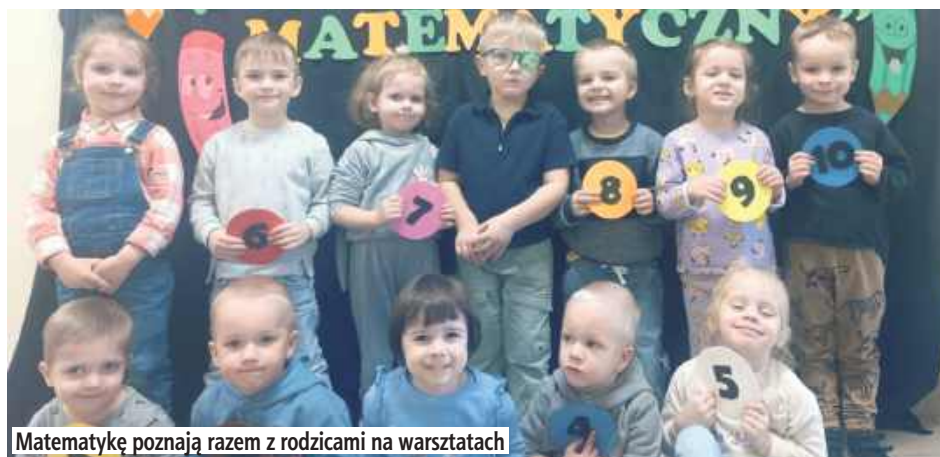
Matematykę poznają razem z rodzicami na warsztatach

GINA SEROKOMLA: W oddziałach przedszkolnych w Szkole Podstawowej w Krzówce realizowany jest projekt „D jak Detektyw Matematyczny”. Projekt został sfinansowany przez Fundację mBanku w ramach programu grantowego „Rosną z matematyką”.