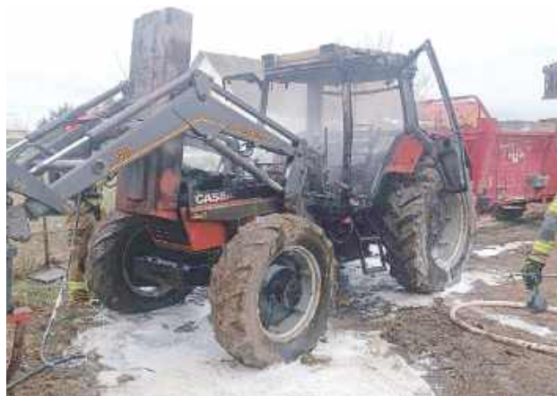
Maszyna została ugaszona pianą gaśniczą

Strażacy ugasiли ogień przy użyciu dwóch prądów ciężkiej piany. Dodatkowo maszynę