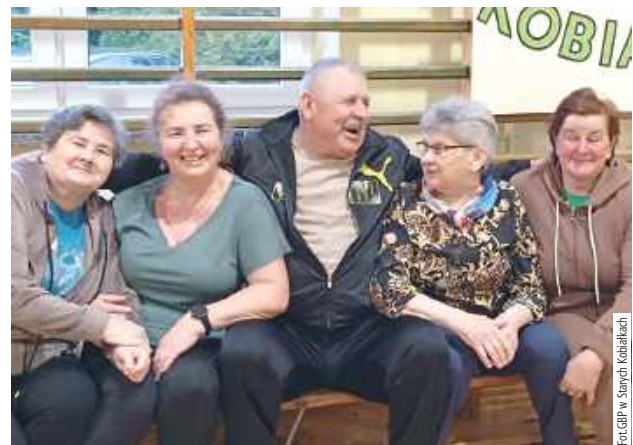
W Senioriadzie wzięli udział członkowie Klubu Seniora „Sami Swoi” ze Starych Kobiątek oraz „Ostoja” z Jedlanki

24 marca w Starych Kobiątkach odbyła się VII edycja Halowych Igrzysk dla Seniorów, czyli Senioriada Halowa 2025.