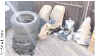
Dzięki zamontowanym kamerom zmniejszyła się liczba podrzucanych śmieci w pobliżu wiat śmietnikowych, a sprawcy wykroczeń przestali być anonimowi

W październiku ub.r. ŁSM w Łukowie rozpoczęła montaż nowoczesnego systemu monitoringu, który obejmuje blisko 40 kamer na osiedlach Chącińskiego i Klimeckiego.