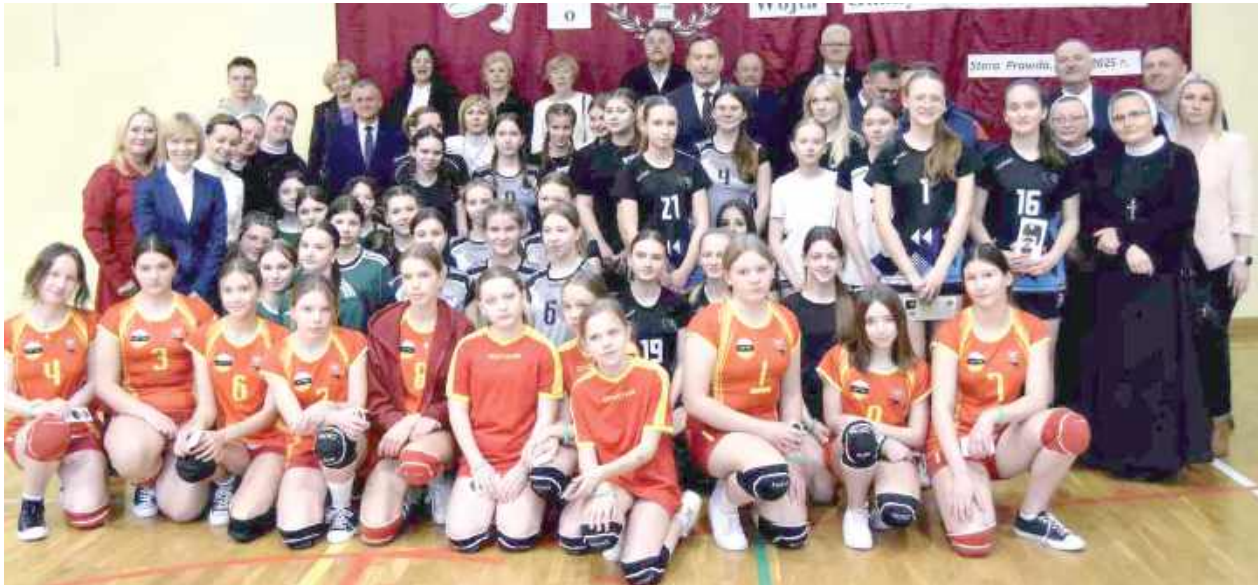
Tego samego dnia w Zespole Oświatowym w Starej Prawdzie został rozegrany X Turniej Finałowy Amatorskiej Piłki Siatkowej Dziewcząt im. Biskupa Adolfa Piotra Szelażka

W niedzielę, 23 marca w kościele parafialnym w Stoczku Łukowskim odprawiono mszę świętą o godz. 12 w intencji biskupa Adolfa Piotra Szelażka.