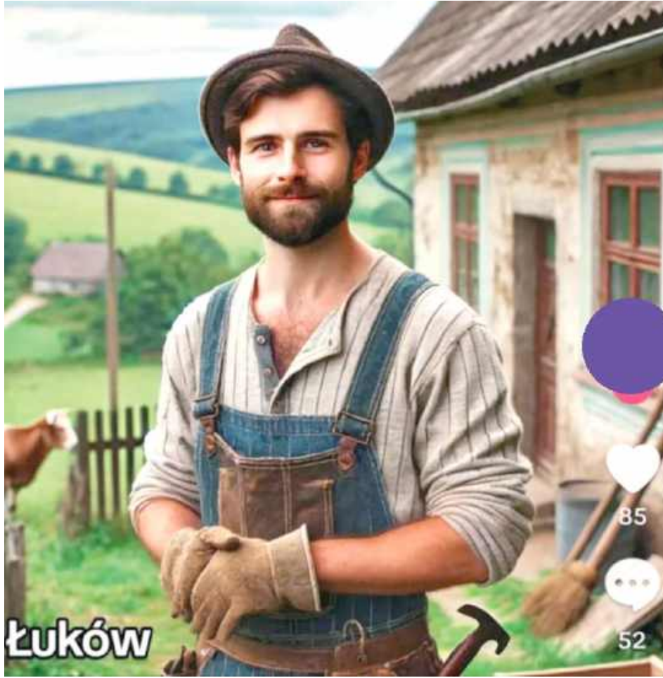
Oto jak sztuczna inteligencja widzi mieszkańców Łukowa

Chociaż trend cieszy się ogromnym zainteresowaniem, wywołuje również pewne kontrowersje. Niektórzy użytkownicy podchodzą do niego z dystansem, podkreślając, że AI może utrwalać stereotypy i upraszczać złożoność kulturową danego miejsca. Z drugiej strony wielu odbiorców z entuzjazmem komentuje efekty działania