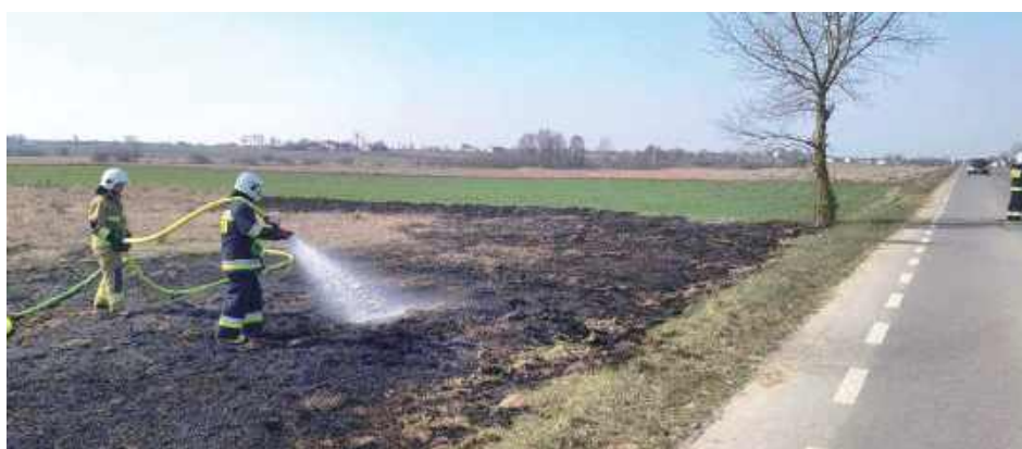
an Palące się nieużytki przy drodze powiatowej gasili strażacy z OSP Wola Okrzejska

Tego samego dnia o godz. 20.28 jednostka OSP Zgórnica wyjechała gasić pożar traw przy drodze wojewódzkiej nr 803, w pobliżu dawnych cegielni niedaleko Kołodziaża, gdzie pożar objął teren o powierzchni 3 arów.