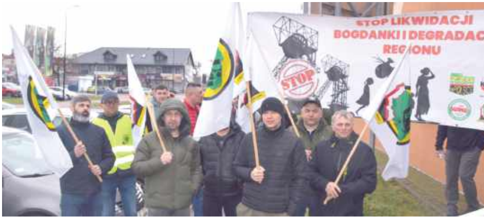
Bez górnictwa upadną inne branże, takie jak budowlanka, fryzjerstwo i wiele innych. - mówili górnicy pod budynkiem starostwa

W Łęcznej odbyło się inauguracyjne spotkanie zespołu ds. sprawiedliwej transformacji energetycznej, którego celem jest opracowanie planu przyszłości regionu w kontekście wygaszania kopalni i tworzenia nowych miejsc pracy. Członkowie rządu zapewnili, że Bogdanka spokojnie będzie fedrować jeszcze co najmniej 10-15 lat.