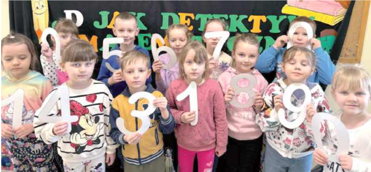
Najmłodszy mają szansę na odkrywanie matematycznego świata poprzez zabawę

GINA SEROKOMLA: W oddziałach przedszkolnych w Szkole Podstawowej w Krzówce realizowany jest projekt „D jak Detektyw Matematyczny”. Projekt został sfinansowany przez Fundację mBanku w ramach programu grantowego „Rosną z matematyką”.