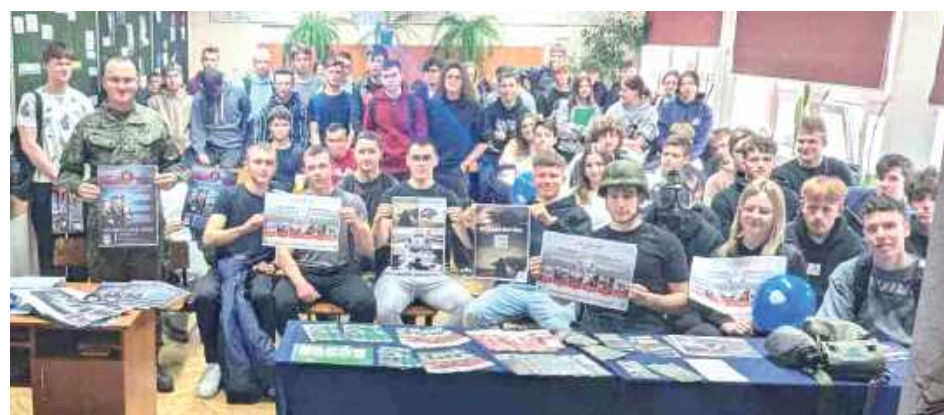
Młodzież dowiedziała się m.in., jak wygląda rekrutacja do uczelni wojskowych i szkół podoficerskich

W ramach projektu „Zawód Żołnierz” uczniowie IV Liceum Ogólnokształcącego im. Jana Pawła II w Łukowie mieli okazję spotkać się z przedstawicielem Wojskowego Centrum Rekrutacji z Białej Podlaskiej.