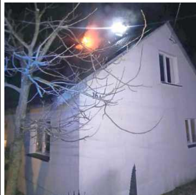
Pożar sadzy w kominie wybuchł 27 marca

W czwartek o godz. 18.27 do straży wpłynęło zgłoszenie o pożarze sadzy w przewodzie kominowym.