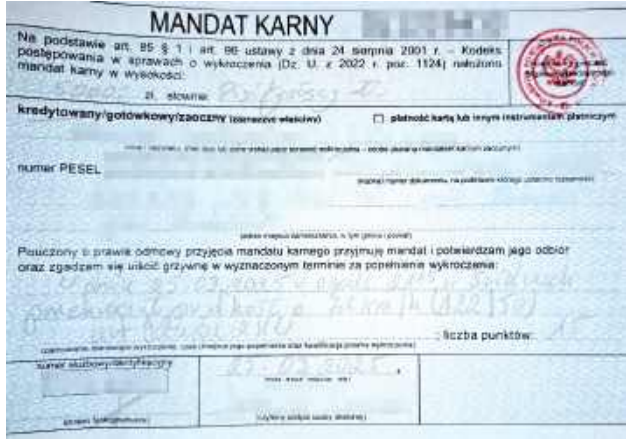
26-latkowi z gminy Adamów policjanci nałożyli mandat w „warunkach recydywy”. W jego przypadku wysokość mandatu wyniosła 5 tys. zł, dodatkowo mężczyzna otrzymał 15 pkt karnych

- Tuż przed godziną 21 kierującą osobówką 22-latek z gminy Trzebieszów o 73 km/h przekroczył dozwoloną w obszarze zabudowanym prędkość. Okazało się, że młody mężczyzna kilka dni temu zdał egzamin na prawo jazdy i jeszcze nie odebrał upragnionego dokumentu, a jadąc autem, korzystał z jego elektronicznej wersji. Oprócz 2500 zł mandatu, 15 punktów karnych