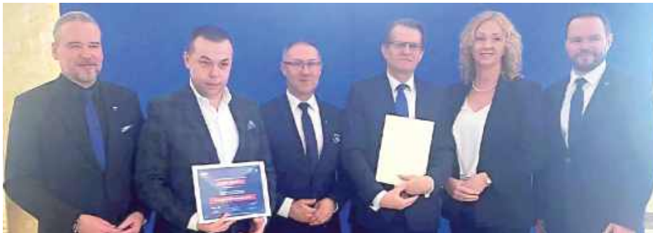
Inwestycja kosztować będzie 11 262 473,46 zł

W Lubelskim Urzędzie Wojewódzkim podpisano umowę na modernizację trasy Tuchowicz - Zagoździe.