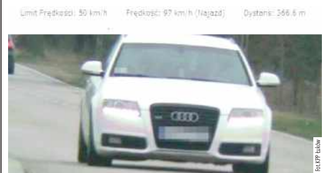
25-latek z małopolski został zatrzymany i trafił do zakładu karnego, gdzie „odsiedzi” zasądzoną karę pozbawienia wolności

Przekroczył prędkość i nie miał prawa jazdy, ale to nie wszystko – był poszukiwany za kradzieże.