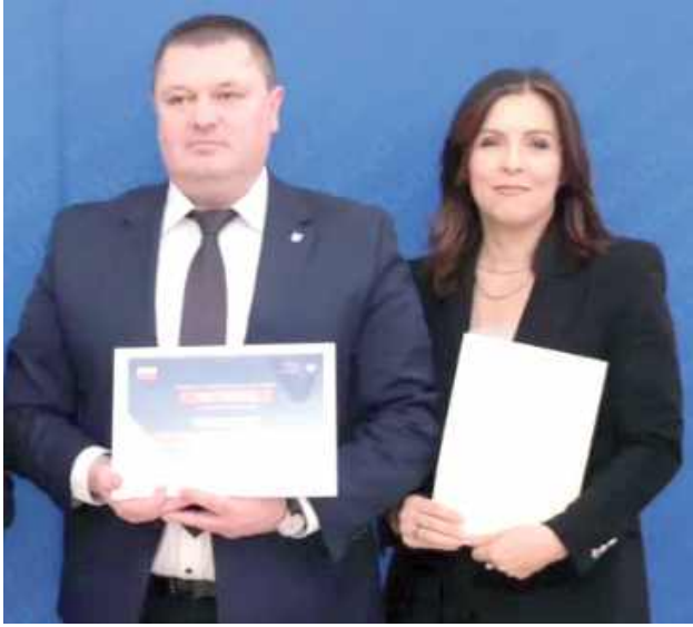
Umowa została podpisana we wtorek, 25 marca

Na terenie gminy Krzywda wkrótce rozpoczną się prace budowlane na drodze gminnej w Feliksynie.