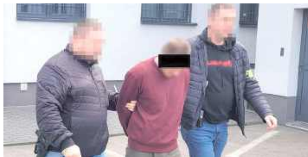
Co najmniej trzy najbliższe miesiące 39-latek spędzi w areszcie tymczasowym

- Kierujący autem 39-latek z gminy Trzebieszów i jego 20-letnia pasażerka zachowywały się nerwowo, sprawiali wrażenie, że chcą, by jak najszybciej zakończyć kontrolę. Bardzo szybko okazało się dlaczego.