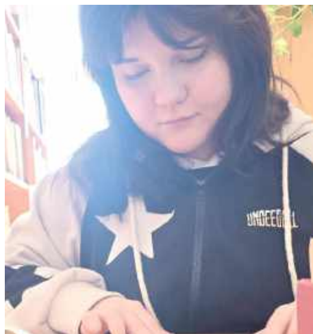
Każdy mógł także wykonać własną poetycką zakładkę lub pokolorować gotowe szablony (zakładkowa wystawa wkrótce). Dzięki temu powstało wiele unikalnych prac, które łączyły literaturę z plastyką

Przez cały dzień w bibliotece rozbrzmiewała poezja śpiewana - od klasycznych utworów m.in. Marka Grechuty, Ewy Demarczyk po współczesne interpretacje Sanah oraz hip-hopowe teksty.