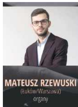
Plakat, Festiwal Muzyki Organowej i Kameralnej 2025

Męski Zespół Muzyki Cerkiewnej „Ikos” specjalizuje się w wykonywaniu sakralnych kompozycji wielogłosowych, chorału gregoriańskiego oraz dawnego śpiewu cerkiewnego.