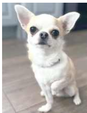
Cookie (Kuki), Inez Sekuła, Radzyń Podlaski