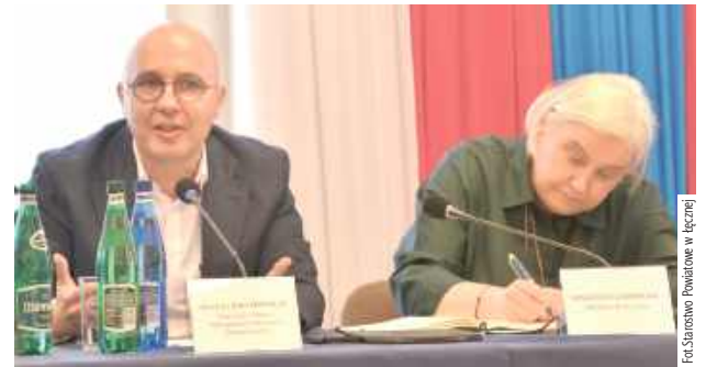
- Uważam, że perspektywa 10-15 lat wydobycia w Bogdancie jest absolutnie bezpieczna - powiedział wiceminister aktywów państwowych Robert Kropiwnicki. - Celem zespołu jest tworzenie alternatywnych miejsc pracy, m.in. w logistyce i przemyśle dual-use - dodała minister przemysłu Marzena Czarnecka