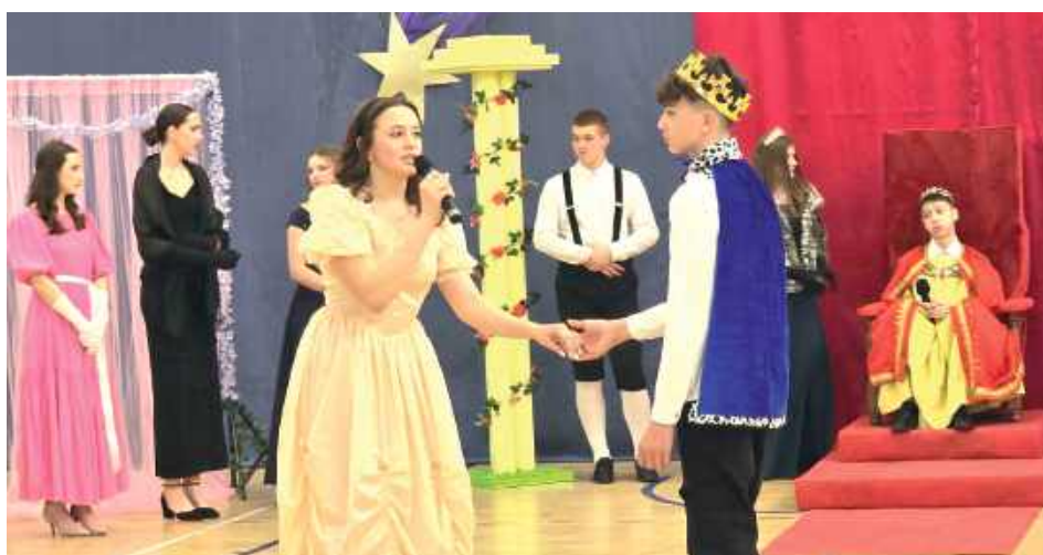
Szczśliwe zakończenie i taniec Kopciuszka z Księżciem