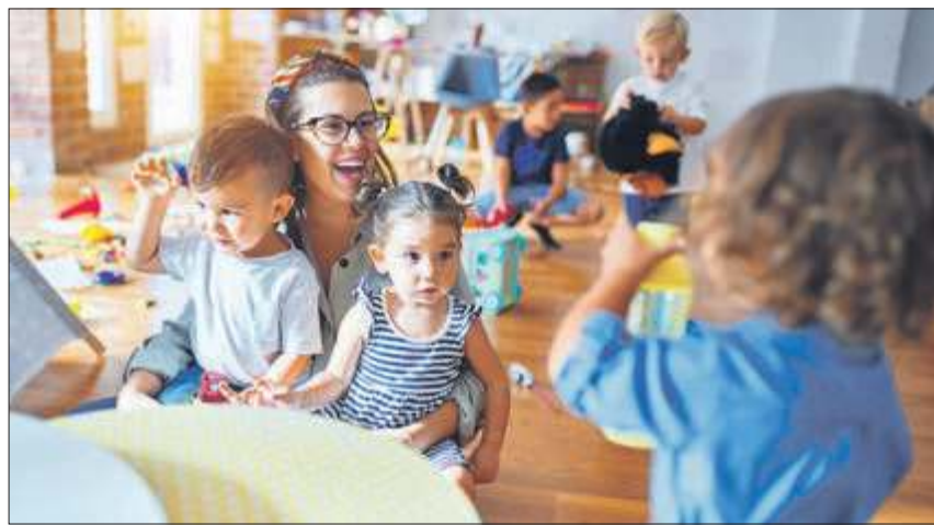
Konsultacje projektu podstawy programowej dla przedszkoli zakończyły się 18 grudnia