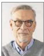
Jacek Żakowski dziennikarz i publicysta

Podaruję apel Strajku Kobiet z ubiegłego tygodnia, bo przeszedł praktycznie bez echa. A zasługuje nie tylko na odpowiedź rządu, ale też na chwilę namysłu.