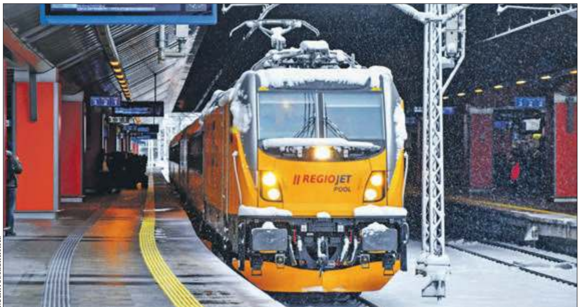
RegioJet dostał miejsce w rozkładzie, ale weryfikacja, czy ma odpowiedni tabor i pracowników, nie była potrzebna

Spółce RegioJet nie udało się też zrealizować zapowiedzi uruchomienia w styczniu dodatkowych połączeń z Warszawy do Krakowa i Trój-