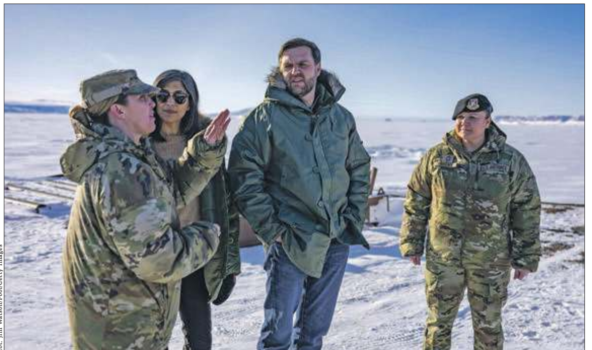
Wiceprezydent USA J.D. Vance w amerykańskiej bazie Pituffik na Grenlandii, marzec 2025 r.

Do zdobycia niepodległości nie wystarczyłoby jedynie wygrane referendum. Potem trzeba by wynegocjować porozumienie, które musiałyby zatwierdzić władze w Nuuk i Kopenhagie. Według Reutersa amerykańscy urzędnicy w ostatnim czasie rozważali szereg działań, które miałyby zmotywować mieszkańców wyspy do starań o suwerenność. Wśród nich znalazła się możliwość przyznawania Grenlandczynom jednorazowych wypłat w ramach próby przekonania ich do secesji z Danii i ewentualnego przyłączenia do USA. Przedstawiciele administracji omawiali kwoty rzędu