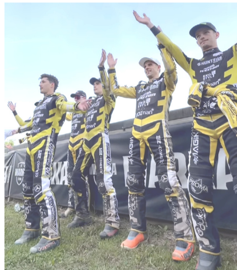
Drużyna PSŻ Poznań dziękuje swoim kibicom za doping.

dwie kolejne jednostki napędowe dla swojego podopiecznego. - W pierwszym biegu Chmiel musiał gonić Berge, ale wprowadzamy zmiany i w kolejnych biegach powinno być jeszcze lepiej. Cieszę się, że mogą go wspomagać w parkingu, współpracuje mi się z nim bardzo dobrze i mam nadzieję, że nasza współpraca będzie się układać nie tylko w dzisiejszym meczu, ale również w dalszej fazie sezonu - mówił przed kamerami.