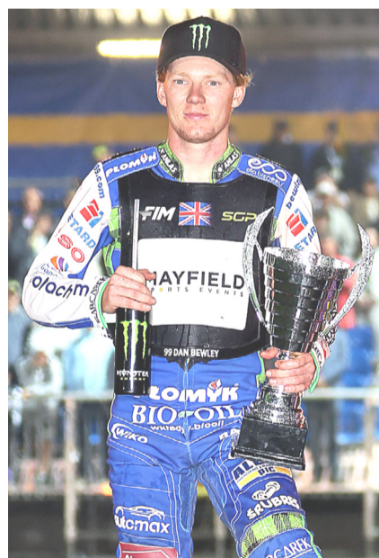
Jeszcze kilka dni temu wydawało się, że Brytyjczyk wchodzi właśnie w najlepszy moment swojej kariery. Teraz najważniejsza pozostaje jednak walka o zdrowie i powrót do sprawności.