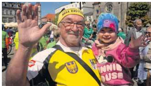
Rajd połączył pokolenia

Uczestnicy zebrał się na tarnogórskim rynku, gdzie w południe wspólnie odśpiewano hymn państwowy i uroczystie podniesiono flagę na maszt. Wydarzeniu towarzyszyła podniosła, ale jednocześnie rodzinna atmosfera.