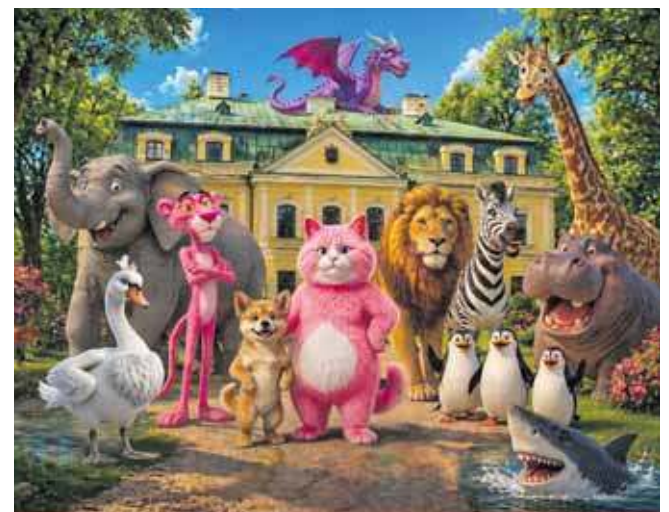
Rybna dzieciom w Dniu Dziecka