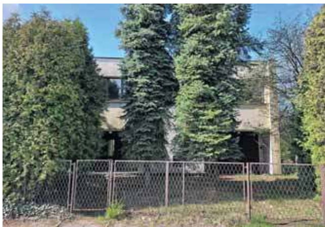
Podczas ostatniej sesji radni zgodzili się na sprzedaż domu jednorodzinnego w Strzybnicy

– Ta kamienica nie znalazła się w takim stanie w ciągu roku. Miasto zarządza nią od wielu lat – podkreślał.