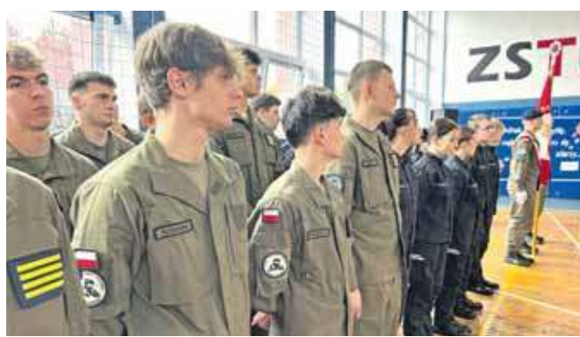
Zakończenie roku szkolnego klas mundurowych ma zawsze wyjątkowy charakter

Uroczystość miała wyjątkowy charakter i przebiegała