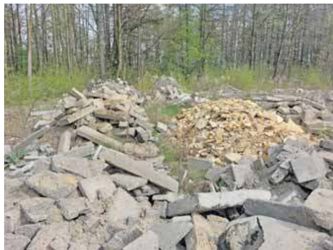
Teren jest bardzo zaśmiecony, a wszystko jest niedaleko hałdy popłuczkowej

Za hałdą popłuczkową w Tarnowskich Górach natknęliśmy się na wysypisko gruzu i innych odpadów. Dobrze to nie wygląda.