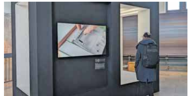
Wystawa będzie prezentowana w Dworcu Kultury w Tarnowskich Górach, instytucji mieszczącej się na piętrze zabytkowego budynku dworca kolejowego