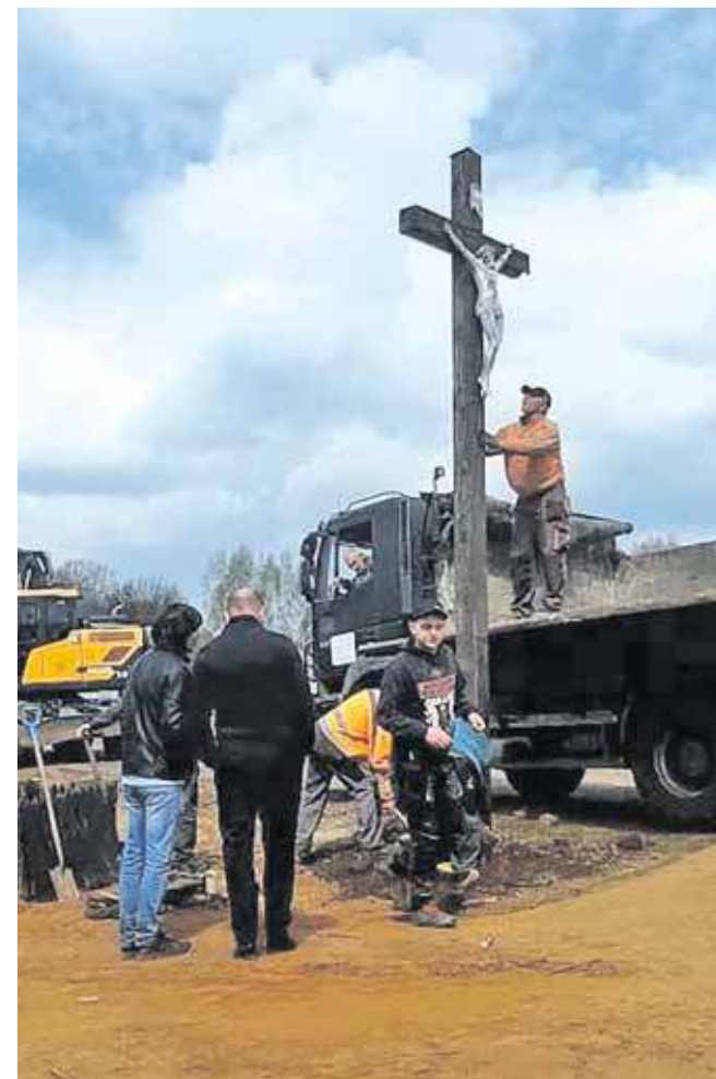
Po zakończeniu renowacji krzyż wróci w tę samą okolicę