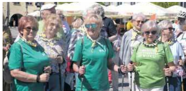
Miłośnicy nordic walkingu gotowi do startu

Ponad 50 rowerzystów oraz około 40 uczestników nordic walkingu wyruszyło w sobotę na trasę rajdu z okazji Dnia Flagi. Wydarzenie zorganizował Uniwersytet Trzeciego Wieku w Tarnowskich Górach.