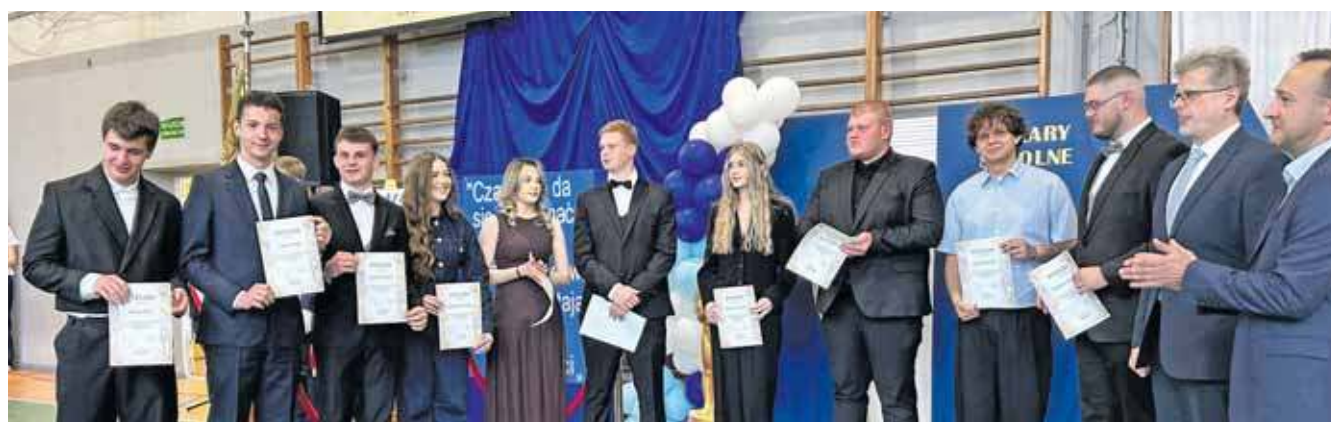
To już ostatnie chwile w murach Budowlanki