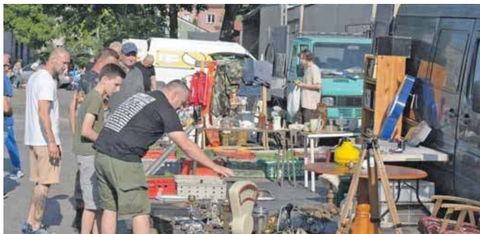
W ubiegłych latach Pchli Targ odbywał się na parkingu za urzędem przy ul. Sieniewicza

Drugi problem dotyczył braku miejsca dla Tarnogórzan. „Na miejscu wszystko pozostawiane straganami osób, które na co dzień zajmują się handlem obwoź-