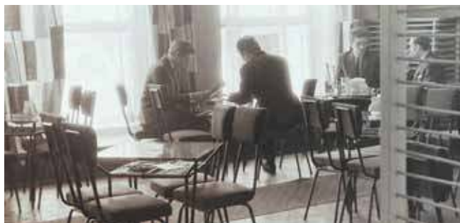
Czas na lekturę i rozmowy przy kawiarnianym stoliku