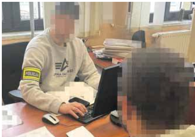
Mężczyzna usłyszał ponad 270 zarzutów oszustwa, do których się przyznał

Policjanci ze Zbrostawic zakończyli śledztwo dotyczące serii oszustw na stacji paliw w Wieszowie. Do sądu trafił akt oskarżenia przeciwko 24-letniemu mieszkańcowi Tarnowskich Gór, który usłyszał ponad 270 zarzutów oszustwa. Grozi mu kara do 8 lat więzienia.