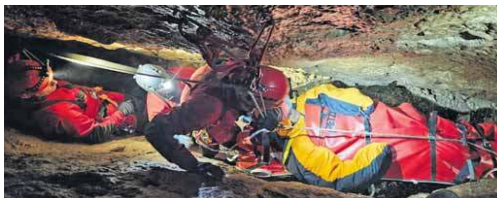
Scenariusz zakładał dwa wypadki w jaskiniach

Specjalistyczna Grupa Ratownictwa Wysokościowego JRG Radzionków wzięła udział w ćwiczeniach z ratownictwa jaskiniowego na Jurze Krakowsko-Częstochowskiej, razem z Grupą Jurajską GOPR oraz KP PSP w Myszkowie.