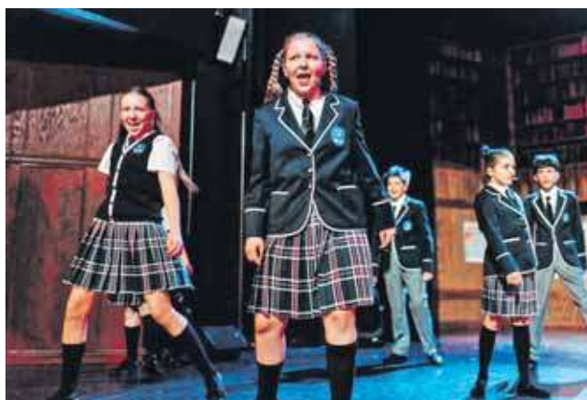
Marzenie o scenie pojawiło się bardzo wcześnie i z czasem stało się planem na życie