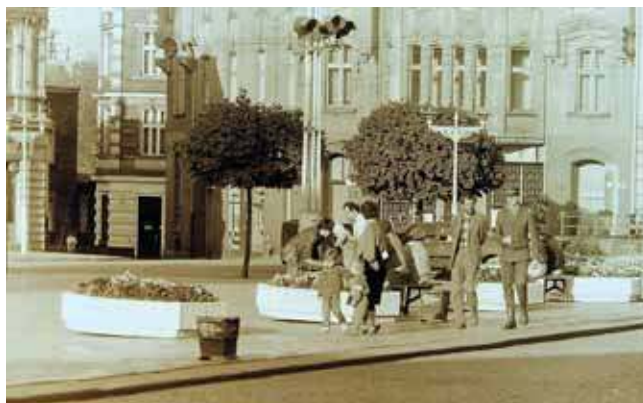
Na tarnogórskim rynku

Podzielcie się wspomnieniami z tych czasów. A może ktoś rozpoznaje na zdjęciach siebie albo kogoś z rodziny? Można do nas pisać na adres a.reczkin@gwarek.com.pl.