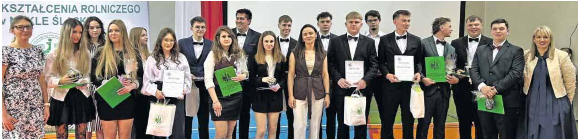
Nie zabrakło wyróżnień dla najlepszych absolwentów

Nietypowy wjazd, ważne słowa i wyróżnienia dla najlepszych – tak wyglądało zakończenie nauki klas technikum w Zespole Szkół Centrum Kształcenia Rolniczego w Nakle Śląskim. Część maturzystów przyjechała na uroczystość traktorami , nawiązując już do tradycji szkoły i wybranych kierunków kształcenia.