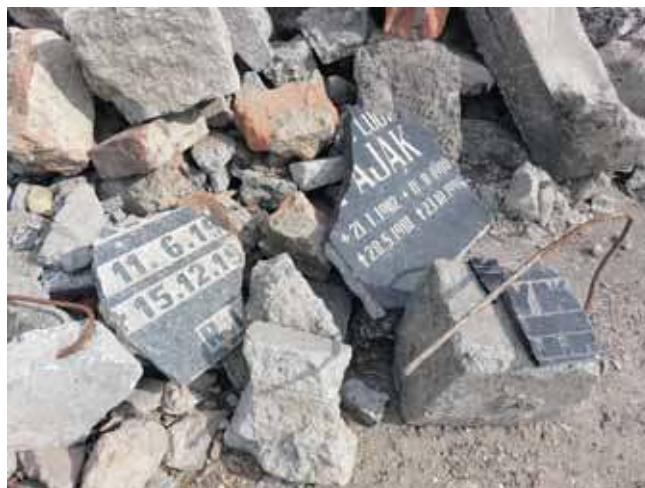
Wśród odpadów są nawet nagrobne płyty

– Jednak nie jest to miejsce składowania i magazynowania odpadów. Już dwa razy nakazaliśmy właścicielowi, by – zgodnie z ustawą o odpadach – usunął je z działki – informuje Ewa Kulisz, rzeczniczka prasowa urzędu