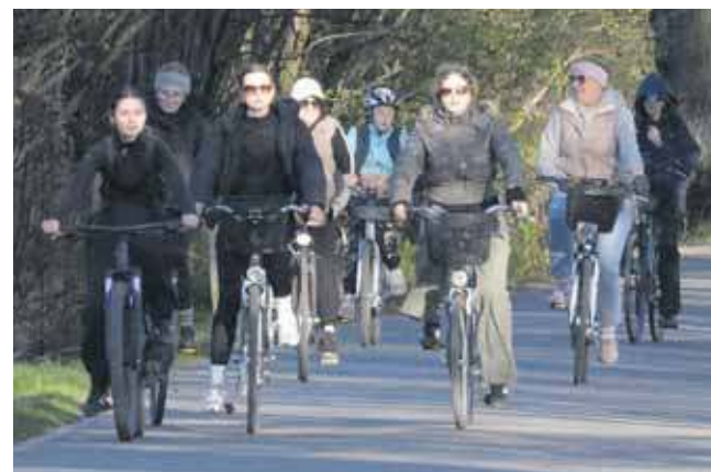
Uczestników nie zniechęciła wietrzna i chłodna pogoda

nie prowadzona przez Koło Łowieckie Kania, przyciągała miłośników przyrody i kuchni regionalnej. Na odwiedzających czekała wystawa zwierząt leśnych oraz degustacja potraw z dziczyzny. W Stacji Donnersmarcka dużą popularnością cieszyło się stoisko Nadleśnictwa Świerkianiec, gdzie oprócz sadzonek przygotowano „leśne koło fortuny”. Rajzowicze mogli także skorzystać z szybkiego serwisu rowerowego „Pit Stop”. W stacji w Truszczyca na uczestników czekał symula-