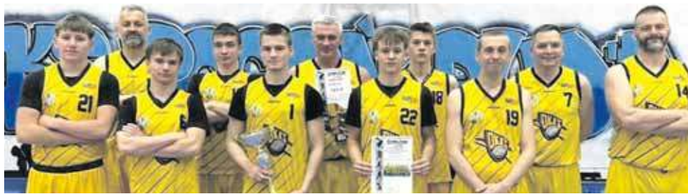
OKKS z Orzecha awansował do I ligi RALK

– To było spotkanie, które trzymało w napięciu do ostatnich sekund i pokazało prawdziwy charakter naszej drużyny. Ogromne brawa dla całego zespołu za walkę, determinację i serce zostawione na parkiecie. Dziękujemy wszystkim kibicom za wsparcie i fanta-