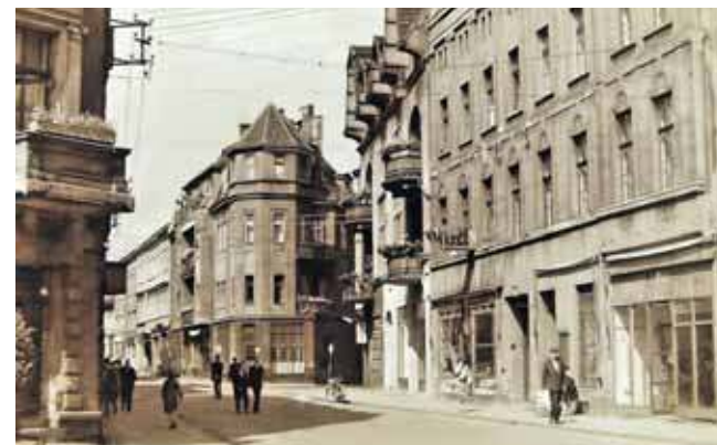
Na ul. Krakowskiej