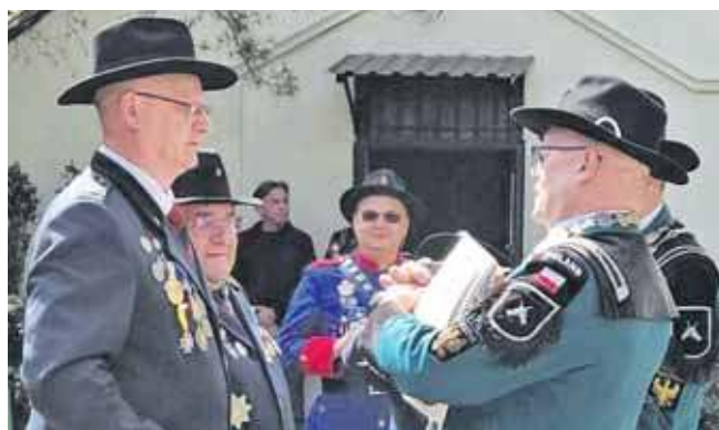
Podczas oficjalnego otwarcia turnieju wręczono prestiżowe odznaczenia dla zasłużonych członków tarnogórskiego bractwa

Na strzelnicy Kurkowego Bractwa Strzeleckiego w Tarnowskich Górach odbył się w sobotę, 25 kwietnia Turniej Otwarcia Sezonu Strzeleckiego Okręgu Śląskiego Zjednoczenie Kurkowych Bractw Strzeleckich RP. Wydarzenie to od lat należy do najważniejszych dorocznych spotkań środowiska brackiego w regionie i przyciąga uczestników z wielu miast Śląska i Opolszczyzny.