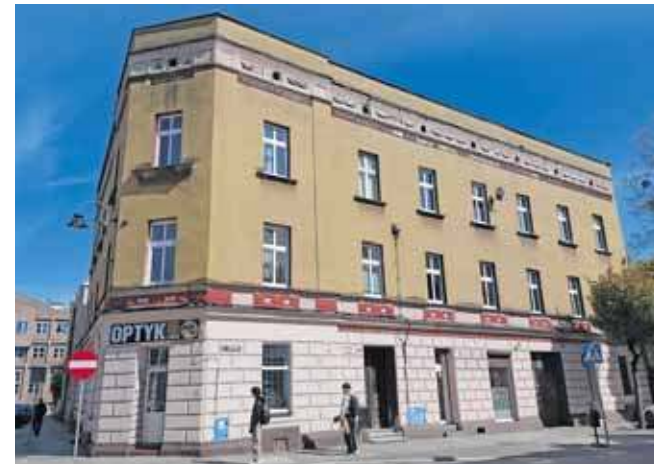
Budynek z 1885 roku reprezentuje styl neorenesansowy, jednak jego bogaty wystrój zachował się tylko częściowo. Dzięki planowanym pracom część detali zostanie odtworzona metodą odlewów

Wszystkie przyznane środki stanowią 25 proc. kosztów planowanych inwestycji. Wnioski były oceniane przez specjalną komisję powołaną przez burmistrza. Jak pod-