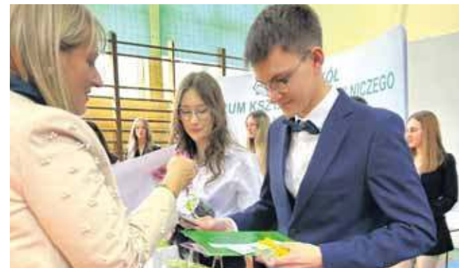
Teraz przed nimi matura

Uroczystość zakończyła się wręczeniem świadectw i wyróżnień. Teraz przed absolwentami egzamin maturalny.