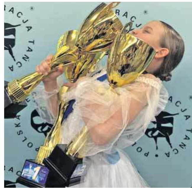
Ma 9 lat, a już jest multimedalistką

Mama tancerki wspomina, że kiedyś córka rano startowała w turnieju, który