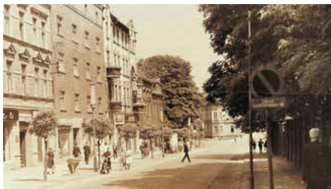
Ul. Piłsudskiego od strony Staszica wyglądała zupełnie inaczej niż dziś