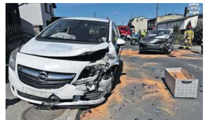
68-letni Tarnogórzanin skręcał na posesję i...

Postępowanie zostało zakończone, a akt oskarżenia skierowano do sądu. Teraz o dalszym losie mieszkańca Tarnowskich Gór zdecyduje wymiar sprawiedliwości. Zgodnie z obowiązującymi przepisami za oszustwo grozi mu kara nawet do 8 lat pozbawienia wolności. (MIR)