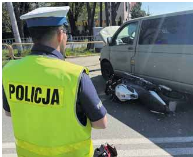
30-letni mieszkaniec Ptakowic, jadąc ulicą Korola w kierunku Bytomia, omijał motocyklem ciąg pojazdów oczekujących przed sygnalizacją świetlną na zmianę światła

Wtedy doszło do zderzenia. Kto jest winny? Wyjaśni to dochodzenie. Obrażen doznał motocyklista. Mężczyzna był przytomny, jednak ze względu na charakter zdarzenia i konieczność dalszej diagnostyki został przetransportowany śmigłowcem Lotniczego Pogotowia Ratunkowego do szpitala. (MIR)