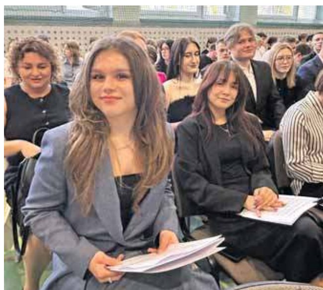
Duma i wzruszenie

W piątek, 24 kwietnia, odbyło się uroczyste zakończenie roku szkolnego klas maturalnych w Zespole Szkół Budowlano-Architektonicznych w Tarnowskich Górach. Podsumowanie pięciu lat nauki to nie tylko podziękowania,