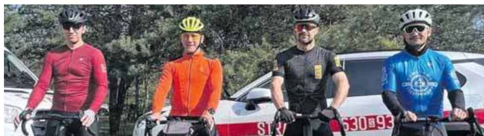
Silna ekipa tarnogórskich strażaków – kolarzy

– Lista startowa mówiła sama za siebie. Wiedziałem – łatwo nie będzie. Od początku mocne tempo. Kłęby kurzu, wysoka prędkość i zieleń budzącego się lasu. Szybko uformowała się ucieczka kilku zawodników, do której udało mi się dołączyć. Współpraca była