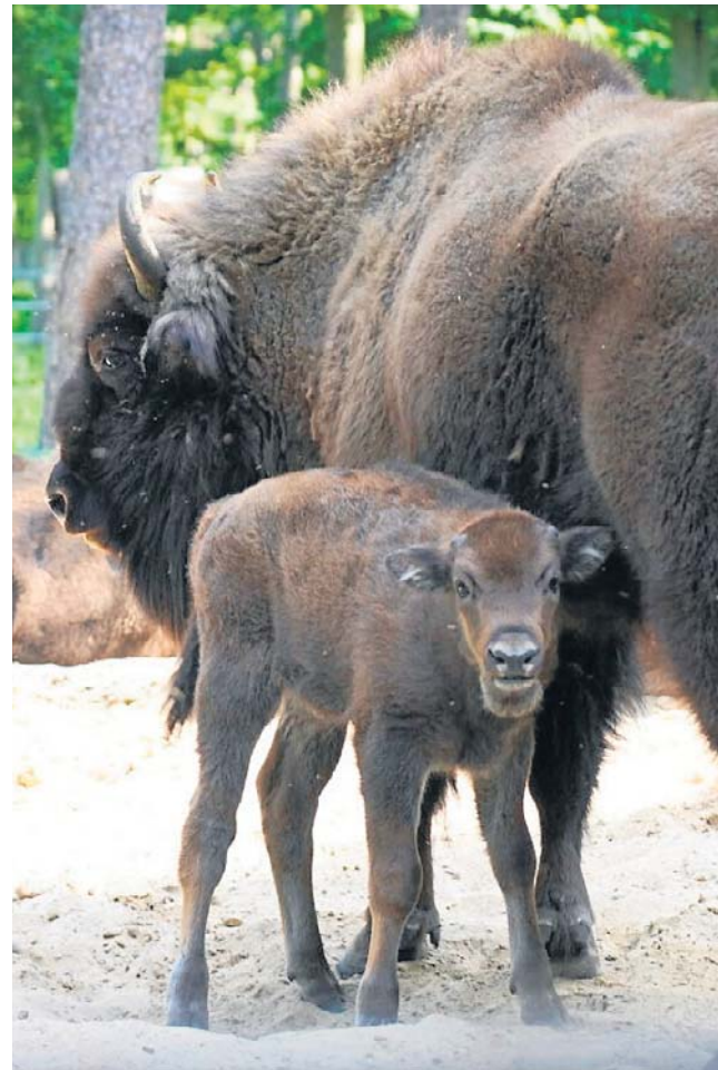
Tak wygląda miesięczne, jeszcze bezimienne żubrzątko. Jego przyszłe imię musi zaczynać się od „Po”

Chociaż opiekunowie starają się zapewnić rodzinie jak najwięcej spokoju, to widok miniaturowego „króla puszczy”, spacerującego po wybiegu już teraz przyciąga tłumy spacerowiczów z aparatami.