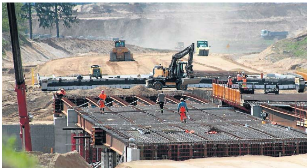
Budowa drogi S11 na odcinku Szczecinek – Piła ślimaczy się niemiłosiernie. Dlatego pojawiają się opinie, że ukończenie całej drogi przed 2030 r. będzie raczej niemożliwe

Podczas konferencji prasowej, jak informuje Polskie Radio Koszalin, odniósł się do odcinka prowadzącego ze Szczecinka do Piły, który np. na trasie z Piły do Jastrowia mierzy się z protestami i zawirowaniem wokół decyzji środowiskowej. Były premier ubolewał nad wstrzymanymi pracami i mówił o specjalnych rozwiązaniach ustawowych, które miałyby przyspieszyć inwestycję.