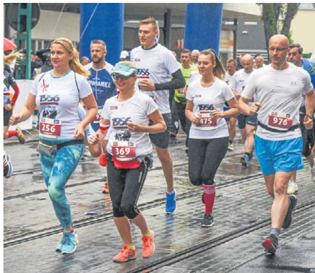
Bieg Poznańskiego Czerwca zawsze ma wyjątkowy charakter i swoją specyfikę. Nie inaczej będzie w niedzielę

Start i meta Biegu Czerwca '56 na terenie Zakładów H. Cegielski-Poznań S.A. to nie przypadek. To hołd oddany ludziom, którzy mieli odwagę powiedzieć „dość” - zapowiadają organizatorzy i namawiają biegaczy do nie ścigania się.