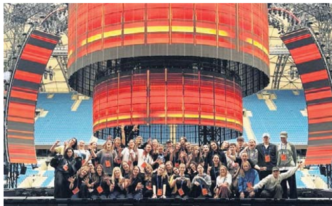
40 tancerzy z Poznania – od najmłodszej 13-letniej członkini grupy, po najstarszych – 35-latków

Wokalista wystąpił z 80. tancerzami, z czego połowę stanowili przedstawiciele poznańskiego Point Dance Studio