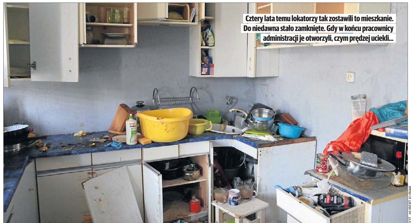
Cztery lata temu lokatorzy tak zostawili to mieszkanie. Do niedawna stało zamknięte. Gdy w końcu pracownicy administracji je otworzyli, czym prędzej uciekli...