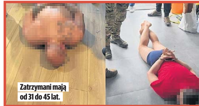
Zatrzymani mają od 31 do 45 lat.

Do zatrzymań mężczyzn w wieku od 31 do 45 lat, mieszkańców woj. mazowieckiego, doszło 16 czerwca. W działania zaangażowani byli policjanci Komendy Miejskiej Policji w Skierniewicach, wspierani przez funkcjonariuszy Komendy Wojewódzkiej Policji w Łodzi, Komendy Stołecznej Poli-