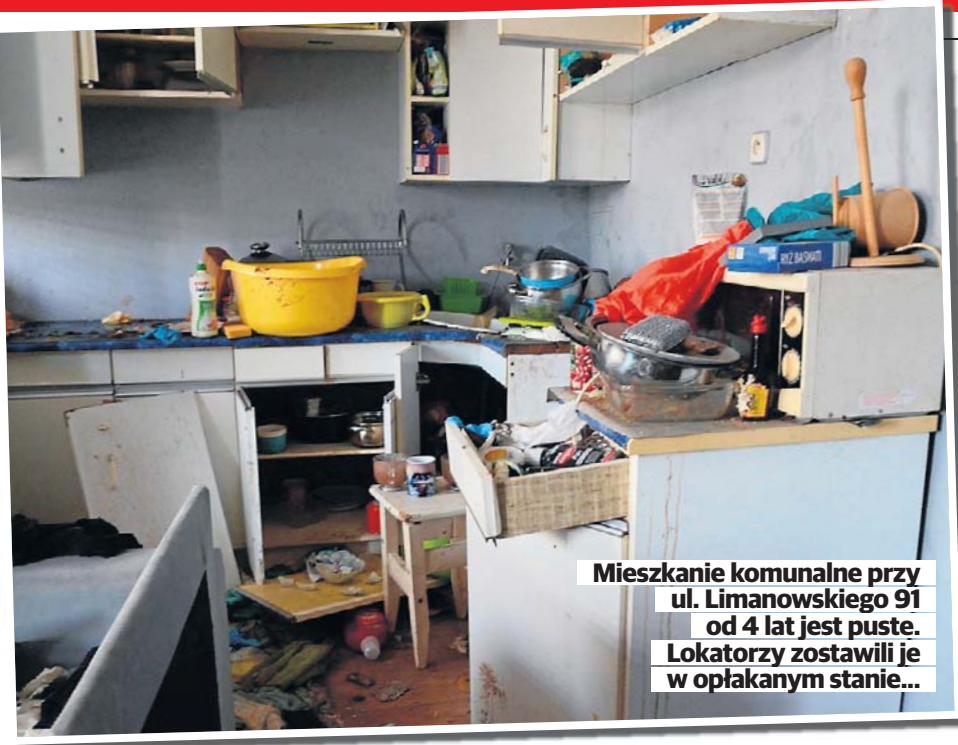
Mieszkanie komunalne przy ul. Limanowskiego 91 od 4 lat jest puste. Lokatorzy zostawili je w opłakanym stanie...