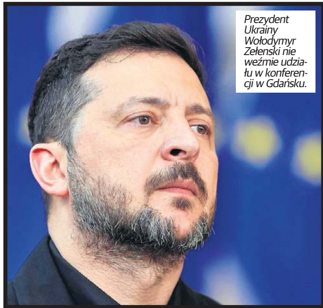
Prezydent Ukrainy Wołodymyr Zełenski nie weźmie udziału w konferencji w Gdańsku.

Swyrydenko oświadczyła, że zadaniem delegacji ukraińskiej w Gdańsku będzie osiągnięcie konkretnych porozumień, które „przyczynią się do zwiększenia zdolności obronnych i odporności Ukrainy oraz rozszerzą współpracę gospodarczą z partnerami”.