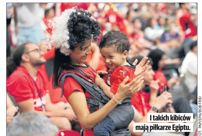
I takich kibiców mają piłkarze Egiptu.

Godz. 22: Ekwador - Niemcy (grupa E, New Jersey)