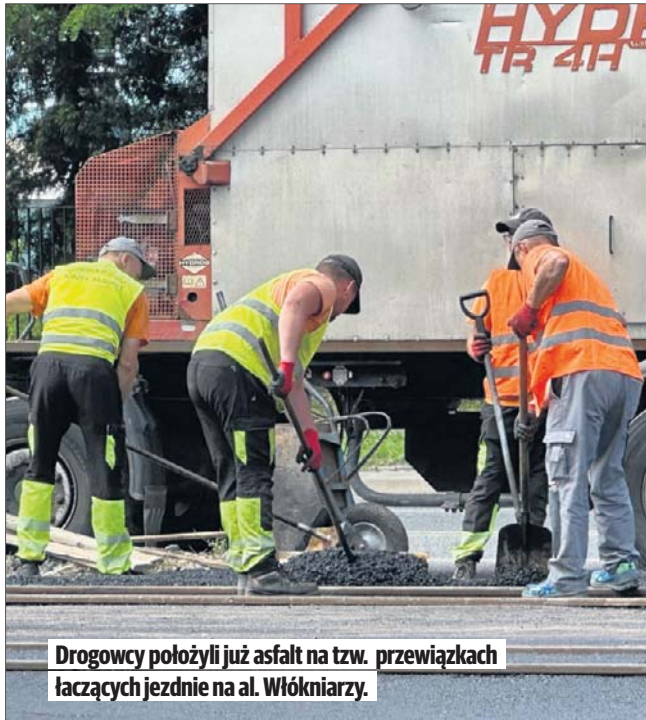
Drogowcy położyli już asfalt na tzw. przewiązkach łączących jezdnie na al. Włókniarzy.