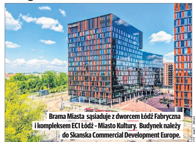
Brama Miasta sąsiaduje z dworcem Łódź Fabryczna i kompleksem EC1 Łódź - Miasto Kultury. Budynek należy do Skanska Commercial Development Europe.