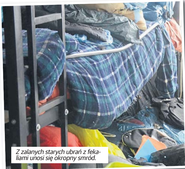
Z zalanych starych ubrań z fekaliami unosi się okropny smród.