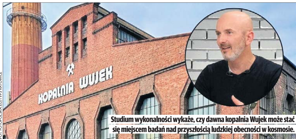
Studium wykonalności wykaże, czy dawna kopalnia Wujek może stać się miejscem badań nad przyszłością ludzkiej obecności w kosmosie.

Projekt roboczo nazywany jest Centrum Symulacji Osadnictwa Kosmicznego. Według koncepcji miałyby opierać się