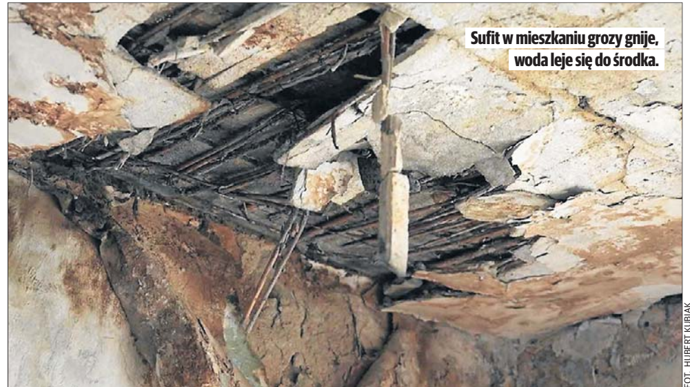
Sufit w mieszkaniu grozi gnije, woda leje się do środka.