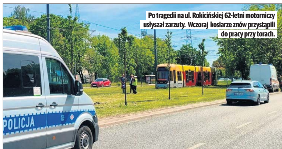
Po tragedii na ul. Rokicińskiej 62-letni motornicz usłyszał zarzuty. Wczoraj kosiarze znów przystąpili do pracy przy torach.

Zarzuty w zakresie spowodowania wypadku ze skutkiem śmiertelnym usłyszał 62-letni motornicz. Prokurator oczekuje na opinię biegłego z zakresu ruchu pojazdów oraz na wyniki sekcji zwłok.