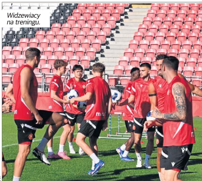
Widzewiacy na treningu.

Część piłkarzy Widzewa rozpoczęła przygotowania do nowego sezonu ekstraklasy. Kilku zawodników dostało dłuższy urlop ze względu na mecze reprezentacyjne.