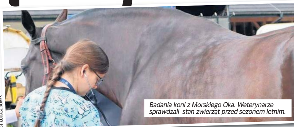
Badania koni z Morskiego Oka. Weterynarze sprawdzali stan zwierząt przed sezonem letnim.

Pierwszy etap badań odbywa się na Palenicy Białczańskiej, zanim konie podejmą pracę. Drugi jest na Polanie Włosienica, po pokonaniu przez konie całej trasy.