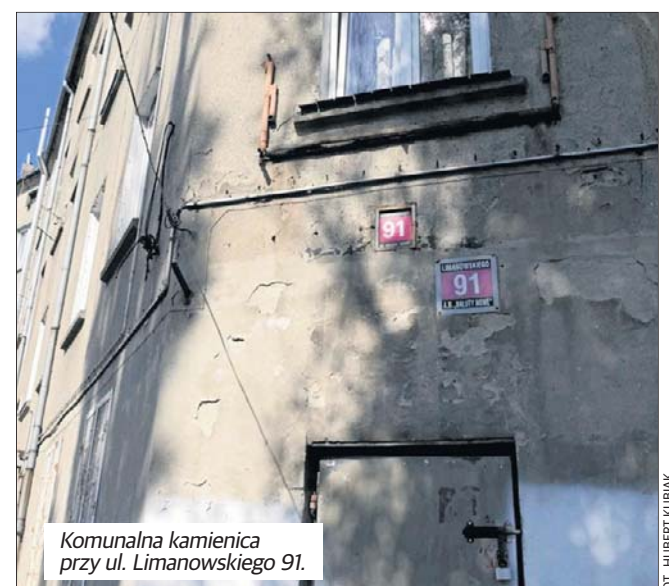
Komunalna kamienica przy ul. Limanowskiego 91.