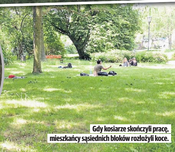
Gdy kosiarze skończyli pracę, mieszkańcy sąsiednich bloków rozłożyli koce.