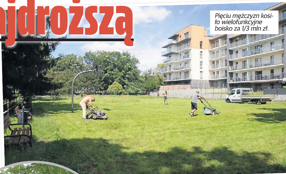
Pięciu mężczyzn kosiło wielofunkcyjne boisko za 1/3 mln zł.

Łodzianie wykorzystali fakt, że skoszone trawę na terenie całego parku - rozłożyli koce i wypoczywali w cieniu.