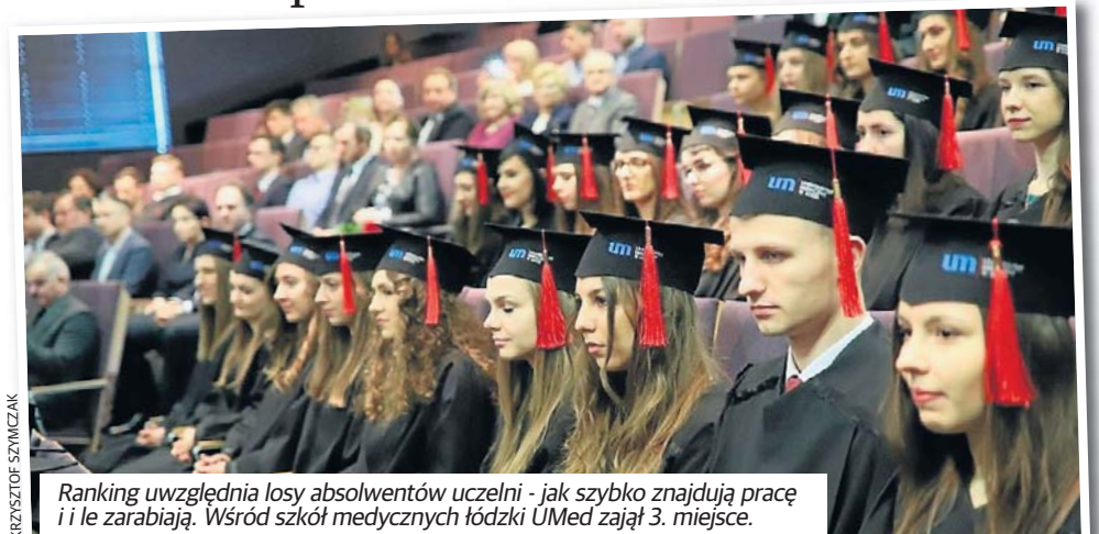
Ranking uwzględnia losy absolwentów uczelni - jak szybko znajdują pracę i ile zarabiają. Wśród szkół medycznych łódzki UMed zajął 3. miejsce.

W rankingu uczelni technicznych niezmiennie przoduje Politechnika Warszawska. Kolejne miejsca zajęły Akademia Górniczo-Hutnicza w Krakowie, Politechnika