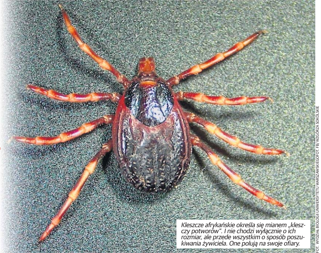
Kleszcze afrykańskie określa się mianem „kleszczy potworów”. I nie chodzi wyłącznie o ich rozmiar, ale przede wszystkim o sposób poszukiwania żywiciela. One polują na swoje ofiary.

Są większe od rodzimych gatunków, mają charakterystycznie prążkowane odnóża i nie czekają biernie na swoją ofiarę. Potrafią aktywnie ją śledzić, pokonując nawet kilkadziesiąt metrów. Afrykańskie kleszcze Hyalomma , nazywane przez media „kleszczami potworami”, zostały już odnotowane w Polsce.