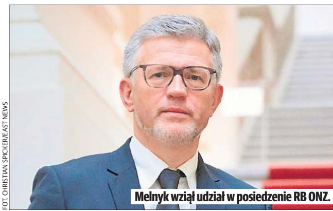
Melnyk wziął udział w posiedzeniu RB ONZ.

Uchwała o dymisji, zostanie przekazana prezydentowi Gitanasowi Nausiedzie. W ciągu 15 dni prezydent przedstawi kandydata na nowego premiera.