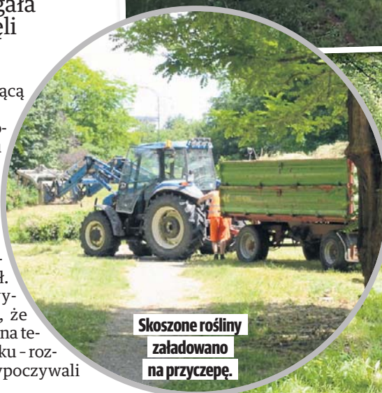
Skoszone rośliny załadowano na przyczepę.