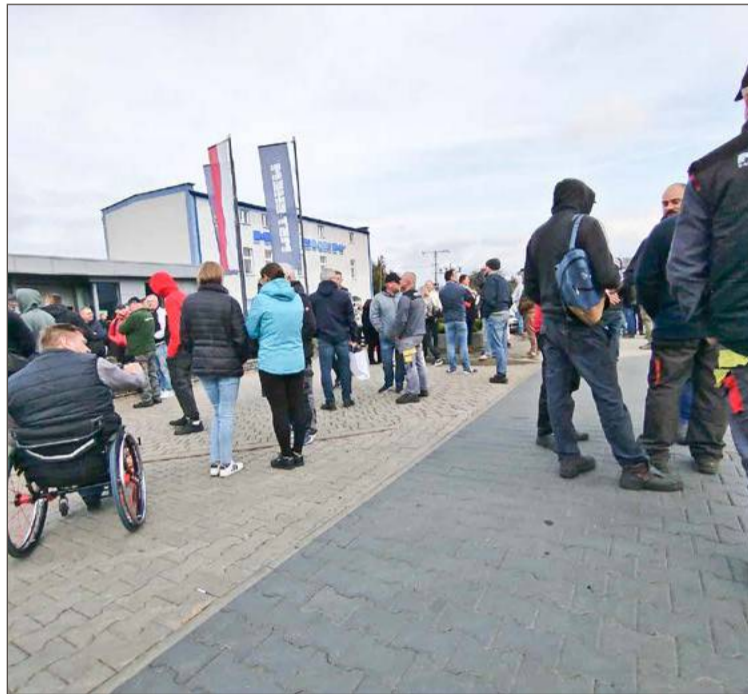
Akcja protestacyjna przyniosła efekt, a pieniądze zostały wypłacone.

Te słowa potwierdza nasz rozmówca, który również stwier-