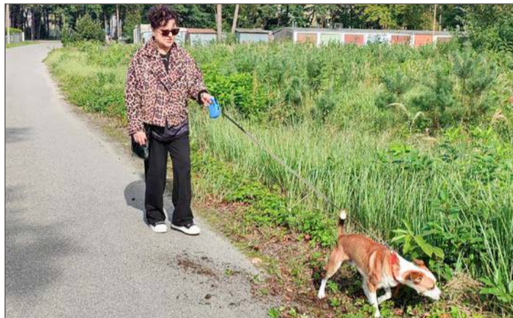
Opiekunka stara się zapewniać psu regularne spacer, ale czasami wybiera się na nie sam.

- Ale to są realne koszty. Psa trzeba wylapać, zabezpieczyć, zapewnić mu transport. Dlaczego inni mieszkańcy mają płacić za to, że ktoś nie potrafi upilnować swojego psa - zastanawia się starszy inspektor.