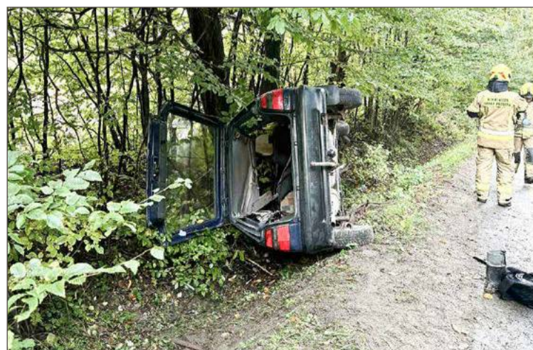
Samochód przewrócił się na lewy bok.