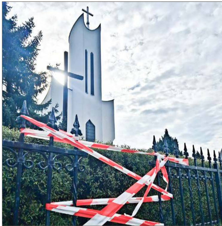
Kierującemu rowerem wręczony zostanie mandat na kwotę 2500 zł.

Po przyjeździe na miejsce patrolu policji okazało się, że 41-letni mieszkaniec Dębicy upadł tak niefortunnie, że ostry fragment niskiego ogrodzenia świątyni wbił się w jego głowę, unieruchamiając mężczyznę. Ściągnięcie go z ogrodzenia było w tej sytuacji niemożliwe, a na miejsce zostali wezwani strażacy z Jednostki Ratowniczo-Gaśniczej nr 1 Komendy Powiatowej Państwowej Straży Pożarnej z Dębicy.