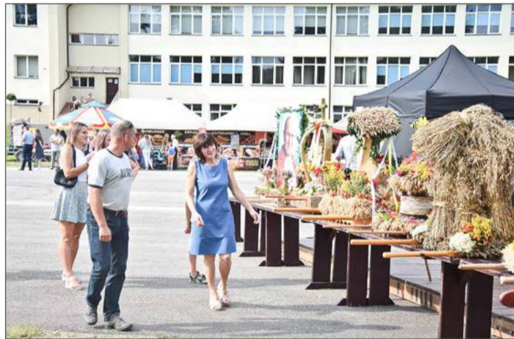
Święto plonów nadal będzie organizowane przy jodłowskim liceum.