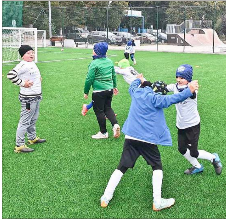
Orliki w całej gminie cieszą się popularnością. Teraz są jak nowe.

- W Pustkowie-Osiedlu i Nagawczynie nawierzchnie były już bardzo