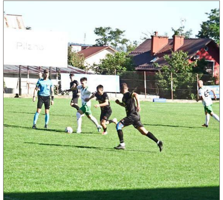
Legion (czarne koszulki) tym razem uległ rywalom.