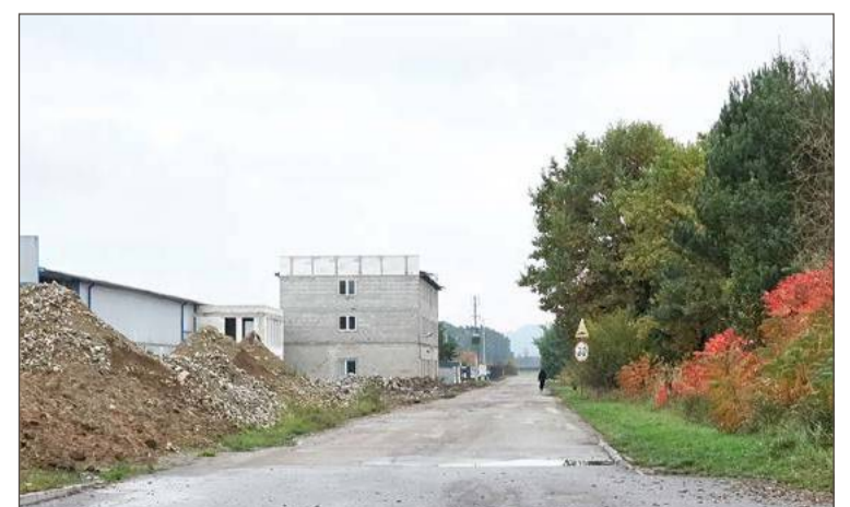
Droga prowadzi na teren strefy gospodarczej w Straszęcinie.