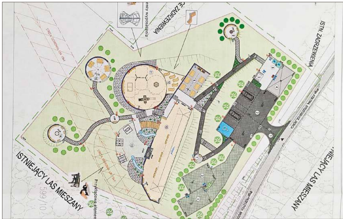
Jedno z Miejsc Obsługi Kamperów powstanie nad Wisłoką w Dęborzynie.

Gmina posiada tam około 40 arów ziemi, która ma zostać zagospodarowana. Powstanie plac zabaw i ścieżki rekreacyjne, ale nie tylko. W Dęborzynie zbudowany zostanie parking z siedmioma miejscami, w tym jedno dla osób niepełnosprawnych. Będą też dwa miejsca dedykowane dla kamperów wraz z miejscem, gdzie ich użytkownicy będą mogli zrzucić tzw. szarą wodę. W planach jest również budowa toalet, pojemników na odpady, wiata biesiadna z kominkiem na ok. 30 osób, miejsce na ognisko, piaskowa plaża