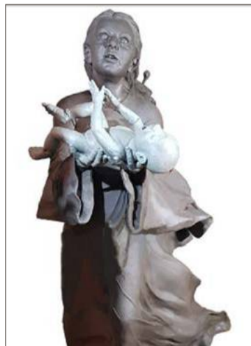
To będzie symboliczna uroczystość.

Imiona do Księgi Pamięci, która zostanie złożona w mogile, można przesłać przez formularz na stronie debica-dzieciutracone.pl. Można je też zapisać na kartkach dostępnych w kościele przed mszą św. Dotychczas zostało ich zapisanych 224.