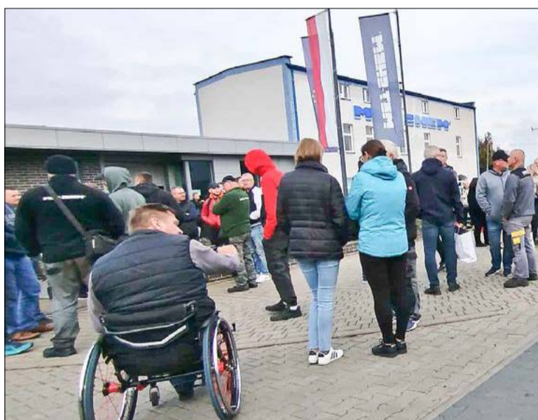
Strona 5 To była pierwsza taka akcja w historii zakładu.

Po tym, jak pracownicy zakładu zorganizowali akcję przed bramami fabryki pieniądze zostały wypłacone, ale obawiają się przyszłości. Dlatego próbują utworzyć związki zawodowe.