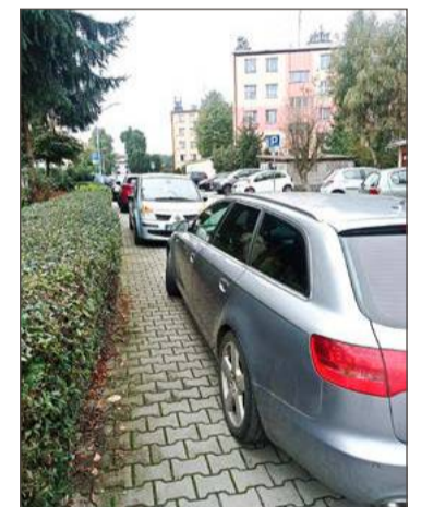
tra Auta parkują tam na chodnikach.

Burmistrz Mateusz Kutrzeba zapewnił radną, że możliwość takiego właśnie oznakowania osiedla zostanie przez urząd rozpatrzona. Na razie jednak nie określił terminu, w którym może dojść do wymiany oznakowania.