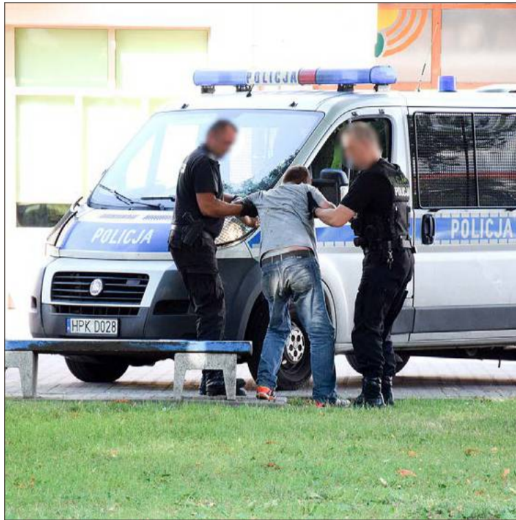
Taki widok na ulicach Dębicy niestety nie należy do rzadkości.

- Tam, przy budce trafo jest taka okrągła ławka i tam, jak zgłaszają panie z tego szeregowca, cały czas coś się dzieje. Jak nie uczyć się je-