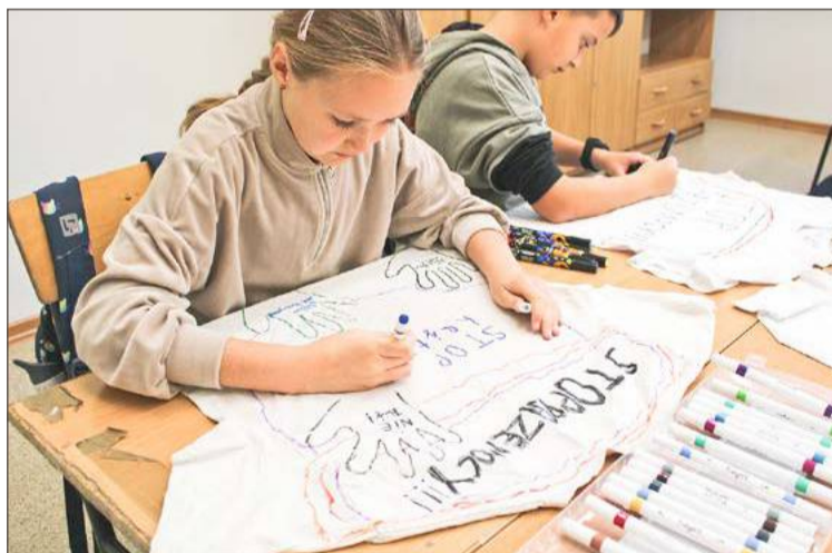
Każdy uczeń mógł zaprojektować i wykonać własną koszulkę.

mi. Młodzi ludzie i tak są uczuleni na godzinach wychowawczych i innych lekcjach, aby unikali agresji, szczególnie tej słownej. Bo ta boli często bardziej niż fizyczna.