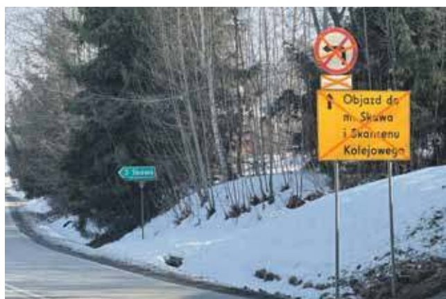
Zamknięcie drogi prowadzącej między innymi do Skansenu Taboru Kolejowego oraz do pobliskiej Skawy nastąpi pomiędzy 16 a 20 lutego.

Za kilka dni poważne utrudnienia drogowe w Chabówce – rozpoczyna się remont mostu na Rabie, a przeprawa będzie zamknięta.