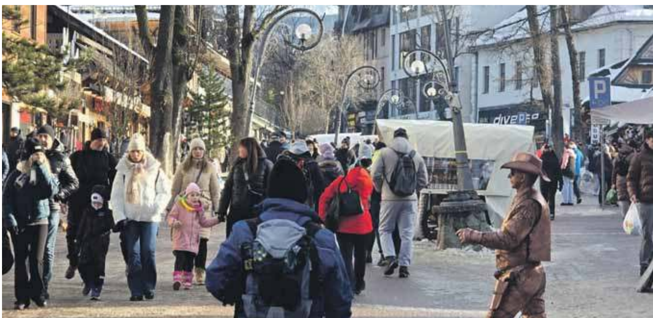
Na Krupówkach ruch umiarkowany.