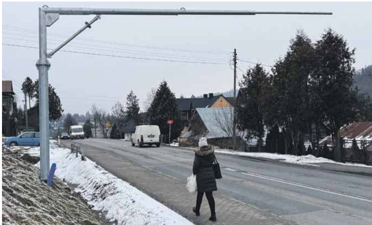
System zostanie uruchomiony najpóźniej pod koniec czerwca.