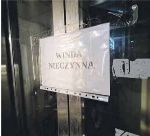
Winda nieczynna, w przejściu podziemnym w Zakopanem bez zmian.

Wymiana szybów windowych – przewiduje odbudowę szybów, przedsiónek i od-