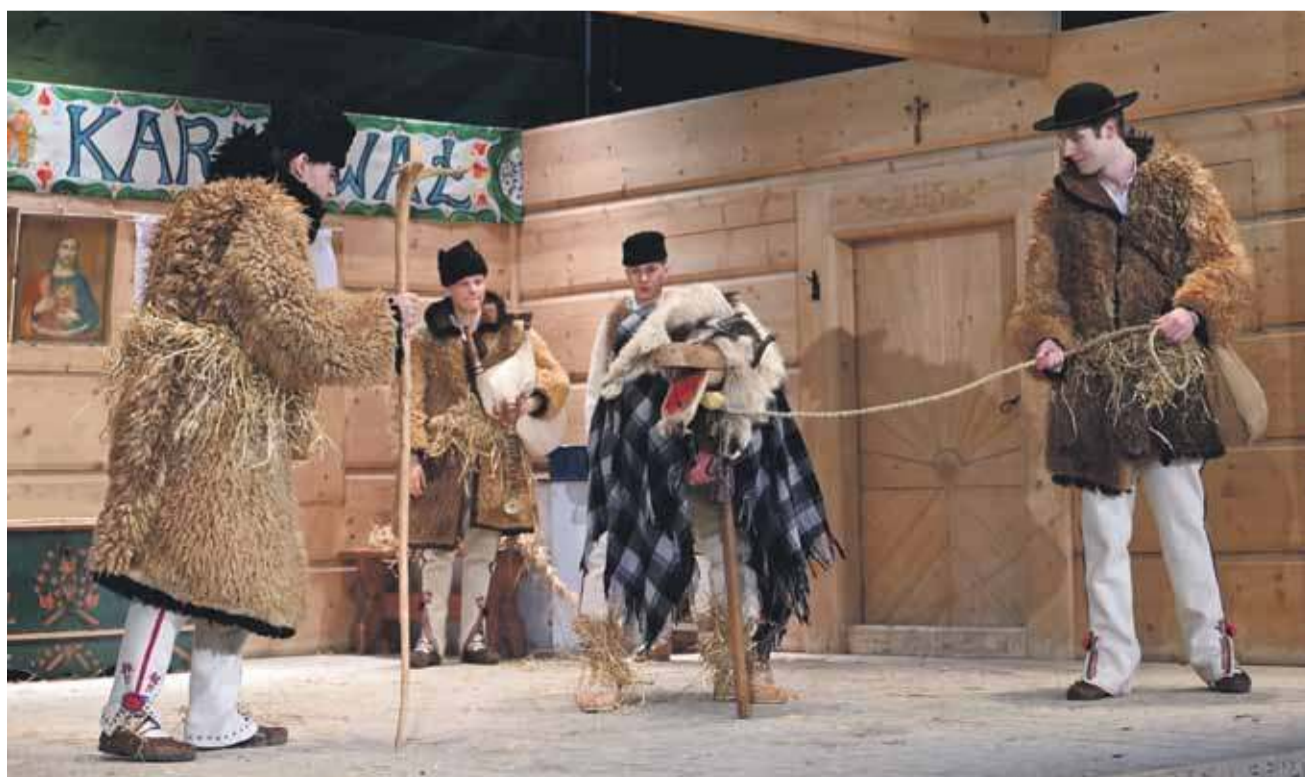
Kołędowanie z turoniem jest jednym z najczęstszych przedstawień.