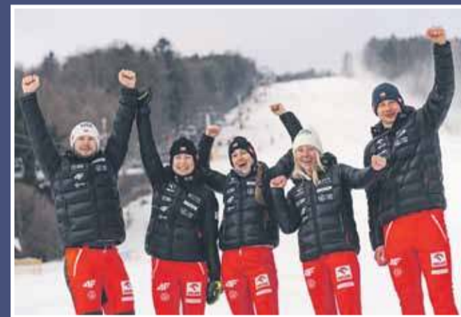
Reprezentacja Polski w Snowboardzie Alpejskim

Ośrodek wyznacza standardy w walce ze zmianami klimatycznymi, stosując od 2024 roku w pełni zautomatyzowany i ekologiczny system naśnieżania obejmujący 50 ha tras. Dzięki zaawansowanym czujnikom pogodowym, wykorzystaniu wody z własnych zbiorników retencyjnych oraz biodegradowalnym środkiem krystalizującym, stacja gwarantuje doskonałe warunki śniegowe nawet przy temperaturach bliskich 0°C. Profesjonalne przygotowanie stoków wspiera system GPS w ratrakach, co pozwala na precyzyjne zarządzanie pokrywą śnieżną.