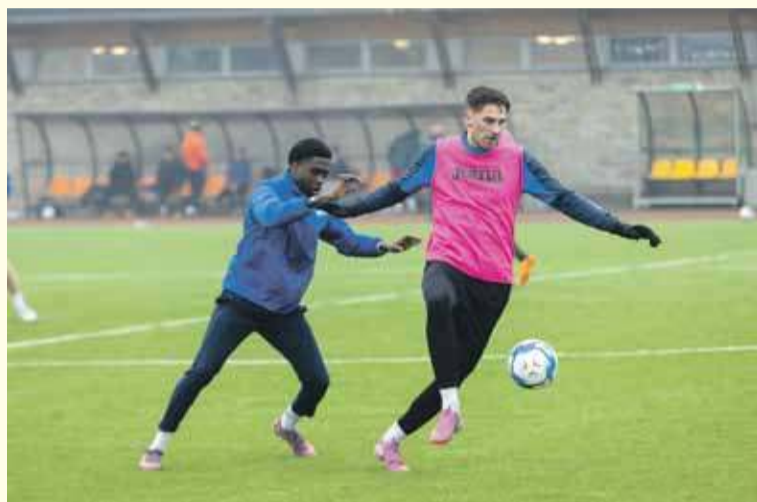
Spotkanie zakończyło się zwycięstwem drużyny z Biały Tatrzańskiej 2:0.

– Przede wszystkim bardzo słaba pierwsza połowa. Nie realizujemy na razie założeń tak-