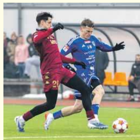
Podhale w sparingu zremisowało z zespołem MFK Tatran Liptovský Mikuláš.