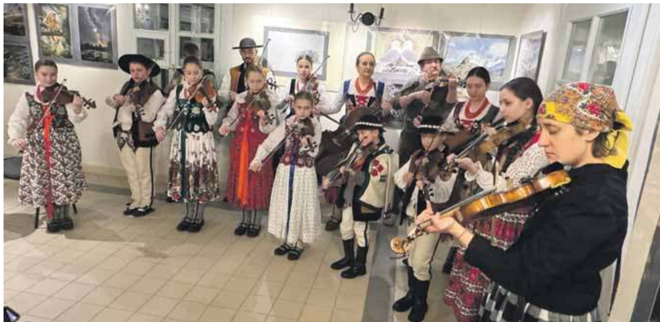
Zespół Regionalny „Majeranki”.