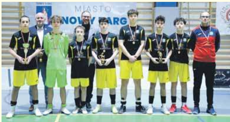
Zwycięska drużyna Jarmuty Szczawnica