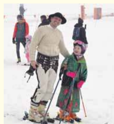
Zawodników było łatwo rozpoznać na stoku, byli ubrani w stroje góralskie.