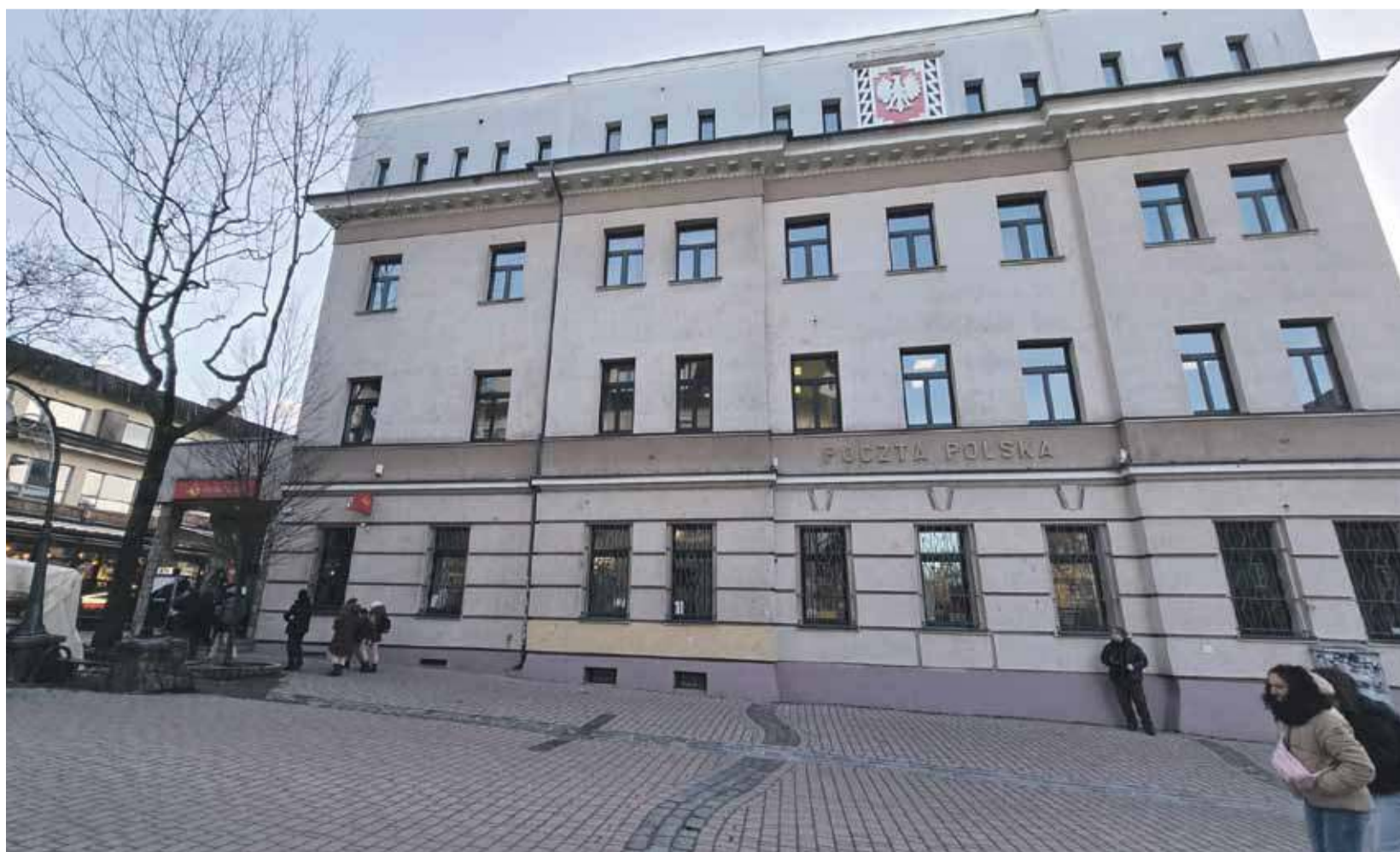
Siedziba Poczty Polskiej na Krupówkach.