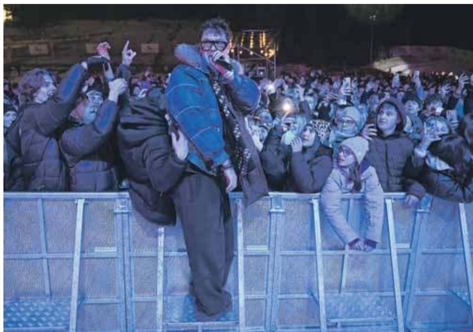
PP Na Długiej Polanie pojawili się hip-hopowi wykonawcy.

Festiwal to nie tylko koncerty, ale także okazja do spotkań, wspólnego spędzenia czasu i celebrowania kultury hip-hopowej.