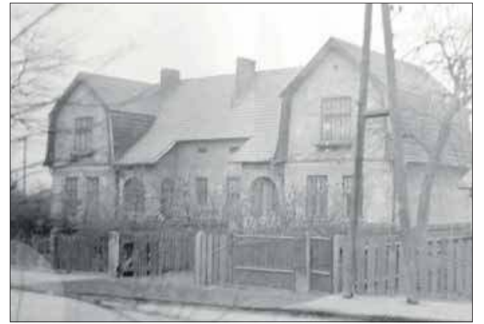
Dom na Chrustach, w którym moi dziadkowie mieszkali przez wiele lat, do początku lat 80. XX wieku (MMJ)

Dom, w którym mieszkali, był starą willą, wybudowaną jako dom dla pracowników kopalni. Pewnym cieniem na historii tego domu był fakt, że w czasie wojny miał w nim mieszkać jeden z komendantów obozu Neu-Dachs. Dom wydawał się jak na tamte czasy okazałą, wielorodzinną willą. Przed nią znajdował się niewielki ogródek, a na zapleczu zabudowa gospodarska. Pamiętam, że w domu tym mieszkało rzeczywiście kilka rodzin, o ile dobrze pamiętam cztery. To co dziwiło mnie w nim najbardziej to fakt, że lokale przeznaczone dla konkretnych rodzin były na swój sposób porzucane po obiekcie. I tak np. moi dziadkowie zajmowali w nim dwa pomieszczenia, a mianowicie dużą, widną kuchnię, tuż na początku korytarza, po prawej stronie; pokój natomiast znajdował się po lewej stronie, ale na samym końcu korytarza. To też być może sprawiło, że tak naprawdę całe rodzinne życie toczyło się właśnie w kuchni. Był tam duży piec węglowy. Był tam zlew i kran z bieżącą wodą, duża wersalka, stół, telewizor, meble kuchenne i maszyna do szycia, usytuowana pod oknem. Było