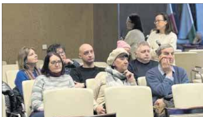
Spotkanie w sprawie miejscowego planu zagospodarowania przestrzennego Jan Kanty-Niedzielska

– Niespecjalnie chcemy dokonywać rewolucji w tym obszarze, dlatego że tam są już plany miejscowe, jednak ich zapisy są na chwilę obecną nieaktualne. Potrzebujemy je uaktualnić i dostosować do aktualnych potrzeb miasta. W pierwszej kolejności tereny, które były przeznaczone pod usługi centrotwórcze, chcemy zamienić na takie, w których dopuszczona jest również zabudowa mieszkaniowa wielorodzinną – i to dotyczy obszaru Jana Kantego. Za to w obszarze Niedzielska chcemy wprowadzić zabudowę mieszkaniową w formie, która da się zrealizować, dlatego że dzisiaj była ona wprawdzie dopuszczona, ale jako element dodatkowy. To była funkcja generalnie przemysłowo-usługowa. Ta funkcja zniknęła, bo zniknęła baza transportowa. W związku z tym jest gwałtowna potrzeba wprowadzania