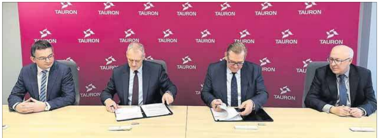
Tauron i SCE Jaworzno III podpisują wieloletnią umowę na dostawy

– Podpisana umowa na dostawę ciepła daje społeczności gwarancję stabilnych, długoterminowych i przewidywalnych dostaw ciepła, a nam