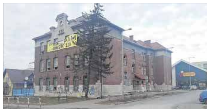
Budynek dawnej Szkoły Podstawowej nr 6 w Jaworznie

W 2021 roku budynek został wystawiony na sprzedaż za 2 650 000 złotych netto. Dwa lata później cena była już o 100 tysięcy złotych niższa. Wtedy ogłoszeniu o sprzedaży podkreślano, że nieruchomość posiada pozwolenie z 2021 roku na przebudowę oraz zmianę sposobu użytkowania na budynek mieszkal-