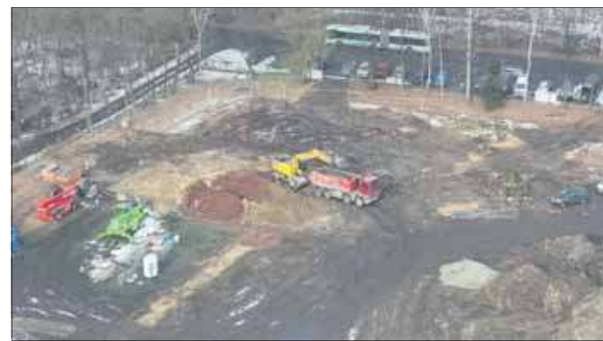
Trwa budowa stadionu lekkoatletycznego w Jaworznie

Pod koniec stycznia miasto informowało o aktualnym postępie prac. Zakończono już wykopy pod fundamenty budynku zaplecza oraz pod zbiorniki retencyjne. Trwają końcowe wyburzenia starych obiektów i nawierzchni, a teren jest niwelowany i przygotowywany pod stadion oraz boisko piłkarskie. Rozpoczęto