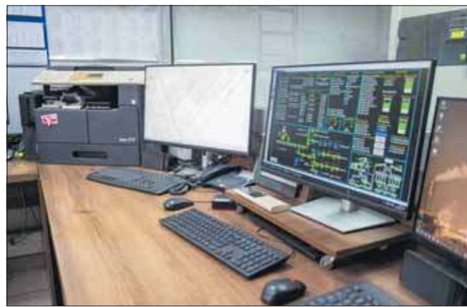
Stanowisko do monitorowania wstrząsów w kopalniach PKW ZG Sobieski i ZG Janina

Kopalnie dzielą wstrząsy na klasy energetyczne. Im wyższa klasa, tym silniejszy wstrząs. Wysokoenergetyczne wstrząsy to te, które przekraczają tzw. górniczą piątkę. Te o oznaczeniu E6 oznaczają