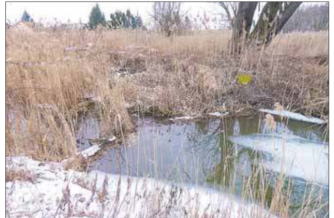
Tama na Kozim Brodzie

Przypomnę, że po raz pierwszy w tej okolicy ich obecność stwierdziłem 17 lutego 2022. Tama pojawiła się u zbiegu