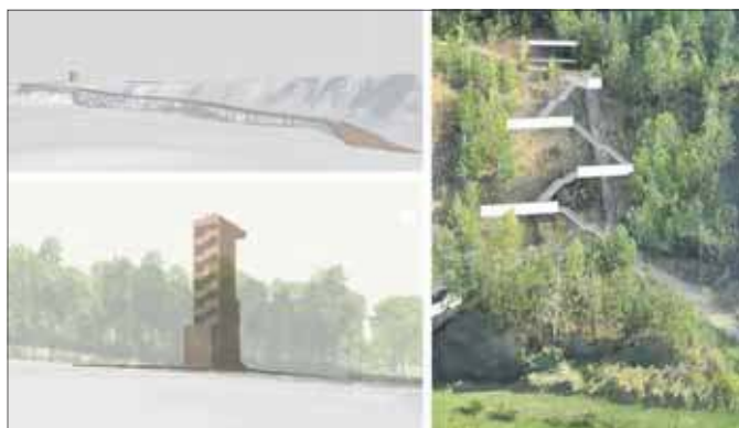
Wizualizacja inwestycji

Jednym z najbardziej charakterystycznych elementów inwestycji będzie adaptacja starej prochowni. Dawny obiekt techniczny zmieni się w muzeum. W środku pojawią się ekspozycje, multimedia i specjalne gabloty, przygotowane zgodnie z koncepcją muzeum „Calcare-