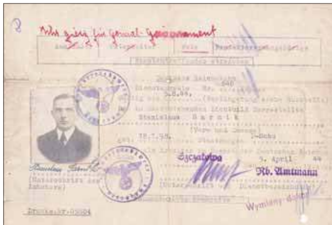
Dokument urzędowy z okresu III Rzeszy – arbeitsbuch (książka pracy)