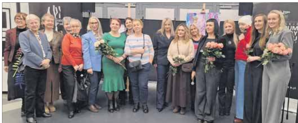
Uczestniczki, organizatorki i prowadzące projekt „Onkosztuka”

Projekt „Onkosztuka” kierowany był do pań onkologicznie chorych i tych wspierających je w trudnej walce z chorobą. Projekt wymyślono i zrealizowano w MCKiS. Zajęcia rozpoczęły się w październiku ubiegłego roku, a zakończył je wernisaż „Onkosztuka” w środę 4 lutego. Prace prezentowano w Galerii Podcienie.