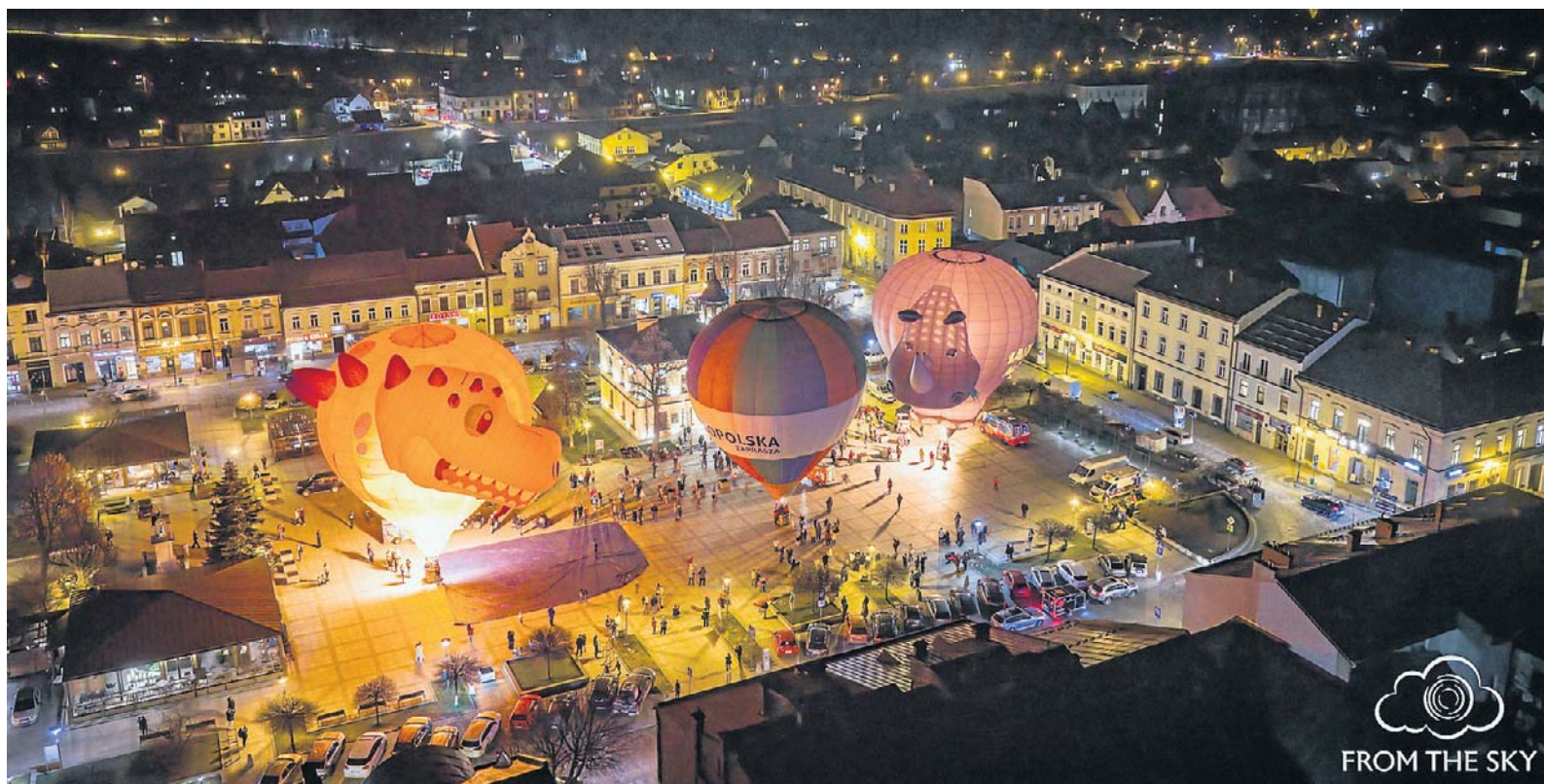
Tak było na Podhalu, tak będzie również na Sądecczyźnie

Odlotowa Małopolska to oczywiście cudownie barwna balonowa fiesta, zawody, adrenalina, ale też zachwycające widoki. Oprócz malowniczych - porannych i wieczornych - startów, odbędzie się również specjalna Wieczorna Gala Balonów