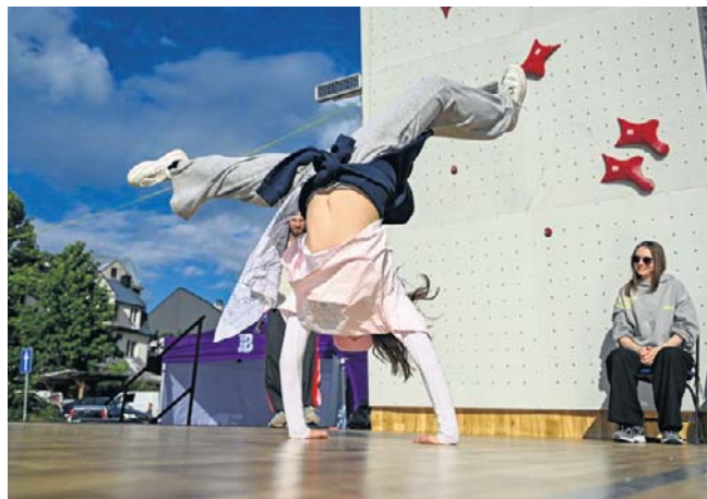
Rywalizacja była niezwykle wymagająca. Organizatorzy zapowiadają, że w Zakopanem będą następne bitwy