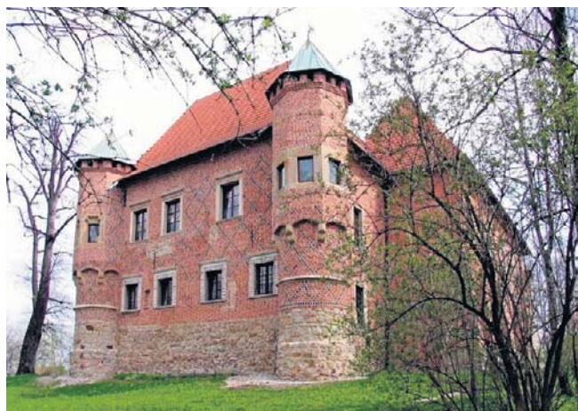
Zamek w Dębnie. Remont przyczyni się do tego, że obiekt będzie dostępny dla turystów przez cały rok