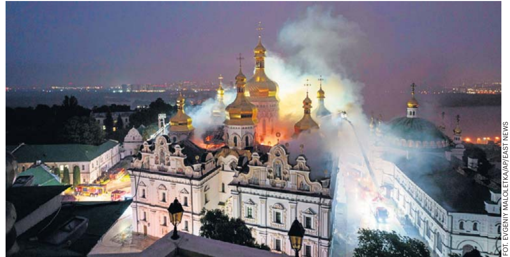
Prawosławna Ławra Peczerska stanęła w płomieniach po uderzeniu dronem. Według dyrekcji klasztoru ikony i inne cenne przedmioty udało się uratować

Reuters zaznacza, że atak nastąpił wkrótce po rozmowie