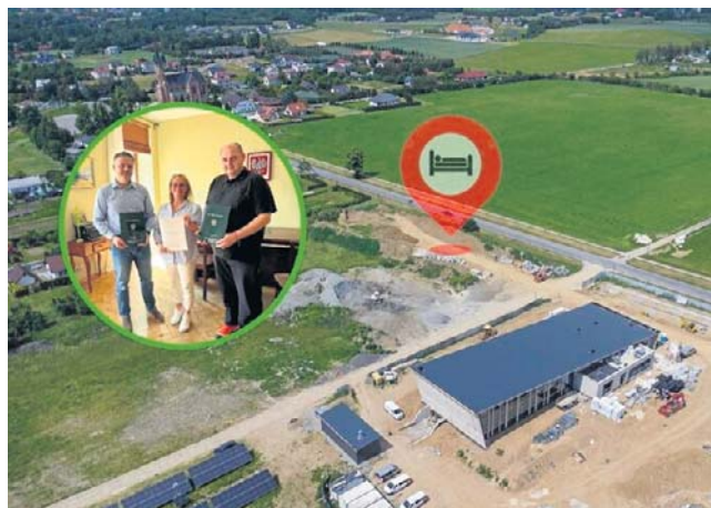
Działkę należącą do gminy Sękowa oddano w użytkowanie wieczyste firmie Investment Group z Jasła. Będzie tu hotel

Przyszły hotel będzie miał dwa oblicza: jedno noclegowe oraz drugie - czyli część o charakterze rehabilitacyjnym z możliwością pobytów turnusowych, być może nawet finan-