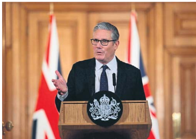
Jak powiedział Starmer, regulacje mają wejść w życie na początku przyszłego roku, prawdopodobnie wiosną

Oftcom, brytyjski regulator ds. mediów, ma teraz przeprowadzić badania na temat najbardziej efektywnego sposobu weryfikacji wieku użytkowników.