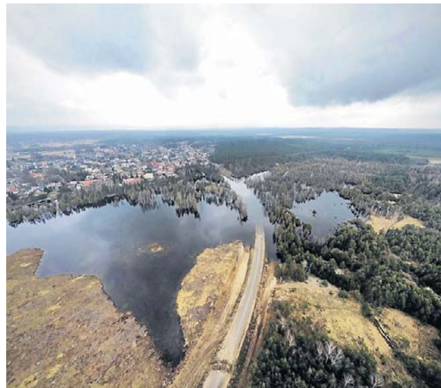
Podwodnica Bolesławia. Powiat żąda pieniędzy za naprawę, ZGH „Bolesław” odmawiają. Sprawa chyba skończy się w sądzie

Jeszcze w ubiegłym miesiącu przedstawiciele spółki jasno podkreślili, że do ugody nie dojdzie. W czerwcu natomiast wydane zostało stanow-