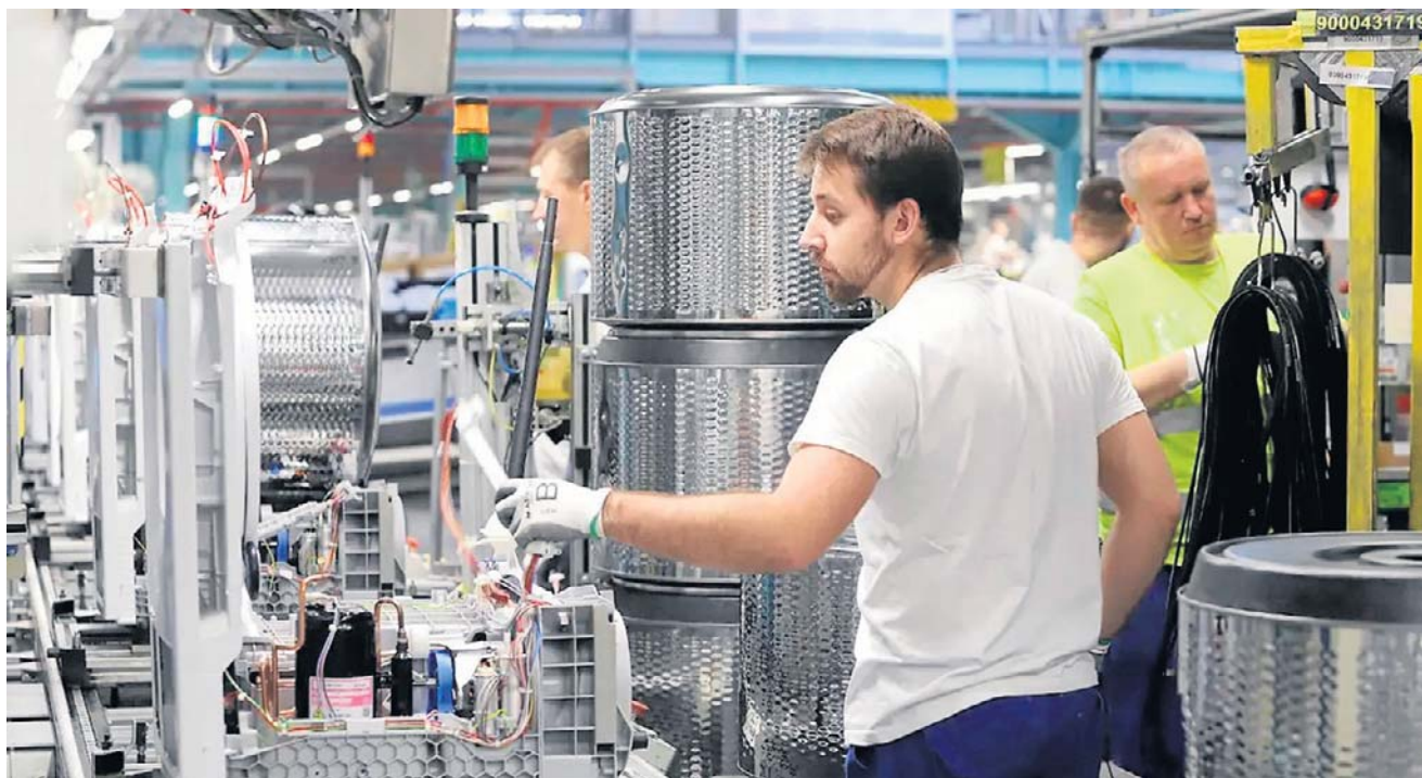
Rząd zaproponował, aby minimalne wynagrodzenie za pracę w 2027 r. wynosiło 4950 zł brutto