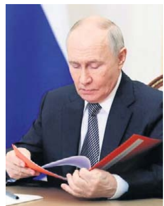
Do Putina docierają jedynie wybrane informacje

- Było tak. Powiedzmy, że o 20.00 na antenie szło zwykłe wydanie „Więści”, po czym ekipa produkcyjna zostawała. Cóż, mieliśmy oczywiście wytyczne,