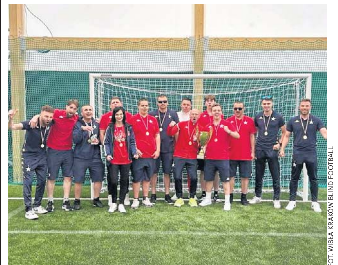
Dla Wisły Kraków Blind Football wywalczony w Bielsku-Białej tytuł mistrza Polski był już trzecim w historii

W tym roku nie jest to ostatnie trofeum, jakie chcą zdobyć wiślacy. W październiku powalczą o obronę Pucharu Polski. W zeszłym sezonie zdobyli dublet i teraz chcą to powtórzyć. ©