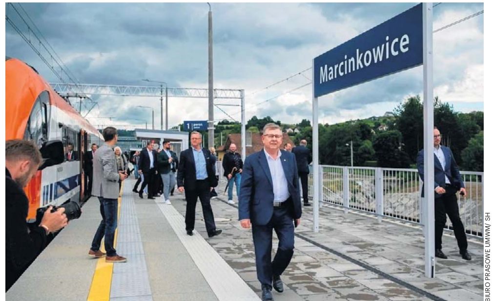
W niedzielę wrócił ruch na trasie Nowy Sącz - Marcinkowice. Jazda trwa 11 minut. Dla mieszkańców to połączenie może być alternatywą dla przejazdu samochodem