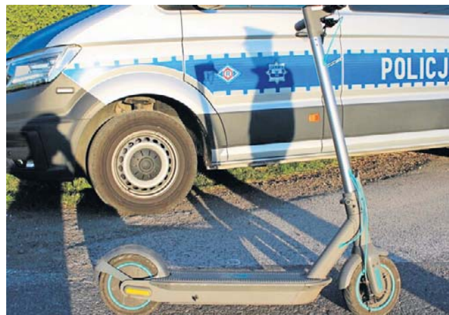
Sprawa może zakończyć się pouczeniem lub nawet skierowaniem do Sądu Rodzinnego i Nieletnich

Konsekwencje sprawy poniosą także rodzice i opiekunowie nastolatków. W przypadku nieprzestrzegania przepisów przez dziecko, osoby sprawujące nad nim nadzór mogą zostać ukarane mandatem w wysokości 100 zł lub karą nagany. ©