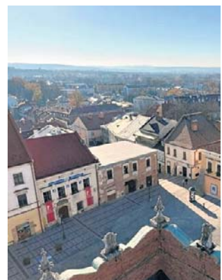
Kamienica przy Rynku 7 ma przejść remont

- Kamienica w całości będzie przebudowywana. Przez prawie dwa lata będzie nieczynna - mówi Marcin Pałach,