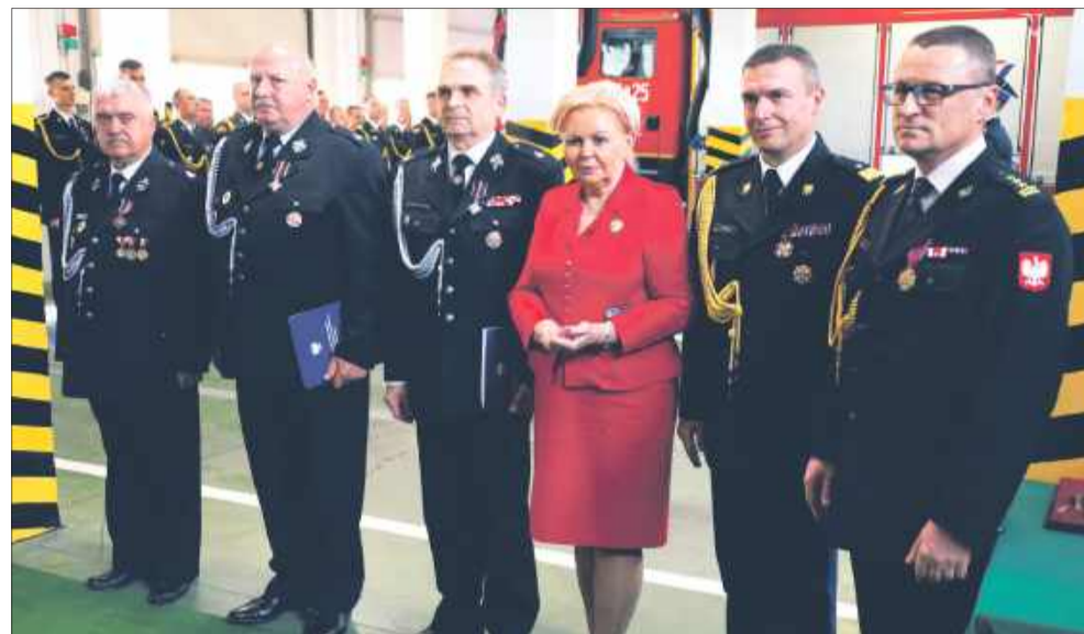
Tego dnia wyróżnieni zostali także druhowie OSP.