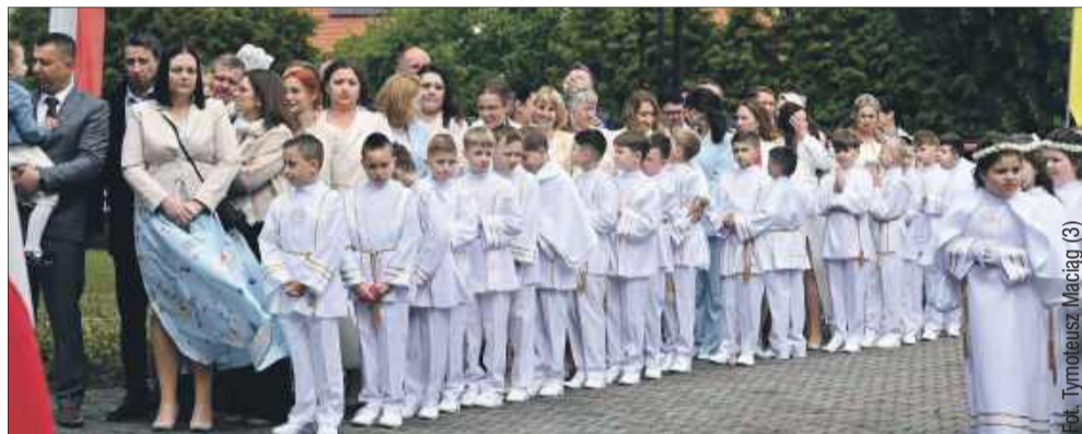
Pierwsza Komunia Święta do wyjątkowy dzień dla wszystkich dzieci.

Oprawę muzyczną stanowiły pieśni towarzyszące całej uroczystości, a dzieci aktywnie uczestni-