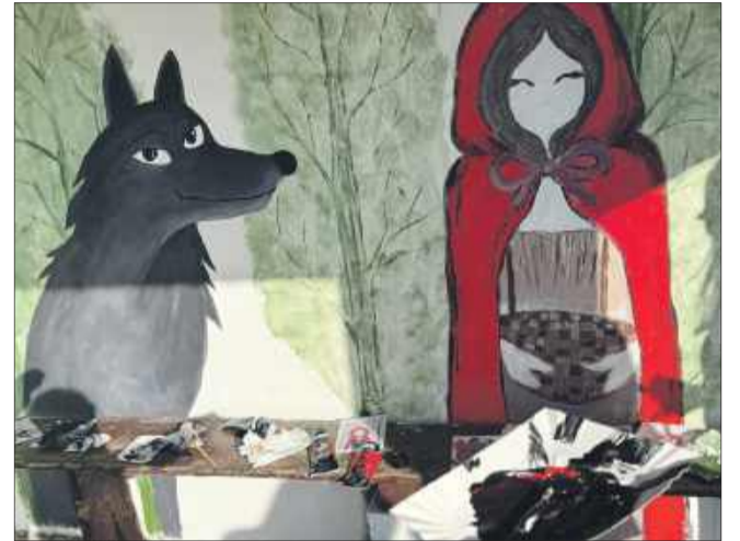
Za malowanie wzięli się pracownicy bibliotek i uczniowie.