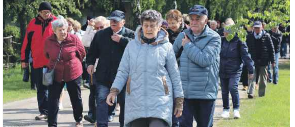
Seniorzy rozpoczęli świętowanie od zwiedzania skansenu.