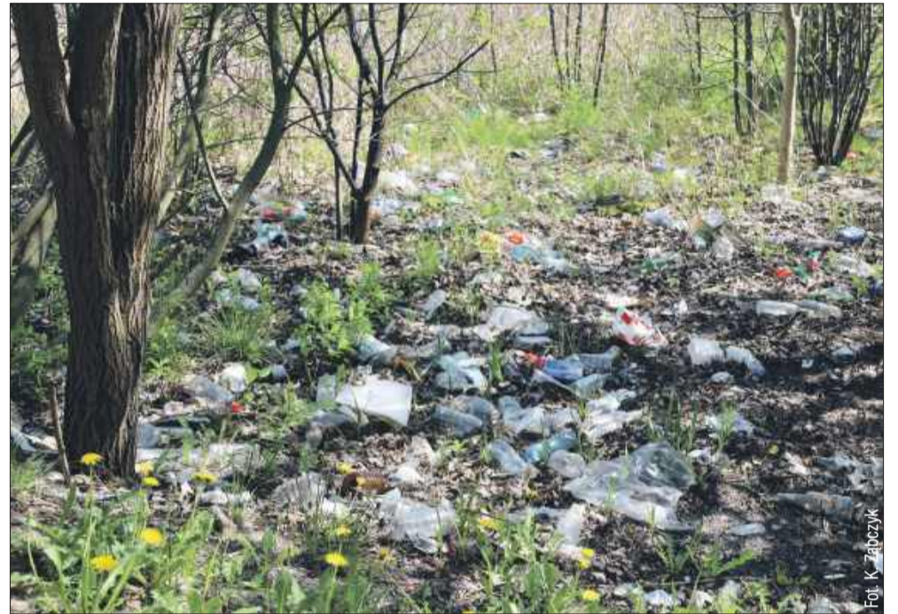
Tak wyglądał pod koniec kwietnia teren za sklepem.

- Dziękujemy za zwrócenie uwagi na ten problem. Po przeanalizowaniu zgłoszenia podkreśliśmy, że jedynie część tego terenu należy do naszej sieci. Niemniej niezwłocznie