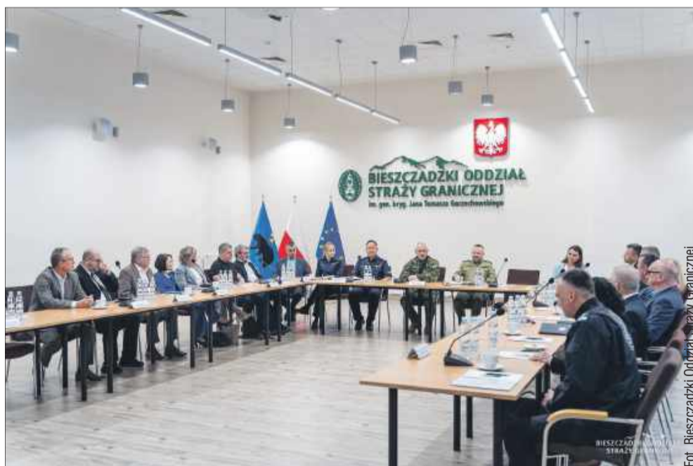
W roku szkolnym 2025/2026 w Liceum Ogólnokształcącym im. Janka Bytnara w Kolbuszowej zostanie uruchomiona klasa mundurowa pod patronatem MSWiA. Nowy oddział będzie przygotowywać uczniów do podjęcia służby w Policji i Straży Granicznej

Uczniowie, którzy w ciągu trzech lat od ukończenia nauki w klasie mundurowej złożą podanie o przyjęcie do służby