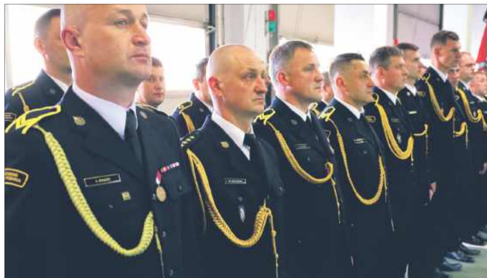
Tego dnia wszyscy strażacy ubrani byli na galowo.