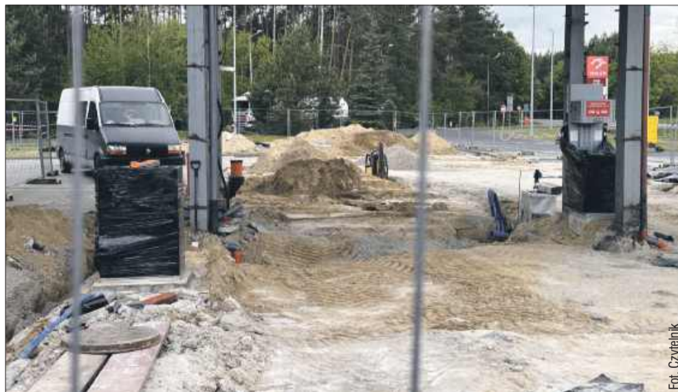
Trwa remont na stacji paliw Orlen w Widelce.

Przejeżdżając krajową „dziwiałką” przez Widelkę, trudno nie zauważyć prac przy stacji Orlen. Czy mimo robót da się tam zatankować? Jak długo potrwa i na czym polega remont?