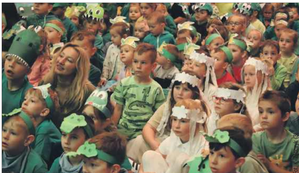
Małe krokodylki zebrały się wewnątrz domu kultury.