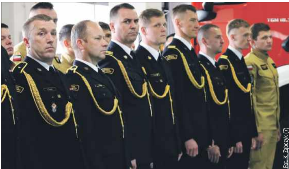
Funkcjonariusze licznie zebrałi się na uroczystym apelu.

W czwartek, 15 maja, podczas uroczystego apelu z okazji Dnia Strażaka w Komendzie Powiatowej PSP w Kolbuszowej wręczono medale, odznaczenia oraz awanse na wyższe stopnie służbowe. Był to wyraz uznania za codzienną służbę, odwagę i poświęcenie strażaków.