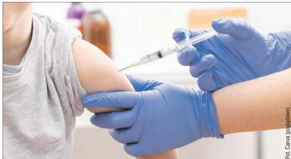
Mimo obowiązkowych szczepień dzieci, wielu rodziców nie decyduje się na nie.

W grupie zachorowań, w których zapobieganie odbywa się poprzez szczepienia ochronne, w 2024 r. odnotowano zachorowanie na świnkę – 1 przypadek, oraz zachorowania na krztusiec – 34 przypadki, (w tym: 13- możliwych, 1 prawdopodobny, 20 potwierdzonych), w roku 2023 nie było żadnych zachorowań. Nie odnotowano zachorowań na