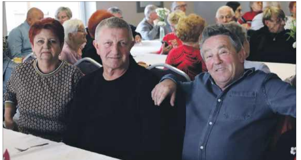
Seniorom dopisywał dobry humor.