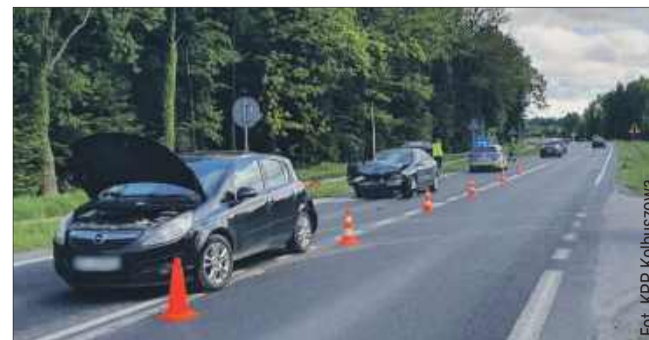
W stłuczce z 17 maja brały udział dwa samochody osobowe.

W związku z przewróconym słupem droga była całkowicie zablokowana przez około półtorej godziny. Służby wprowadziły objazdy dla kierowców, a po usunięciu przeszkody i zabezpieczeniu miejsca ruch wznowiono z zachowaniem ruchu wahadłowego. Policja zakwalifikowała to zdarzenie jako kolizję, a kierująca została ukarana mandatem karnym.