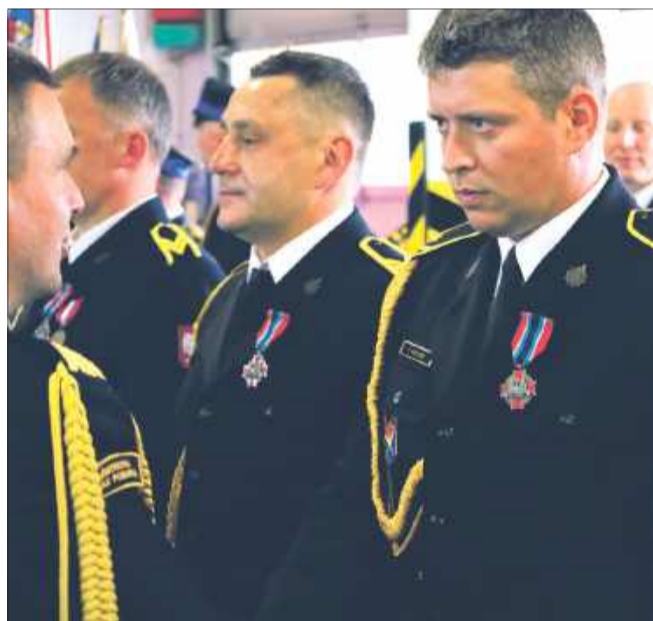
Nadanie odznaki to wyjątkowy moment dla każdego strażaka.