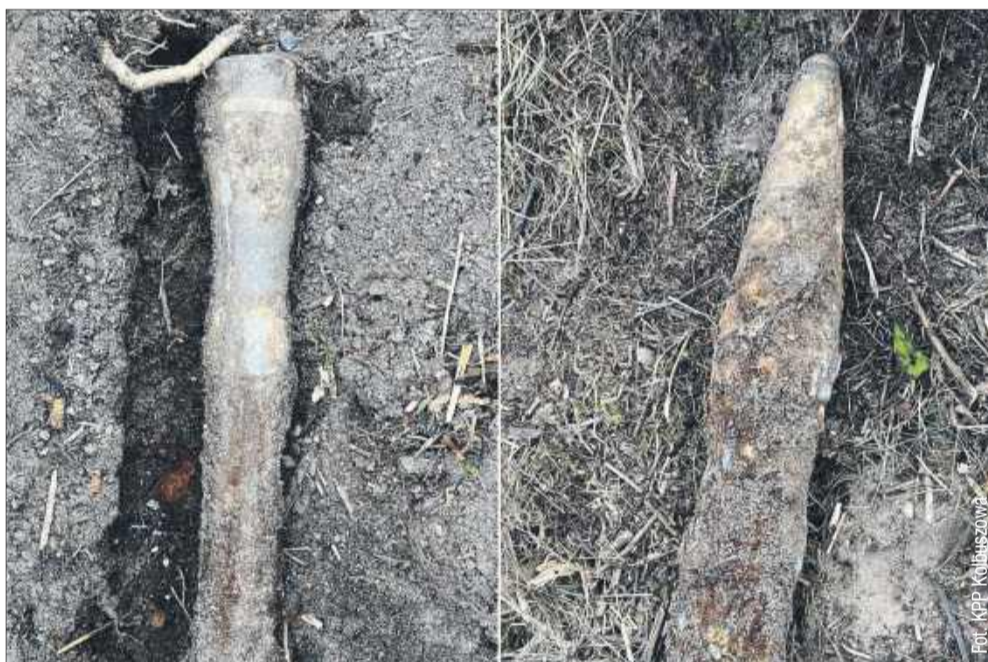
Niewybuch znaleźli pracownicy kolei.

Podczas prac porządkowych przy torowisku w Krzątce pracownicy kolei natrafili na pocisk artyleryjski z okresu II wojny światowej. Miejsce znaleziska zostało zabezpieczone, a ruch pociągów na linii czar-