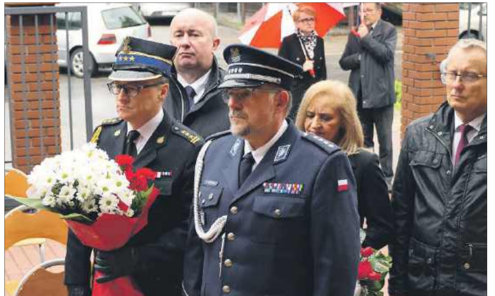
Delegacje złożyły kwiaty pod pomnikiem znajdującym się przy ZST w Kolbuszowej.