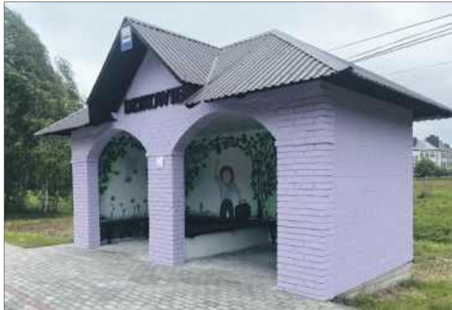
Przystanek w Dzikowcu nawiązuje natomiast do wiersza „Na Jagody”.

Motywy zdobiące przystanki zostały zainspirowane literaturą i lokalną przyrodą. Przystanek w Wilczej Woli został ozdobiony ilustracjami postaci z bajki