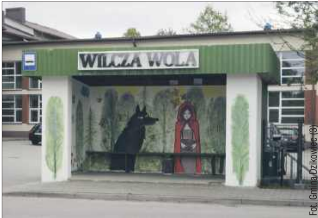
„Czerwony Kapturek” zdobi przystanek w Wilczej Woli.

W gminie Dzikowiec zrealizowano nietypową akcję społeczną polegającą na malowaniu przystanków komunikacyjnych. Projekt miał na celu zarówno promocję czytelnictwa, jak i wizualne ożywienie przestrzeni publicznej w okolicach miejscowości Spie, Wilcza Wola i Dzikowiec.