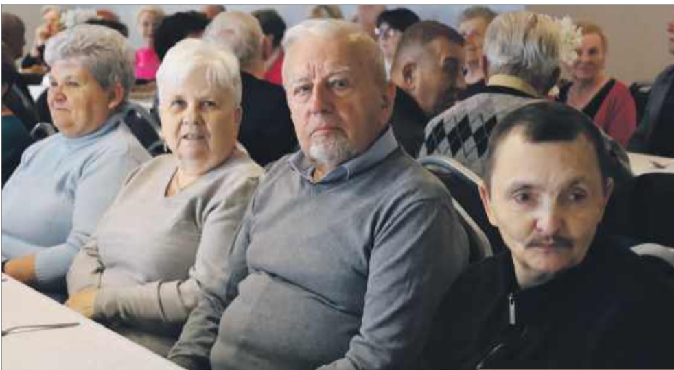
Starsi zasiedli wspólnie przy stole.