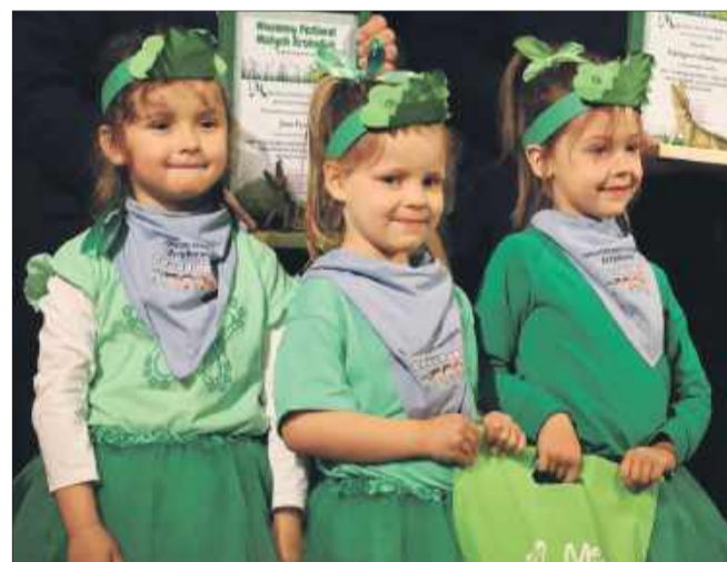
Maluchy wręczyły władzom podziękowania.

Mimo kapryśnej pogody, festiwal okazał się radosnym i kolorowym wydarzeniem, które na długo zostanie w pamięci jego uczestników.