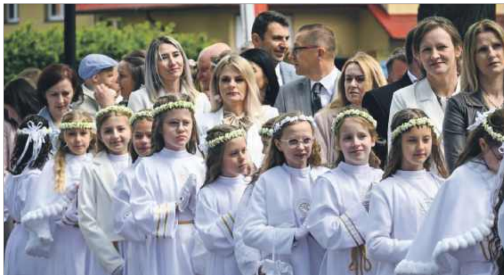
Białe stroje komunijne symbolizować mają czystość i niewinność.

W tym roku do Pierwszej Komunii Świętej przystąpiło 44 trzecioklasistów, którzy ubrani w odświętne alby z powagą i skupieniem przyjęli sakrament. Kościół wypełniły modlitwa, śpiew i radość z tej wyjątkowej chwili.