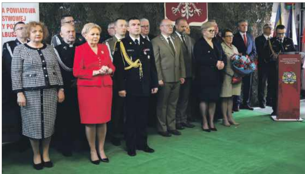
Na uroczystej zbiórce nie zabrakło władz kolbuszowskich i wojewódzkich.