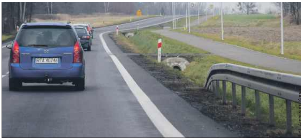
Ostateczny przebieg nowej drogi krajowej nr 9 nie został jeszcze ustalony.

Jedną z osób zabiegających o inwestycję jest poseł na Sejm RP Zbigniew Chmielowiec, który od początku wspiera proces realizacji obwodnic Kolbuszowej i Nowej Dęby oraz ich włączenia do nowej DK9. Przypomnijmy, że po rozmowach z Generalną Dyrekcją Dróg Krajowych i Autostrad oraz Regionalną Dyrekcją Ochrony Środowiska poseł przekazał ważne informacje dotyczące preferowanego wariantu obwodnicy Kolbuszowej. Według aktualnych ustaleń wybór padł na wariant 4.1A – trasę o długości około 12,5 km, która będzie bieć po wschodniej stronie istniejącej „dziewiątki” od Cmol-