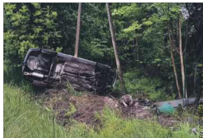
W zdarzeniu z 19 maja samochód uderzył prosto w słup energetyczny.