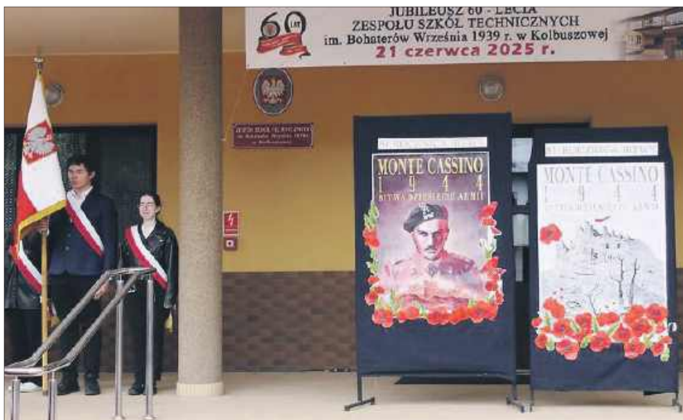
Uroczystości co roku odbywają się w Kolbuszowej, pielęgnując tym samym pamięć o poległych.