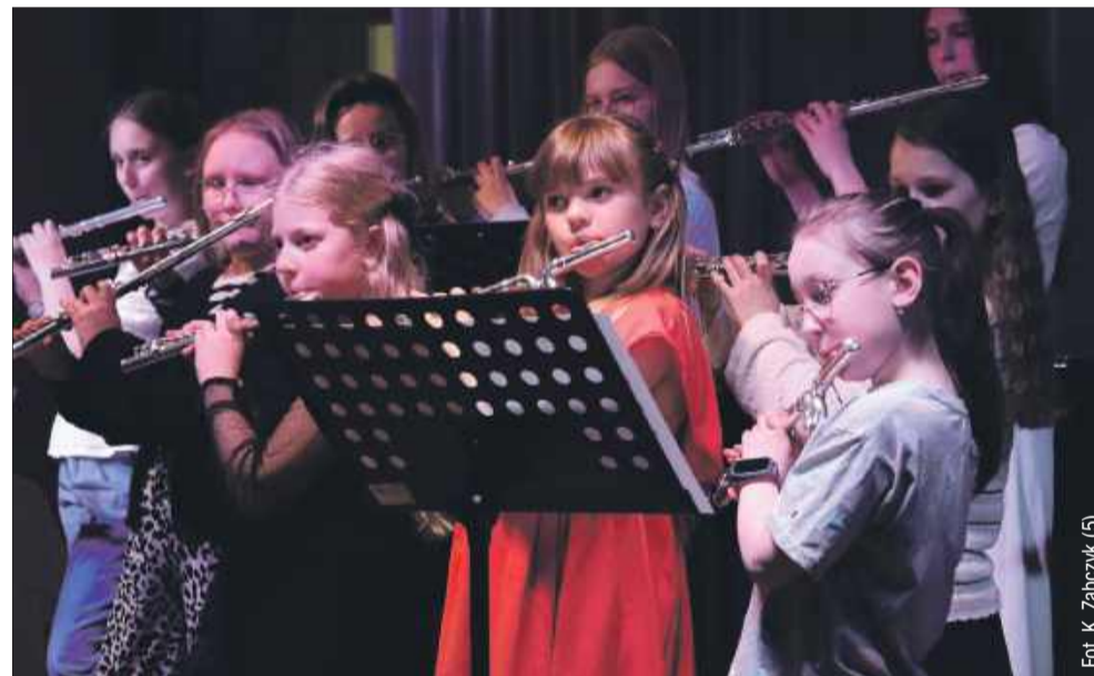
Chór fletowy pozytywnie zaskoczył publiczność.