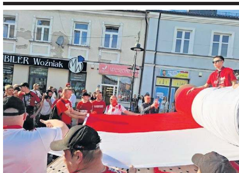
FOT. NATALIA ZWOLINSKA