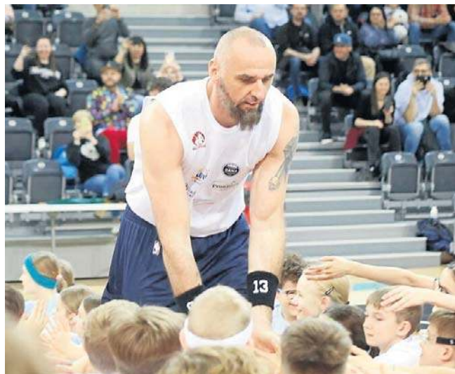
Marcin Gortat podczas każdego spotkania ma doskonały kontakt z młodymi pasjonatami koszykówki

Każdy Camp to okazja do sportowej rywalizacji, zdobywania nowych doświadczeń oraz spotkania z pasjonatami koszykówki z całej Polski. W każdym z miast odbyły się kilkugodzinne sesje treningowe, które pozwolą uczestnikom rozwijać swoje umiejętności. Dla młodzieży spotkanie z Marcinem Gortatem to niezapomniana przygoda. ©©