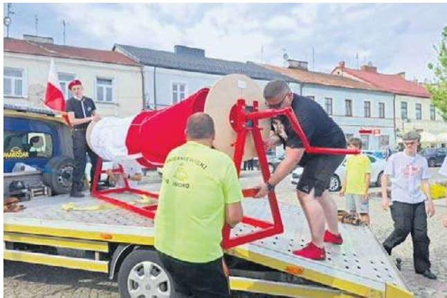
W tym roku biało-czerwona flaga w Skierniewicach będzie długa aż na 475 metrów

Dziennik Łódzki ☎ 42 715 80 68 bok.prenumerata@polskapress.pl prenumerata.dzienniklodzki.pl