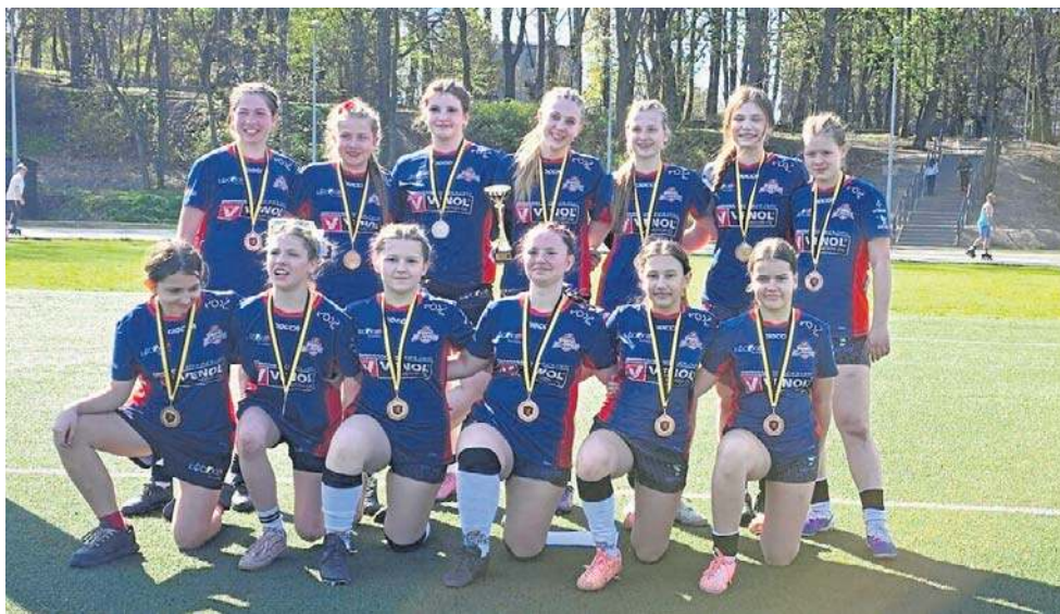
Brązowy medal kadetek Venol Atomówek w III Turnieju Mistrzostw Polski U16

- Jestem zadowolony z postawy zawodniczek. Po przerwie zimowej forma zawsze jest pewną niewiadomą, ale wiadać, że odrobiliśmy lekcje - podsumował trener Zbigniew Grądyś. - Połączenie sił z zawodniczkami z Gorców okazało się strzałem w dziesiątkę - dziewczyny świetnie się zgrały już po kilku wspólnych treningach. Przed nami jeszcze trzy turnieje i wierzę, że utrzymamy wysoką pozycję w rozgrywkach. Tytuł MVP w drużynie