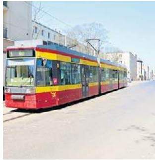
Remont Franciszkańskiej rozpocznie się 4 maja

Po przebudowie jezdni pomiędzy ul. Wolborską a ul. Północną będzie szersza, a tramwaje pojadą obok aut. Przy ul. Północnej powstanie podwyższony peron przystankowy tuż przy torowisku, dzięki czemu pasażerowie nie będą się już musieli przeciskać wśród stojących samochodów ani nie