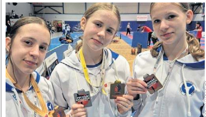
Karatecy Harasuto Łódź wzięli udział w turnieju o Puchar Mazowsza

To był udany start karateków KK Harasuto Łódź.