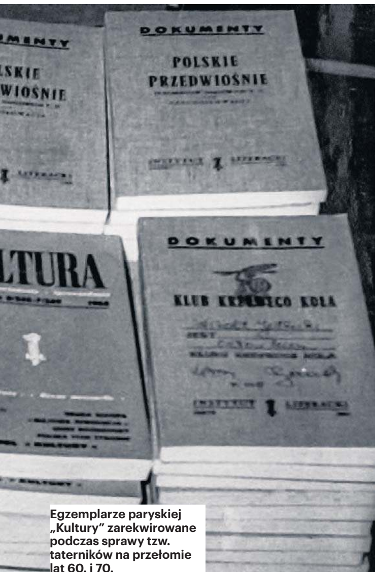
Exemplarze paryskiej „Kultury” zarekwirowane podczas sprawy tzw. tatarników na przełomie lat 60. i 70.

do lat 80. wielokrotnie współprowadził wymierzone w Michnika i byłych „komandosów” sprawy, bywał też „konsultantem” innych esbeków od opozycji demokratycznej w PRL.