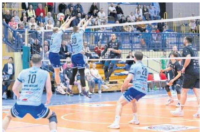
Wielunianie (jasne stroje) już rok temu byli blisko awansu do I ligi - do promocji zabrakło im wygranego seta

Siatkarki KS Pajęczno są gospodarzami turnieju półfinałowego, który ma być rozegrany od 1 do 3 maja. Jak już informowaliśmy rywalkami KP będą TPS Bielsk Podlaski, Enea Energetyk Poznań oraz Marba Sędziszów Małopolski. Z obu turniejów do decydujących zawodów awans wywalczą po dwie najlepsze drużyny.