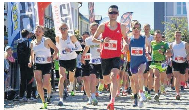
W niedzielnych 66. Biegach Ulicami Sieradza weźmie udział ponad 800 śmiałków z całego naszego regionu, którzy rywalizować będą na kilku dystansach