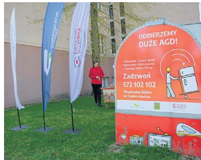
Kto sam nie może odwieźć zużytego dużego sprzętu AGD, może się umówić na bezpłatny odbiór

Przysłowie na dziś: Nauką i pracą ludzie się bogacą