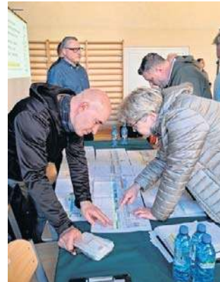
O remoncie Rzgowskiej debatowali mieszkańcy i urzędnicy. Pokazano projekt, zainteresowanie było spore