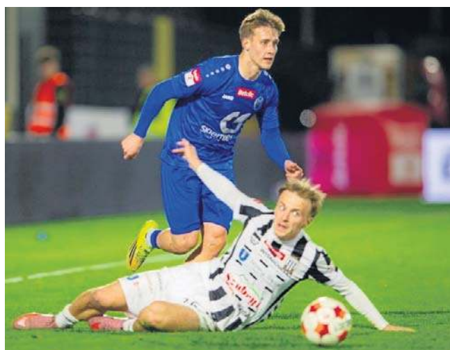
Unia Skierniewice ma przed sobą jeszcze pięć meczów o drugoligowe punkty - najbliższy w niedzielę

Unia wpadła ostatnio w dołek i na potęgę traci punkty. Od pięciu kolejek nie wygrała meczu i ma już tylko trzy punkty przewagi nad drugą w rankingu Olimpią Grudziądz, a to tyle, co kot napłakał. Na szczęście za zespołem przemawia korzystny terminarz. Już w niedzielę Skierniewiczanie zmierzą się na swoim obiekcie przy Pomologicznej, gdzie wygrali osiem pojedynków, trzy zremisowali i trzy przegrali, z Sokołem Kleczew. Początek meczu o 14.30. Goście mają aż 22 punkty mniej od zespołu ze Skierniewic i są na 14 miejscu w tabeli. Gdyby dziś zakończyła się liga, graliby w barażach o utrzymanie. Unia powinna ten mecz wygrać. „Choć ostatnie tygodnie nie były dla biało-niebiesko-żółtych najłatwiejsze, drużyna