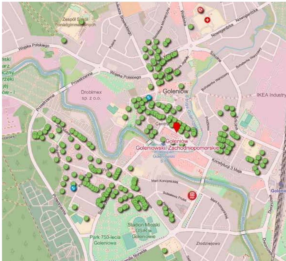
Na mapie można sprawdzić lokalizację schronów