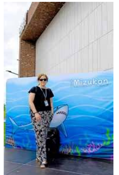
Biblioteka na Mizukonie Pod koniec lipca w Przecławiu

ne atrakcji. Dzieci biorą udział w wycieczkach do kina, parku trampolin i Fabryki Wody, a kulinarny dzień – z pieczeniem pączków czy drożdżówek – stał się już ulubionym elementem każdego turnusu. Nie brakuje także warsztatów plastycznych, zajęć edukacyjnych, gier i zabaw na świeżym powietrzu. Na zakończenie przewidziana jest dyskoteka, która zawsze dostarcza wielu emocji i radości. Zróżnicowany i bogaty program potwierdza, że półkolonie z biblioteką to sprawdzona i chętnie wybierana forma letniego wypoczynku dla najmłodszych.