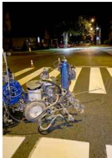
Prace prowadzone były po zmroku