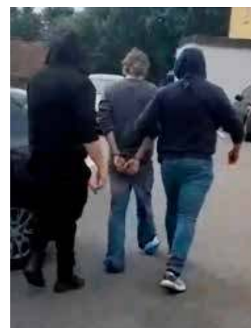
Zatrzymany został przekazany iławskim policjantom