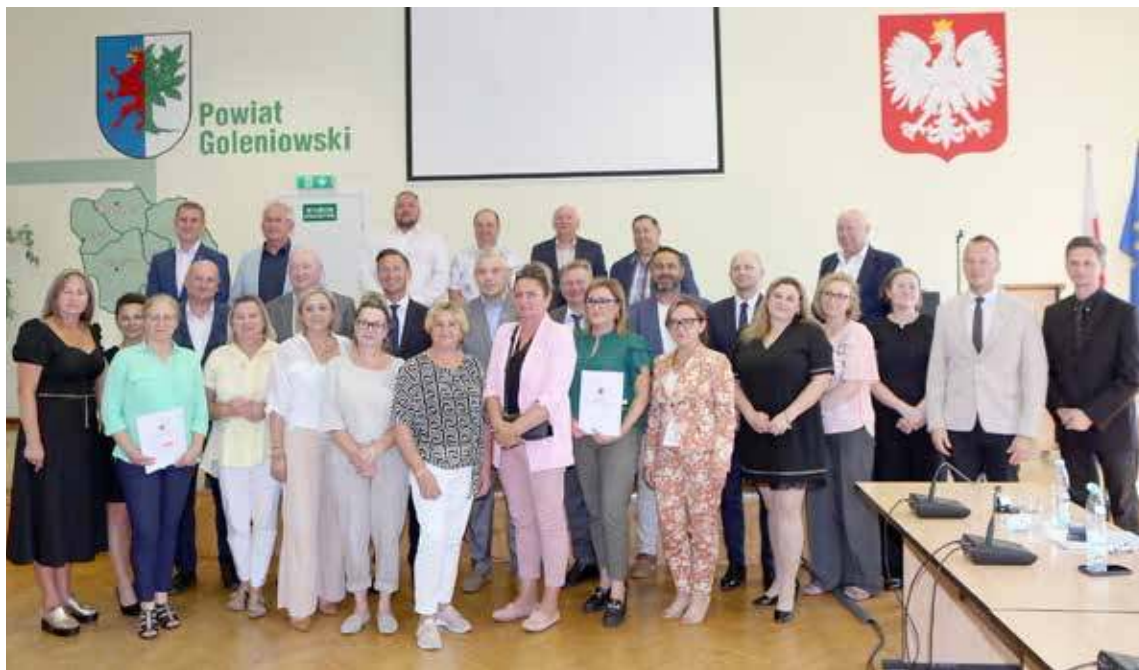
Czternaście sołectw z powiatu goleniowskiego skorzysta z dotacji