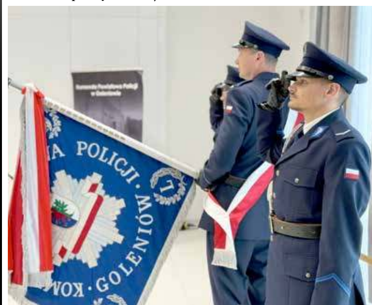
Uroczystość rozpoczęła wniesienie sztandaru