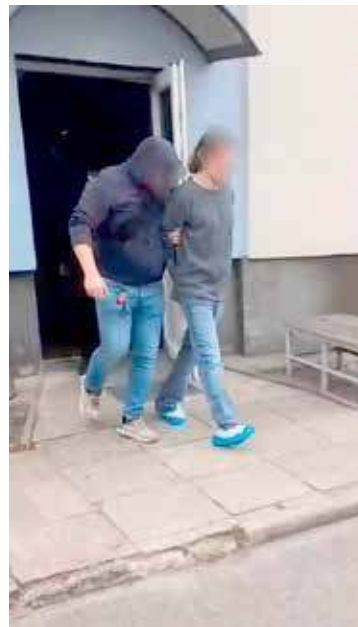
Dokonano zatrzymania mężczyzny podejrzanego o podwójne morderstwo

Wymiana informacji pomiędzy jednostkami pozwoliła policjantom z powiatu goleniowskiego na przygotowanie się do działania. W Wojcieszynie ustawione zostały pojazdy w sposób uniemożliwiający przejazd – słowem blokada drogową. W chwili gdy pościg dotarł do tego miejsca okazało się, że kierujący Mercesem podejrzanym mężczyzną