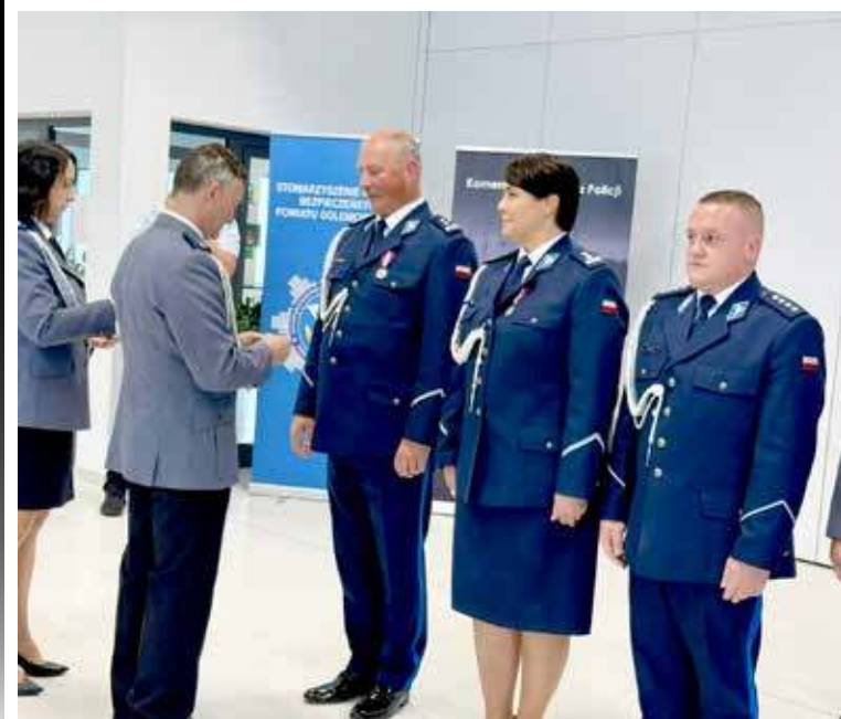
Wręczane były odznaczenia