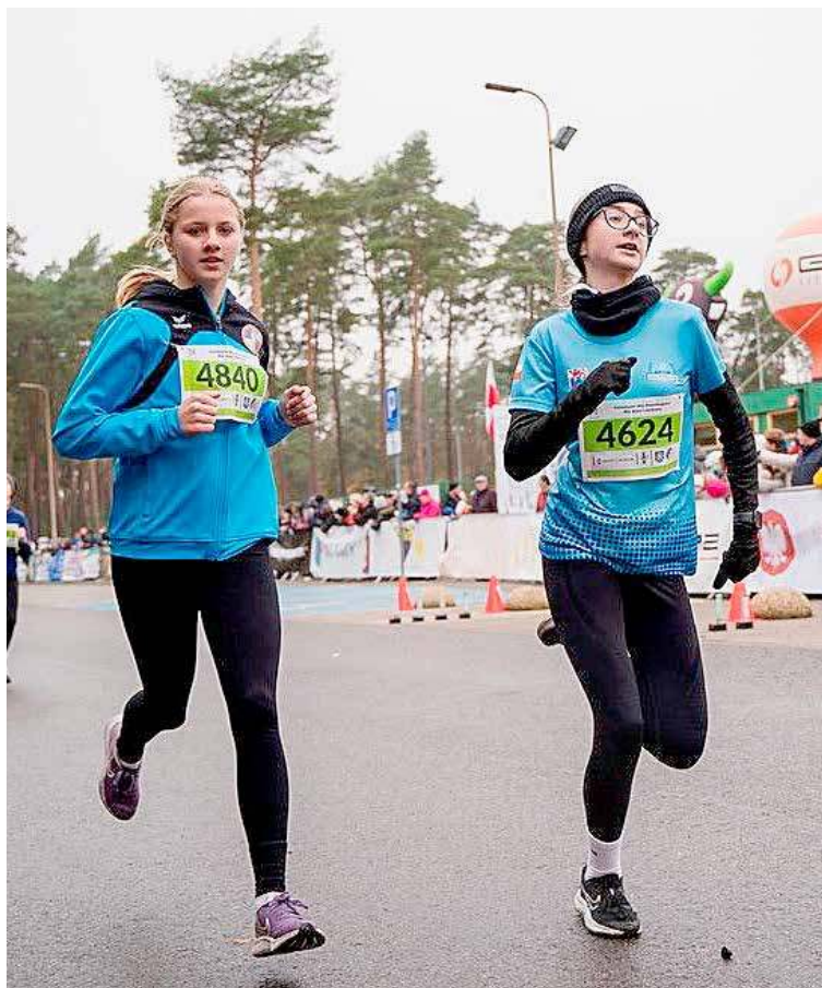
Bieg na 10 kilometrów podczas zeszłorocznego wydarzenia

Niższa opłata startowa za udział w biegu XXXVII Goleniowskiej Mili Niepodległości obowiązuje tylko do końca sierpnia. Osoby, które planują udział powinny mieć to na uwadze, aby nieco zaoszczędzić.