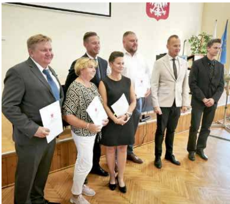
Umowy zostały podpisane

- Sołectwo Miodowice – „Strefa Ruchu – Gramy u siebie! – modernizacja boiska w Miodowicach”.