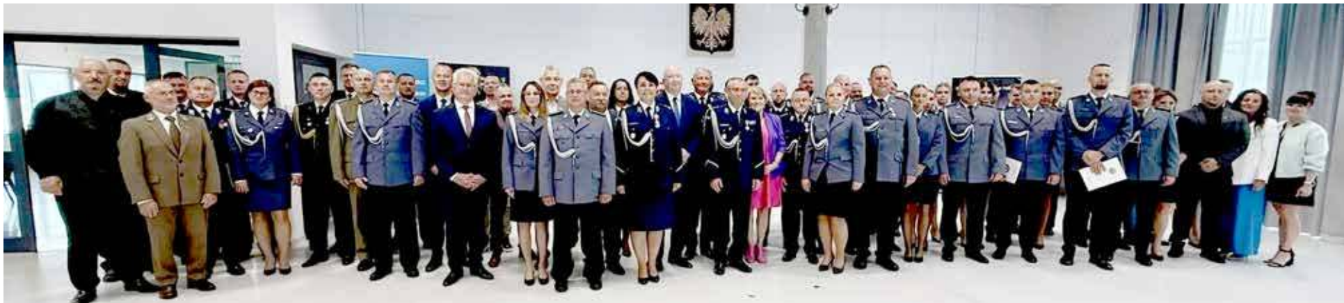
W ZAZ-ie odbyło się święto Policji

W ubiegłym tygodniu odbyły się Powiatowe Obchody Święta Policji. Miały one miejsce w Zakładzie Aktywności Zawodowej w Łozienicy. W ich trakcie kilkudziesięciu policjantów otrzymało awanse. Przyznawano również odznaczenia.