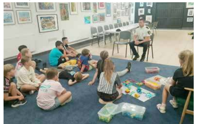
Dzieci uczyły się o bezpieczeństwie