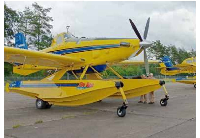
Niezwykłe samoloty zagościły na goleniowskim lotnisku