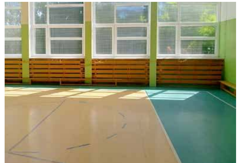
Salę gimnastyczną w stepnickiej szkole czeka modernizacja