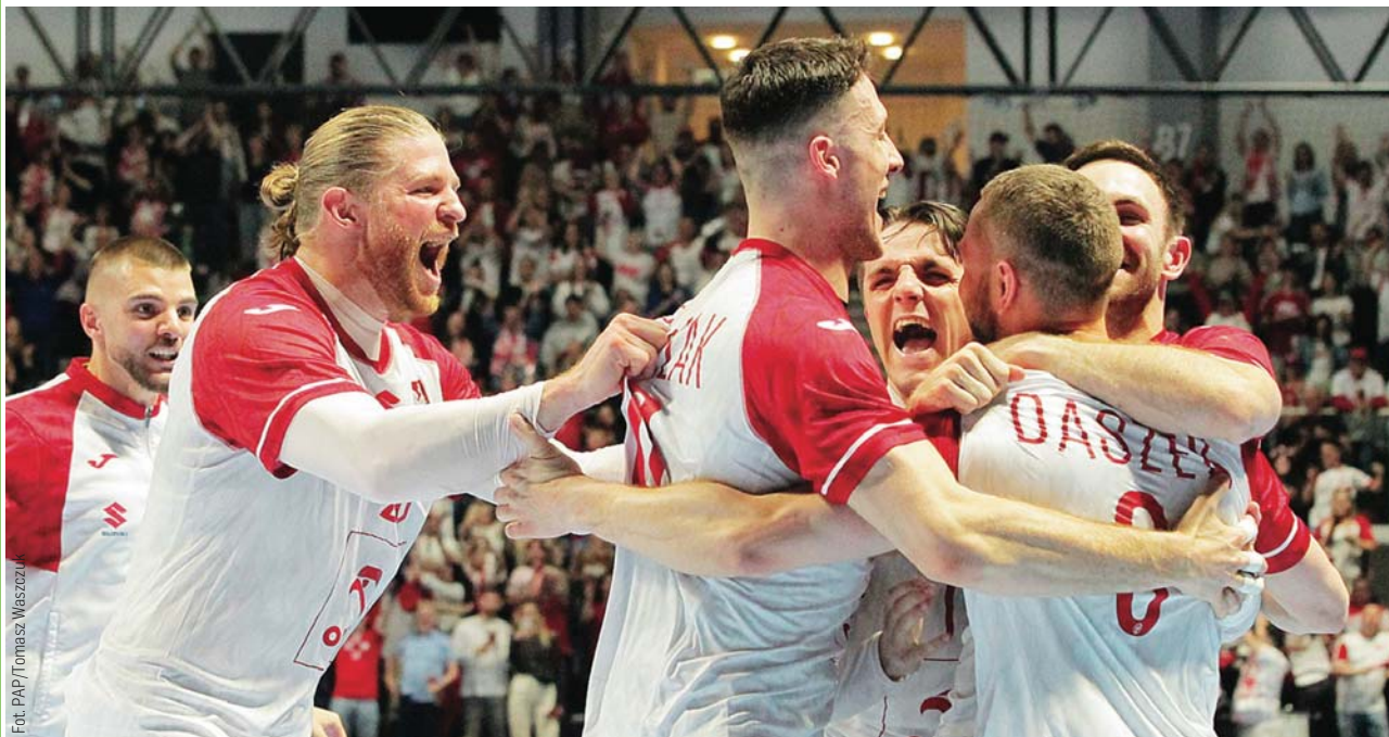
Polacy zagrają na mistrzostwach świata i na tym... koniec dobrych informacji

PILKA RĘCZNA \\ Biało-czerwoni po dramatycznym dwumeczu z Austrią wywalczyli awans na przyszłoroczne mistrzostwa świata, jednak Karol Bielecki, znakomity przed laty zawodnik, nie kryje rozczarowania obecnym poziomem polskiego szczypiorniaka.