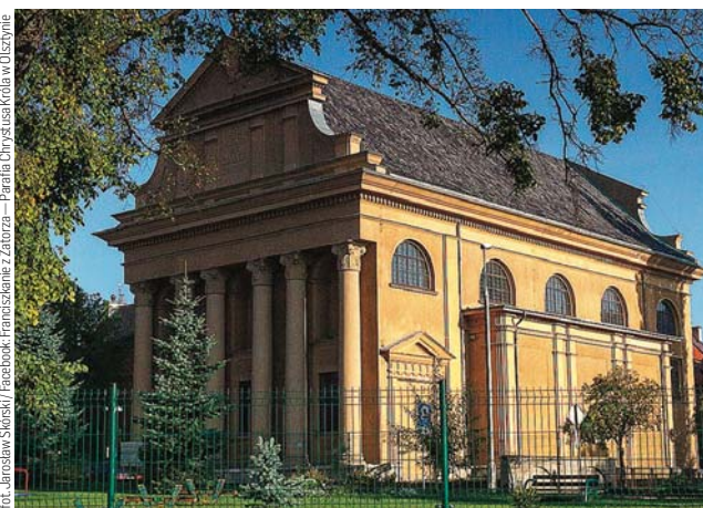
Kościół franciszkanów na olsztyńskim Zatorzu będzie tematem spotkania w Archiwum Archidiecezji Warmińskiej