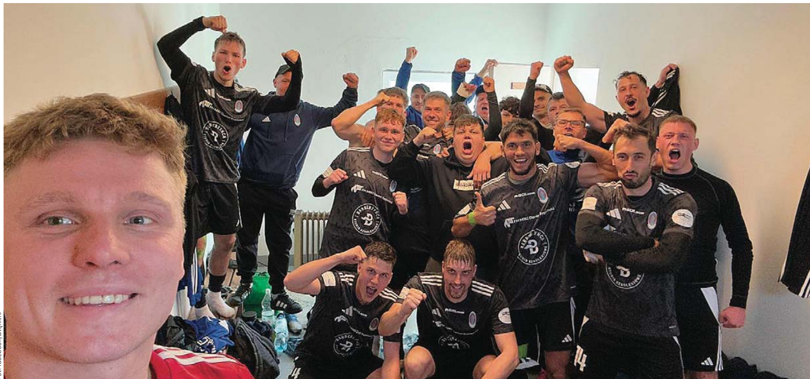
Szatnia Błękitnych Pasym po zwycięstwie nad rezerwami Stomilu

PIŁKA NOŻNA W grupie 1 okręgowki 26. kolejka należała do gości, którzy wygrali aż pięć meczów. Naki przekroczyło granicę stu zdobytych goli, a w Górowie Olimpia jedynie zremisowała, przez co znacznie zmalały jej szanse na grę w barażach.