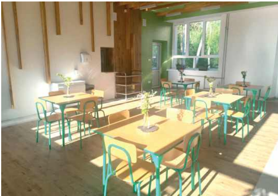
„Szkolne Bistro” zachwyca przestrzennością, naturalnością i dbałością o szczegóły

- „Szkolne Bistro” zachwyca przestrzennością, naturalnością i dbałością o szczegóły - przekazuje szkoła.