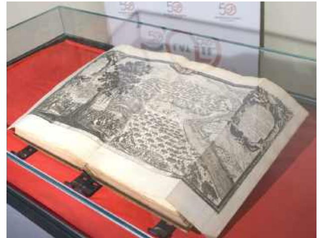
Na wystawie stałej w Muzeum Zamek w Janowcu będzie można oglądać teraz XVII-wieczną księgę Samuela Pufendorfa z rycinami Erika Dahlberga ukazującymi m.in. Janowiec

- Zarząd województwa nie zapomina o takiej perle Lu-