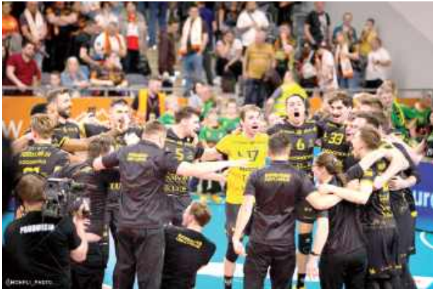
Siatkarze z Lublina awansowali do finału PlusLigi! Pierwszy raz w historii klubu

W pierwszym secie miejscowi szybko narzucili swoje tempo i prowadzili 7:2. To oznaczało, że lublinianie staną naprawdę przed niezwykle trudnym zadaniem, ale w kolejnej części partii w ogóle się go nie przestraszyli. Trzypunktowa seria dała im zniwelowanie do strat do wyniku 9:10, a chwilę później