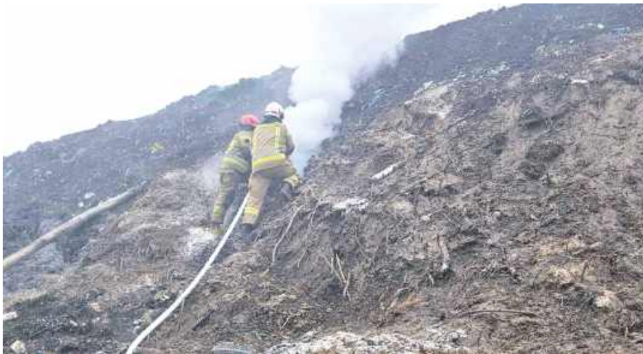
W ciągu kilku ostatnich lat strażacy co jakiś czas wzywani są do gaszenia pożarów na wysypisku śmieci w Poniatowej Wsi. Ostatnie miały miejsce w lutym i w kwietniu br.