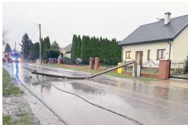
Po nawałnicy wielu mieszkańców powiatu puławskiego przez wiele godzin nie miało prądu. Wszystko przez pozrywane linie energetyczne i uszkodzone słupy