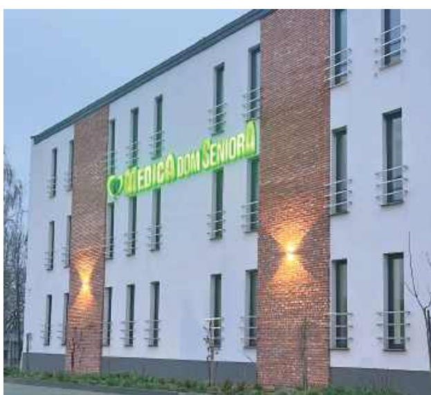
Wstępnie budynek miał być gotowy pod koniec 2022 roku, później termin uległ zmianie i otwarcie miało nastąpić w 2023 roku. Niestety znów się nie udało. Ale w końcu jest i już zaprasza do siebie seniorów

Obiekt pomieści ponad 100 osób starszych, a miesz-