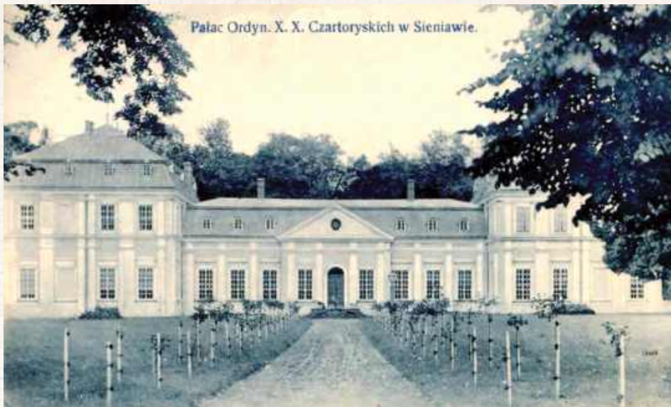
W sieniawskim Pałacu ślad po Szkatule się urywa. Niemieccy żołnierze rozszabrowali odkryte w piwnicach skarby Czartoryskich. Historykom sztuki udało się wpaść na trop tylko niektórych z nich