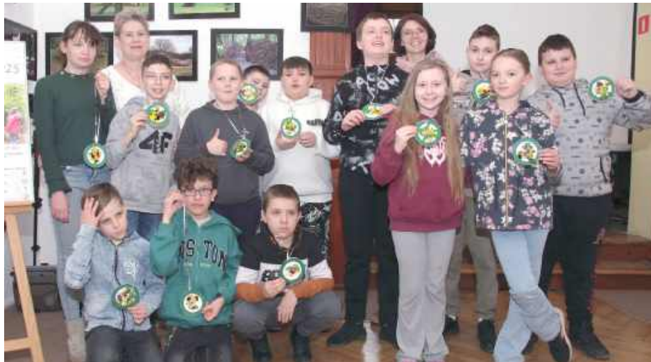
W sumie podczas „Zawilcowych dni” Muzeum odwiedziło ponad 190 osób

- W sumie podczas „Zawilcowych dni” Muzeum