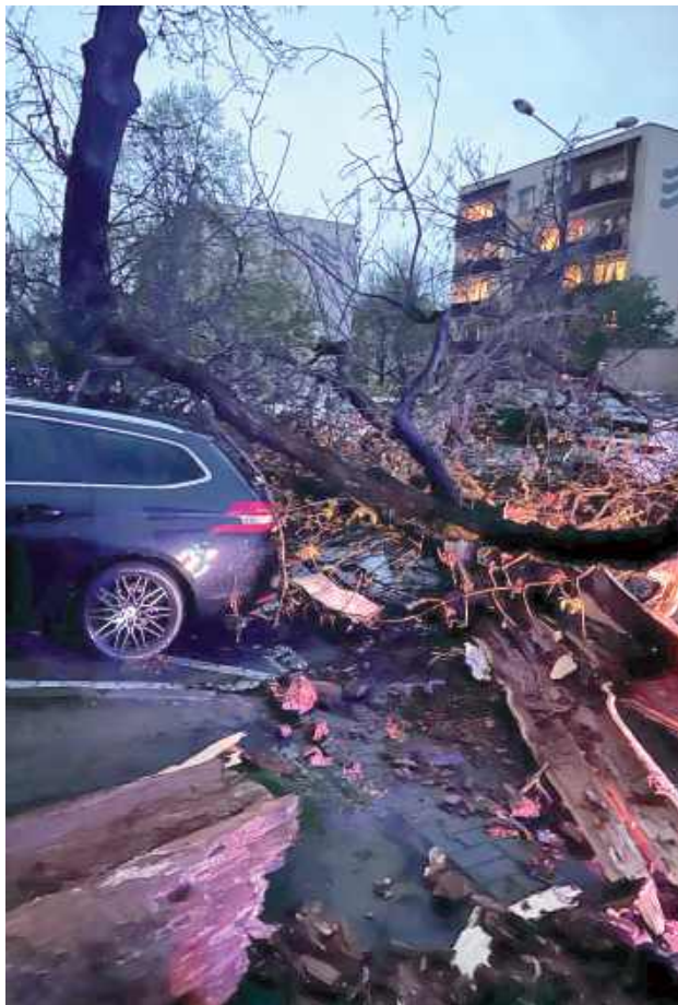
Silny wiatr nłamał drzewa, które upadały także na zaparkowane samochody

Najwięcej interwencji odnotowano na terenie Miasta Puławy, Gminy Puławy, Gminy Wąwolnica, Gminy Kofiskowola, Gminy Janowiec oraz Gminy Kazimierz Dolny. Łącznie w usuwaniu skutków brało udział 42 jednostki OSP z terenu powiatu puławskiego (około 250 strażaków ratowników), w tym 18 z 22 włączonych do krajowego systemu ratowniczo-gaśniczego oraz 6 zastępów z KP PSP z Puławy