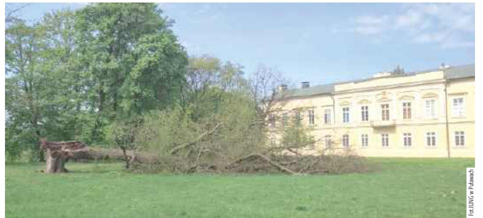
Wichura nie oszczędziła również zabytkowego Parku Czartoryskich. Silny wiatr połamał ok. 30 drzew. Ich usuwanie może potrwać nawet 2 miesiące, ze względu na to, że teren ten podlega konserwatorowi zabytków i IUNG jako administrator Parku musi wystąpić do niego o zgodę na usunięcie wiatrołomów

Z uwagi na bezpieczeństwo osób przebywających w parku, już następnego dnia rano,