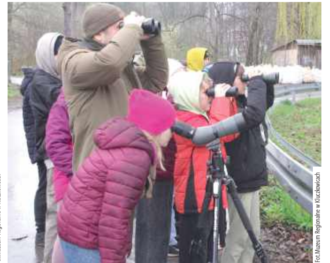
Najciekawsza część zajęć odbywała się na świeżym powietrzu

Na koniec odbywały się zajęcia plastyczne. Dzieci wykonywały medaliony, używając przyniesionych z lasu materiałów organicznych. Z szarego papieru pomalowanego farbami akrylowymi młodzi