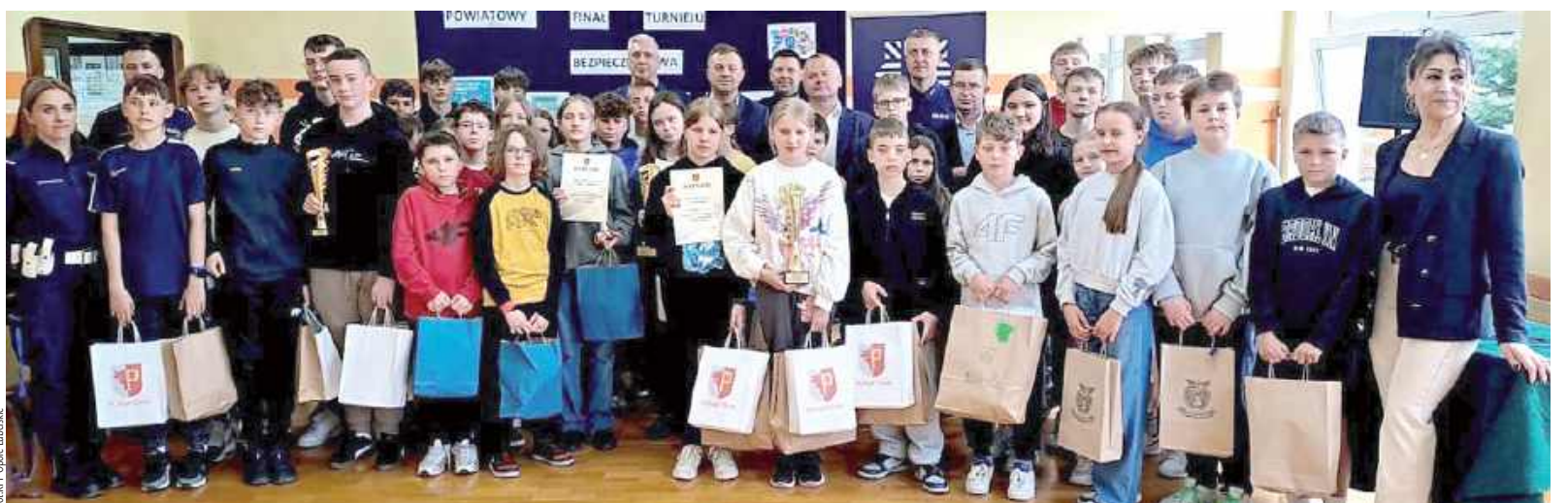
W Turnieju udział wzięli uczniowie ze wszystkich szkół powiatu opolskiego. W kategorii klas starszych szkół podstawowych bezkonkurencyjni okazali się uczniowie Szkoły Podstawowej w Zagłobie, a w kategorii klas młodszych - uczniowie Szkoły Podstawowej w Niezabitowie

W piątek, 25 kwietnia w Zespole Szkół Ogólnokształcących w Józefowie nad Wisłą odbył się etap powiatowy Turnieju Bezpieczeństwa w Ruchu Drogowym. Na szczeblu wojewódzkim powalczą uczniowie z Niezabitowa i z Zagłoby.