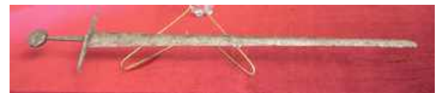
Zbiory muzealne wzbogacił także miecz typu Castillon z XV w