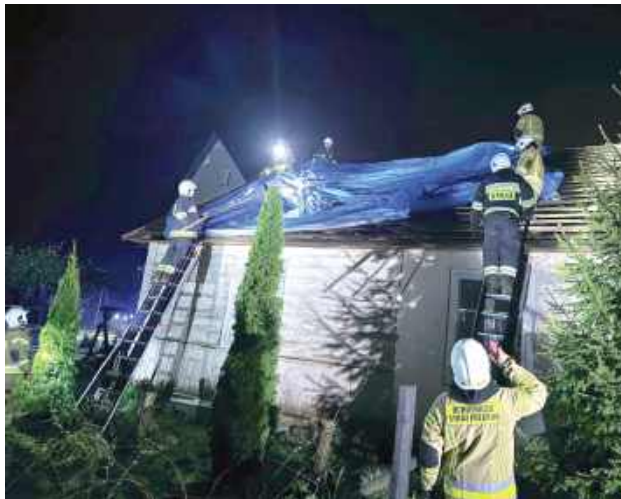
Strażacy w całym powiecie zostali postawieni na nogi. Ochotnicy z gmin, które żywioł ominął, zostali przekierowani do pomocy tam, gdzie trzeba było ratować ludzkie mienie

(16 osób) i 1 zastęp z KM PSP Lublin (2 osoby). Pozostałe 4 jednostki OSP włączone do KSRG pozostały w macierzystych jednostkach jako zabezpieczenie operacyjne własnej gminy - informuje na swoim oficjalnym profilu na Facebooku KP PSP w Puławach.