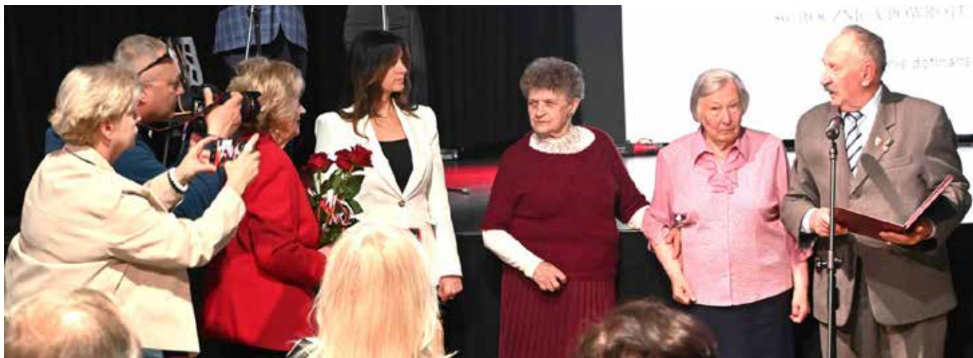
Podczas uroczystości wręczono tytuły Honorowych Członków Zachodniopomorskiego Związku Sybiraków

– My, pokolenie sybiraków, jesteśmy zobowiązani, by ocalić od za- ➤