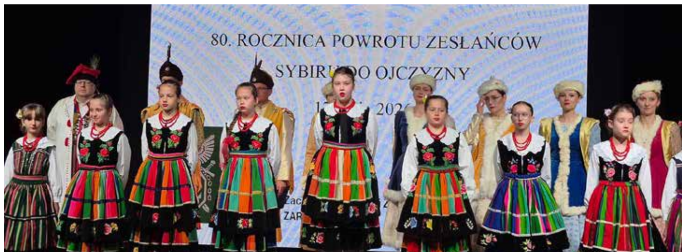
Zespół Pieśni i Tańca Ziemi Szczecińskiej „Krag”

80 lat po powrocie sybiracy znów byli razem. Już nie jako przesiedleńcy, lecz jako strażnicy pamięci. I choć ich droga do Ojczyzny była długa i bolesna, to właśnie oni pokazali, że nawet po najdłuższym wygnaniu można wrócić – jeśli nie do dawnego domu, to do prawdy o własnym losie. ■