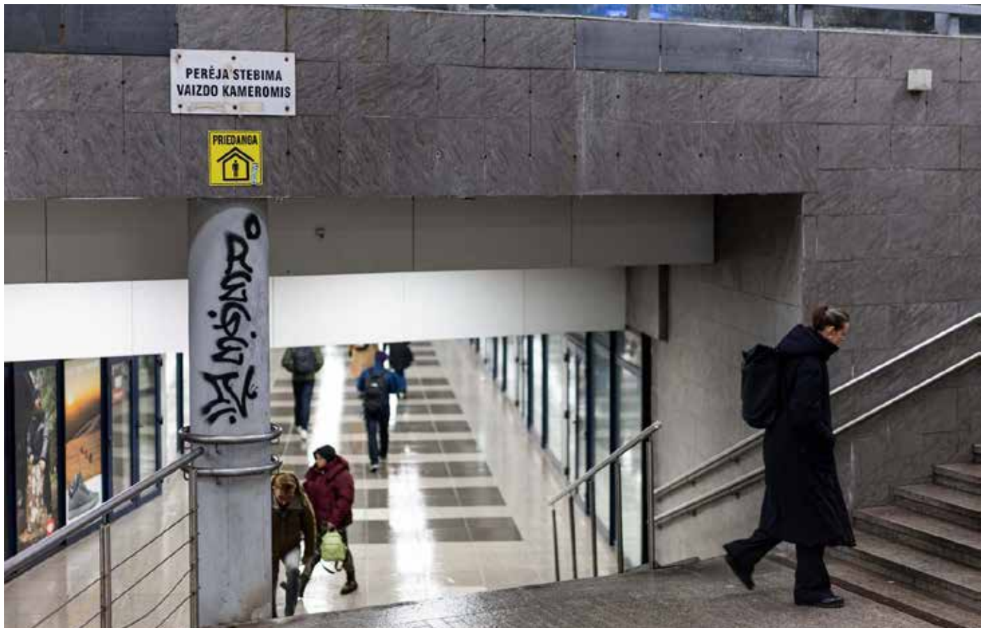
Po otrzymaniu komunikatu ostrzegawczego o zagrożeniu z powietrza placówki powinny działać zgodnie z procedurami

20 maja mieszkańcy Litwy otrzymali powiadomienia o czerwonym alarmie, świadczącym o zagrożeniu z powietrza. Specjaliści zastrzegają, że podobne alerty mogą się pojawiać również w przyszłości. Dlatego bardzo ważne jest, aby mieszkańcy Litwy wiedzieli, jak powinni się zachować w placówkach oświatowych oraz miejscach pracy w sytuacjach zagrożenia.