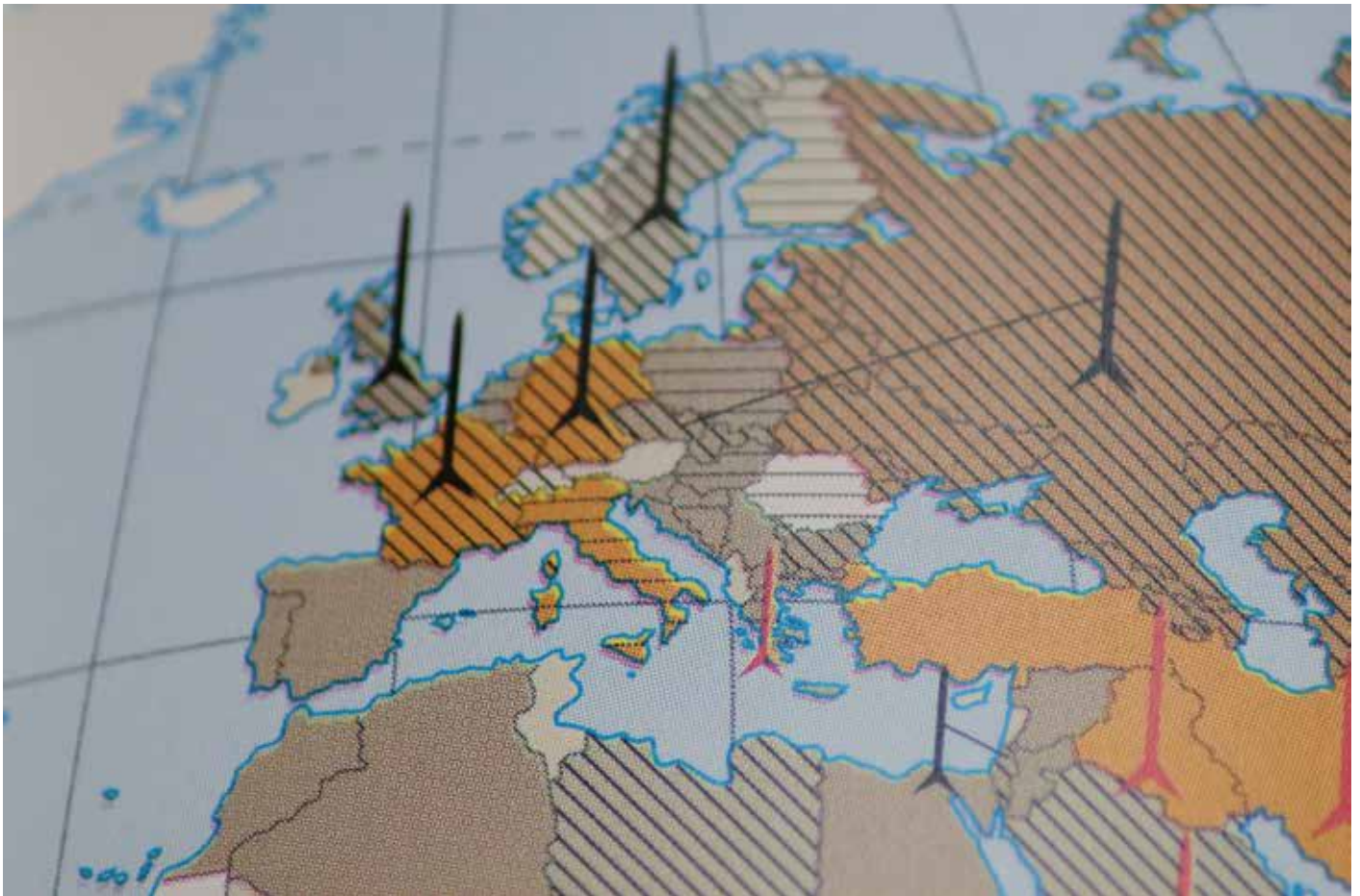
Rosja względem Zachodu używa szantażu nuklearnego na szeroką skalę