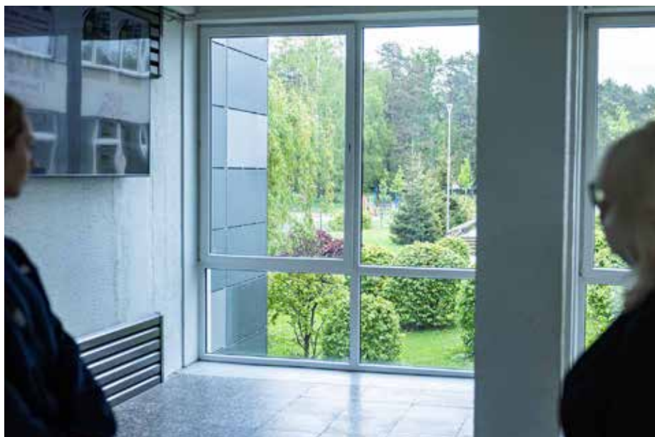
Szkoła nasadziła na terenie szkoły krzewy leszczyny, aby podkreślić zielony charakter nomen omen Leszczyniaków