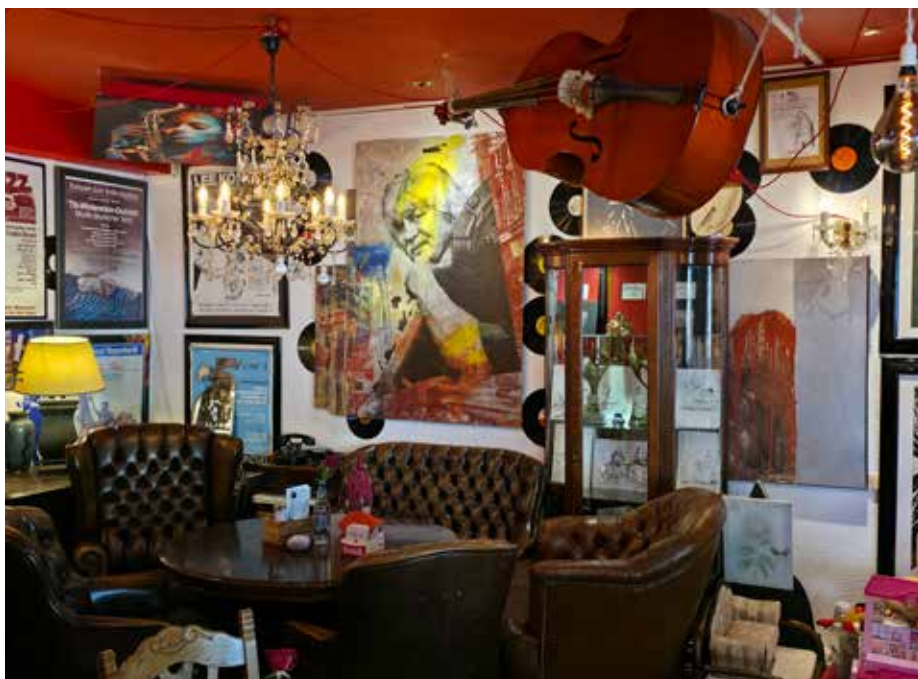
Restauracja „Gdańska” w Oberhausen szybko stała się dla miejscowych jednym z ulubionych miejsc gastronomicznych

Gołębiewscy postawili na kuchnię polską. W menu odnajdujemy: rosół polski z makaronem, żurek, barszcz z krokietem, a w sezonie chłodnik. Dania główne to: golonka pieczona pomorska, gołąbki, kluski śląskie, kapusta zasmażana, bigos, co jakiś czas kaszanka i zawsze – kotlet schabowy, rolada wieprzowa, pieczenie, do tego