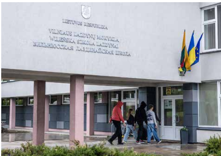
Szkoła w Leszczyniakach jest trójjęzyczna – ma klasy litewskie, polskie i rosyjskie