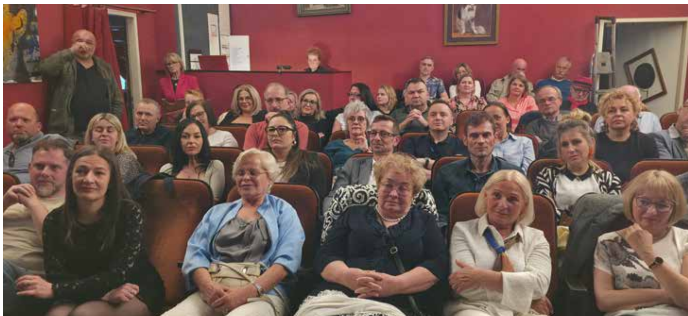
Adaptacje kolejnych przestrzeni w „Gdańskiej” przyniosły powstanie sceny teatralnej na ok. 50 miejsc

Gdańska (restauracja, teatr, hotelik). Altmarkt 3, 46045 Oberhausen