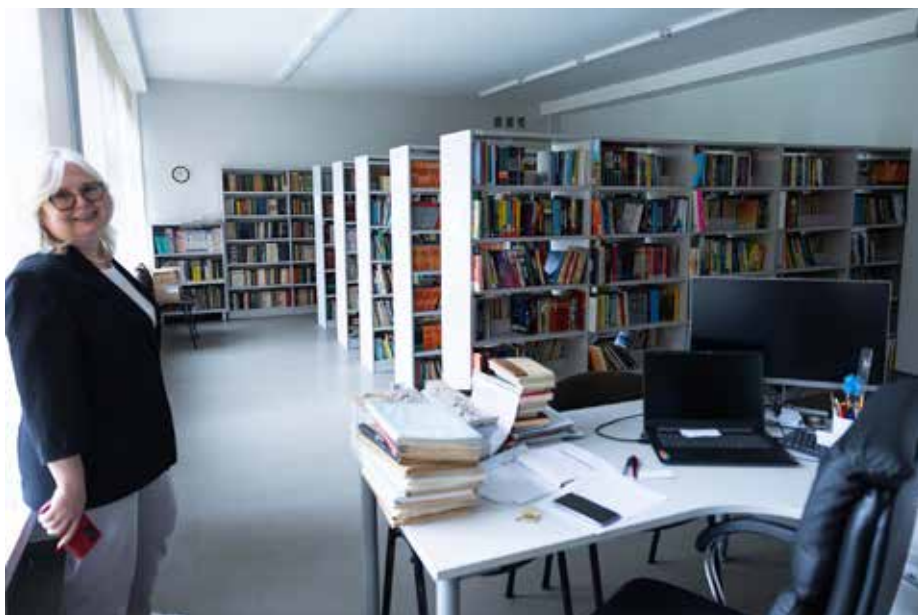
Do dyspozycji uczniów oddana jest świeżo wyremontowana biblioteka – zadbana i dobrze zorganizowana

Czy to znaczy, że niektórzy rosyjscy uczniowie też ustawiają sobie język polski? >>