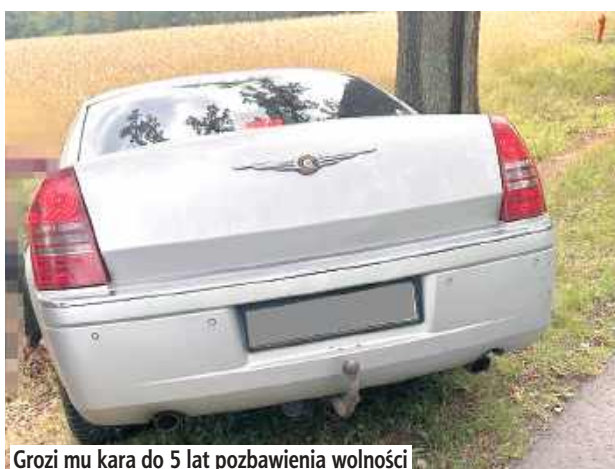
Grozi mu kara do 5 lat pozbawienia wolności

- Międzyrzecy kryminalni w trakcie pełnionej służby zwrócili uwagę na Chryslera, którego kierowca nie trzymał toru jazdy. Z uwagi na podejrzenie, że mężczyzna może znajdować się na „podwójnym gazie”, natychmiast ruszyli w pościg, dając kierowcy sygnały świetlne i dźwiękowe do zatrzymania. Jednak kierowca osobówki ani myślał zatrzymać się. Przyspieszył, kontynuując jazdę. Po chwili stracił panowanie nad autem. Zjechał