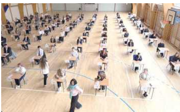
Zdawalność Matury 2025 w I Liceum Ogólnokształcącym już dzisiaj wynosi 92% podczas, gdy w kraju ogółem 80% a w liceach ogólnokształcących 86%

W naszym liceum powód do radości ma już 117 ze 127