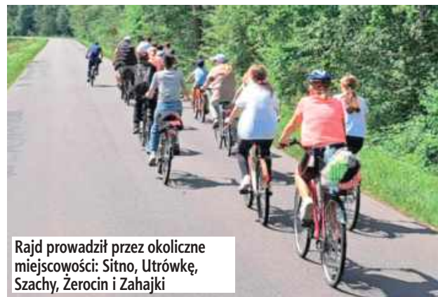
Rajd prowadził przez okoliczne miejscowości: Sitno, Utrówkę, Szachy, Żerocin i Zahajki

– Super rajd! – podsumował jeden z uczestników wydarzenia. – Świetnie zorganizowany, trasa ciekawa, a meta na Stolicy w Międzyrzeczu to strzał