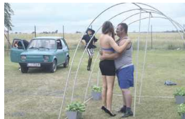
Kultowa scenka z doskonałej komedii „Kogel - Mogel” zebrła niesamowity aplauz. W rolę docenta Wolańskiego i innych bohaterów, szczególnie Pauliny, koleganki Pawła – wcielił się mieszkańcy Woli Chomejowej. Mistrzostwo!