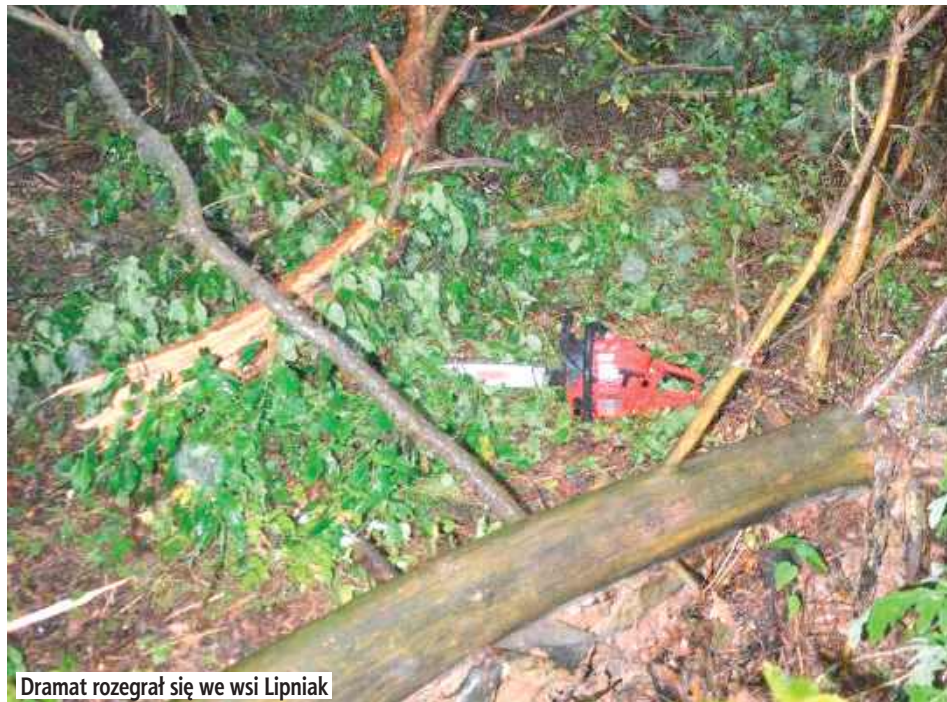
Dramat rozegrał się we wsi Lipniak

- Nieprzytomny i z obrażeniami głowy został przetransportowany do szpitala