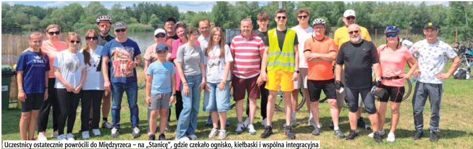
Uczestnicy ostatecznie powrócili do Międzyrzecza – na „Stanicę”, gdzie czekało ognisko, kiełbaski i wspólna integracyjna

Mieszkańcy Międzyrzecza Podlaskiego i okolic w sobotę, 12 lipca, wzięli udział w wyjątkowym wydarzeniu – Rowerowym Rajdzie organizowanym przez stowarzyszenie Razem zmieniamy Międzyrzec Podlaski i okolice.