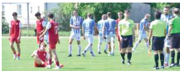
Na kibiców czeka aż 21 pasjonujących spotkań, które zainaugurują tegoroczne rozgrywki w regionie

Start Gózd - ŁKS Łazy Unia Krzywda - Orkan Wojcieszaków Olimpia Okrzeja - Sokół Adamów Janovia Janów Podlaski - KS Drelów Bizon Jeleniec - Dwernicki Stoczek Łukowski Agrosport Leśna Podlaska - Victoria Parczew Bystrzyca Borki - AZ-BUD I Komarówka Podlaska Armata Stoczek Łukowski - Orłęta II Radzyń Podlaski Lesovia Trzebieszów - Kujawiak Stanin Podlasie II Biała Podlaska - Orzeł Czemierniki Niwa Łomazy - Grom Kąkolwnica Polesie Serokomla - Absolwent Domaszewnica Bór Dąbie - Orłęta Gołyszyn Gręzovia Gręzówka - Bad Boys Zastawie Podlasie Biała Podlaska U-17 - Red Sielczyk