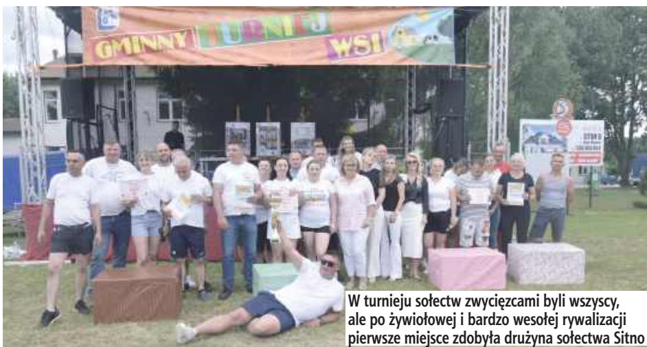
W turnieju sołectw zwycięzcami byli wszyscy, ale po żywiołowej i bardzo wesołej rywalizacji pierwsze miejsce zdobyła drużyna sołectwa Sitno

Podczas Turnieju sołectwo Wola Chomejowa rozbawiło publiczność do łez, prezentując doskonałą scenkę inspirowaną kultowym filmem „Kogel Mogel”. Świetna gra aktorska, dopracowane stroje i znakomite oddanie klimatu PRL-u sprawiły, że widzowie poczuli się jak na prawdziwym planie filmowym. To była scenka na najwyższym poziomie – z humorem, sercem i pomysłem. Partnerem wydarzenia było Województwo Lubelskie, Lubelskie Smakuj Życie, Urząd Marszałkowski Województwa Lubelskiego w Lublinie.