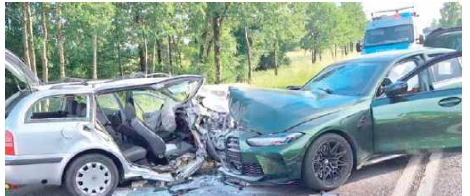
Dramat rozegrał się 1 czerwca 2024 roku około godziny 18 w Radzynie Podlaskim

Sledztwo ws. wypadku wszczęła Prokuratura Rejonowa w Radzynie. - Postawiliśmy kierowcy zarzut spowodowania wypadku ze skutkiem śmiertelnym. Mężczyzna przyznał się do winy, zastosowaliśmy wobec niego dozór policji, zakaz opuszczenia kraju oraz poręczenie majątkowe w kwocie 15 tysięcy