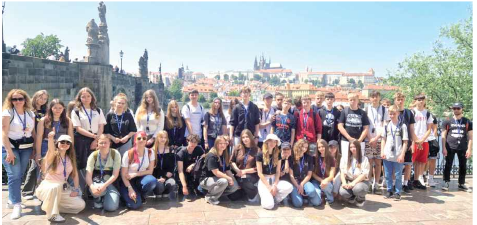
Pod opieką nauczycieli i przewodnika uczniowie przemierzali setki kilometrów, by poznać historię, kulturę i przyrodę regionu Dolnego Śląska oraz części Czech

Dzień rozpoczął się bardzo wcześnie – śniadanie jedliśmy już o 6:30. Następnie wyruszyliśmy do Czech, gdzie zwiedziliśmy malowniczy rezerwat przyrody Skalne Miasto. Spacer wśród unikalnych formacji skalnych zrobił na nas ogromne wrażenie. Po powrocie zatrzymaliśmy się w centrum Karpacza, gdzie mieliśmy czas na krótki spacer i zakup pamiątek. Dzień zakończył się obiadem w pensjonacie.