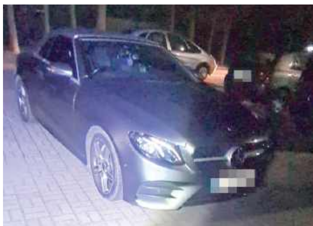
Kobieta została zatrzymana przez mundurowych i trafiła do policyjnego aresztu

- Kiedy na miejsce dotarli policjanci, podszedł do nich mężczyzna, informując, że to on wezwał Policję. Dodał, że jechał ulicami miasta i w pewnym momencie zauważył, jak kierująca samochodem marki Mercedes na rondzie uderza w znak drogowy, po czym odjeżdża z miejsca zdarzenia. Mężczyzna pojechał