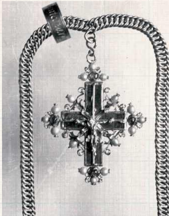
Jednym z najbardziej godnych uwagi przedmiotów przechowywanych w Szkatule był krzyż napierśny należący do Zygmunta Starego. Oprócz wielkiej wartości historycznej stanowił wybitne dzieło sztuki jubilerskiej: na wążącym 21,5 tuta (ok. 300 gramów) złotym łańcuchu długości 82 cm, o podwójnie przeplatanych ogniwach, zawieszono zdobiony na końcach rubinami otoczonymi perłami krzyż z czarnego jaspisu. Dołączono do niego srebrny pierścień z napisem „Zygmunta Pierwszego”

Wojska niemieckie do pałacu weszły już 14 września i skrytka została zdemaskowana niemal natychmiast. Żołdactwo nie doceniło znaczenia hebanowego kufra, widząc tylko stanowiące jego ozdobę szlachetne kamienie i nieco, zupełnie dla nich z niczym się nie kojarzących, błyskotek w środku.