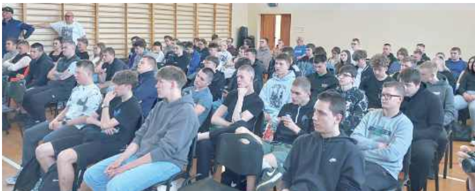
Uczniowie RCEZ na spotkaniu z piłkarzem

Spotkanie było elementem zadania „Aktywni Młodzi”,