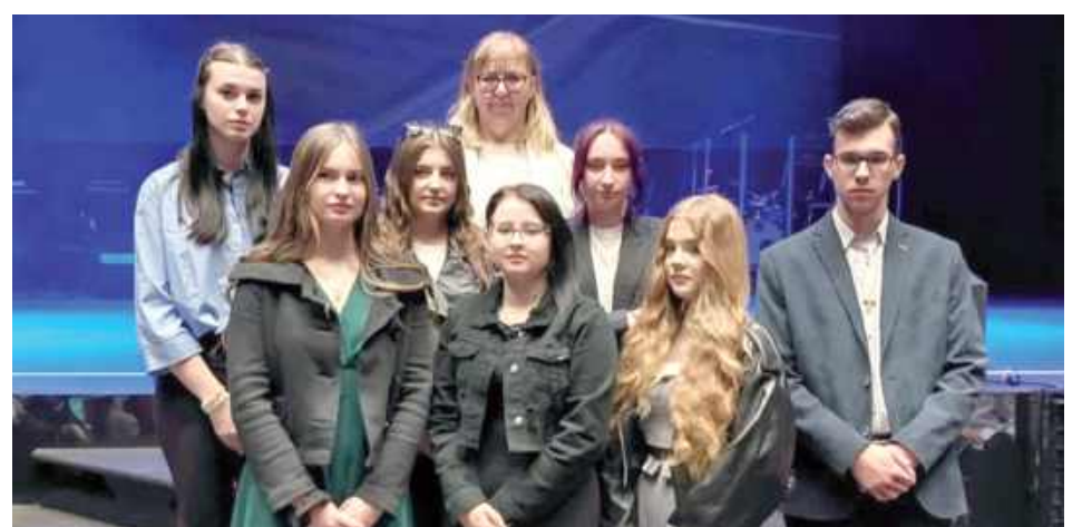
Stypendyści z RCEZ

16 uczniów Regionalnego Centrum Edukacji Zawodowej w Lubartowie zostało uhonorowanych stypendiami w ramach programu stypendialnego „Lubelskie wspiera uzdolnionych 2024-2025” oraz „Lubelska kuźnia talentów 2024-2025”. Stypendia zostały