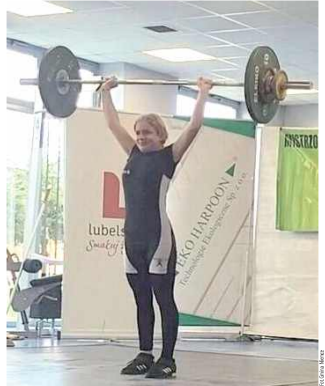
Sztanga nad głową, bój zaliczony