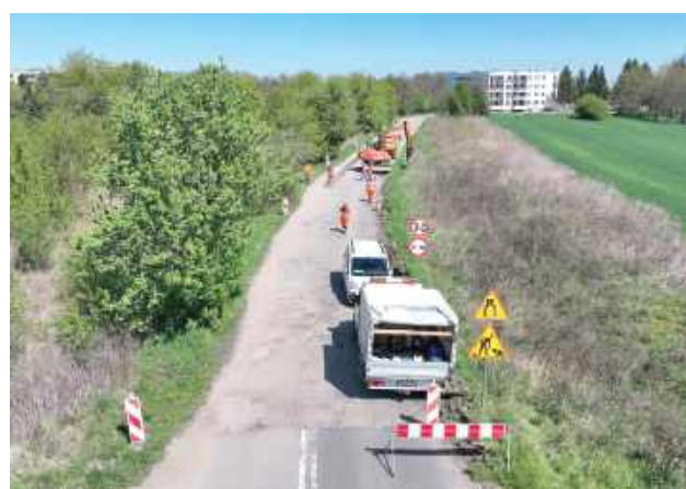
Zakończenie robót planowane jest na sierpień 2025 roku

Ulica Cichy Zakątek zyska szczególne znaczenie dla mieszkańców nowego osiedla wybudowanego przez spółdzielnię mieszkaniową „Skarbek”. Dzięki inwestycji zapewniony zostanie wygodny i bezpieczny dojazd do bloków.