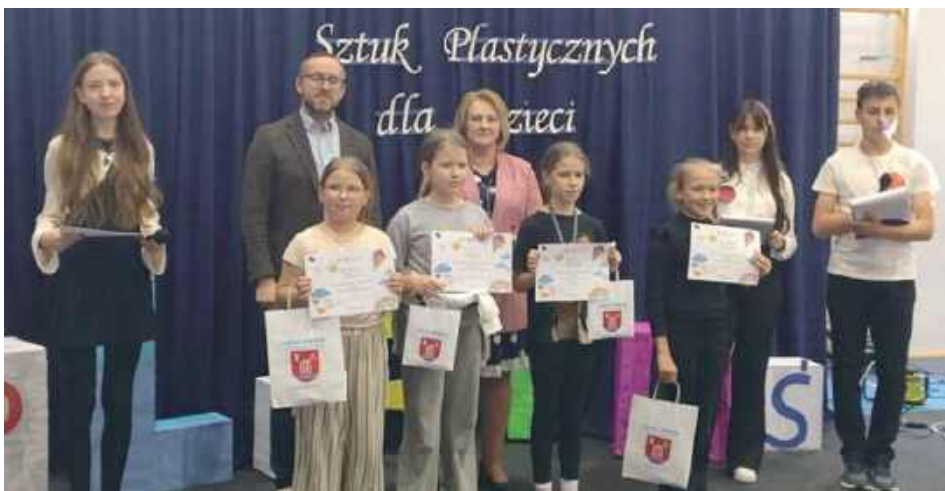
Laureaci plastycznego konkursu w gminie Niemce