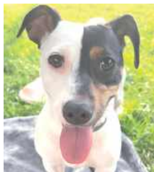
Bambi, Oliwia Bednarczyk, Kowala Druga