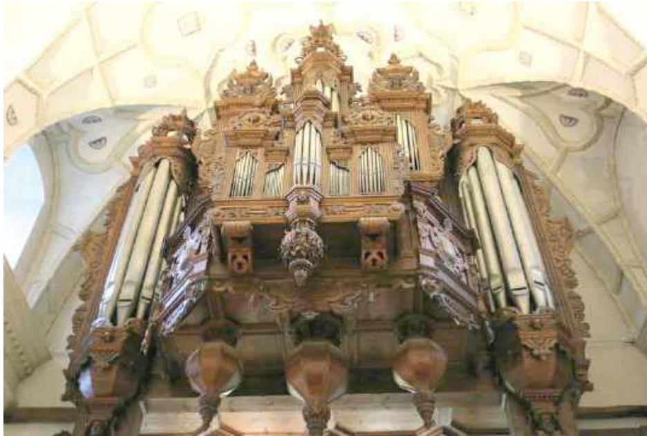
Kazimierskie organy najprawdopodobniej są najstarszymi w całości zachowanymi organami w Polsce

- Stąd 11 kwietnia tego roku przy udziale ekspertów z Narodowego Instytutu Dziedzictwa (jednocześnie Rzeczników Ministra Kultury i Dziedzictwa Narodowego) - miały miejsce oględziny organów w Kazimierzu Dolnym - w kontekście