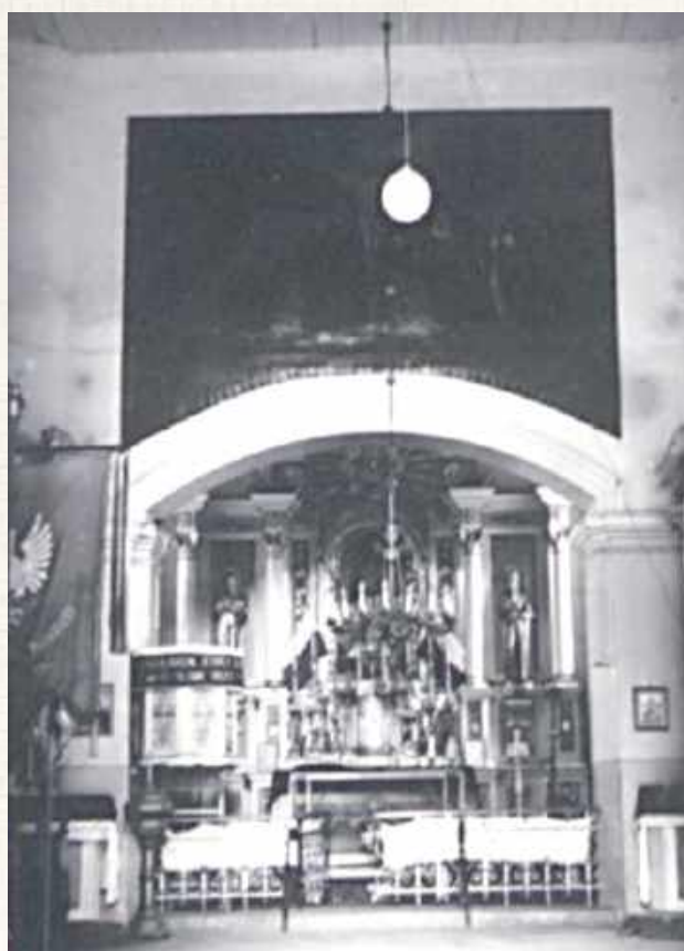
Wnętrze dawnej cerkwi unickiej, obecnie kościoła pw. Opieki świętego Józefa na zdjęciu z lat 60. XX wieku na tzw. „białej” karcie zabytku na portalu zabytek.pl