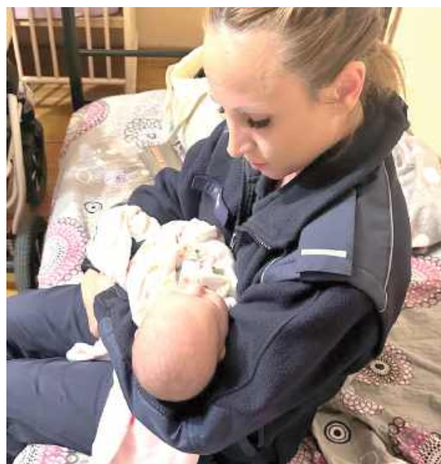
Do czasu przyjazdu wezwanej na miejsce karetki pogotowia dziećmi zajęła się policjantka

Po otrzymaniu zgłoszenia na miejsce dyżurny skierował patrol. Na podwórku pod domem funkcjonariusze zastali dziecięcy wózek, a w nim śpiące niemowlę oraz kilkuletniego chłopca. Dzieci przebywały na dworze bez nadzoru rodzica. Ponadto w wózku, w którym znajdowała się dziewczynka, policjanci ujawnili dwie butelki alkoholu. Po chwili wyszła z domu ich matka, którą okazała się 37-letnia obywatelka Ukrainy. Mundurowi wyczuli od niej wyraźną woń alkoholu, jednak ta zaprze-