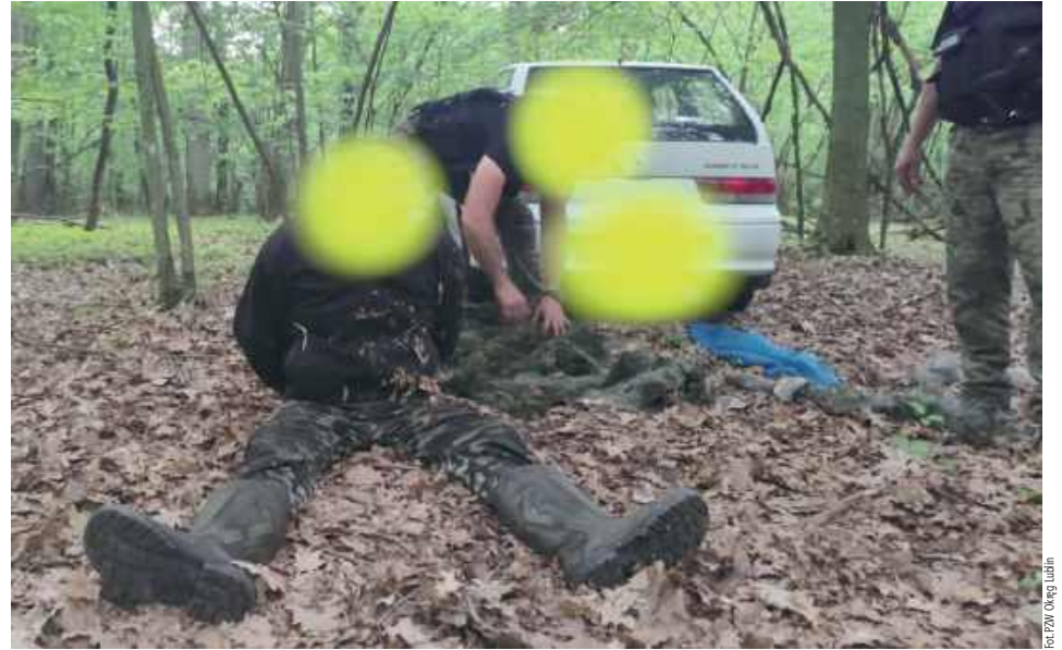
Mężczyźni zostali złapani na gorącym uczynku przy połowie