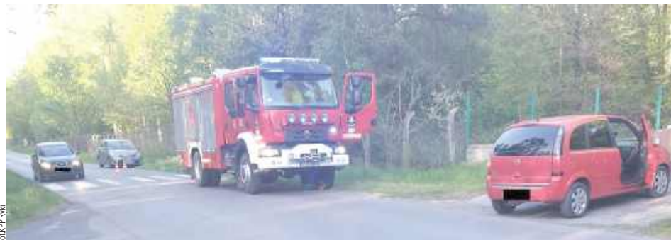
36-letnia mieszkanka Siedlec, kierująca oplem, nie zachowała należytej ostrożności podczas skrętu w lewo, w wyniku czego doprowadziła do zderzenia z kierującym motorowerem, który poruszał się drogą z pierwszeństwem przejazdu

Ze wstępnych ustaleń funkcjonariuszy wynika, że przyczyną zdarzenia było nieustąpienie pierwszeństwa przejazdu. 36-letnia mieszkanka