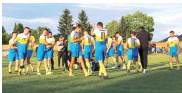
Pewny mecz i zasłużona wygrana w Piotrkowie. Ludwiniak Ludwin rozbił walczącego o utrzymanie rywala 0:4

Ludwiniak Ludwin wygodnie rozsiadł się w fotelu wicelidera. Po zwycięskim odrabianiu zaległości w Biskupicach przyszedł czas na kolejną ekipą ze strefy spadkowej - Piotrcovię Piotrków. Znaczący lokalnego futbolu wiedzą, jak trudne potrafią być spotkania z ekipami drżącymi przed relegacją. Znaczenie inaczej było w tym przypadku.