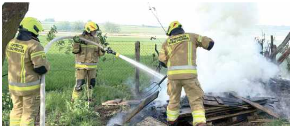
Najpierw strażacy gasili pożar desek i palet

Około godz. 16.46 paliły się deski i palety składowane przy budynku w Ostrówku Kolonii. Strażacy ugasiли pożar wodą, pogorzelisko zostało dokładnie przelane i skontrolowane kamerą termowizyjną. W akcji uczestniczyły zastępy JRG Lubartów, OSP Ostrówek i OSP Kamienowola. Bezpośrednio po zakończeniu tej akcji strażacy zostali skierowani do Leszkowic. Doszło tam do pożaru traw i lasu. Z ogniem walczyła już OSP Leszkowice. Przybyłe zastępy ugasiły po-