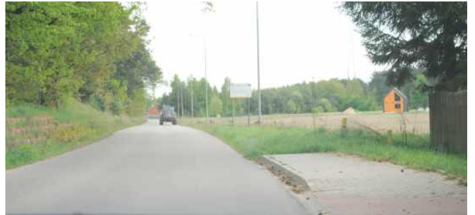
Mieszkańcy Wandzina chodzą pieszo na przystanek w Kopaninie. Jednak chodnik jest tylko po jednej stronie i kończy się kilkaset metrów za wsią, dalej trzeba iść poboczem. Ze względu na duży ruch jest to niebezpieczne

- Zgłaszaliśmy, żeby gmina wystąpiła do GDDKiA o lewoskręt, żeby można było bezpiecznie skręcić na Kopaninę. Rozmawiałem z wójtem, powiedział, że GDDKiA nie