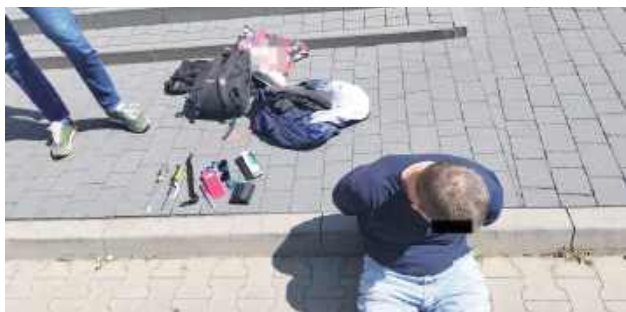
W ręce policjantów wpadł bezpośrednio po dokonaniu włamania w woj. łódzkim

Lublin: Do tymczasowego aresztu trafił 61-latek, który włamywał się do mieszkań. Szacuje się, że może mieć na koncie nawet kilkadziesiąt podobnych czynów, których dokonał w całym kraju.