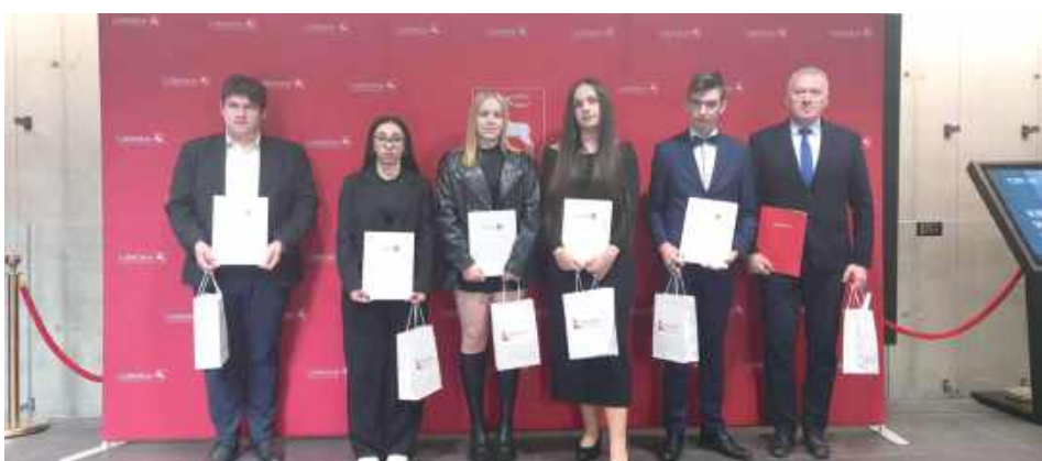
Stypendyści z ZSP Niemce i ich opiekun

Sala Operowa Centrum Spotkania Kultur w Lublinie była miejscem, gdzie zorganizowano uroczystą galę stypendystów. Wśród laureatów nie zabrakło uczniów Zespołu Szkół Ponadpodstawowych w Niemcach.