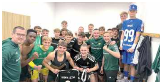
Radość łącznian po wygranej w Zamościu