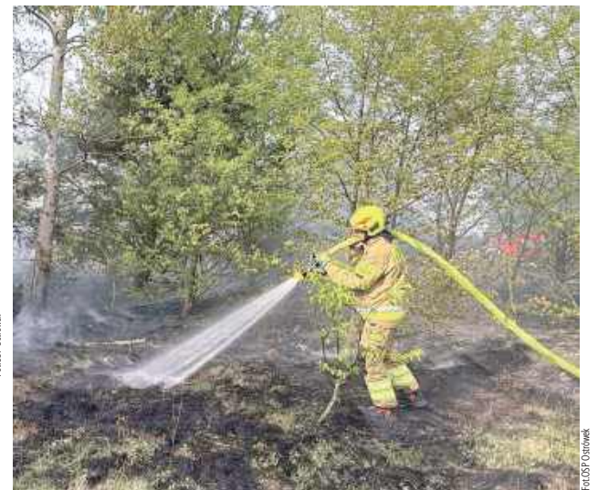
Bezpośrednio po tej akcji wzięli udział w gaszeniu pożaru lasu