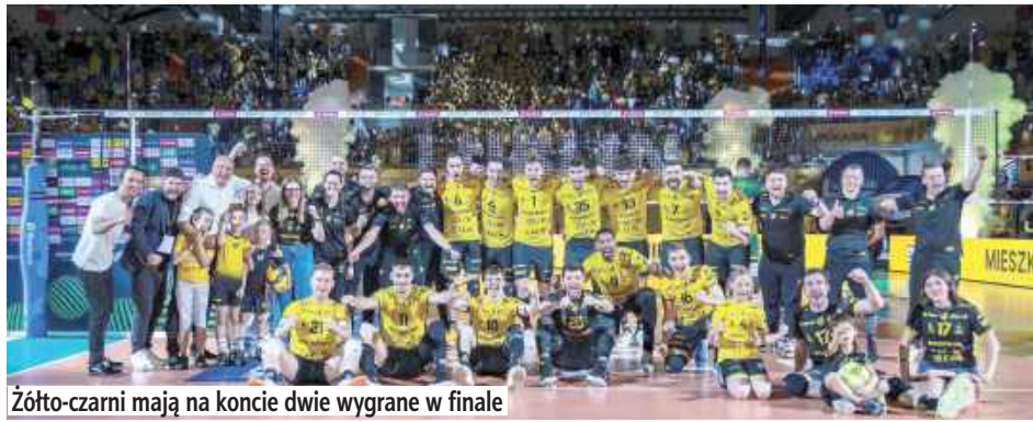
Złoto-czarni mają na koncie dwie wygrane w finale

W drugim finałowym meczu PlusLigi siatkarze Bogdanki LUK Lublin pokonali przed własną publicznością Aluron CMC Warta Zawiercie. Tym samym podopiecznych Massimo Bottiego dzieli od mistrzostwa Polski już tylko jedno zwycięstwo.