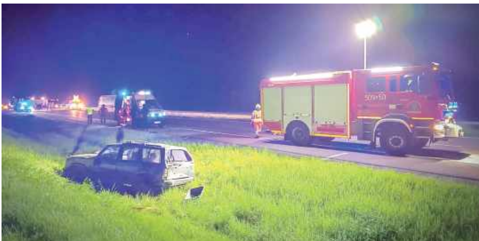
Kierowca dostawczego Renault uderzył w tył jadącego przed nim Jeepa, wskutek czego auto wypadło z drogi. Poważnych obrażeń doznała pasażerka Jeepa

Do zdarzenia doszło w nocy z niedzieli na poniedziałek (27/28 kwietnia), tuż po północy