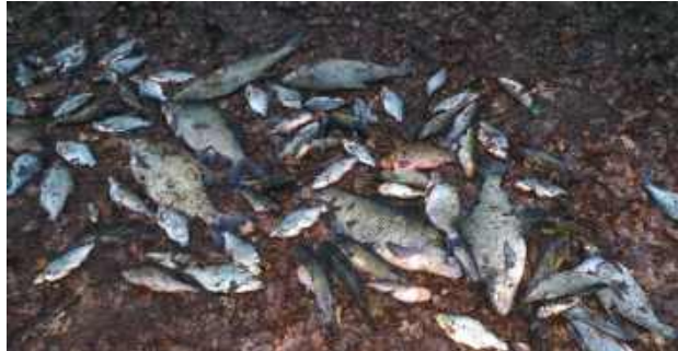
Ponad 30 kilogramów nielegalnie złowionych ryb przez kłusowników

Mężczyźni zostali ujęci na gorącym uczynku w trakcie odławiania ryb przy pomocy czterech sieci rybackich. W ich nielegalnym połowie znajdowało się około 30 kilogramów ryb różnych gatunków, w tym leszcz, płoć, wzdrega, krap, okoń, karaś