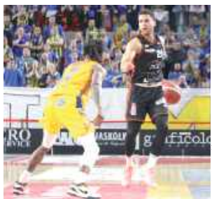
Start wywalczył play-offy pierwszy raz od 2021 roku