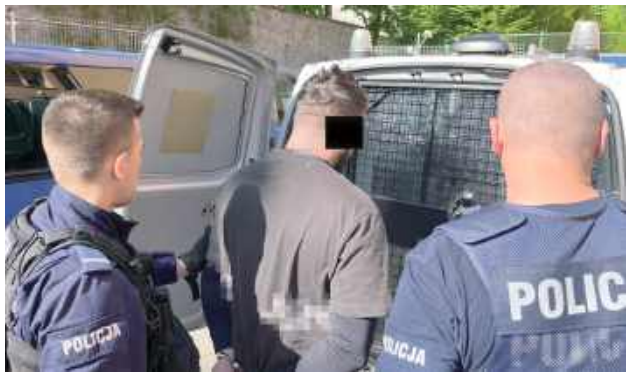
Przy okazji kontroli drogowej wyszło na jaw, że 32-latek szuka sądu w Pile, bo ma on do odbycia karę za oszustwo

Do zdarzenia doszło w minioną sobotę 26 kwietnia. Policjanci z puławskiej drogowki patrolowali okolicę i w miejscowości Góry w Gminie Markuszów sprawdzali, czy kierowcy przestrzegają przepisów i jeżdżą z odpowiednią prędkością. W pewnym mo-