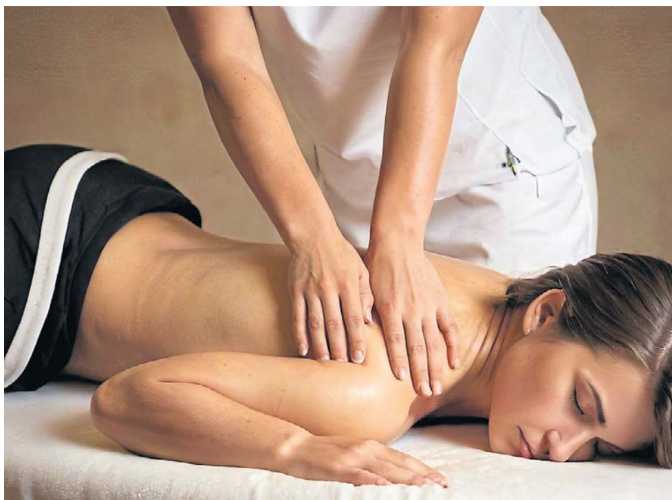
Przy wyborze sanatorium warto sprawdzić, jaką bazą zabiegową dysponuje

rzeń ortopedycznych i reumatologicznych oraz bogatą bazą zabiegową.