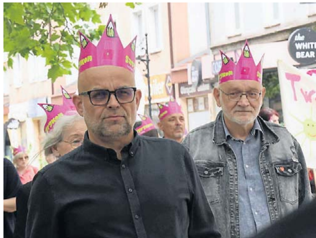
W kolorowym korowodzie 12 czerwca można było spotkać wiele postaci legnickiej kultury