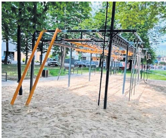
Ninja Park w Lesznie. Czy u nas też taki powstanie?

2. Park Active Games do pięcioboju nowoczesnego w Parku