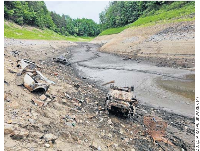
Jak dotąd na zboczach jeziora widać trzy wraki pojazdów

Ostatni raz woda z Jeziora Pilchowickiego była spuszczana 50 lat temu. Teraz pozostanie bez wody do zakończenia remonty zapory, które planowane jest w lutym 2028 roku.