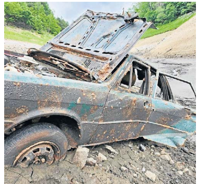
Samochody pochodzą sprzed kilku dziesięcioleci