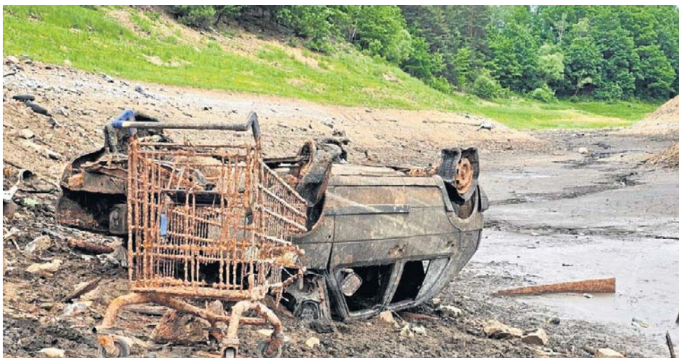
Wraz z obniżaniem się lustra wody można się spodziewać nowych „skarbów”