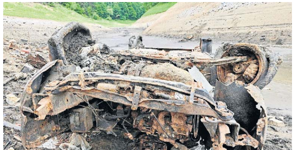
Skąd się tu znalazł ten złom? Czy ktoś kiedyś rozwikła te tajemnice?