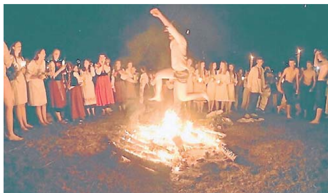
Szykuje się upalna pogoda i impreza, jakiej Legnica jeszcze nie widziała. Po wiankach będzie wielkie ognisko!

W godzinach 17:00-19:00 rzeką zawładną tradycyjne obrzędy świętojańskie. Mieszkańcy będą mogli wziąć udział w warsztatach pleceni wianków, po których nastąpi roz-