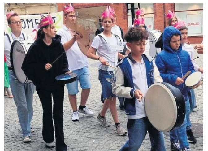
Jak co roku, licznie stawiała się młodzież. Za kilka lat to ona będzie organizować konkurs i wystawy Satyrykonu