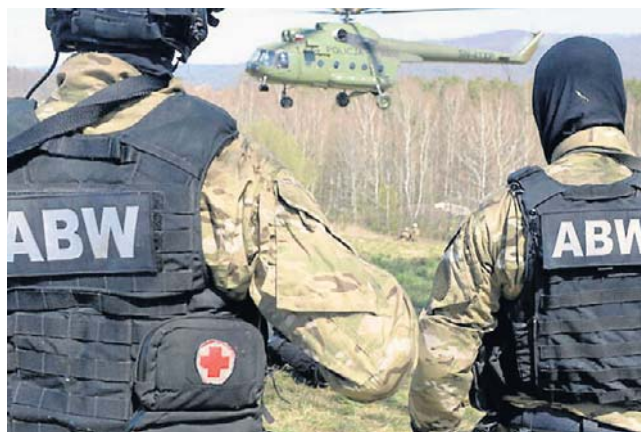
Swoje działania funkcjonariusze ABW przeprowadzili we wrześniu 2025 roku