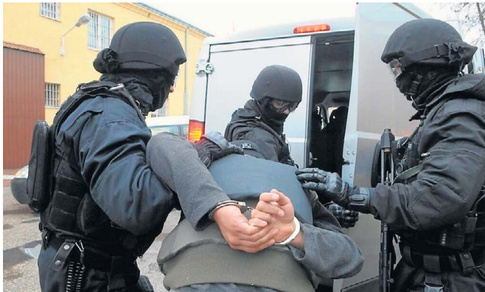
Polak i Rosjanin odpowiedzą przed legnickim sądem (zdjęcie ilustracyjne)

- Według opinii biegłych urządzenie umożliwia jednoznaczne sterowanie w pięciu osiach, co pozwala na wykonywanie skomplikowanych elementów z wysoką dokład-