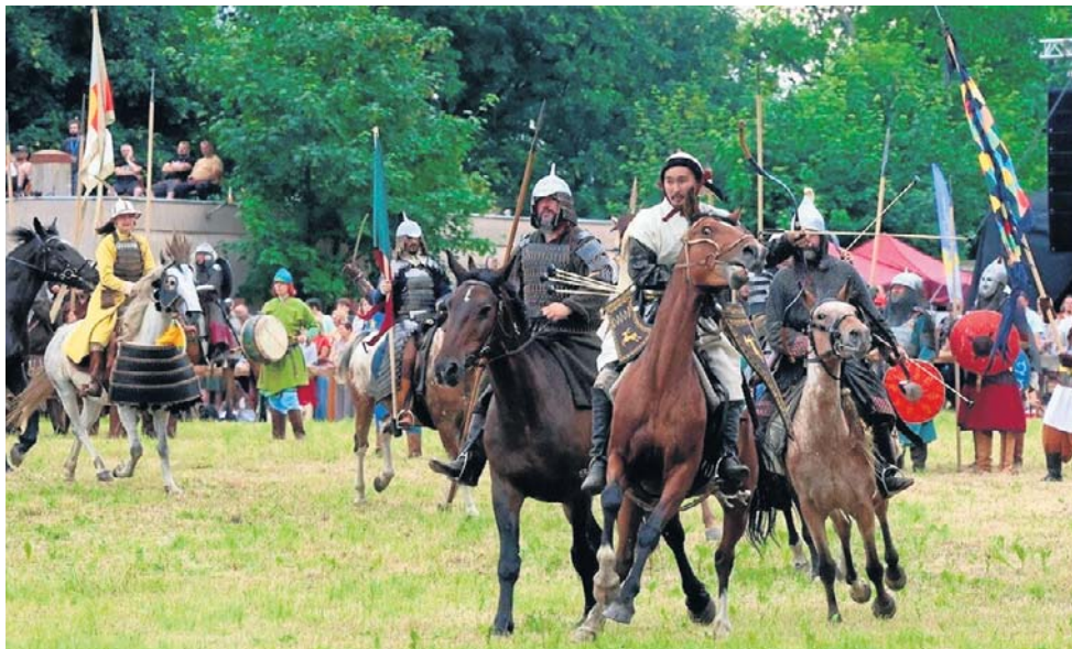
W inscenizacji bitwy uczestniczyło ok. pół tysiąca rycerzy i wojowników z 14 państw

A ja bym dodał, że jest to też odpowiedź na duże zapotrzebowanie społeczne na tego typu spektakle. Bo w owe sobotnie popołudnie trzeba było wybrać: Legnickie Pole czy finałowy mecz Mai Chwalińskiej na turnieju Rolanda Garrosa w Paryżu.