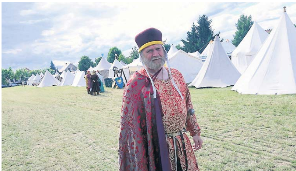
Uczestnicy rekonstrukcji rozbili okazałe, średniowieczne obozowisko