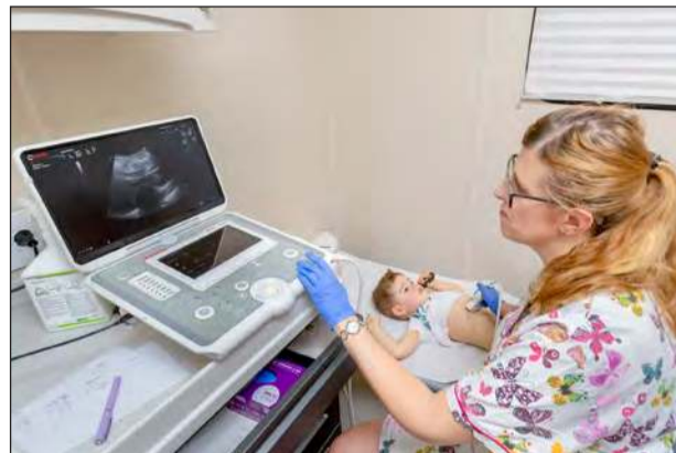
Fundacja Ronald McDonald, we współpracy z miastem Garwolin, zaprasza rodziców i opiekunów na bezpłatne badania USG dzieci w wieku od 9 miesięcy do 6 lat

Inicjatywa mobilnej kliniki Fundacji Ronald McDo-