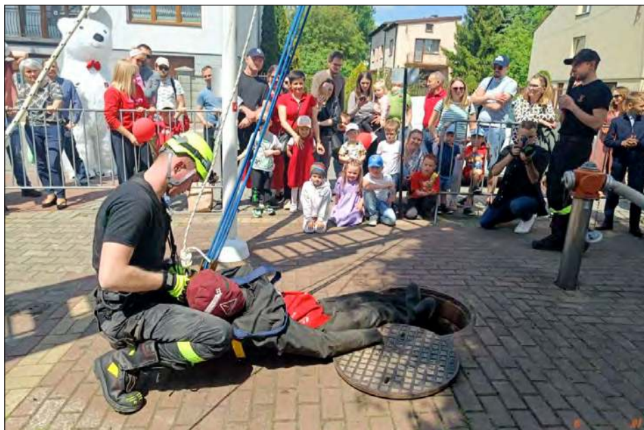
☛ Jednym z punktów programu był pokaz ratownictwa wysokościowego