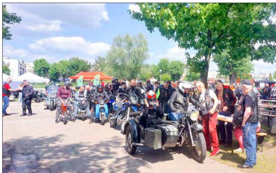
Na trasę, poza konkurencją, z numerem 1 wyjechał motocykl z osobą, która wylicytowała voucher podczas tegorocznej Wielkiej Orkiestry Świątecznej Pomocy

Weteran Klub Tur Garwolin po raz kolejny zaprosił wszystkich miłośników motocykli na coroczne wydarzenie, które łączy pasję do dwóch kółek z pomocą innym. Na Kwadracie ryk silników szedł w parze z biciem szlachetnych serc