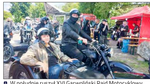
W południe ruszył XVI Garwoliński Rajd Motocyklowy. Wzięło w nim udział prawie 40 uczestników. Tradycyjnie rywalizowali w dwóch kategoriach: open oraz do 50 ccm pojemności silnika