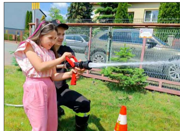
☛ Dzieci miały możliwość gaszenia pożaru wężem strażackim