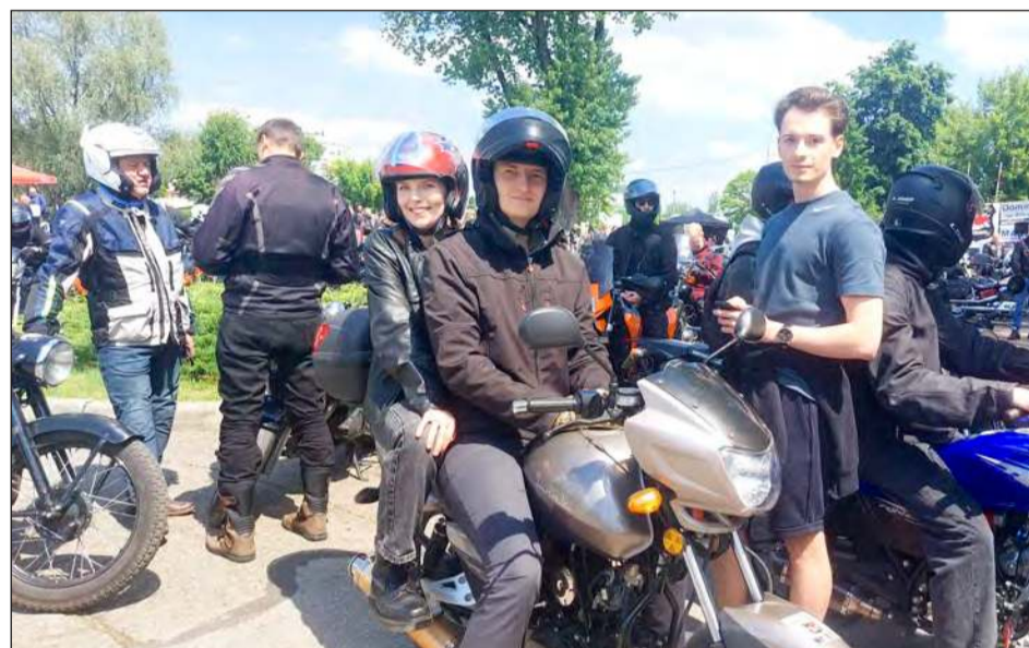
Wydarzenie zorganizowano 24 maja na garwolińskim Kwadracie, a rajd odbywał się trasami powiatu garwolińskiego