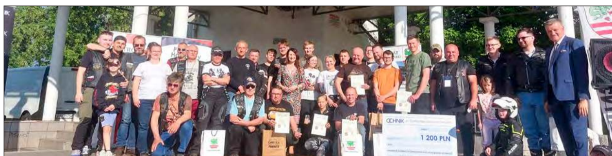
Ostatnim akcentem imprezy było wręczenie nagród zwycięzcom rajdu i poszczególnych konkurencji