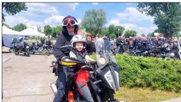
Czy motocykle to pasja tylko dla dorosłych? Nic podobnego! Na imprezie pojawiło się wielu małych miłośników jednośladów