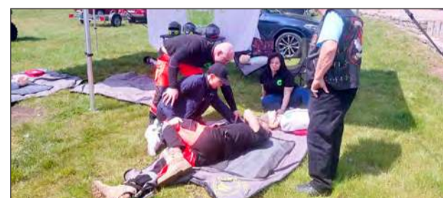
Po raz pierwszy w imprezie wzięli udział Ratownicy na Motocyklach z fundacji Dawcy Życia. Prowadzili praktyczne pokazy i szkolenia z pierwszej pomocy