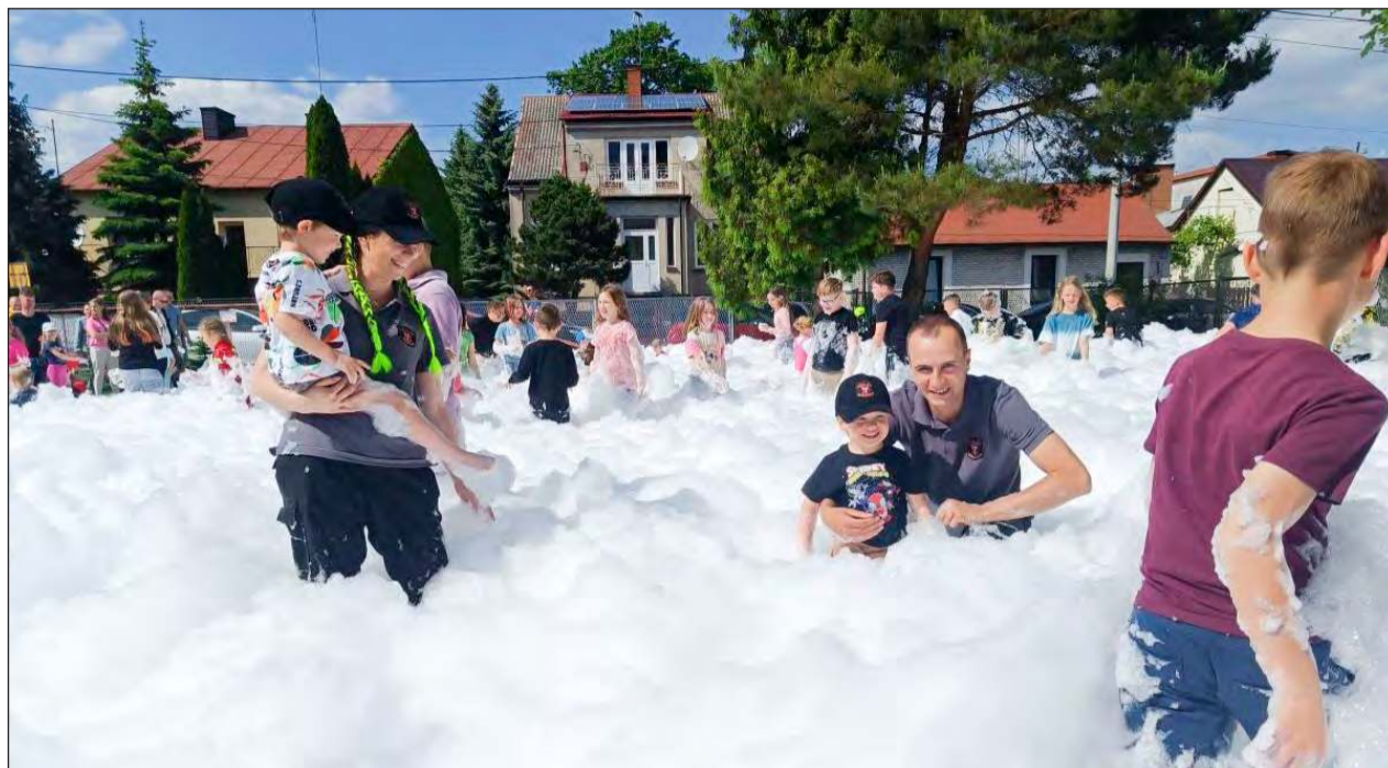
☛ Dzień pełen atrakcji zakończył się widowiskową „strażacką pianą”

» Dzień Otwarty w OSP Garwolin przyciągnął liczne grono mieszkańców i był doskonałą okazją do zapoznania się z pracą strażaków, sprzętem, jakim dysponują, a także do nauki podstawowych zasad bezpieczeństwa