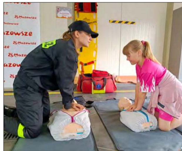
☛ Stanowisko do nauki pierwszej pomocy, gdzie każdy mógł odświeżyć lub zdobyć cenną wiedzę ratującą życie