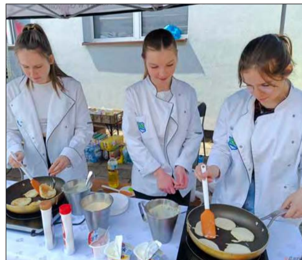
☛ Na zgłodniałych czekały przekąski serwowane przez uczennice z ZS nr 2 w Garwolinie