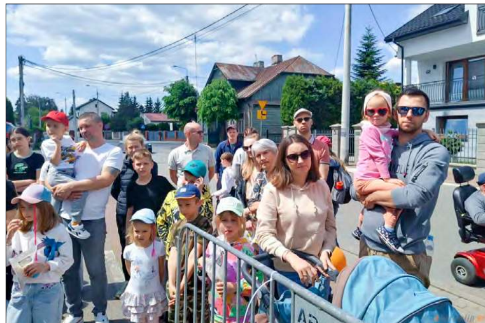
eprasa.pl 7d ☛ Dzień Otwarty w OSP Garwolin przyciągnął liczne grono mieszkańców