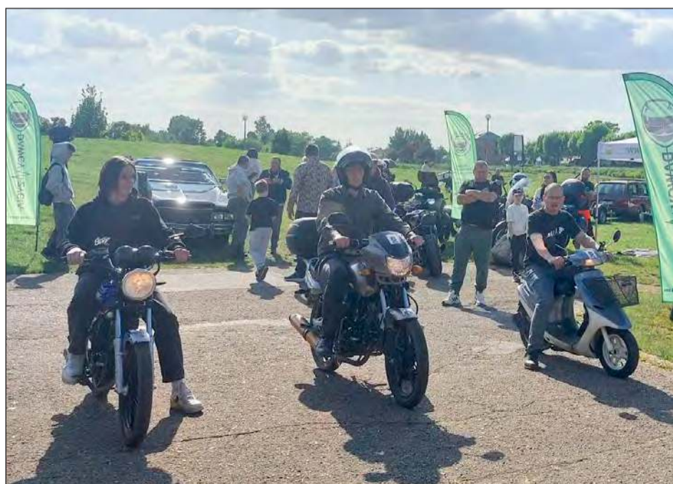
Podczas wydarzenia zorganizowano i rozstrzygnięto kilka konkursów z atrakcyjnymi nagrodami