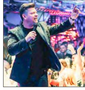
Miejsca Music Wilga

Już w czerwcu niekwestionowany król disco polo da koncert w naszym powiecie. Zenek Martyniuk będzie gwiazdą Dni Gminy Sobolew.