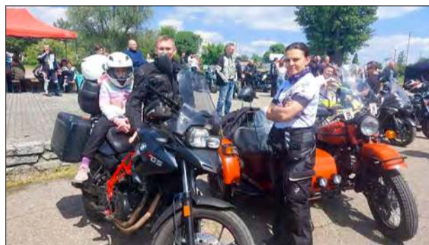
Weteran Klub Tur Garwolin ponownie zaprosił wszystkich entuzjastów motocykli na coroczne święto, które łączy pasję do dwóch kółek z pomaganiem innym