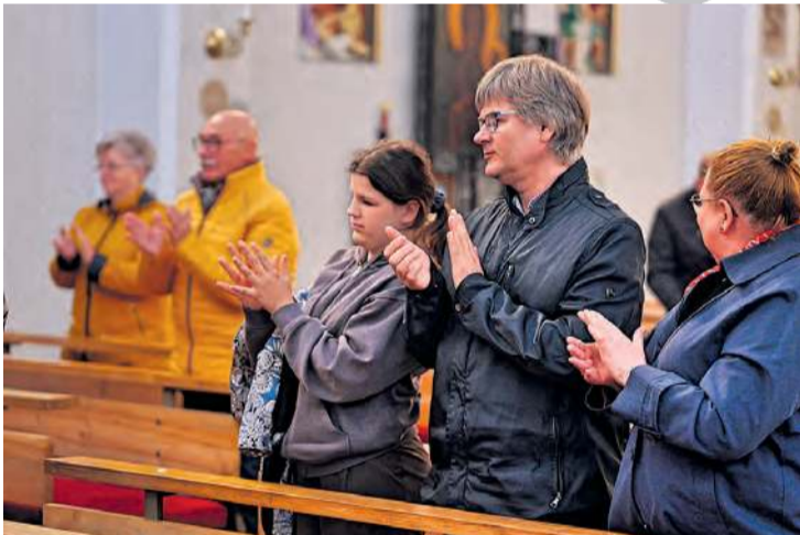
Publiczność, która nie opuściła kościoła od razu po mszy, była oczarowana występem dwóch artystów.