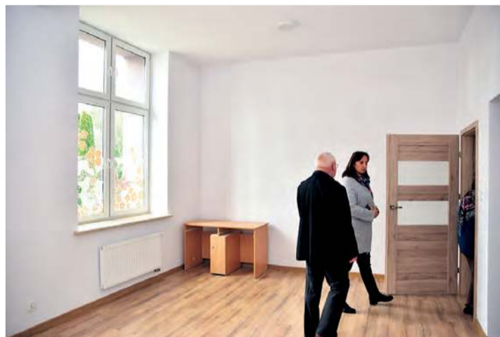
Lokale na parterze mają wysoko położone sufitu, przez co koszty ogrzewania mogą być w nich wyższe.

wspólne (na ich remont gmina nie otrzymała zgody od konserwatora zabytków), które mogą pełnić rolę suszarni, składzika itp. Budynek jest podłączony do kotłowni w Wiejskim Domu Kultury, gdzie jest piec na pellet.