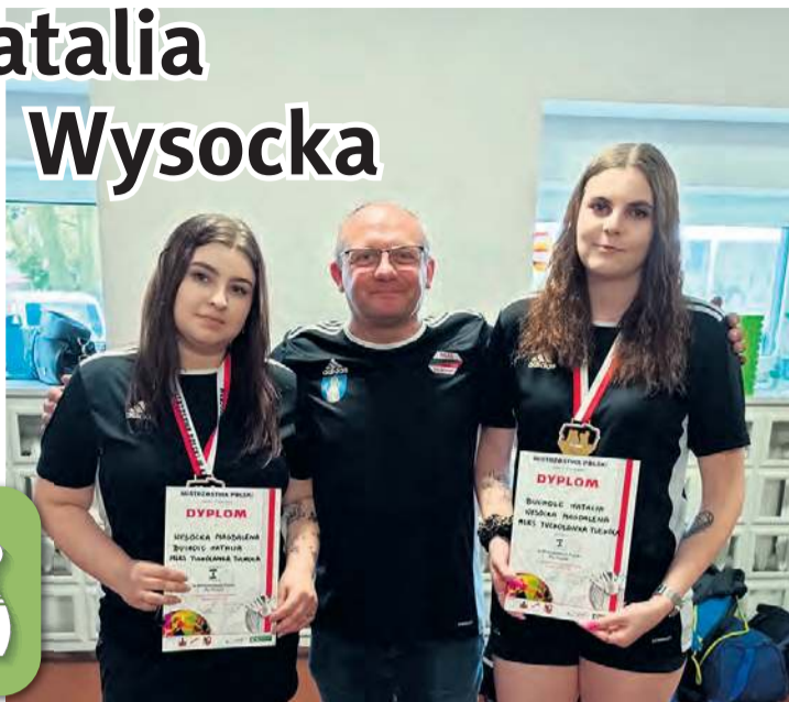
Po zejściu z podium. Złote medalistki z kierownikiem sekcji kręglarskiej Tucholanki.

Dekoracja odbywała się następnego dnia, zatem tucholanki wiedziały, że mają złoto, ale jeszcze krążków nie otrzymały, za to musiały wystartować w konkurencji indywidualnej. Tucholanki po kwa-