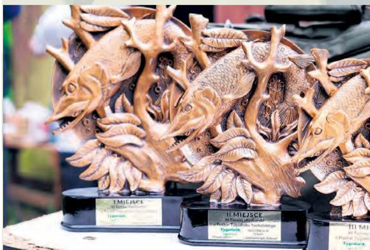
Trofea przygotowane przez „Tygodnik Tucholski”. To już jedenasta edycja zawodów o nasz puchar.