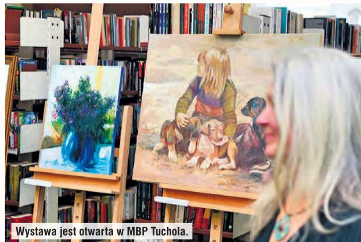
Wystawa jest otwarta w MBP Tuchola.

– Przeżyłam ciężki wypadek. „Przeżyłam” to dobre słowo, bo wszystko wskazywało, że nie będę żyła. Musiałam od nowa uczyć się: chodzić, mówić... Wróciłam do dzieciństwa. Właściwie byłam jak dziecko. To widać było też w malarstwie. Pierwsze prace ze szpitala były