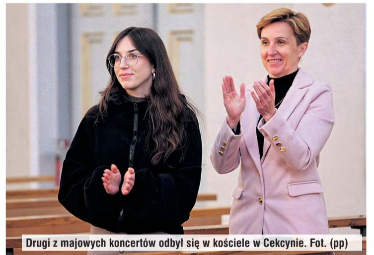
Druzi z majowych koncertów odbył się w kościele w Cekcynie.