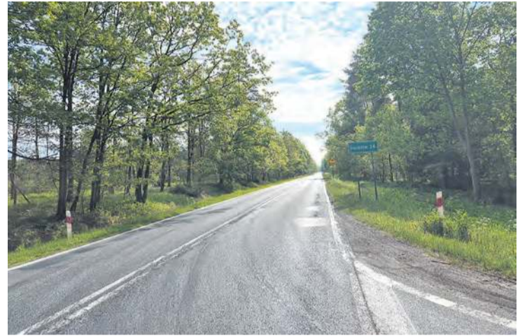
W kolejnych dniach należy spodziewać się prac na drodze wojewódzkiej między Tucholą a Świeciem.

– Przygotowujemy się do podpisania umowy z firmą Redon