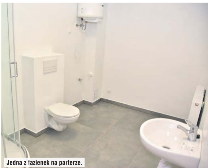
Jedna z łazienek na parterze.