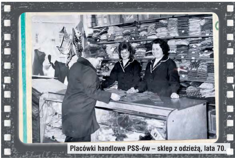
Placówki handlowe PSS-ów – sklep z odzieżą, lata 70.