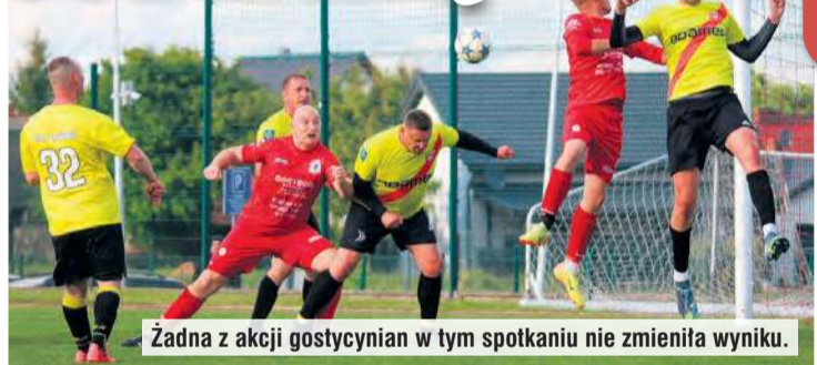
Żadna z akcji gostycynian w tym spotkaniu nie zmieniła wyniku.

Zdecydowanie poniżej oczekiwań zagraли sportowcy z drużyn klasy B. Dwa remisy ze słabymi drużynami i przegrana jedną bramką Myśliwca nie dają powodów do uśmiechu. Nadzieje na punkty były wielkie, ale sytuacja na boisku rozczarowała kibiców.