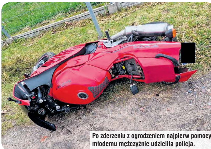
Po zderzeniu z ogrodzeniem najpierw pomocy młodemu mężczyźnie udzieliła policja.

W poniedziałek (19 maja) w Czersku policjanci próbowali zatrzymać do kontroli motocyklistę. Jak podaje chojnicka komenda, ten nie dość że się nie zatrzymał, to zaczął uciekać. Z motocyklem wylądował na ogrodzeniu. Okazuje się, że to 19 latek z gminy Kęsowo.