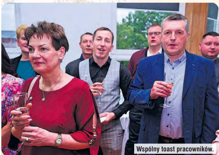
Wspólny toast pracowników.