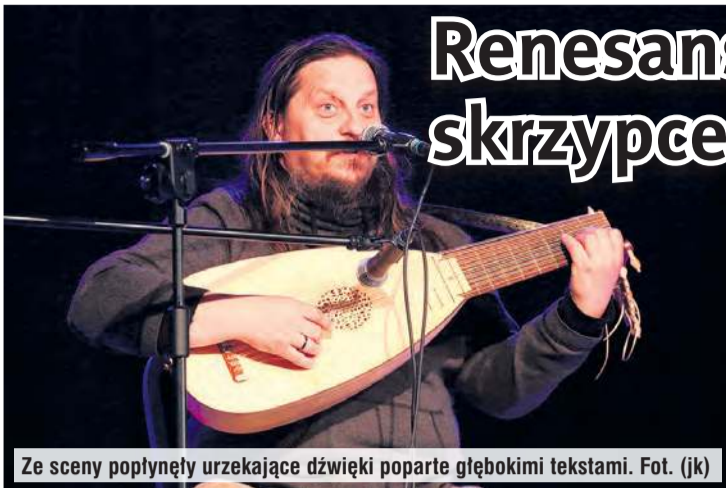
Ze sceny popłynęły urzekające dźwięki poparte głębokimi tekstami.