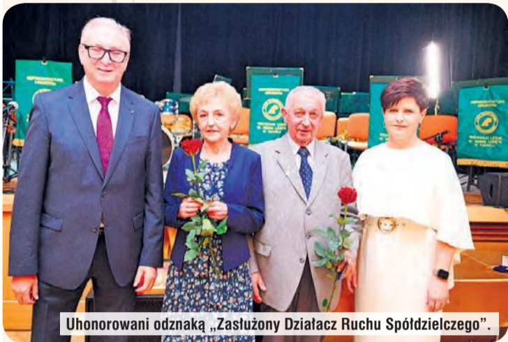
U honorowani odznaką „Zasłużony Działacz Ruchu Spółdzielczego”.