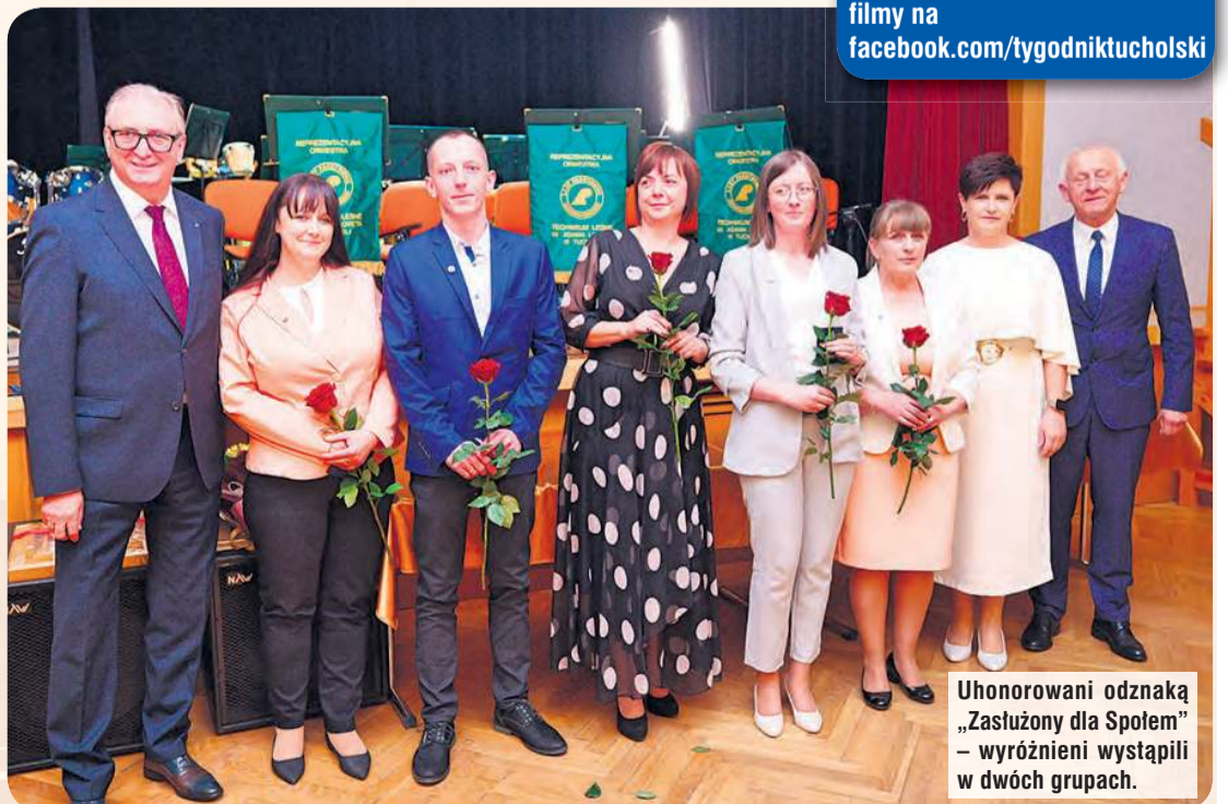
U honorowani odznaką „Zasłużony dla Społem” – wyróżnieni wystąpili w dwóch grupach.

więcej zdjęć na tygodnik.pl filmy na facebook.com/tygodniktucholski