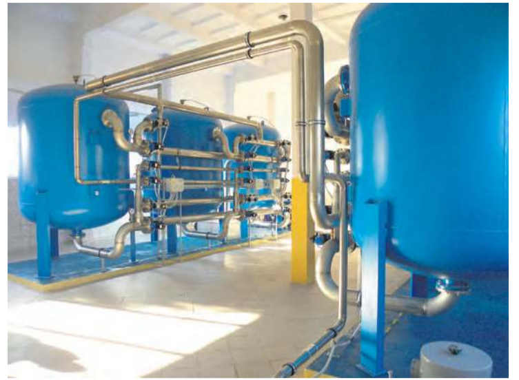
Istniejącej instalacji niedługo stuknie półwiecze.

– Pracę będziemy starali się tak koordynować, aby niedogodności dla mieszkańców były jak najmniej odczuwalne, jed-