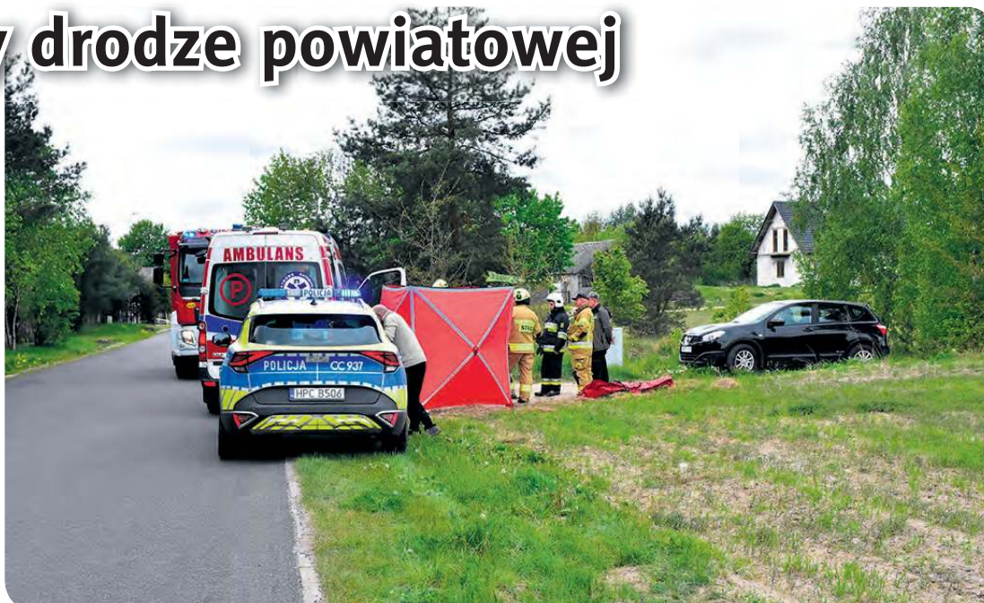
Medykom nie udało się uratować życia 67-latka.