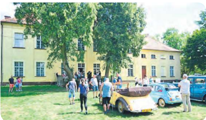
W pałacu w Kamienicy od około roku przybywa organizowanych wydarzeń. To 31 maja będzie mieć duży rozmach.