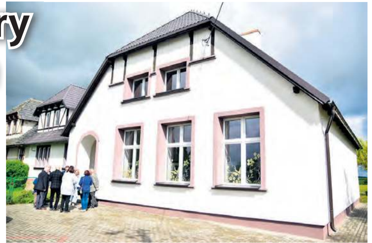
Obiekt przeszedł kompletną termomodernizację i renowację dachu. Wymienione zostały w nim drzwi i okna, a drewniane schody prowadzące na piętro zastąpiła konstrukcja żelbetowa. Zadbano także o bezpieczeństwo pożarowe.

W czwartek (15.05) radni Rady Gminy w Gostycynie mieli okazję zobaczyć, jak prezentuje się nowa substancja mieszkaniowa samorządu. Do Wielkiej Kloni udali się zaraz po sesji. W przebudowanej części szkoły powstały 4 mieszkania pod klucz. Na parterze o metrażu: 58 i 54 m 2 , na piętrze liczące 58 i 62 m 2 . W każdym z nich znajdują się dwa pokoje, kuchnia, łazienka (wyposażona) i korytarz. Do dyspozycji lokatorów będą także pomieszczenia