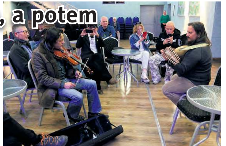
Artysta zmniejszył dystans między sceną a publicznością.

W niedzielę (11 maja) w cekcyńskim kościele Wiktor Kuzniecowa