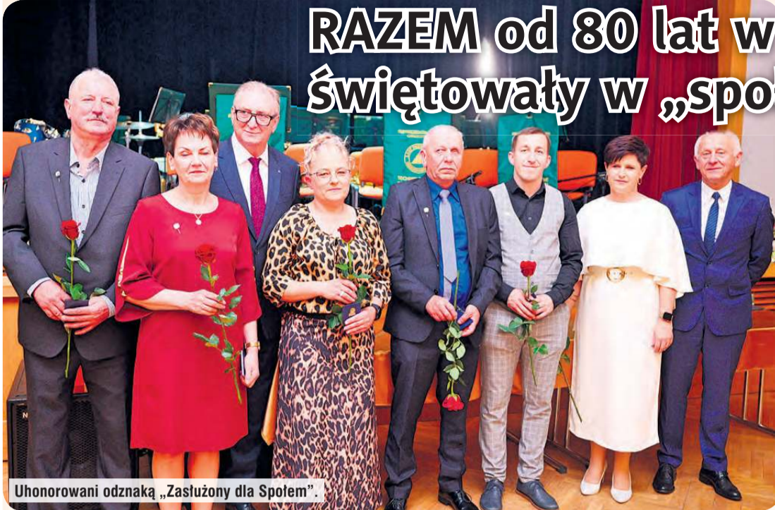
Uchonorowani odznaką „Zasłużony dla Społem”.

13 sklepów w różnych zakątkach miasta, 3 zakłady, ponad 100 pracowników i 80 lat tradycji. Dla wielu Społem PSS Tuchola to coś jednak więcej niż liczby i zakupy. To codzienne życie i historie babć, dziadków, rodziców. Miejsca pracy, ale też odrębna społeczność. Spółdzielnia, która jest nierozdzielalnym elementem miasta.