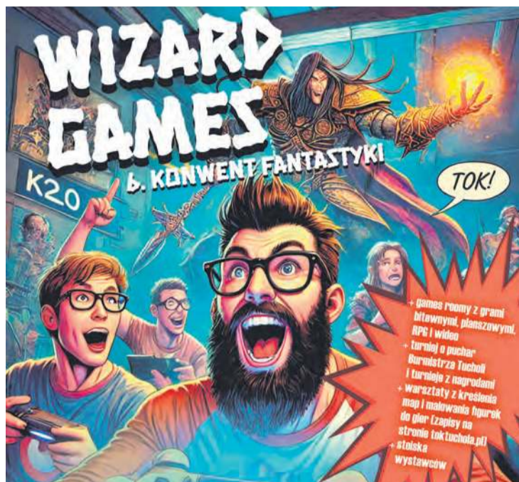
Grafika: Tucholski Ośrodek Kultury

W tym roku zaplanowano dużo gamingu, ale będzie też okazja na uczestnictwo w niecodziennych warsztatach: kreślenia map i malowania figurek do gier. Jesteś fanem fantasy albo chcesz poznać ten fascynujący świat? Wpadnij do Tucholskiego Ośrodka Kultury!