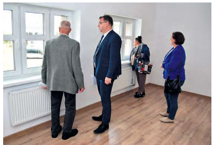
Z mieszkań położonych na tyłach obiektu rozpościera się widok na dom kultury i jego zielone otoczenie.