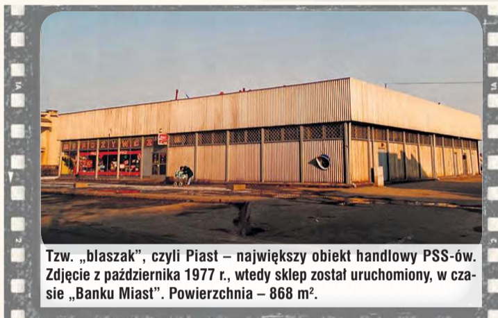
Tzw. „blaszak”, czyli Piast – największy obiekt handlowy PSS-ów. Zdjęcie z października 1977 r., wtedy sklep został uruchomiony, w czasie „Banku Miał”. Powierzchnia – 868 m 2 .