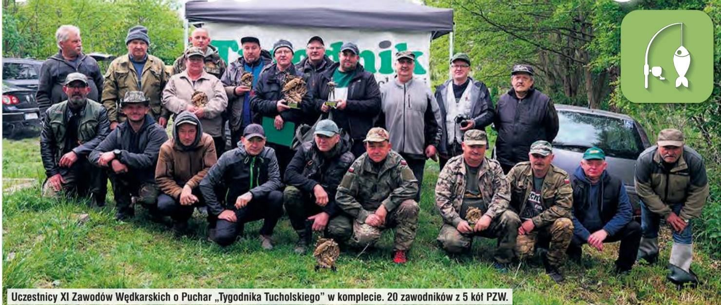
Uczestnicy XI Zawodów Wędkarskich o Puchar „Tygodnika Tucholskiego” w komplecie. 20 zawodników z 5 kół PZW.