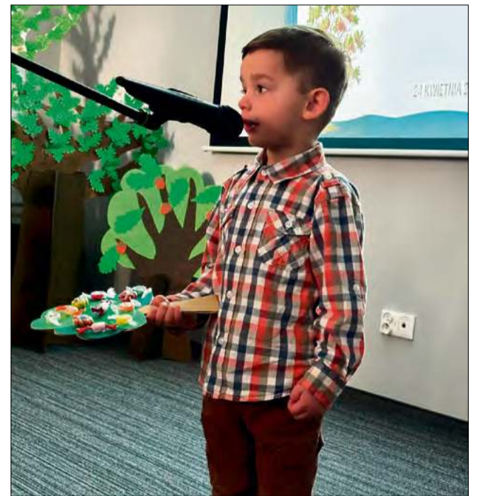
Przedszkolaki z pełnym zaangażowaniem wzięły udział w konkursie.