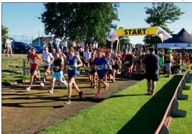
Organizatorzy zapraszają na kolejną edycję biegu, dedykowanego śp. Piotrowi Blachucikowi.

Trasa biegu ulicznego liczy 10 km i będzie prowadzić drogami szutrowymi oraz asfaltowymi. Składa się z dwóch