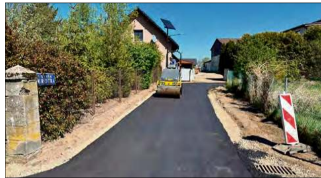
Prace na ul. Krótkiej w Ciepeliowicach.

Jednym z najważniejszych przedsięwzięć realizowanych na terenie gminy jest przebudowa ul. Szkolnej