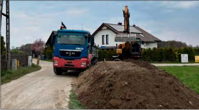
Przebudowa ul. Oliwkowej i Zielonej w Chróście.

Przystąpiono również do przebudowy ulic Krótkiej oraz Osadników w Ciepeliowicach.