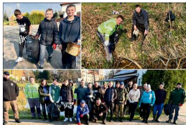
Uczestnicy akcji w Niemodlinie pokazali, że wspólne sprzątanie przynosi wymierny efekt.

Do akcji włączyły się władze samorządowe, które wraz z mieszkańcami porządkowały Ścinawę w rejonie sołectwa Szydło-