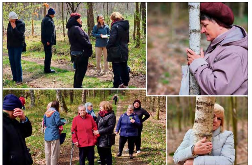
Seniorzy spacerowali swoim tempem po lesie, korzystając z technik oddechowych i uważnego kontaktu z naturą.