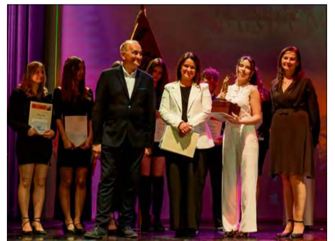
Absolwenci Zespołu Szkół w Ozimku podczas uroczystości zakończenia nauki – wydarzeniu towarzyszyła wyjątkowa część artystyczna.