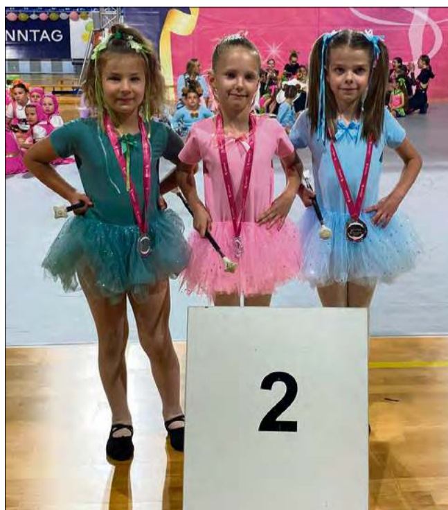
Taniec mażoretkowy stanowi połączenie wielu stylów i technik tanecznych.

Członkinie sekcji mażoretek biorą udział w wydarze-