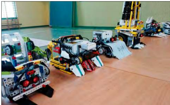
Stworzenie takich robotów wymaga nie tylko umiejętności, ale też cierpliwości.

Małgorzata Łyczak