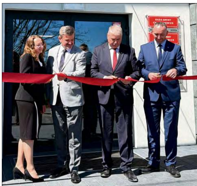
Symbolicznym przecięciem wstęgi zaproszono wszystkich do zwiedzenia nowej siedziby gminy.

Ale za tym wydarzeniem stoi coś więcej niż tylko ładny budynek.