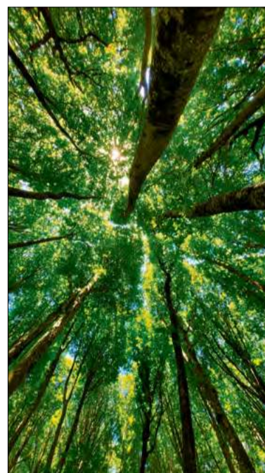
A co, jeśli na ratowanie przyrody będzie już za późno?

Jednym z głównych problemów jest fakt, że uczniowie sprzątając odpady pozostawione