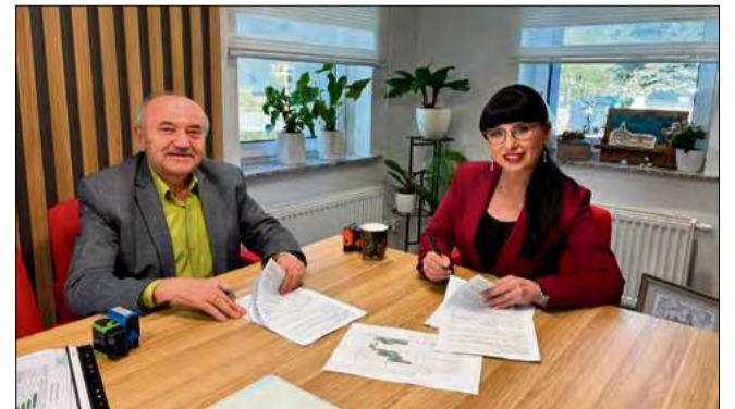
Wójt gminy Dąbrowa podpisał umowę na przebudowę ul. Szkolnej w Dąbrowie.

w Dąbrowie. Zakres robót obejmuje poszerzenie drogi, budowę kanalizacji deszczowej oraz zakrycie istniejącej