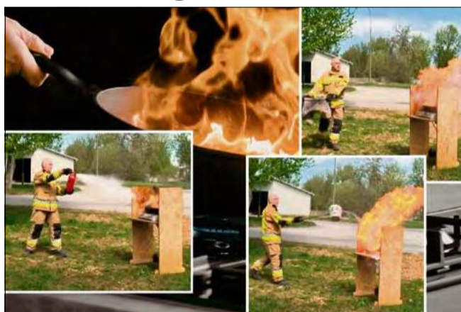
Na facebookowej stronie OSP Tarnów Opolski można obejrzeć film, w którym strażacy pokazują jak radzić sobie z zapalonym olejem.

W czasie pokazu na stanowisku szkoleniowym podczas Dni Bezpieczeństwa w Zakładach Wapienniczych Lhoist w Tarnowie Opolskim miejscowi strażacy ochotnicy zademonstrowali właściwe reakcje na pożar oleju w kuchni. W pierwszej kolejności zalecają wyłączenie źródła ciepła. Najprostszym sposobem jest przykrycie patelni pokrywką - odcięcie dopływu tlenu gasi ogień. Zamiast pokrywy można też użyć grubego ręcznika zwilżonego wodą i dokładnie odciśniętego. Materiał nie może okapywać wodą. Po ugaszeniu nie należy szybko odkrywać naczynia, ponieważ gorący olej w kontakcie z powietrzem może ponownie zapłonąć.