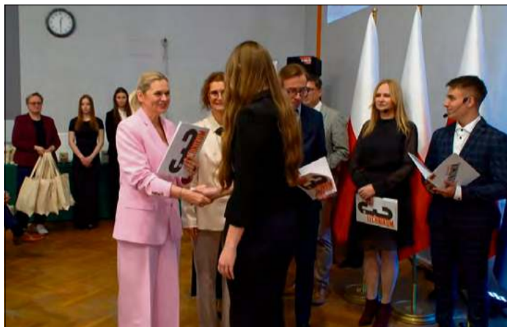
Minister Barbara Nowacka spotkała się z uczniami Zespołu Szkół Ekonomicznych oraz odwiedziła Branżowe Centrum Umiejętności przy Zespole Szkół Elektrycznych.

W Opolu z udziałem minister edukacji Barbary Nowackiej odbyło się oficjalne ogólnopolskie zakończenie roku szkolnego dla tej grupy abiturientów. Minister Barbara Nowacka spotkała się z uczniami Zespołu Szkół Ekonomicznych oraz odwiedziła Branżowe Centrum Umiejętności przy Zespole Szkół Elektrycznych.