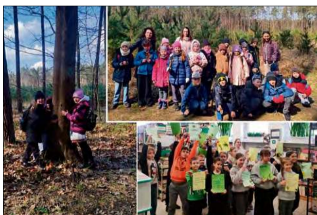
Uczniowie dowiedzieli się, jaki wpływ na samopoczucie ma bliskość drzew.

Ciekawość dzieci wzbudziło hasło „kąpiel w lesie”. Prowadząca wyjaśniła, że chodzi o zmysłowe zanurzenie w atmosferze lasu, nie o kontakt z wodą. Uczniowie dowiedzieli się, jaki wpływ na samopoczucie