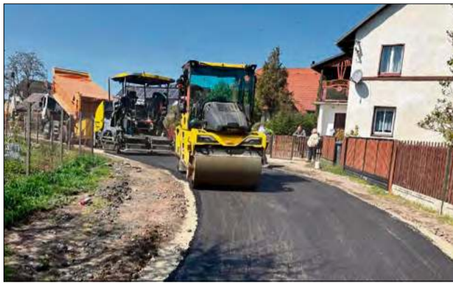
Nowa nawierzchnia na ul. Osadników w Ciepeliowicach.

Wartość zadania wyniesie 106 tys. zł. Zakres prac obejmuje: korytowanie, instalację korytek ściekowych oraz położenie nawierzchni bitumicznej.