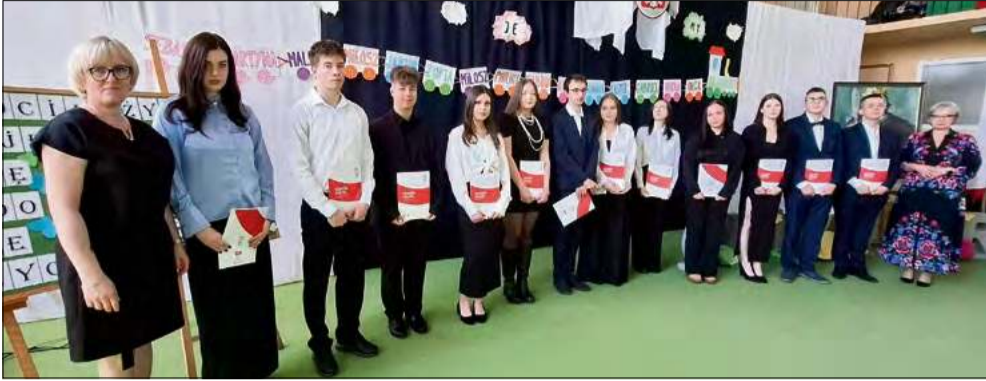
Uroczystość zakończenia roku maturalistów w Zespole Szkół w Niemodlinie – wręczenie nagród i wyróżnień dla najlepszych absolwentów.

K ońcówka kwietnia to dla uczniów klas maturalnych moment szczególny – czas podsumowań, pożegnań i pierwszych poważnych decyzji. Nie inaczej było w szkołach prowadzonych przez powiat opolski, gdzie tegoroczni absolwenci oficjalnie zakończyli swoją edukację w murach placówek w Niemodlinie, Prószkowie, Ozimku i Tułowicach.