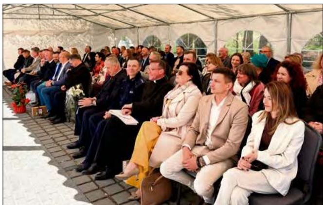
Uroczystość zgromadziła wielu gości oraz osób, które przyczyniły się do realizacji inwestycji.

Choć budynek robi wrażenie, najważniejszy przekaz wydarzenia był inny. Wielokrotnie powtarzano, że urząd to nie ściany, a ludzie. Dziękowano pracownikom – za wytrwałość, za pilnowanie budżetu, za codzienną pracę w trudnych warunkach. I to właśnie oni są największym „kapitałem” tej inwestycji.