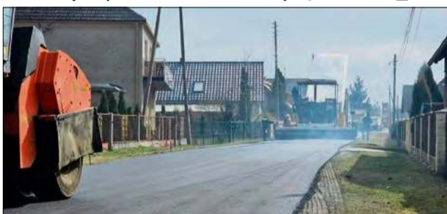
Prace drogowe w powiecie opolskim nabierają tempa – w najbliższym czasie ruszą kolejne inwestycje i remonty poprawiające bezpieczeństwo na lokalnych trasach.

Równolegle powiat opolski przygotowuje się do realizacji szerokiego programu remontowego. Obejmuje on m.in. wykonywanie nowych nawierzchni, utwardzanie poboczy oraz budowę i modernizację chodników.