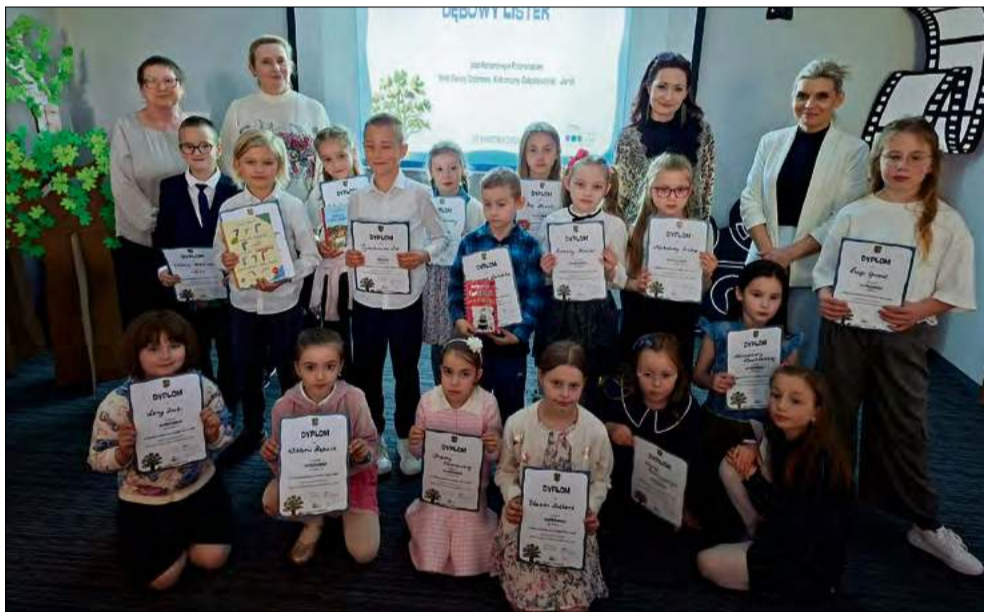
Na scenie zaprezentowały się dzieci i młodzież w pięciu kategoriach wiekowych.