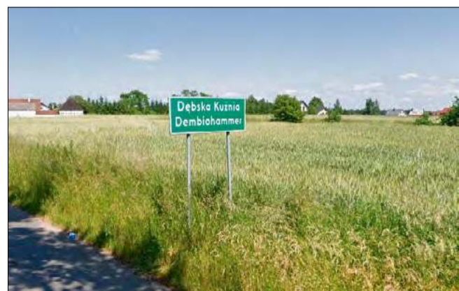
Inwestycja drogowa ruszy w Dębskiej Kuźni.

- Chodzi o położenie dywanika asfaltowego w ramach remontów bieżących, dlatego że mieszkańcy zadeklarowali, iż będą partycy-