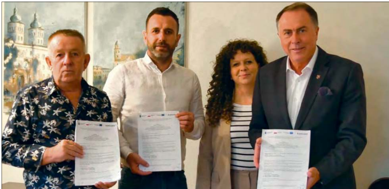
Umowę na budowę ścieżki pieszo-rowerowej podpisano we wrześniu zeszłego roku.

W gminie Prószków realizowane jest kolejne przedsięwzięcie infrastrukturalne, którego celem jest poprawa komfortu i bezpieczeństwa ruchu pieszych oraz rowerzystów. Inwestycja obejmuje budowę nowego odcinka ścieżki łączącej dwie miejscowości i stanowi element szerszych działań związanych z roz-