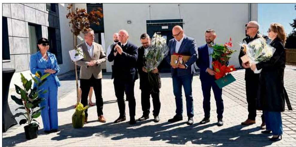
W wydarzeniu udział wzięli także samorządowcy z sąsiednich gmin i powiatu.

– Komfort mieszkańców to jest najważniejsze. Chcemy, żeby każdy, kto tu przyjdzie, nie tylko załatwił sprawę, ale też czuł się dobrze – podkreśla wójt. – Już widzimy, że odbiór jest bardzo pozytywny – dodaje.