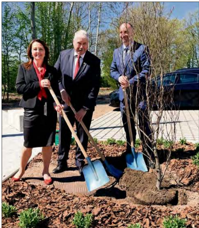
Za budynkiem posadzono buka, by był pomostem pomiędzy historią, a przyszłością.