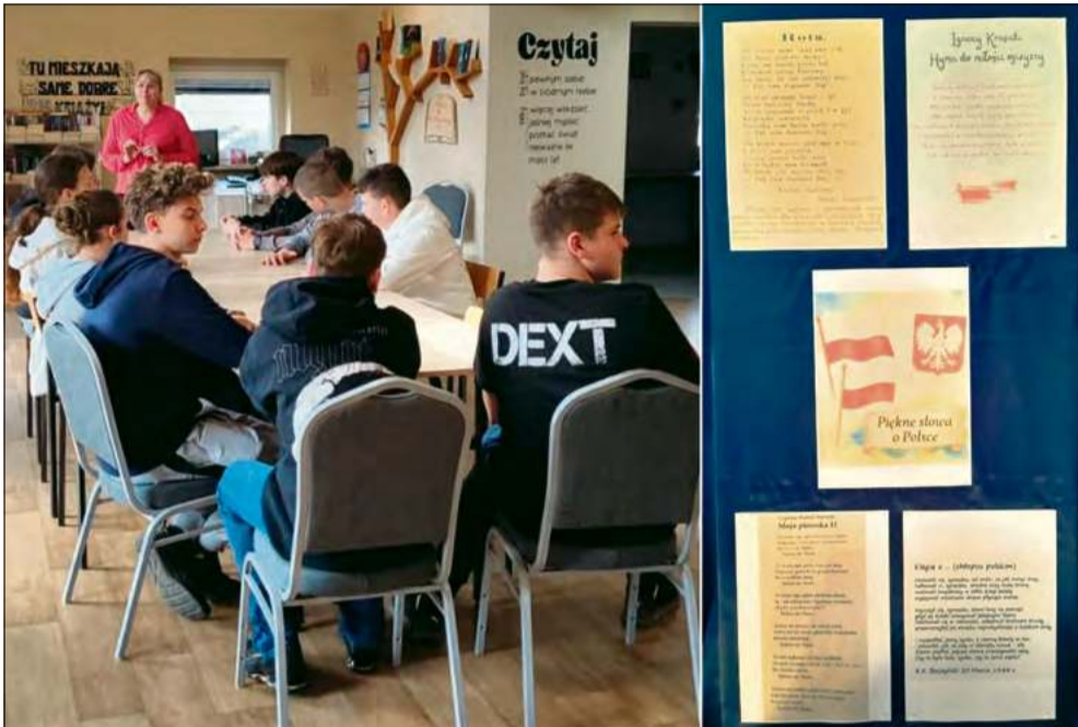
Podczas spotkania omówiono ewolucję pojęcia patriotyzmu na przestrzeni dziejów.

W filii Gminnej Biblioteki Publicznej w Tarnowie Opolskim, w Nakle, odbyło się spotkanie z uczniami klasy VIII miejscowej szkoły. Lekcja biblioteczna poświęcona była znaczeniu patriotyzmu we współczesnym świecie.