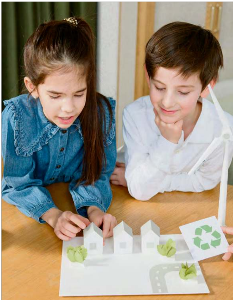
W ochronę środowiska często angażujemy najmłodszych – czy jednak sami dajemy dobry przykład?

Główne założenia Dnia Ziemi obejmują edukację i budowanie świadomości ekologicznej, zachęcanie do konkretnych działań – takich jak ograniczanie odpadów i racjonalne korzystanie z zasobów – oraz podkreślanie wspólnej odpowiedzialności za przyszłość planety. Obchodom często towarzyszą lokalne wydarzenia, m.in. wykłady, warsztaty dotyczące recyklingu i segregacji