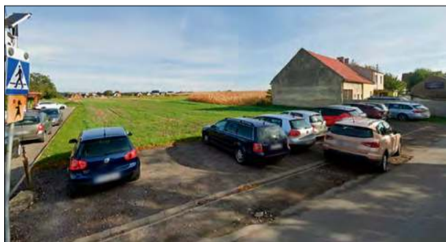
Chodzi o działkę liczącą prawie 17 arów.