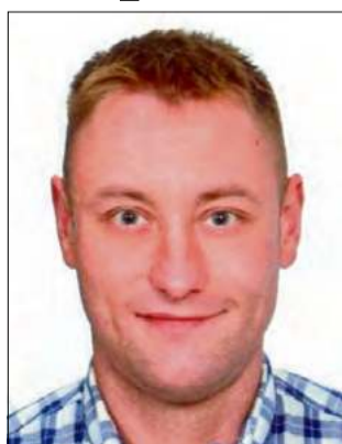
Policjanci publikują jego wizerunek.

Sprawą zajmują się funkcjonariusze z Komisariatu II Policji w Opolu. Mężczyzna został skazany za przestępstwo kradzieży. Opolanin do tej pory nie stawiał się w zakładzie karnym i ukrywa się przed organami ścigania, dlatego policjanci publikują jego wizerunek i proszą o pomoc każdego, kto może pomóc w ujęciu sprawcy. Poszukiwany