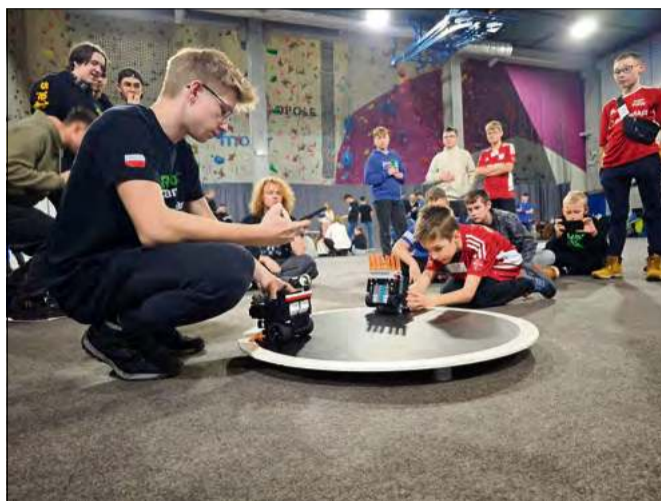
Zawodnicy Bunlab Team często biorą udział w turniejach oraz mistrzostwach.

Warto podkreślić, że jedne z pierwszych tego typu zajęć