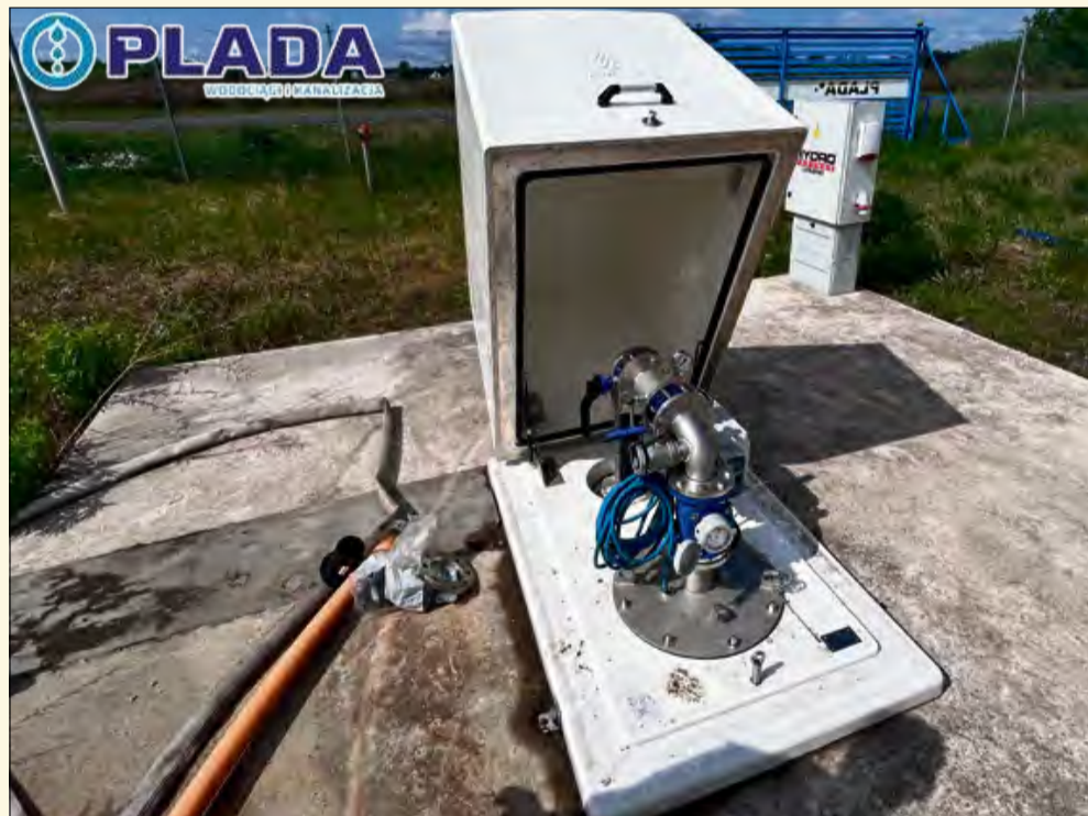
Studnia głębinowa już została wybudowana.

- Nasze analizy pokazują, że w ciągu najbliższych 10 lat wody z tych ujęć może już nie wystarczyć, dla zabezpieczenia potrzeb mieszkańców gmin Łubniany i Chrzastowice dlatego od 2020 roku