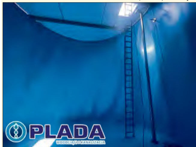
Obiekt będzie miał wydajność 50 m 3 wody na godzinę z docelową możliwością zwiększenia wydajności do 150 m 3 na godzinę.

Cały projekt opiewa na kwotę 4,3 miliona złotych. Na jego realizację firma Plada pozyskała 2,6 miliona złotych dofinansowania z KPO.