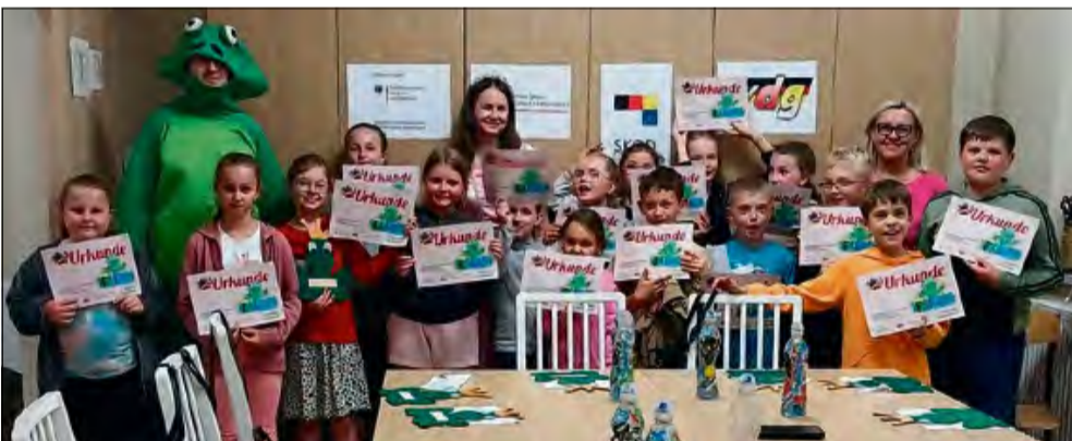
Ponadczasowa siła baśni.

W brożeckiej stodole zrobiło się naprawdę bajkowo! 3 lipca 2025 roku w miejscowości Brożec, w ramach projektu organizowanego przez Towarzystwo Społeczno-Kulturalne Niemców na Śląsku Opolskim, odbyła się wyjątkowa Noc Baśni Braci Grimm. Wydarzenie poprzedziła podobna impreza w Grocholubiu, która miała miejsce 27 czerwca. W obu lokalizacjach udział wzięło łącznie 15 dzieci w wieku od 6 do 10 lat, które spędziły niezwykłą noc w świecie opowieści, kolorów i dobrej zabawy. Wieczór rozpoczął się od rundy zapoznawczej i wspólnej kolacji, co pozwoliło uczestnikom poczuć się swobodnie i zintegrować z grupą.