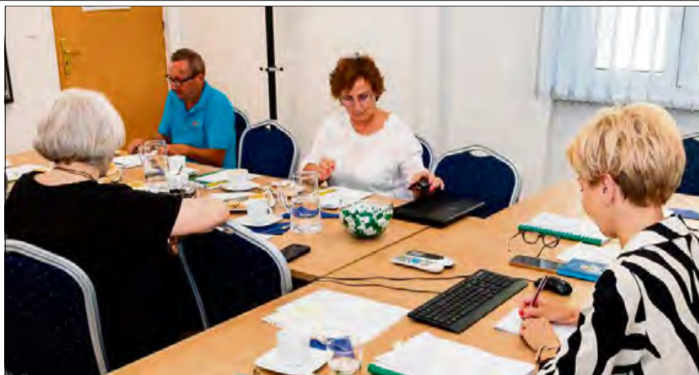
Podczas ostatniego posiedzenia Powiatowej Rady Rynku Pracy w Krapkowicach podjęto decyzję o zwiększeniu środków finansowych m.in. na realizację staży.

Zmieniono także maksymalny czas trwania statusu