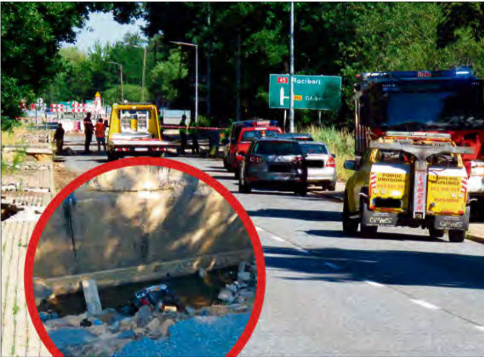
Miejsce śmiertelnego wypadku przy zniszczonym moście na DK 45.

Dramat na zamkniętym odcinku drogi krajowej nr 45 w pobliżu Krapkowic. Starszy mężczyzna zginął na miejscu po tym, jak motocyklem wjechał w głęboką wyrwę przed zniszczonym mostem na Osobłodzie. Policja i prokuratura wyjaśniają okoliczności zdarzenia.