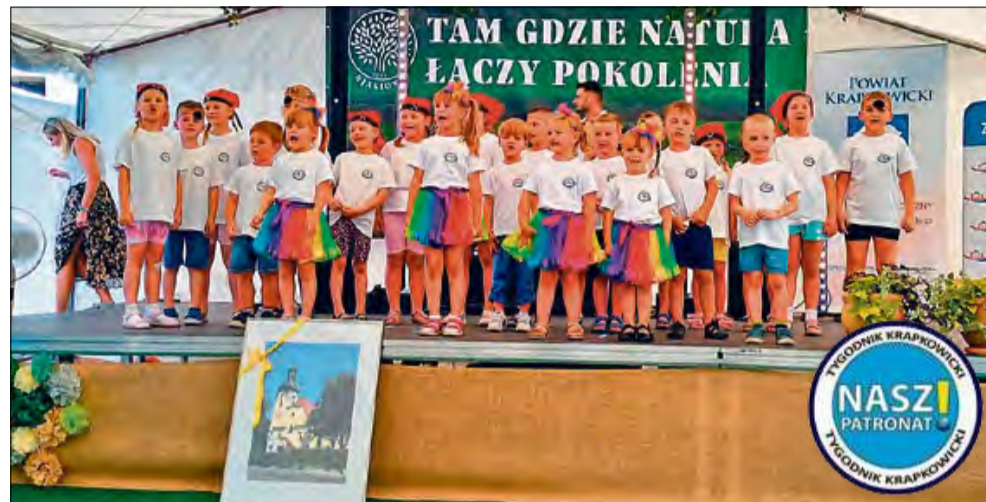
W programie nie zabrakło występów dzieci.

Najmłodszy uczestnicy święta chętnie korzystali z dmuchańców i innych przygotowanych dla nich rozrywek. Dla tych, którzy chcieli lepiej poznać miejscowość, zorganizowano przejazd bryczką oraz zwiedzanie ciekawych zakątków Jasiony.