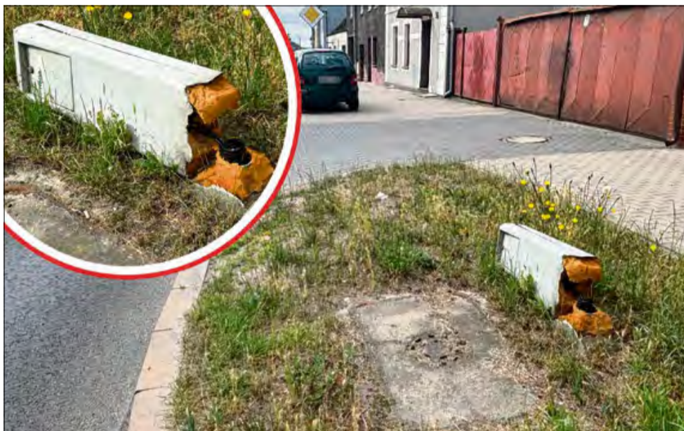
Przewrócona skrzynka wciąż niszczy, czekając na naprawę.

Od dłuższego czasu na trawniku przy ulicy Opolskiej w Krapkowicach, niedaleko zakładu krawieckiego, leży uszkodzona skrzynka telekomunikacyjna. Jej obudowa jest złamana, a wewnątrz widoczne są izolacje i czarne przewody. Mimo że tego typu urządzenia są kluczowe dla działania sieci telekomunikacyjnych (internet, telefon) lub niskonapięciowego zasilania, nikt nie kwapi się do naprawy. Skrzynka powoli zarasta trawą, co świadczy o tym, że problem został zbagatelizowany.