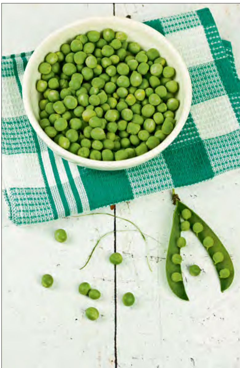
Kto z nas nie lubi zielonego groszku?

Rośliny strączkowe coraz częściej zyskują miano „superfoods” – i to nie bez powodu. Fasola, soczewica, ciecierzycza czy groch to prawdziwe skarbnice wartości odżywczych. Są doskonałym źródłem pełnowartościowego białka, błonnika, złożonych węglowodanów oraz witamin z grupy B. Dostarczają także wielu cennych składników mineralnych, takich jak potas, fosfor, żelazo, cynk, wapń, magnez, selen, miedź czy mangan. Co więcej, strączki zawierają nienasycone kwasy tłuszczowe,