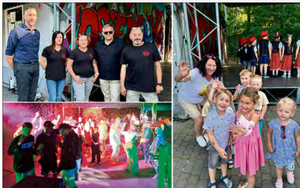
„Osiedłokowe Powitanie Lata” w Zdzeszowicach było okazją do wspólnej zabawy i integracji mieszkańców.

21 czerwca na terenie Zdzeszowic odbył się radosny festyn „Osiedłokowe Powitanie Lata”, który zgromadził licznych mieszkańców. Impreza, zorganizowana wspólnie przez Stowarzyszenie OSIEDLOK, Zarząd Osiedla, Publiczne Przedszkole Nr 2 im. Kubusia Puchatka oraz Publiczną Szkołę Podstawową nr 2 im. Artura Gadzińskiego, stała się prawdziwą ucztą rozrywki dla całych rodzin.