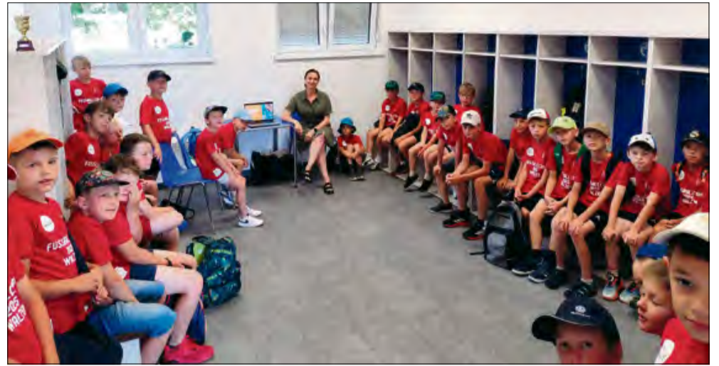
Podczas zajęć poruszono wiele istotnych tematów związanych z bezpieczeństwem i zdrowiem.

Jak co roku Powiatowa Stacja Sanitarno-Epidemiologiczna w Krapkowicach podejmuje działania związane z bezpieczeństwem podczas wakacji. Ich celem jest stworzenie bezpiecznych warunków wypoczynku dzieci i młodzieży, zwłaszcza w ośrodkach wypoczynku letniego. W minionym czasie pracownicy Powiatowej Stacji Sanitarno-Epidemiologicznej w Krapkowicach odwiedzili uczestników letniego wypoczynku, prowadząc działania edukacyjne i kontrolne na stadionie LZS Walce.