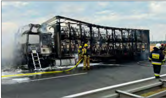
Po dojeździe na miejsce zdarzenia strażacy zastali ciągnik siodłowy z naczepą całkowicie objęty pożarem.

O godz. 13.16 Stowarzyszenie Kierowania Komendanta Powiatowego PSP w Krapkowicach otrzymało zgłoszenie o pożarze samochodu ciężarowego na autostradzie. Do zdarzenia zadysponowano dwa zastępy z JRG PSP Krapkowice oraz OSP Dąbrówka Górna i OSP Rogów Opolski. W trakcie dojazdu, dowódca - widząc unoszące się nad autostradą kłęby dymu polecił zadysponowanie dodatkowych sił i środków. Zadysponowano zatem dodatkowo: OSP Odrowąż, OSP KSRG Kórnicza oraz trzeci zastęp z JRG PSP Krapkowice.