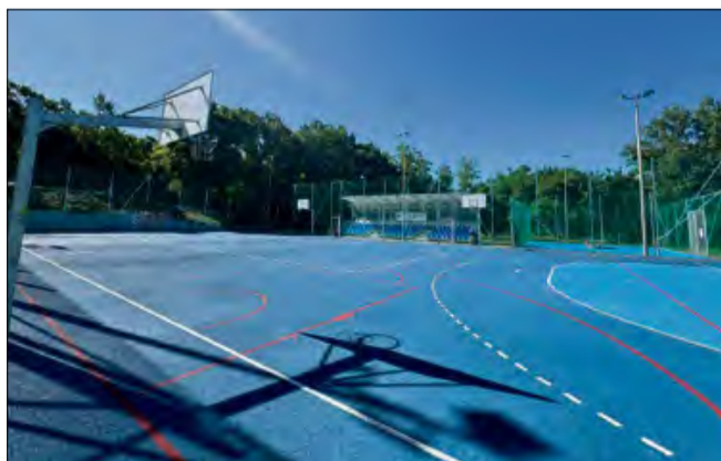
Boiska są dostępne dla wszystkich.

Boiska wielofunkcyjne przy LO w Otmęcie będą dostępne dla wszystkich przez całe wakacje - bez rezerwacji, przez cały dzień. To propozycja dla młodzieży, rodzin i każdego, kto lubi aktywność na świeżym powietrzu.