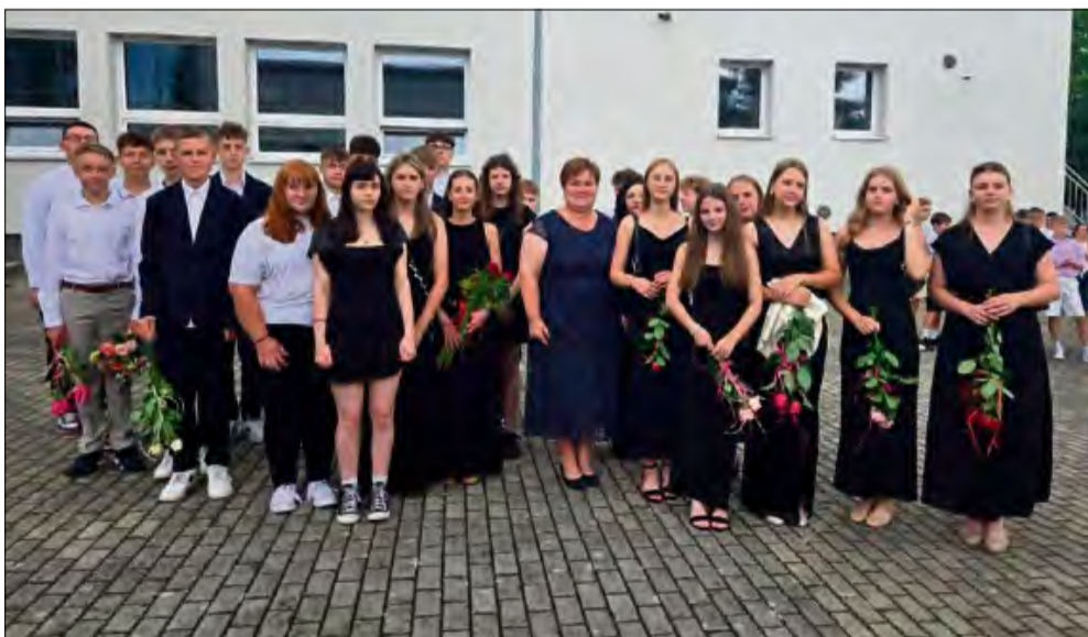
To były bardzo uroczyste chwile. Nie brakowało też wzruszeń i refleksji.

W piątek 27 czerwca w Strzeleczkach uroczysto pożegnano rok szkolny. Teraz przed uczniami czas zasłużonych wakacji.