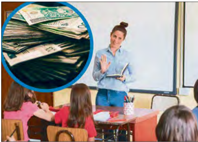
Gmina Walce odzyska ponad 269 tysięcy złotych.

Spór sięga decyzji z początku 2022 roku, kiedy Ministerstwo Edukacji ograniczyło naukę języka niemieckiego jako języka mniejszości z trzech godzin tygodniowo do jednej. Redukcja dotyczyła wyłącznie dzieci należących do mniejszości niemieckiej, co wywołało sprzeciw samorządów.