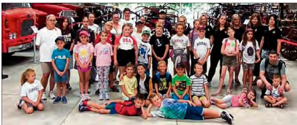
Druhowie z Ochotniczej Straży Pożarnej w Pietnej wyruszyli na wspólną wycieczkę do Centralnego Muzeum Pożarnictwa w Mysłowicach.

W piątek, 4 lipca, druhowie z Ochotniczej Straży Pożarnej w Pietnej - zarówno starsi, jak i młodszy - wyruszyli na wspólną wycieczkę do Centralnego Muzeum Pożarnictwa w Mysłowicach. Do wyprawy dołączyli również druhowie z OSP Żuzela oraz OSP Gogolin, tworząc wyjątkową grupę.