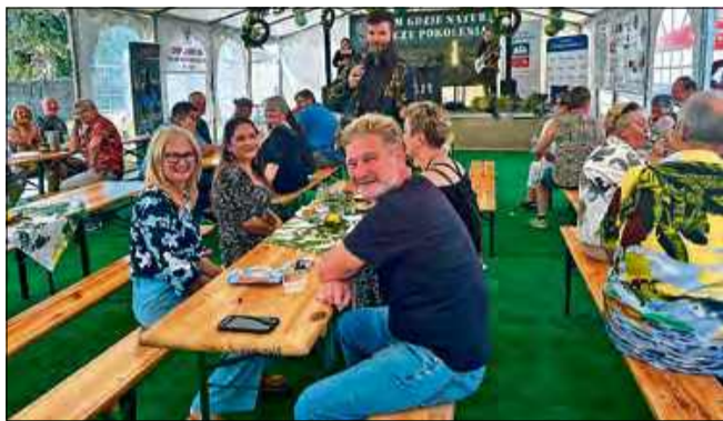
Mieszkańcy Jasiony świętowali 740. rocznicę powstania miejscowości.

28 czerwca, mieszkańcy Jasiony oraz liczni goście świętowali 740. rocznicę powstania miejscowości. Uroczystości rozpoczęły się mszą świętą, po której nastąpiło oficjalne otwarcie obchodów.