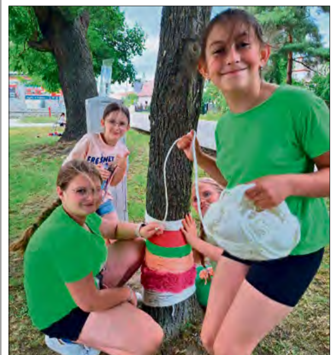
Kolor, wyobraźnia i wspólna zabawa.

24 czerwca drzewa przy Gminnym Ośrodku Kultury w Walcach na chwilę zamieniły się w... galerię sztuki! Wszystko za sprawą wyjątkowych międzynarodowych warsztatów plastycznych, które połączyły dzieci z Polski i Czech w radosnym, kolorowym i bardzo kreatywnym działaniu.