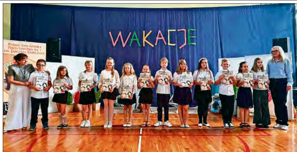
27 czerwca uczniowie rozpoczęli czas wakacyjnego odpoczynku.

Wakacje to dla uczniów czas odpoczynku, a dla dorosłych – może być on okazją, by choć na chwilę zwolnić tempo, zregenerować się i cieszyć się pięknem przyrody.