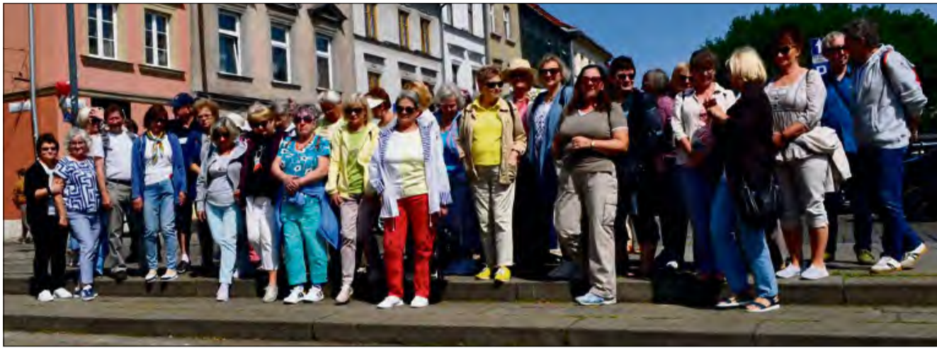
Uczestnicy Uniwersytetu Trzeciego Wieku odwiedzili Kraków i malowniczą Lanckoronę.

Niezwykłe wrażenie wywarł na uczestnikach gotycki Kościół Bożego Ciała, monumentalna bazylika pamiętająca czasy Kazimierza Wielkiego. Jej imponujące wnętrza zachwycało wszystkich swoim bogactwem.