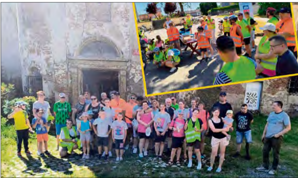
28 czerwca odbył się wyjątkowy Wielopokoleniowy Rajd Rowerowy.

28 czerwca Stowarzyszenie Rozwoju Wsi Ściborowice zorganizowało wyjątkowy Wielopokoleniowy Rajd Rowerowy, który zgromadził miłośników aktywnego wypoczynku w różnym wieku. Wydarzenie, odbywające się pod patronatem starosty krapkowickiego, stało się okazją do wspólnej zabawy, integracji oraz promocji zdrowego stylu życia.