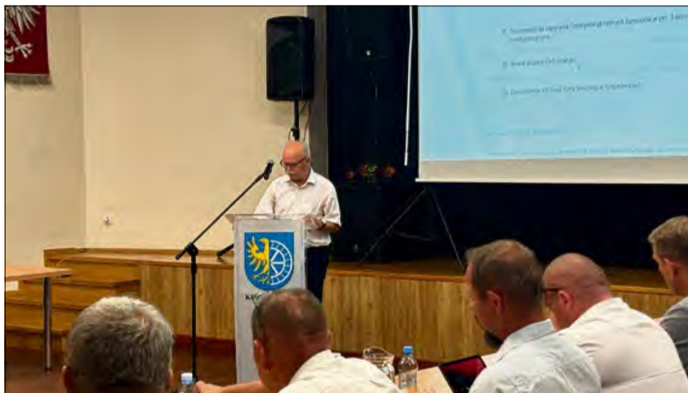
Jeden z mieszkańców podzielił się swoimi obawami z krapkowickimi radnymi..

Odnosnie dróg przeciwpożarowych i wykonania audytu w tym zakresie zarząd argumentuje, że ze względu na zmienione przepisy konieczne byłoby dostosowanie istniejących dróg pod względem szerokości i nośności, a nakłady na takie przedsięwzięcie obciążłyby fundusz remontowy nieruchomości na os. Sady 3,4,5,8,9.