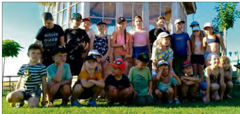
Dzieci spędziły miło czas na świeżym powietrzu.

Ochotnicza Straż Pożarna w Odrowążu organizuje wakacyjne zbiórki dla dzieci. Pierwsza z nich miała miejsce na początku lipca w zagrodzie z alpakami.