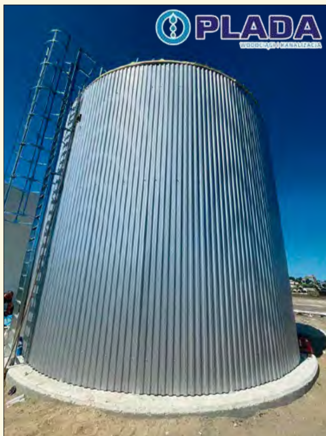
Stacja wodociągowa w Chrzastowicach ma być uruchomiona do końca 2025 roku.

- Od kilku lat „na półce” mamy dwa projekty, które prowadzą do dalszego unowocześniania technologii związanych