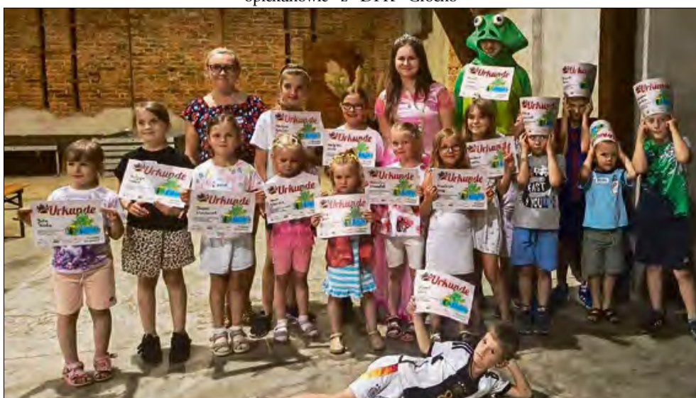
Baśniowe rozpoczęcie wakacji.