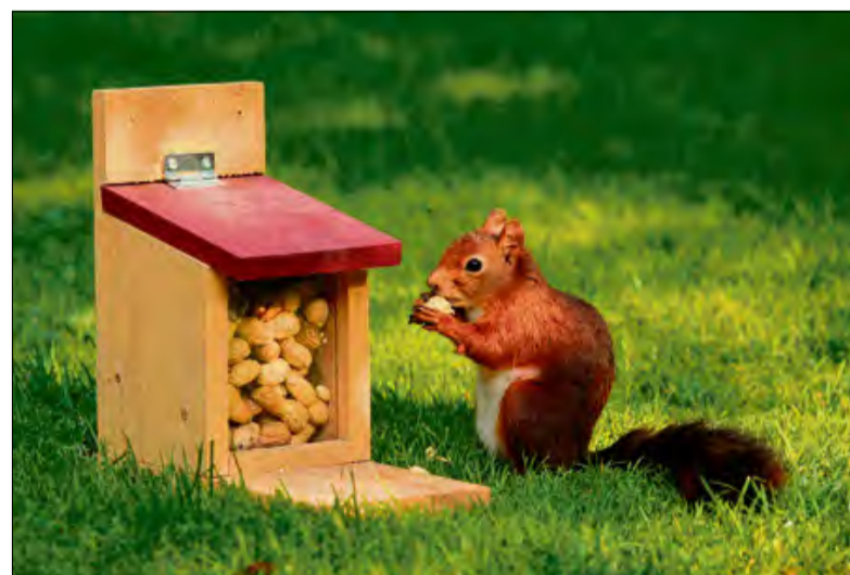
Nasiona zawierają wiele cennych właściwości zdrowotnych.

zostawić je w wodzie na kilka godzin, a nawet na całą noc. Następnie należy je dokładnie ugotować do miękkości, co znacząco redukuje ilość substancji niesprzyjających naszemu samopoczuciu. Kolejną metodą jest fermentacja. Produkty takie jak tempeh czy miso, powstałe w wyniku fermentacji soi, zawierają mniej substancji utrudniających trawienie i są lepiej tolerowane przez układ pokarmowy. Warto również sięgać po przyprawy – dodatek kminku, majeranku, kopru włoskiego czy imbiru do potraw ze strączków może skutecznie ograniczyć ryzyko wzdęć. Jeśli korzystamy z konserwowanych strączków, takich jak fasola czy groszek z puszki, dobrze jest przepłukać je pod bieżącą wodą. Pozwoli to pozbyć się nadmiaru soli oraz części substancji wzdymających. Dobrym pomysłem jest także blendowanie strączków na zupy krem, pasty czy sosy – w takiej formie są one łatwiejsze do strawienia. Nie należy zapominać o dokładnym przeżuwaniu, które wspomaga proces trawienia już na etapie jamy ustnej. Osoby z wrażliwym układem pokarmo-