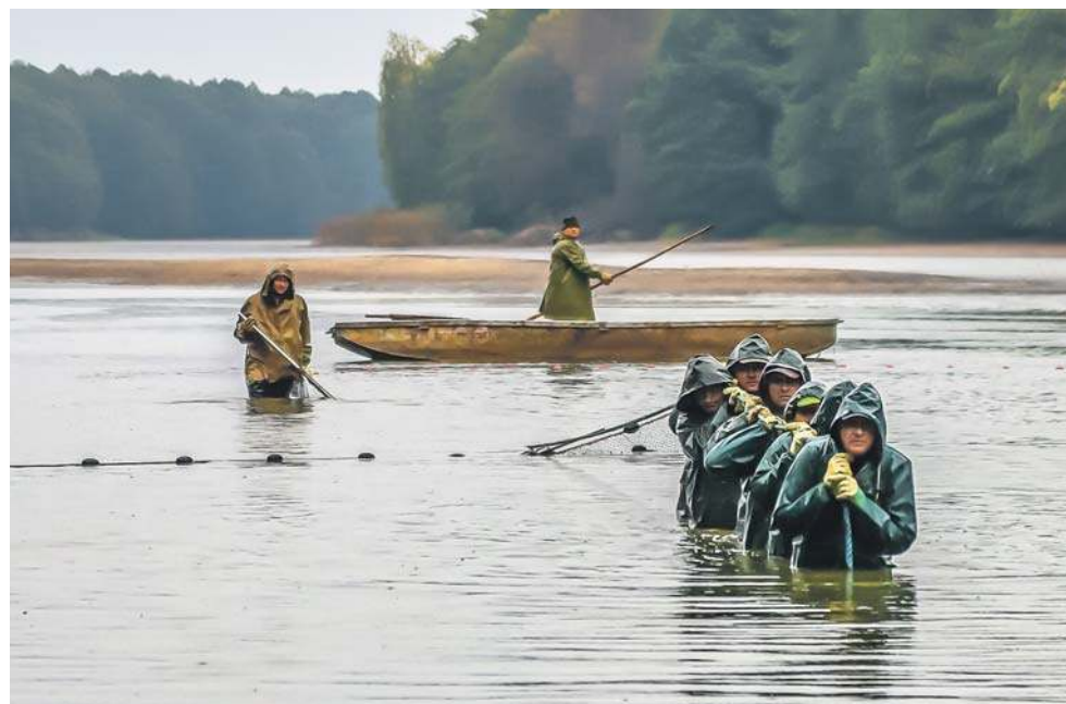
Rybacy ciągną sieci przez ponad godzinę. W wodzie, ubrani w gumowe spodnie i płaszcze

- No właśnie dziwi mnie to pojęcie, że karp... „śmierdzi mułem”, „śmierdzi błotem” - mówi jeden z rybaków. - Takie