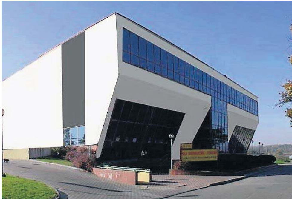
Na razie nie widać szans na budowę nowej hali, Legnicy musi więc wystarczyć obecna

Ta część prac modernizacyjnych także została dofinansowana przez Urząd Marszałkowski Województwa Dolnośląskiego kwotą 1, 5 miliona złotych.