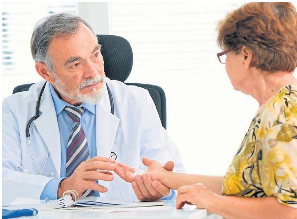
Na hipochondrię najczęściej zapadają osoby z tendencją do stanów depresyjnych

Hipochondryk jest osobą, której towarzyszy stały lęk przed zachorowaniem. Nieustannie znajduje się w gotowości i doszukuje się objawów, które mogą wskazywać na poważną chorobę - zawał, udar czy nowotwór. Co więcej, hipochondryk jest „nadwrażliwy” na różne informacje na temat chorób. Według badań przeprowadzonych przez Thomasa