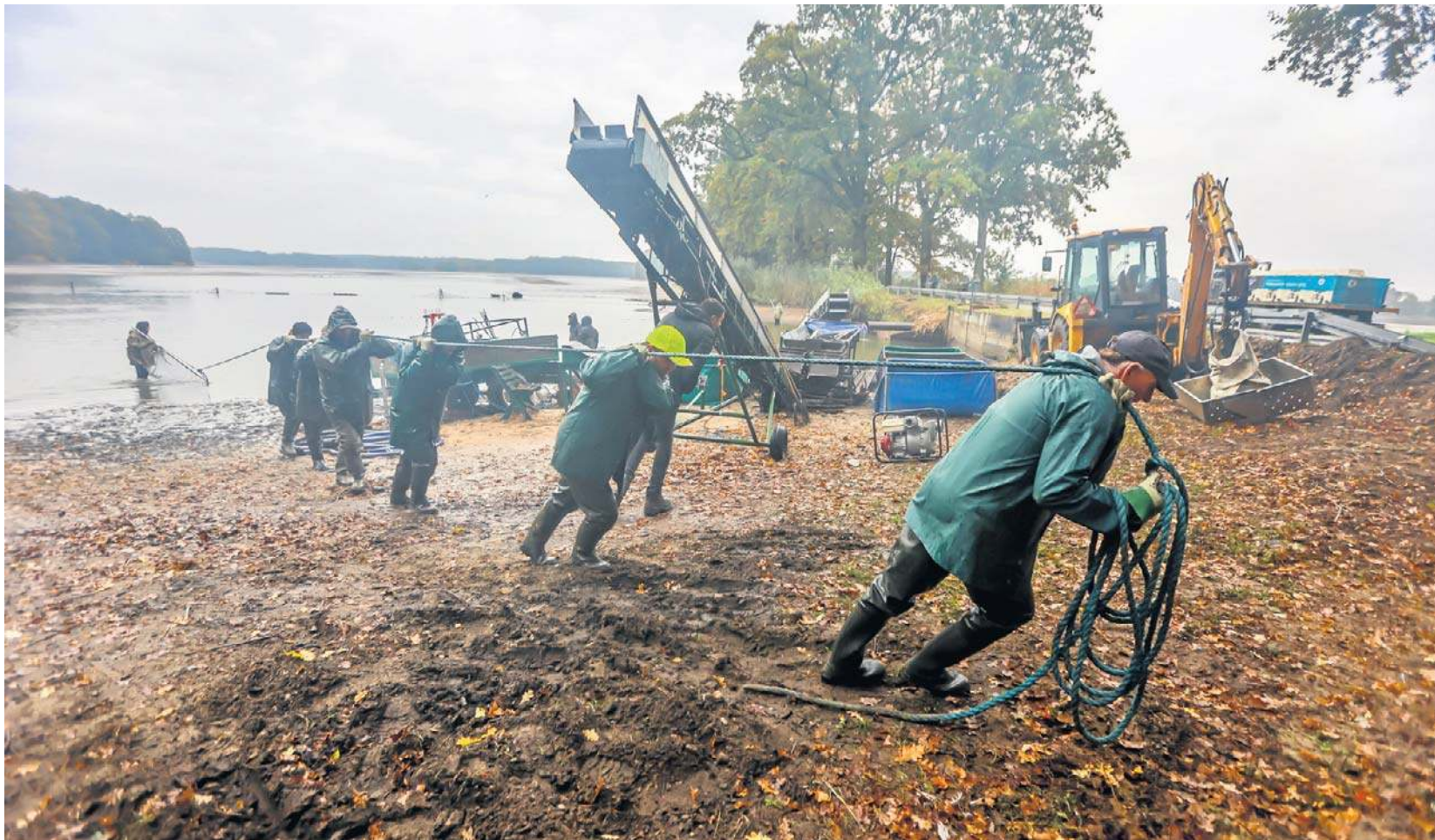
Karpie odławiane są ze Stawów Milickich siłą ludzkich mięśni, tak samo jak dziesiątki, jak setki lat temu

gadanie to dla mnie zagadka. Jadł pan naszego karpia dziś na śniadanie?