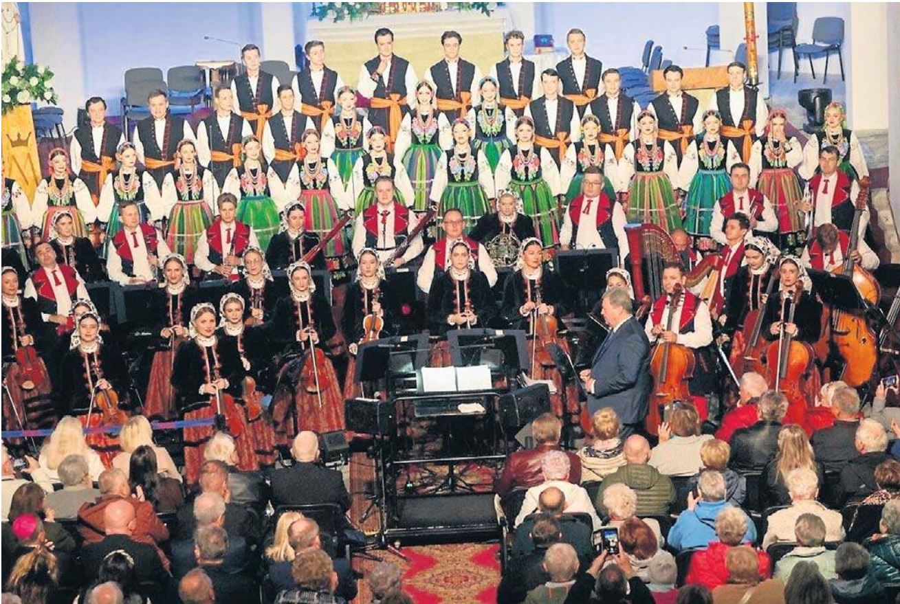
W koncercie pt. „Jan Paweł II. Prorok Nadziei” wystąpił Państwowy Zespół Ludowy Pieśni i Tańca „Mazowsze”. Koncert rozpoczęła pieśń „Gaude Mater Polonia” (Ciesz się Matko Polsko)

LEGNICA PARAFIA PODWYŻSZENIA KRZYŻA ŚWIĘTEGO GOŚCIŁA ARTYSTÓW