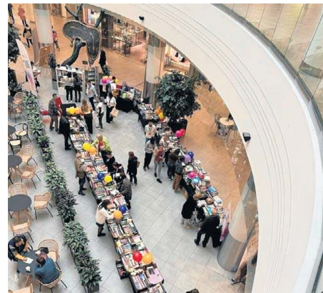
Wrocławski kiermasz książek na rzecz Fundacji

Sama straciła ukochanego syna. - Najlepiej wiem jak ważne jest wsparcie w takich sytuacjach, i dla dziecka, i dla rodziny. W Formule Dobra działa na co dzień 120 osób, lekarzy, pielęgniarek, terapeutów, wolontariuszy. Przyjeżdżają do domów, zapewniają