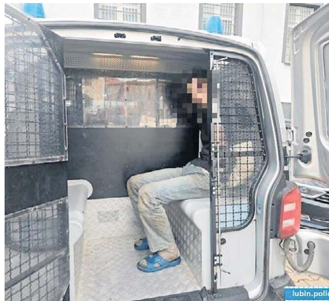
Decyzją sądu trafił już do aresztu tymczasowego

cenia, po czym niespodziewanie wybiegł z nożem w rękę i rzucił nim w kierunku funkcjonariuszy. Ostrze trafiło w nogę jednej z policjantek. Na szczęście obrażenia okazały się niegroźne i kobieta nie wymagała pomocy medycznej.