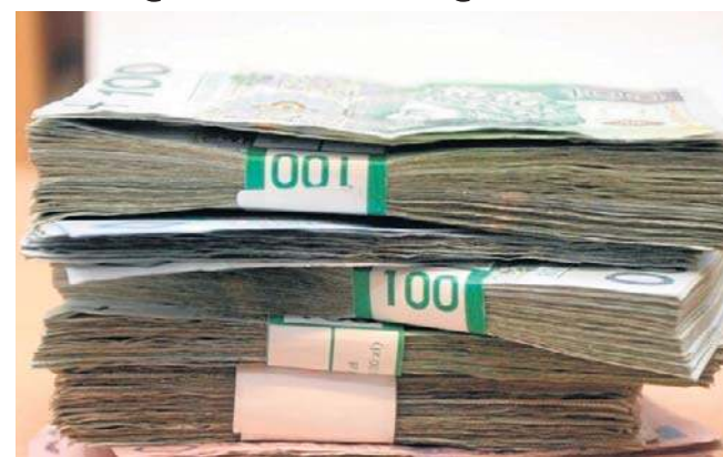
Starsza pani oddała obcej kobiecie 30 tys. zł

Warto zadzwonić do kogoś bliskiego, by opowiedzieć o zdarzeniu. W przypadku jakichkolwiek podejrzeń, że nie jest to członek rodziny, czy prawdziwy funkcjonariusz tylko oszust, prosimy o jak najszybsze powiadomienie policji - mówi podkom. Sylwia Serafin.