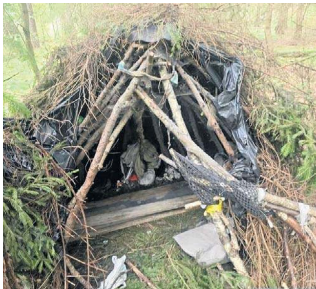
W tym szałasie 34-latek ukrywał się przed więzieniem

Funkcjonariusze zgłoszenie otrzymali od Straży Leśnej. Wynikało z niego, że pracownicy firmy wykonującej prace porządkowe, ujawnili w lesie mężczyznę, który według ich oświadczenia krzyczał do nich, uniemożliwiając kontynuację dalszych prac, a dodatkowo groził, że ma broń i zrobi sobie krzywdę. Był wobec nich bardzo agresywny - informuje podkom. Sylwia Serafin.