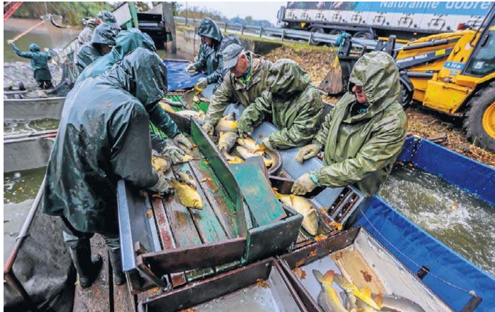
Po wyłowieniu ze stawów ryby są segregowane. Karpie są oddzielane od innych gatunków ryb, które rybacy wyciągnęli w sieci z wody