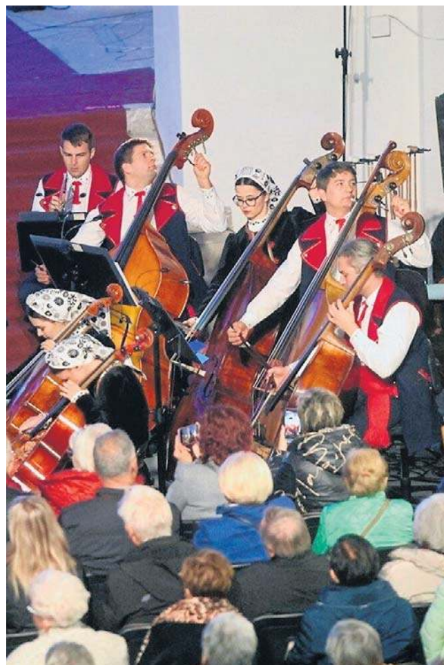
Wysłuchaliśmy pieśni religijnych i patriotycznych. Dochód z cegiełek trafi na pomoc Polakom na Wschodzie