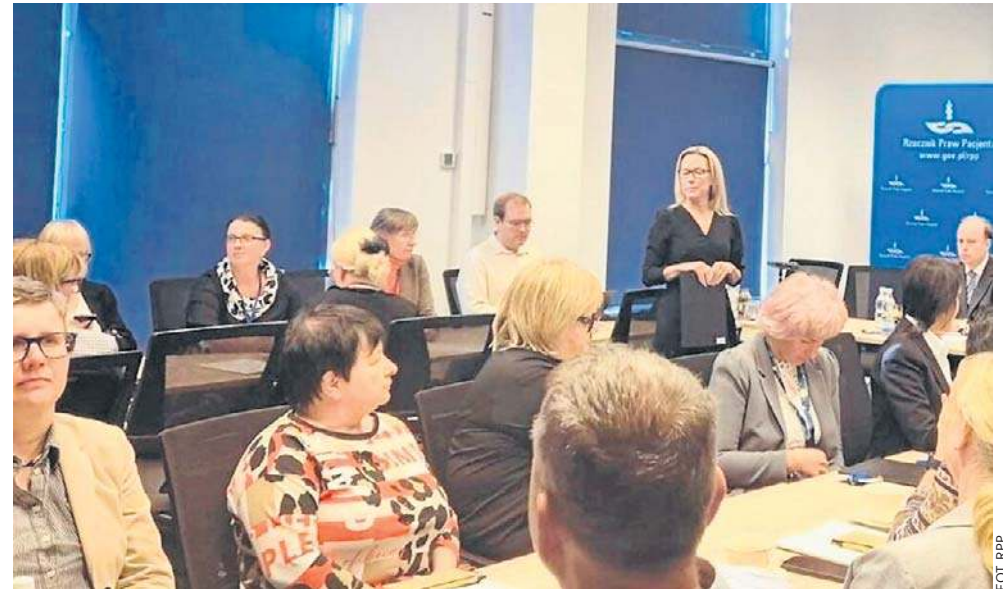
Spotkanie w Warszawie przedstawicieli placówek wybranych do programu

Przedstawiciele wybranych szpitali wzięli już udział w pierwszym spotkaniu, które stanowiło okazję do wymiany doświadczeń, odbyło się wiele ciekawych dyskusji dotyczą-