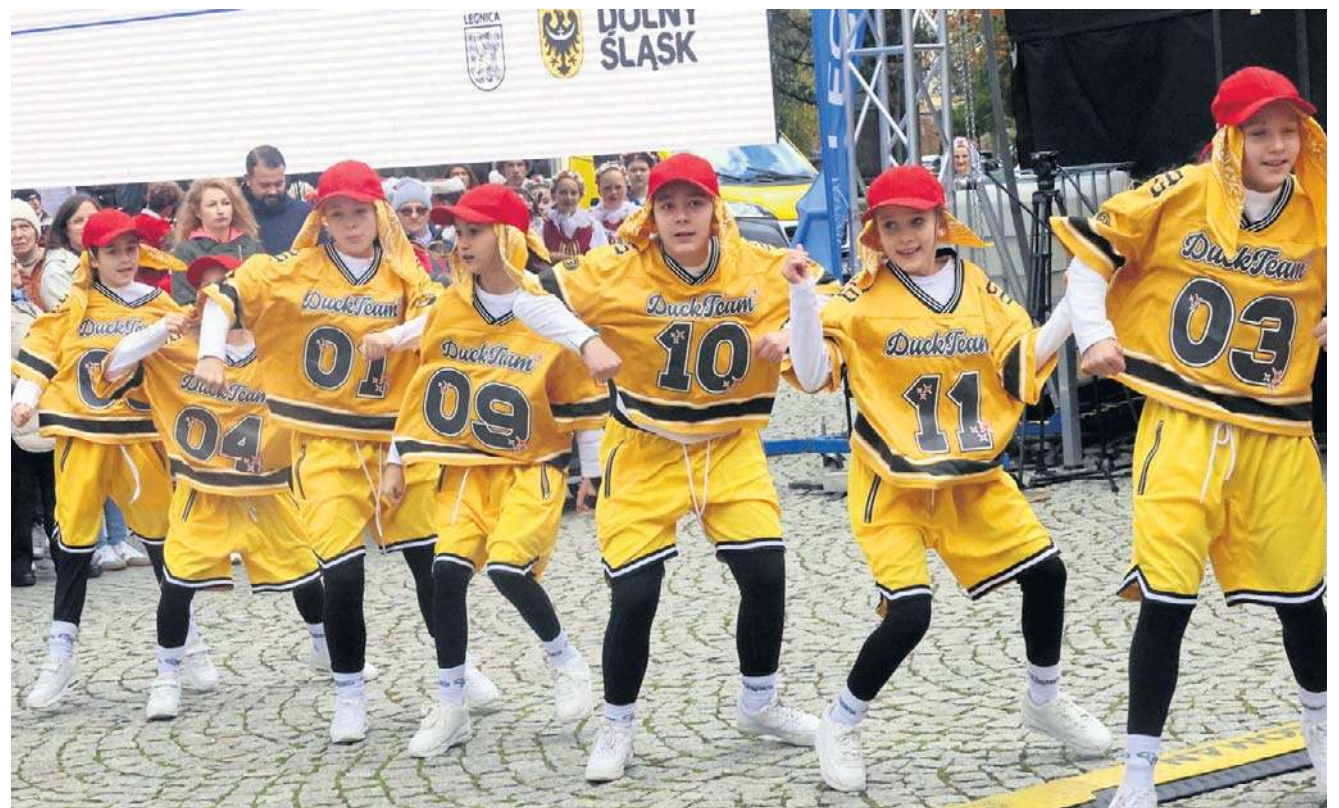
W sobotę na Rynku wystąpiły zespoły taneczne i wokaliści z Młodzieżowego Domu Kultury w Legnicy