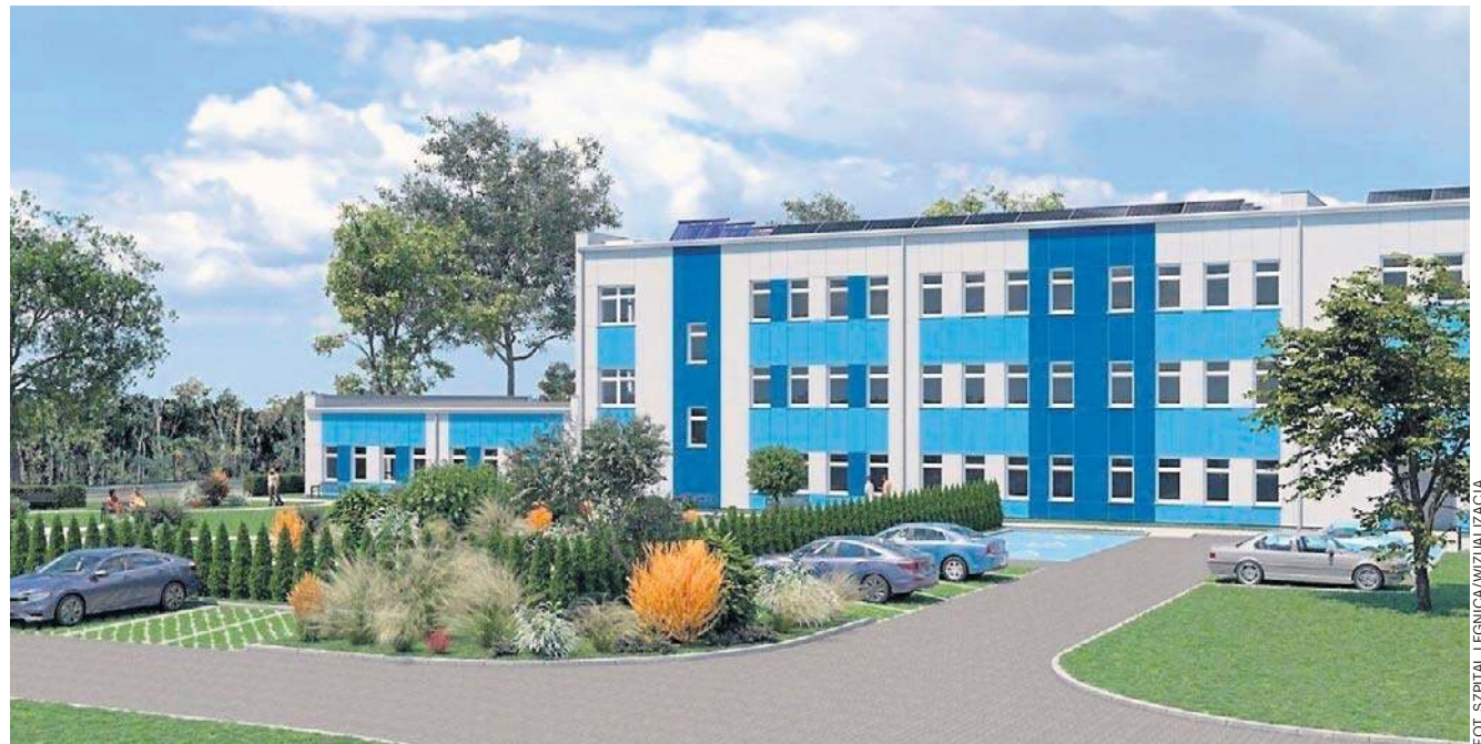
Psychiatria działa w legnickim szpitalu od 16 lat. Za dwa lata wzbogaci się o Centrum Zdrowia Psychicznego