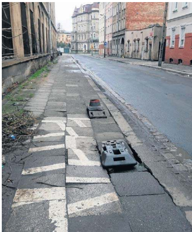
Na liście ulic do remontu jest ulica Emilii Plater

miejsc postojowych, chodników oraz nowoczesnego oświetlenia ulicznego. Projekt zakłada także wykonanie kanalizacji deszczowej, co ma zwiększyć trwałość infrastruktury i komfort użytkowników.