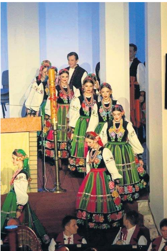
Zespół „Mazowsze” działa od wielu lat, ma swoją siedzibę w podwarszawskim Karolinie