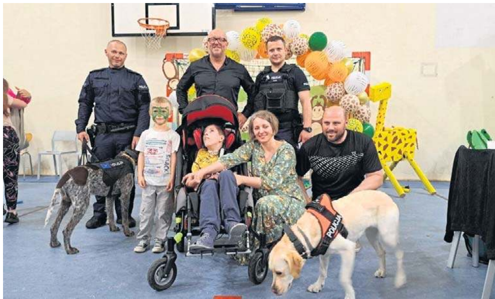
Fundacja „Formuła Dobra” wspiera rodziny, wypożyczając np. potrzebny sprzęt

- Zainteresowanie przeszło nasze najsmielsze oczekiwania.