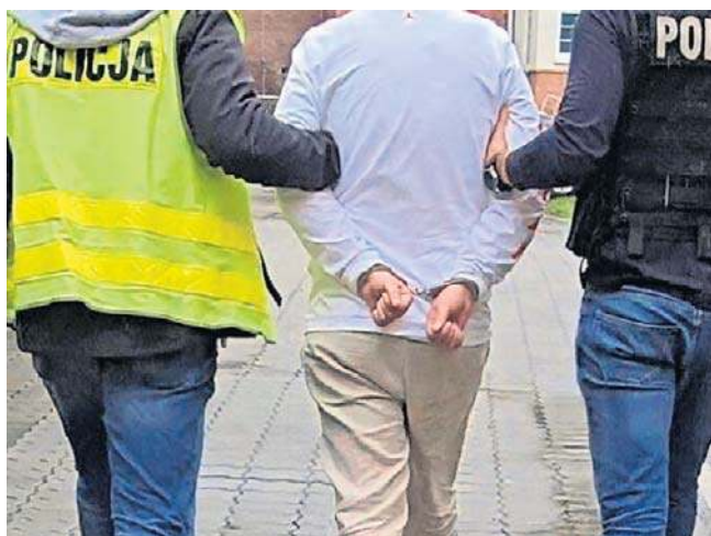
„Specjaliści” od sprzętu RTV i AGD zostali aresztowani tymczasowo na trzy miesiące, grozi im do 8 lat więzienia

Z dotychczasowych ustaleń wynika, że zatrzymani dokonali kradzieży w sklepach na terenie województw: dol-