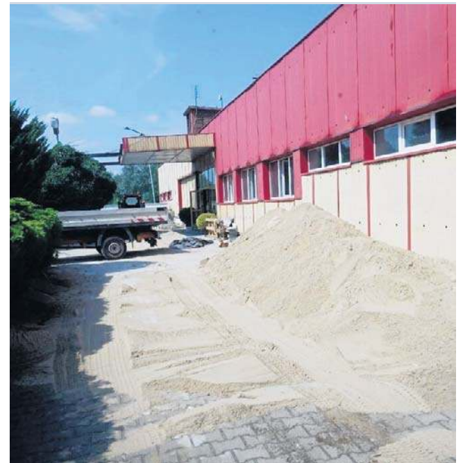
Trwa remont zaplecza szatniowo-sanitarnego

- Trzecim, ostatnim etapem będzie termomodernizacja, która zakończy w ciągu dwóch lat cały proces unowocześnienia obiektu, poprawi przede wszystkim komfort użytkownika dla zawodników i kibiców - podkreślano na konferencji.