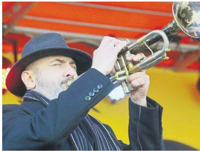
Podczas uroczystości otwarcia święta Zespół Pieśni i Tańca „Legnica” zaprosił do poloneza na płycie Rynku