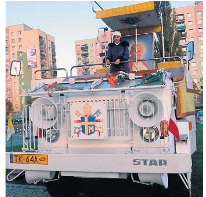
Przed kościołem zaparkował pojazd, którym Jan Paweł II poruszał się podczas pierwszej pielgrzymki do Polski