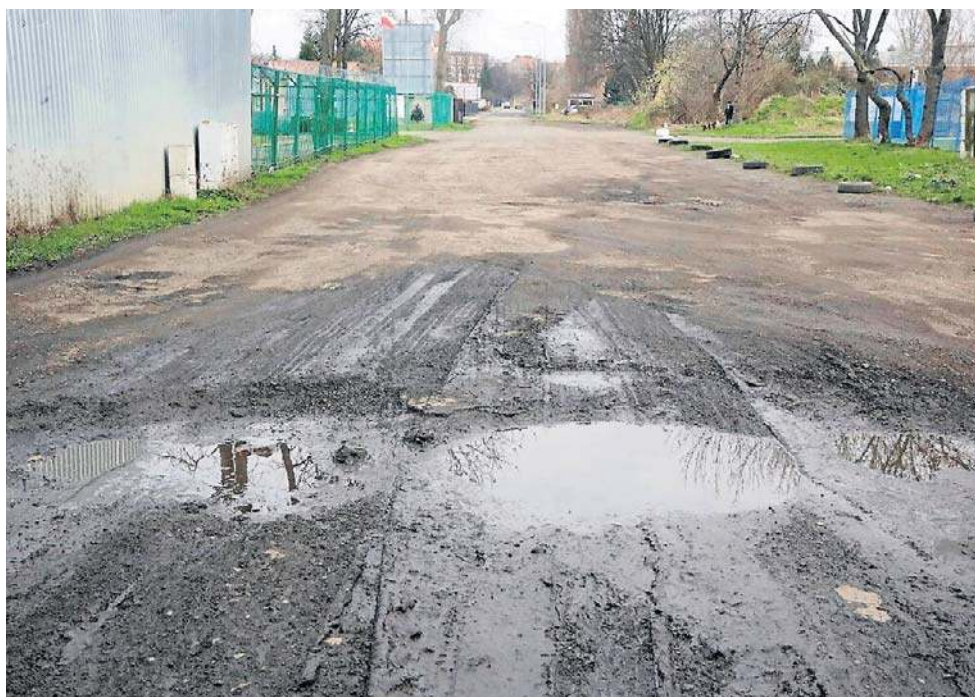
W latach 2026-2027 przebudowane będą ulice Senatorska i Przemysłowa (na zdjęciu)

Również w 2026 roku powstanie nowy parking przy ul. Neptuna, obejmujący budowę