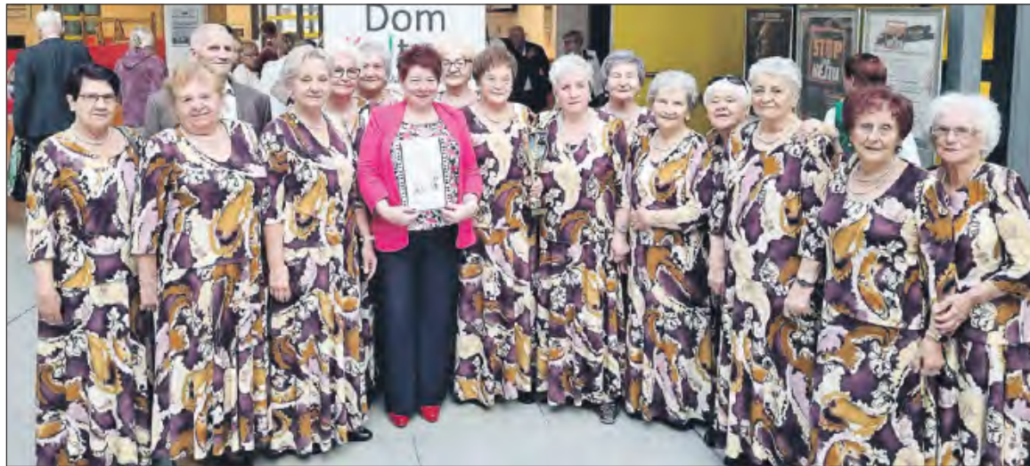
☛ Po wysłuchaniu wokalistów i instrumentalistów wręczono statuetki, dyplomy oraz upominki

Chór „Jesienna Róża” z Miejskiego Domu Kultury w Dęblinie wziął udział w 29. Ogólnopolskim Przeglądzie Piosenki Biesiadnej w Kozienicach