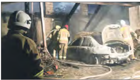
■ Ze względu na dużą ilość nagromadzonych przedmiotów oraz pojazdów wewnątrz budynku, zaszła potrzeba opróżnienia go w celu dokładnego dogaszenia wszystkich zarzewi ognia

Z żywiołem walczyło 8 zastępów straży pożarnej. W ubiegłą niedzielę wieczorem służby zostały zaalarmowane o wybuchu pożaru w miejscowości Kokoszka. Palili się budynek gospodar-