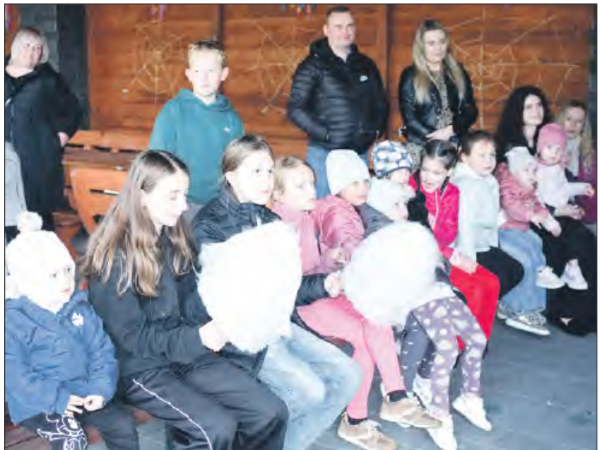
☛ Gry i konkursy zgromadziły sporą liczbę dzieci

palm w Izbie Tradycji i reprezentowanie sołectwa na kiermaszu wielkanocnym; zorganizowanie Dnia Dziecka; udział gospodyń w gminnych dożynkach (wicie wieńca i wystawienie stoiska); zorganizowanie letniej potańcówki.