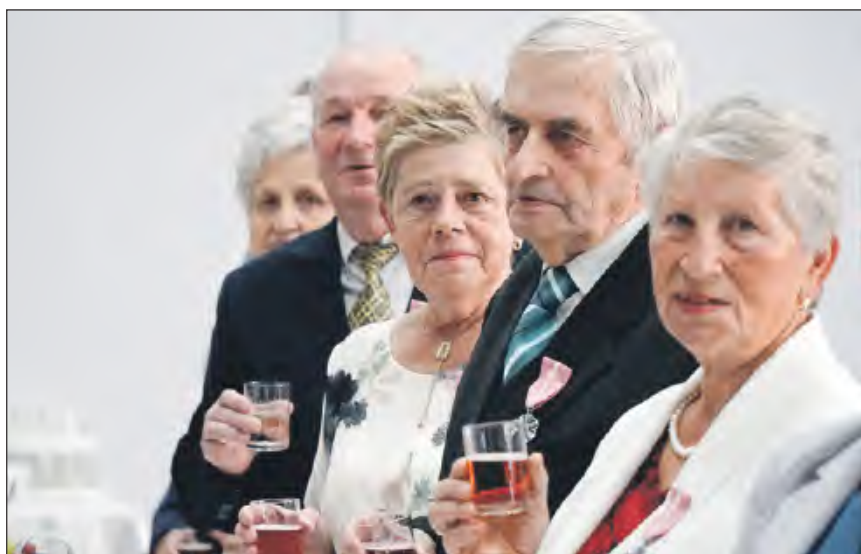
Jubilaci oraz ich goście wzniesli toast za dotychczasowe wspólne lata w małżeństwie