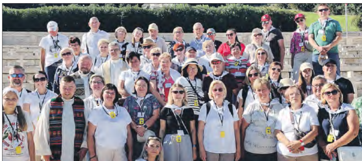
Pielgrzymka była dość liczna, bo oprócz parafian z Piotrowic uczestniczyli w niej wierni z parafii w Warszawicach i Radczu

Grupa parafian z Piotrowic, na czele ze swoim proboszczem, a także osoby z Warszawic i Radcza, wzięła udział w kilkudniowej, licznej pielgrzymce do Włoch. Plan był bardzo bogaty i zakładał odwiedzin wielu znanych miejsc. Pielgrzymkę rozpoczęto od Monte Cassino i oddania hołdu polskim żołnierzom walczącym w bohaterskiej bitwie. Po Mszy św. pielgrzymi zwiedzili jeszcze Opac-two Św. Benedykta. Kolejnym celem był Neapol. Pielgrzymi dotarli