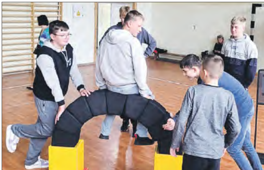
☛ Eksponaty tworzące „O matmo!” podzielone są na trzy grupy tematyczne: matematyka stosowana, podstawy matematyki i matematyka rekreacyjna. Uczniowie mogli m.in. zbudować fuk

Uczniowie z gminy Nowodwór mogli na własne oczy przekonać się, gdzie w otaczającym świecie odnaleźć można matematykę. Mobilna wystawa odwiedza szkoły, które zgłosiły zainteresowanie ekspozycją jeszcze w styczniu. Aby się zakwalifikować, wnioskodawcy musieli przekonać orga-