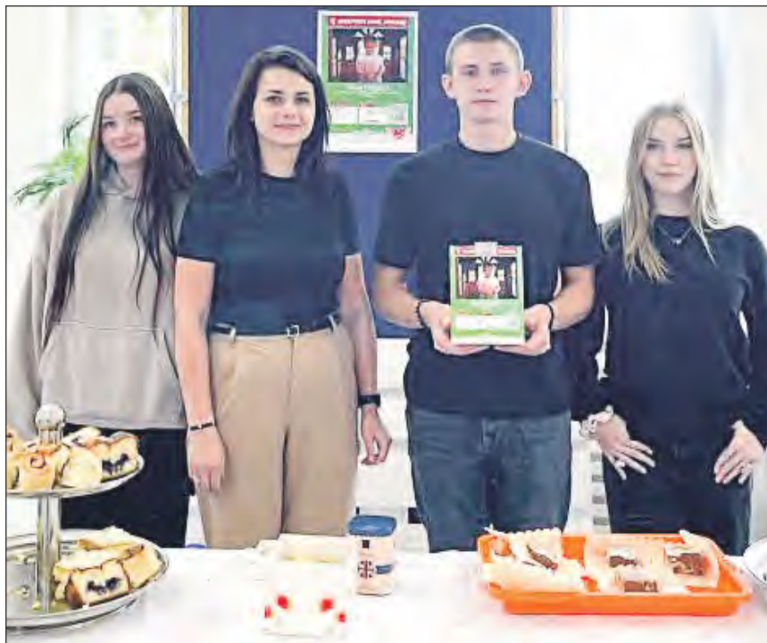
■ Nauczyciele i uczniowie ZSZ nr 2 w Dęblinie zorganizowali kiermasz ciast. Dochód ze sprzedaży w całości trafił na rzecz chorej dziewczynki

Szpital w Lublinie zareagował błyskawicznie - przeprowadzono operację usunięcia guza i rozpoczęto chemioterapię. Niestety, mimo natychmiastowego leczenia, przerzuty zostały potwierdzone. Choroba ta często daje niespecyficzne objawy i bywa rozpoznawana dopiero w za-