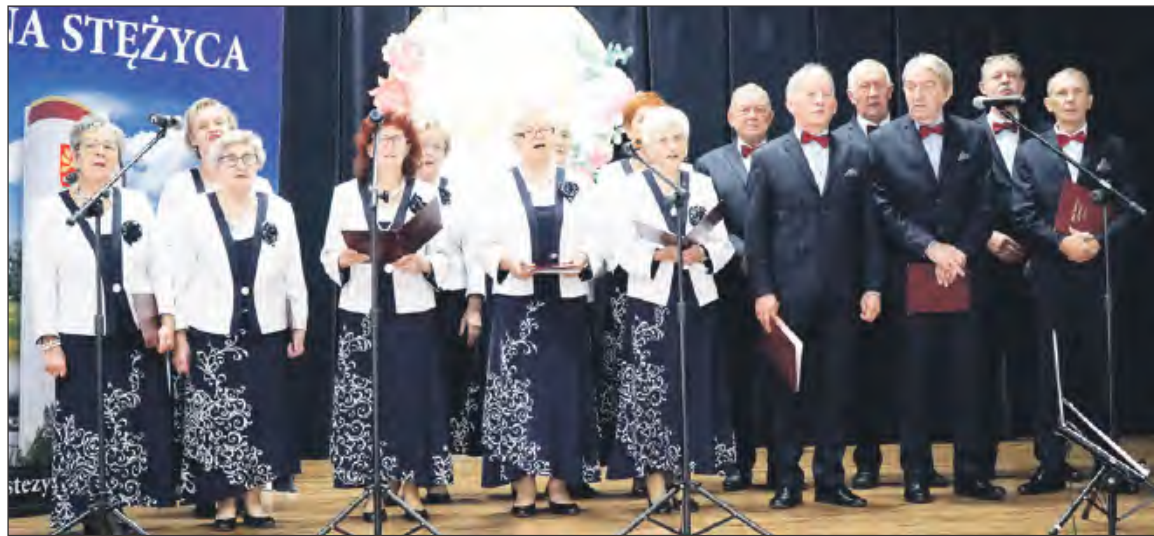
Uroczystą Galę uświetnił występ Chóru Seniora „Zorza” ze Steżyczy

Mimo trudności, pokus i różnicy charakterów, nadal idą razem przez życie. Dwanaście małżeństw z gminy Steżycza, które w ubiegłym roku obchodziły Złote Gody, zostało uhonorowanych przez Prezydenta RP