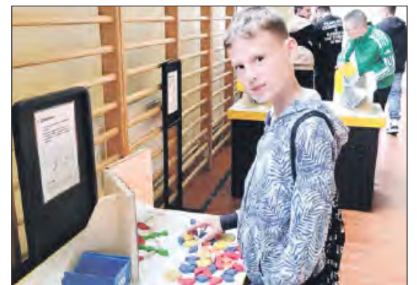
☛ Na ekspozycję składają się 22 eksponaty, które zachęcają widzów do samodzielnego odkrywania, zadawania pytań i refleksji nad tym, gdzie na co dzień spotykają matematykę