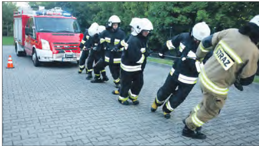
☛ Zadanie polegało na przeciągnięciu wozu bojowego na odległość minimum 5 metrów. Strażacy ze Swat bez najmniejszego problemu wykonali zadanie