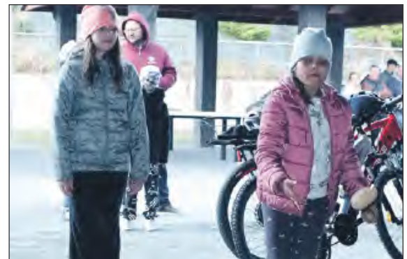
☛ Jedną z konkurencji polegała na celowaniu ziemniakiem do wiklinowego kosza