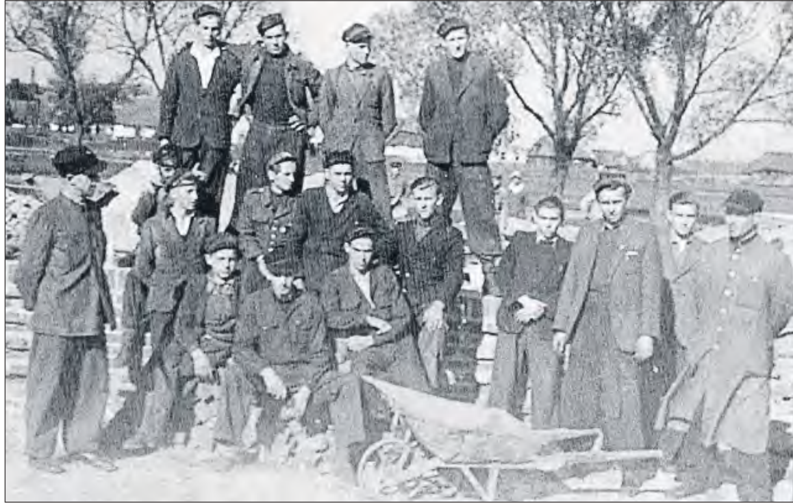
Uczniowie - budowniczości szkoły

H istoria szkoły rozpoczęła się jesienią 1945 roku, kiedy powołano do życia Publiczną Średnią Szkołę Zawodową przy Parowozowni w Dęblinie. Była to bezpośrednia odpowiedź na potrzeby środowiska lokalnego, a zwłaszcza na zapotrzebowanie Dęblińskiego Węzła Kolejowego, który odgrywał wówczas ogromną rolę gospodarczą w regionie. Dzięki determinacji i zaangażowaniu grona pedagogicznego oraz społeczności lokalnej, kształcenie pierwszych uczniów rozpoczęło się w pomieszczeniach socjalnych Związku Zawodowego Kolejarzy. Choć brakowało mebli, pomocy dydaktycznych i odpowiedniego zaplecza, od samego początku przyświecała wszystkim idea stworzenia miejsca, w którym młodzież będzie mogła zdobywać wiedzę i umiejętności zawodowe, przygotowując do pracy w ważnych dla kraju gałęziach gospodarki.