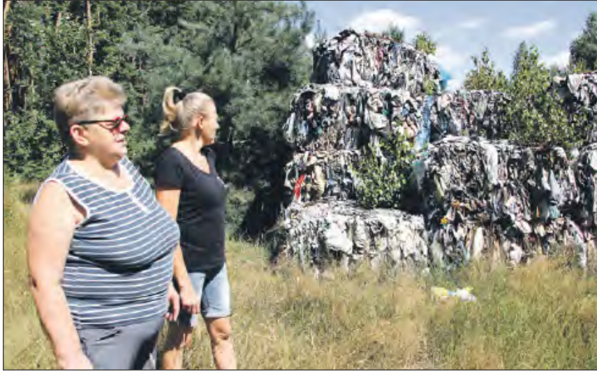
■ Mieszkańcy Owni wciąż z niepokojem patrzą na górę gnijących ubrań

Prokuratura Rejonowa w Rykach skierowała do sądu akt oskarżenia przeciwko Tomaszowi M., podejrzanemu o nieodpowiednie postępowanie z odpadami. Oskarżonemu grozi od roku do 10 lat więzienia