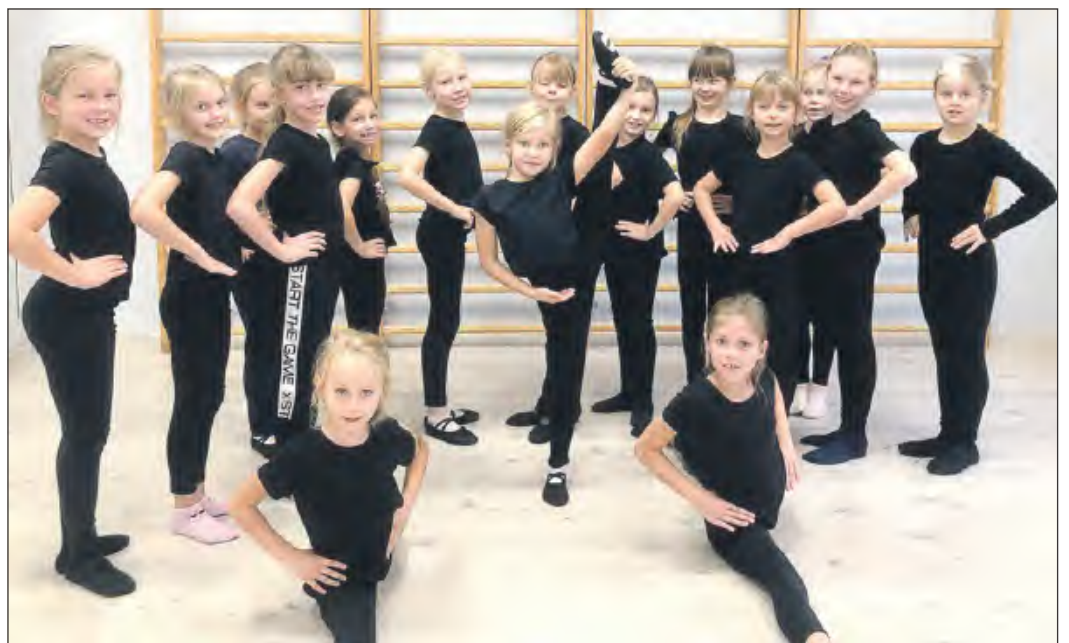
☛ Młodziutkie tancerki Małej Rewii Tanecznej z grupy „Czarodziejek” są pełne zapału i chęci do zdobywania nowych szlifów tanecznych