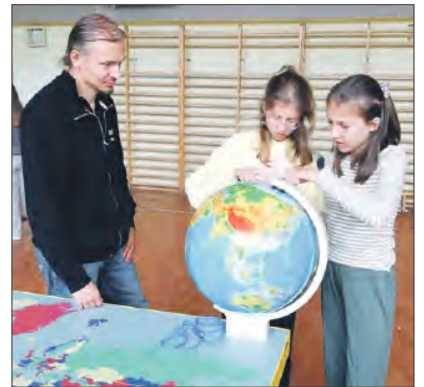
☛ Uczniowie i nauczyciele, mogli korzystać nieodpłatnie z interaktywnych eksponatów, eksperymentować z edukatorami z Centrum Nauki Kopernik, zadawać pytania i sprawdzać się nie tylko w działaniach matematycznych