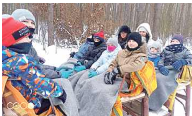
Kulminacją zimowych atrakcji był Zimowy Kulig. W programie przewidziano przejażdżki wśród zimowych krajobrazów