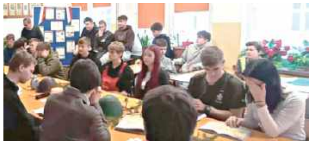
W ZSZ nr 1 im. gen. F. Kleeberga w Dęblinie odbyło się patriotyczne spotkanie poświęcone Polakom walczącym na frontach II wojny światowej

W czwartek, 15 stycznia w ZSZ nr 1 im. gen. F. Kleeberga w Dęblinie odbyło się spotkanie patriotyczne poświęcone Polakom walczącym na frontach II wojny światowej.