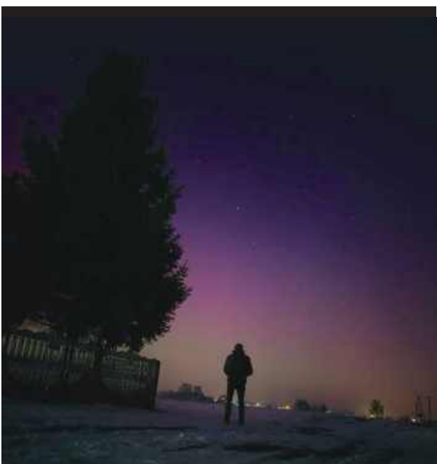
Różne kolory zorzy w zimową noc.

i żółć, tworząc świetlistą kurtynę nad horyzontem. Zorza była widoczna gołym okiem, a jej intensywność momentami przypominała obrazy znane z dalekiej północy Europy – opowiada pan Tomasz.