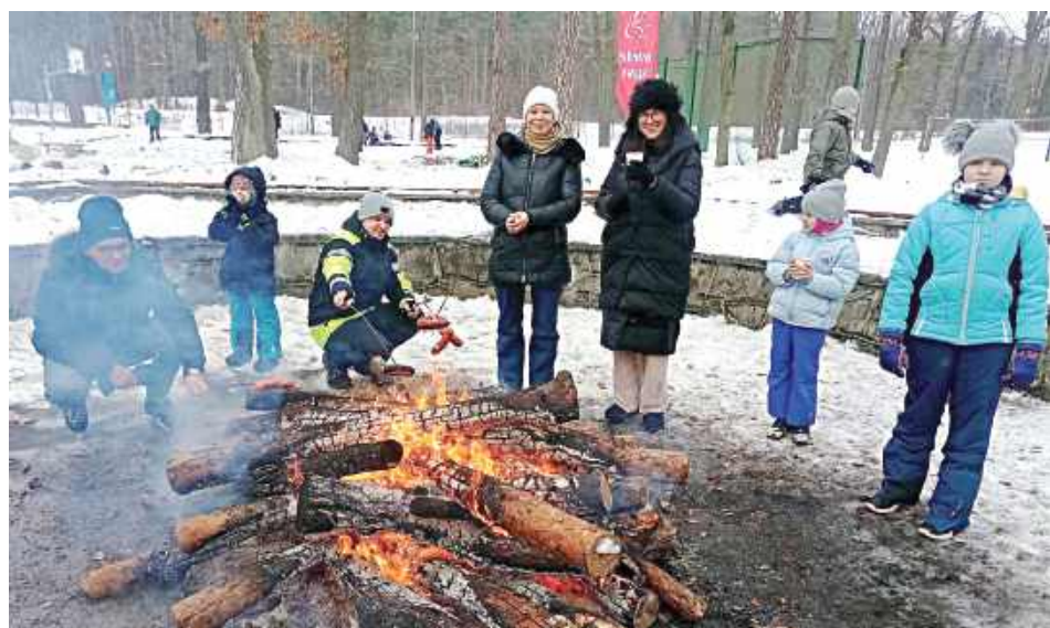
Wspólne ognisko, pieczenie kiełbasek, żołnierska grochówka. W Stawach się działo!