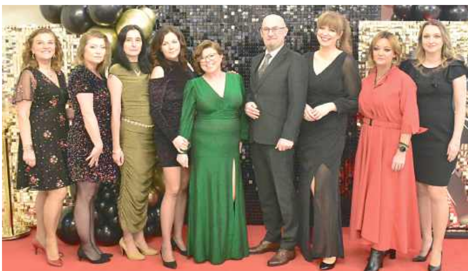
Grono pedagogiczne Zespołu Szkół Zawodowych nr 1 w Dęblinie wraz z dyrektorem