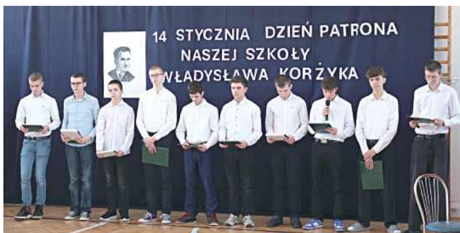
Podczas wydarzenia uczniowie mieli okazję przypomnieć sobie sylwetkę patrona oraz historię placówki