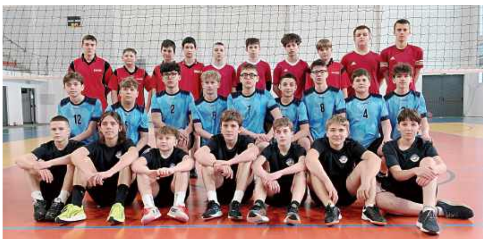
Pamiątkowe zdjęcie wszystkich ekip, które rywalizowały w finale powiatowym w siatkówce

Puchary i dyplomy dla wszystkich uczestniczących drużyn ufundowało Starostwo Powiatowe w Rykach. Organizator rywalizacji przewodniczący Powiatowego Szkolnego Związku Sportowego w Rykach podziękował dyrekcji Centrum Kultury i Sportu w Rykach za udostępnienie hali sportowej, w której odbyły się zawody.