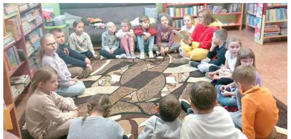
Wspólne świętowanie Dnia Kubusia Puchatka okazało się nie tylko doskonałą okazją do rozwijania zainteresowań czytelniczych najmłodszych, ale także do kreatywnej i radosnej zabawy w bibliotece

Podczas wizyty w bibliotece dzieci miały okazję obejrzeć prezentację przybliżającą historię Kubusia Puchatka oraz wysłuchać bajki pt. „Kubuś Puchatek - urodziny Puchatka”. Bibliotekarka przeczytała również pierwszy rozdział książki A.A. Milne'a „Kubuś Puchatek”,