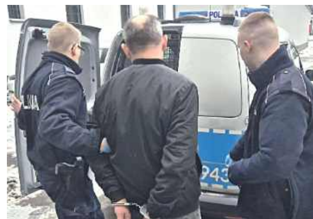
48-latek został zatrzymany!

Policjanci z Adamowa otrzymali zgłoszenie o poważnej awanturze w jednym z domów. Agresorem okazał się 48-latek, który fizycznie i psychicznie znęcał się nad żoną i córkami.