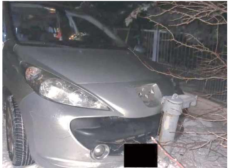
Po przybyciu na miejsce policjanci zastali niecodzienny widok. Za kierownicą uszkodzonego pojazdu spał 42-letni mieszkaniec powiatu garwolińskiego

Do niebezpiecznego zdarzenia doszło w miniony piątek wieczorem w miejscowości Niwa Babicka. Kierujący samochodem osobowym marki Peugeot stracił panowanie nad pojazdem i uderzył w przydrożny hydrant. Auto zatrzymało się bezpośrednio na nim, a silnik cały czas pracował.