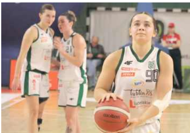
Lubelskie koszykarki przeszły do historii!