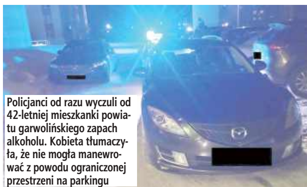
Policjanci od razu wyczuli od 42-letniej mieszkanki powiatu garwolińskiego zapach alkoholu. Kobieta tłumaczyła, że nie mogła manewrować z powodu ograniczonej przestrzeni na parkingu

W minioną sobotę wieczorem doszło do nietypowej kolizji na jednym z parkingów pod lokalem gastronomicznym w Rykach.