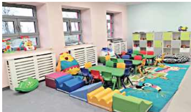
Kolorowe przyjazne wnętrza czekają na dzieci

Dzięki dofinansowaniu z Polskiego Ładu i Krajowego Planu Odbudowy w Nowodworze wybudowano dwufunkcyjny budynek, w którym mieszczą się przedszkole i żłobek. Obiekt pochłonął 6 mln zł. Pierwsza z placówek zainaugurowała działalność we wrześniu i uczęszcza do niej blisko 60 dzieci. Druga miała ruszyć od stycznia 2026 roku, ale moment otwarcia przedłuża się i ostatecznie nastąpi to z początkiem lutego. Kolejna dobra wiadomość zainteresuje rodziców. Jeżeli zwlekali z zapisami, mogą to jeszcze zrobić. Dlaczego warto? Żłobek „Smerfuś” to nie tylko opieka na czas, kiedy dorośli idą do pracy. To miejsce, w którym maluch rozwija się w bezpiecznym i przyjaznym środowisku. Dzieci uczą się samodzielności, nawiązują pierwsze przyjaźnie, rozwijają kreatywność i poznają świat w zabawowy sposób. Rodzice zyskują spokój i pewność, że ich pociecha jest pod fachową opieką, a dziecko łatwiej przygotowuje się do kolejnego etapu