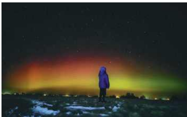
Syn pana Tomasza dzielnie trwał z tatą na fotograficznej wyprawie po zdjęcia zorzy.

- Niebo nad wsią rozbłysło intensywnymi kolorami. Dominowała głęboka czerwień, która płynnie przechodziła w zieleń