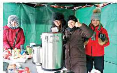
Kulminacją zimowych atrakcji był zimowy kulig. W programie przewidziano przejażdżki wśród zimowych krajobrazów, wspólne ognisko, pieczenie kiełbasek, żołnierską grochówkę oraz gorącą herbatę