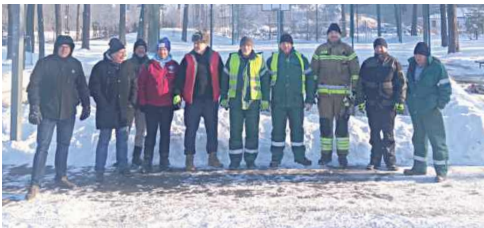
Zimowa inicjatywa na Osiedlu Stawy po raz kolejny pokazuje, że wspólne działania lokalnej społeczności mogą przynieść realne efekty i stworzyć przestrzeń do aktywnego, rodzinnego spędzania czasu

Na Osiedlu Stawy w Dęblinie ponownie zagościła prawdziwa zima, a wraz z nią osiedlowe lodowisko, które powstało dzięki zaangażowaniu mieszkańców oraz wsparciu lokalnych instytucji. W sobotę odbyła się plenerowa impreza zimowa połączona z kuligiem.