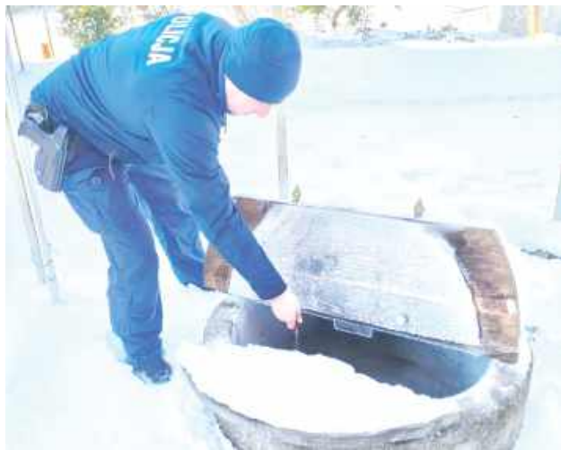
Do domu przyniesiono drewno i rozpalono ogień w kuchni, dostarczono wodę ze studni oraz sprawdzono, czy senior posiada zapasy żywności

Podczas mrozów 81-letni mieszkaniec gminy Kłoczew znalazł się w trudnej sytuacji z powodu bardzo niskiej temperatury panującej w jego domu. O sprawie został poinformowany dzielnicowy z Komendy Powiatowej Policji w Rykach przez pracownicę socjalną, która przekazała, że senior ma problemy z samodzielnym rozpaleniem ognia w kuchni będącej jedynym źródłem ogrzewania budynku.