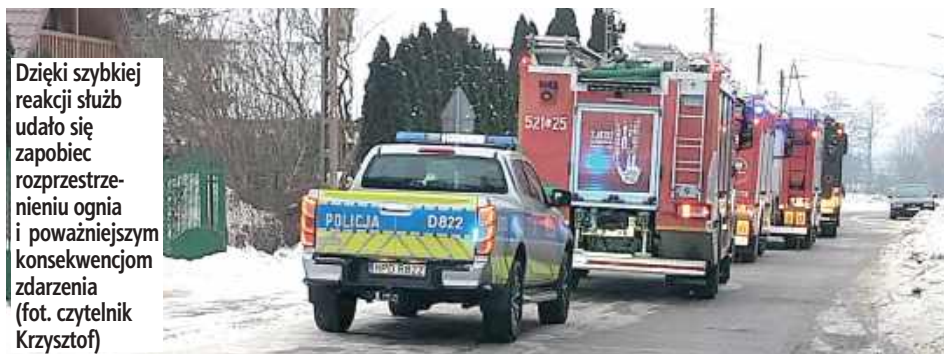
Dzięki szybkiej reakcji służb udało się zapobiec rozprzestrzenieniu ognia i poważniejszym konsekwencjom zdarzenia

23 stycznia strażacy interweniowali przy ul. Starej w Dęblinie, gdzie doszło do zagrożenia pożarowego spowodowanego nieszczelnym przewodem kominowym na poddaszu budynku, w części nad kotłownią.