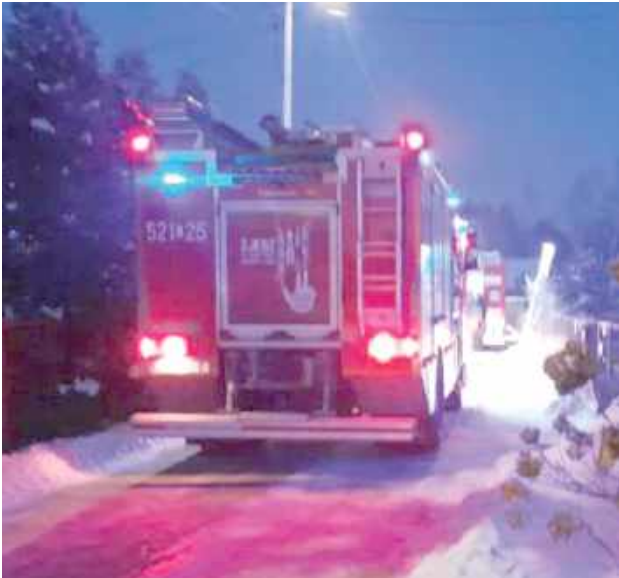
Pożar spowodował znaczne straty w sprzęcie i wyposażeniu garażu

19 stycznia w Dęblinie przy ul. Kołłątaja wybuchł pożar w garażu, w którym znajdowały się trzy motocykle, quad, rowery oraz różnorodne narzędzia i sprzęt ogrodniczy.