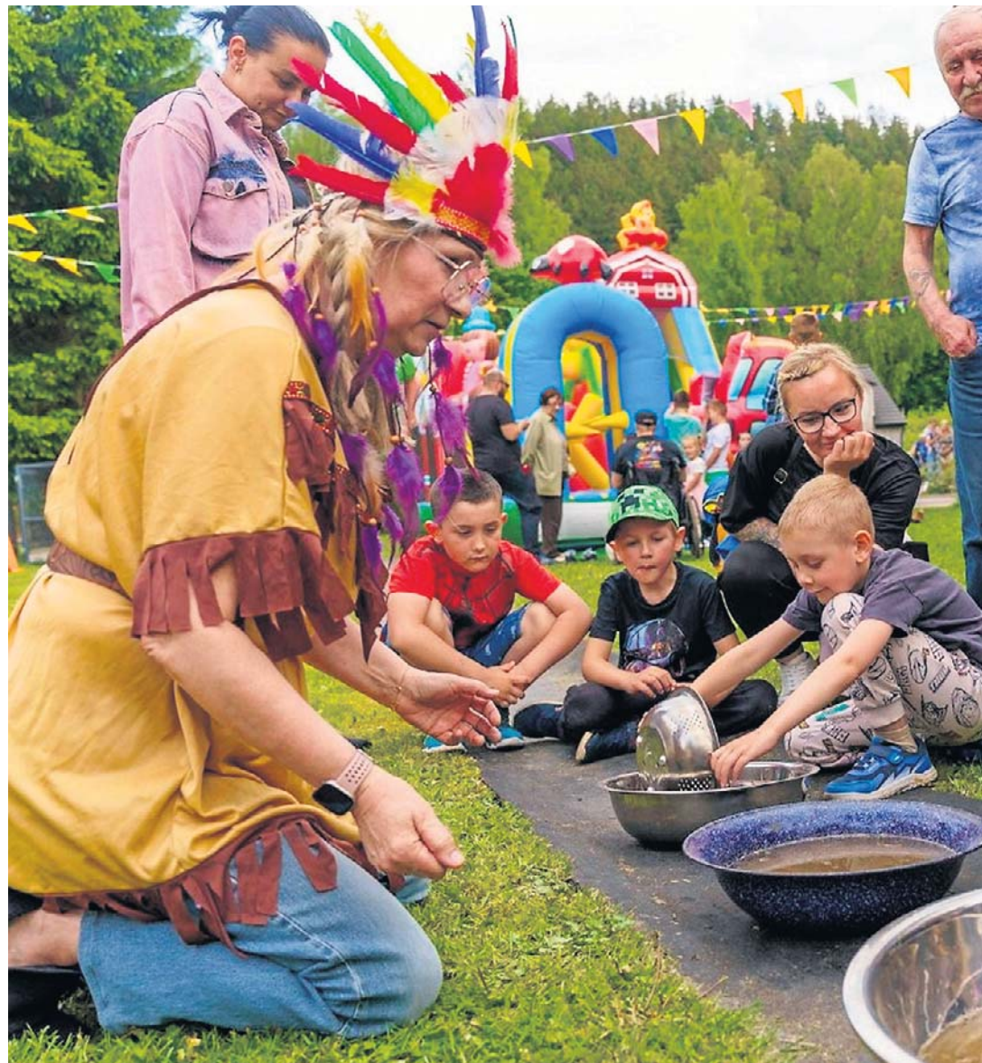
Teren przy Publicznej Szkole Podstawowej w Kowalowej (gmina Mieroszów) zamienił się na kil