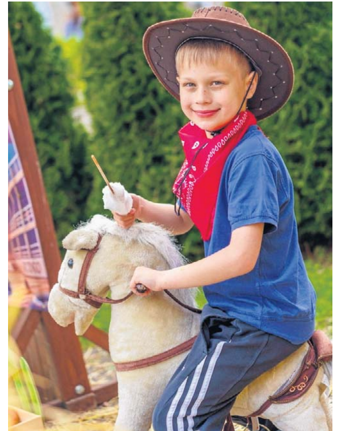
Na razie konik bujany, ale w przyszłości... Kto wie? Ten młodzian ma wyraźne zadatki na kowboja z krwi i kości.