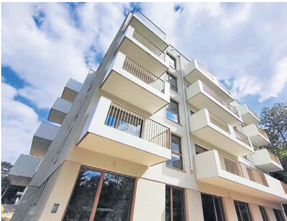
Jak zapewniają wykonawcy, takich balkonów i tarasów nie ma nigdzie indziej w mieście.

czenie widywaliśmy dotąd jedynie w wysokościowcach. To najwyższy standard.