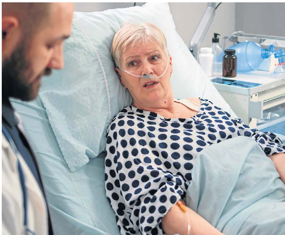
Problem pojawia się wtedy, gdy ból pooperacyjny lub pourazowy nie jest skutecznie kontrolowany i przechodzi w postać przewlekłą.

- Pacjenci nie są w stanie kontynuować pracy, uprawiać