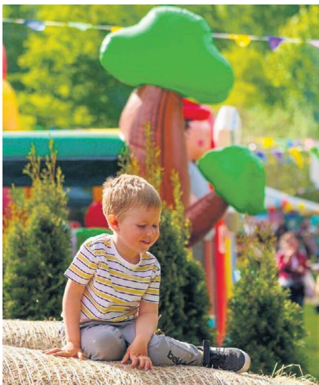
Przygotowano jedzenie, dmuchańce, malowano tatuaże, pleciono warkoczki, był grill, popcorn i wata cukrowa.