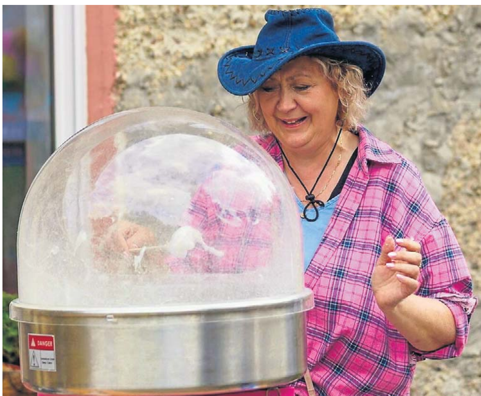
W całej gminie było słyhać indiańskie okrzyki, a przy szkole trwała zabawa.