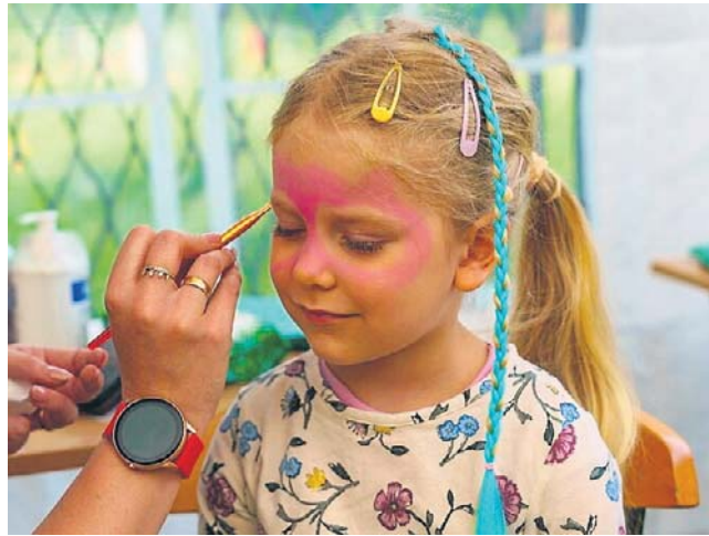
Ta miła blondyneczka zapragnęła być „czerwoną twarzą”. Marzenie dziewczynki zostało spełnione w mig!