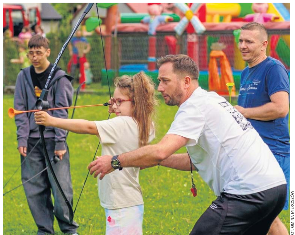
Hitem festynu okazało się strzelanie z łuku. Było też rzucanie lassem i płukanie złota.