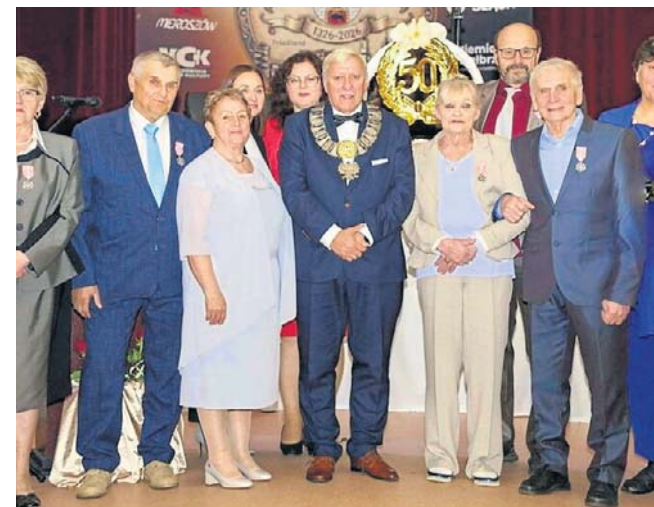
W Mieroszowie kilkanaście par świętowało Złote, a nawet Smaragdowe Gody. Wszystkie otrzymały medale.

Zjawisko zaczęło się w maju 2007 roku. Wtedy zdjęcia dziwnego obiektu na niebie w po-