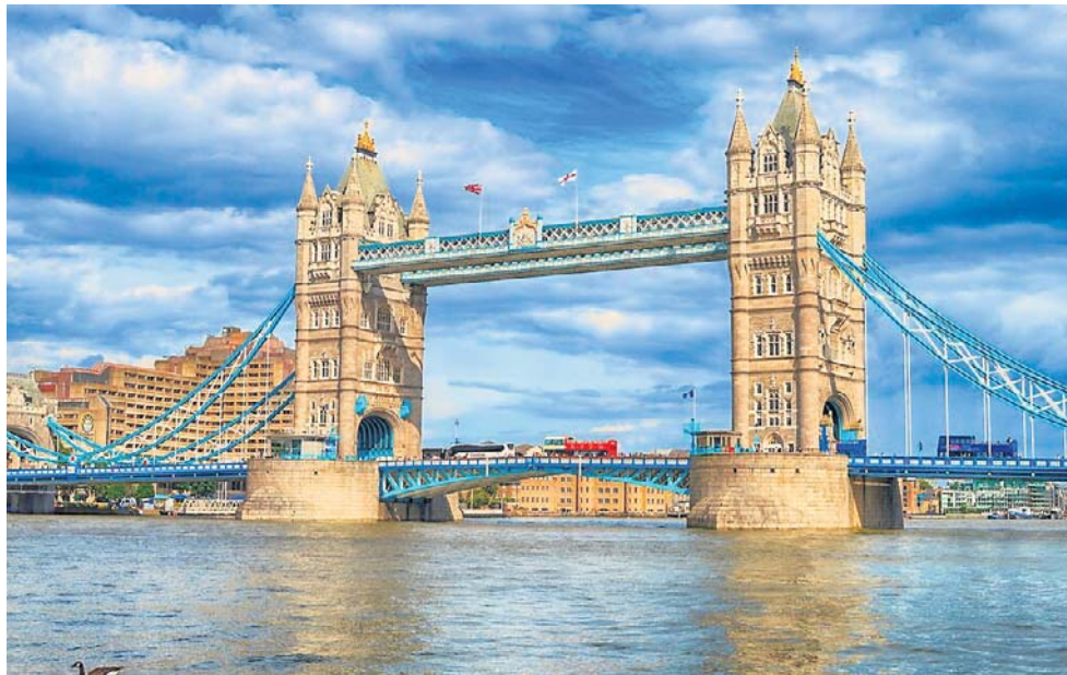
Wielka Brytania była głównym celem polskiej emigracji zarobkowej po wejściu Polski do UE, gromadząc ponad milion Polaków. Obecnie trend się odwrócił.

Znają świetnie język angielski, ale czy to dziś wystarczy, żeby w Polsce dostać dobrą pracę, gdy wiele osób tutaj też zna języki? Niektórzy wracają ze zwierzętami.