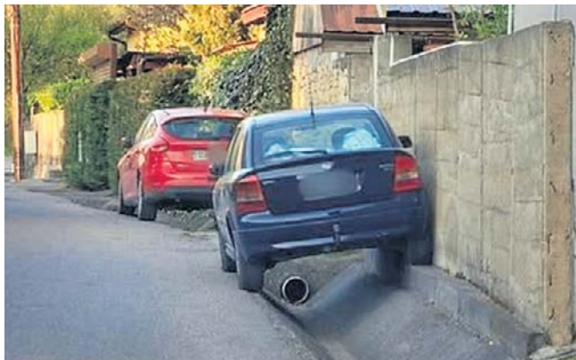
FOT. ŚWIĘTE KROWY WAŁBRZYCH

Co powiecie na takie parkowanie? W sumie trzeba nie dać umiejętności, by tak ustawić samochód nad kanałem.