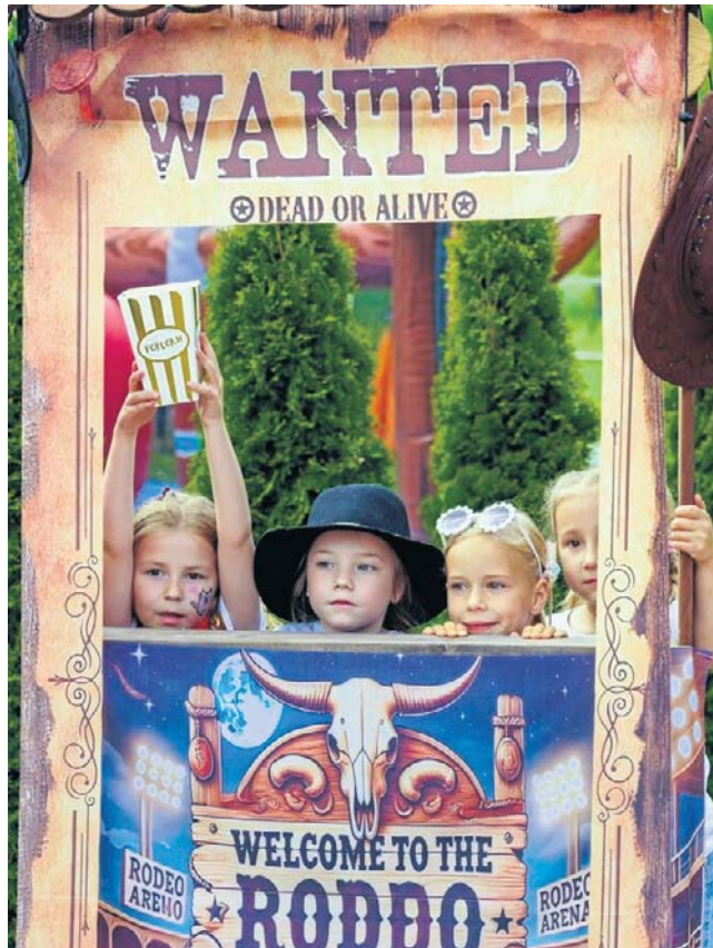
Pojawiły się też listy gończe. Tych czworo „przestępców” z pewnością nie ma na sumieniu ciężkich grzechów.