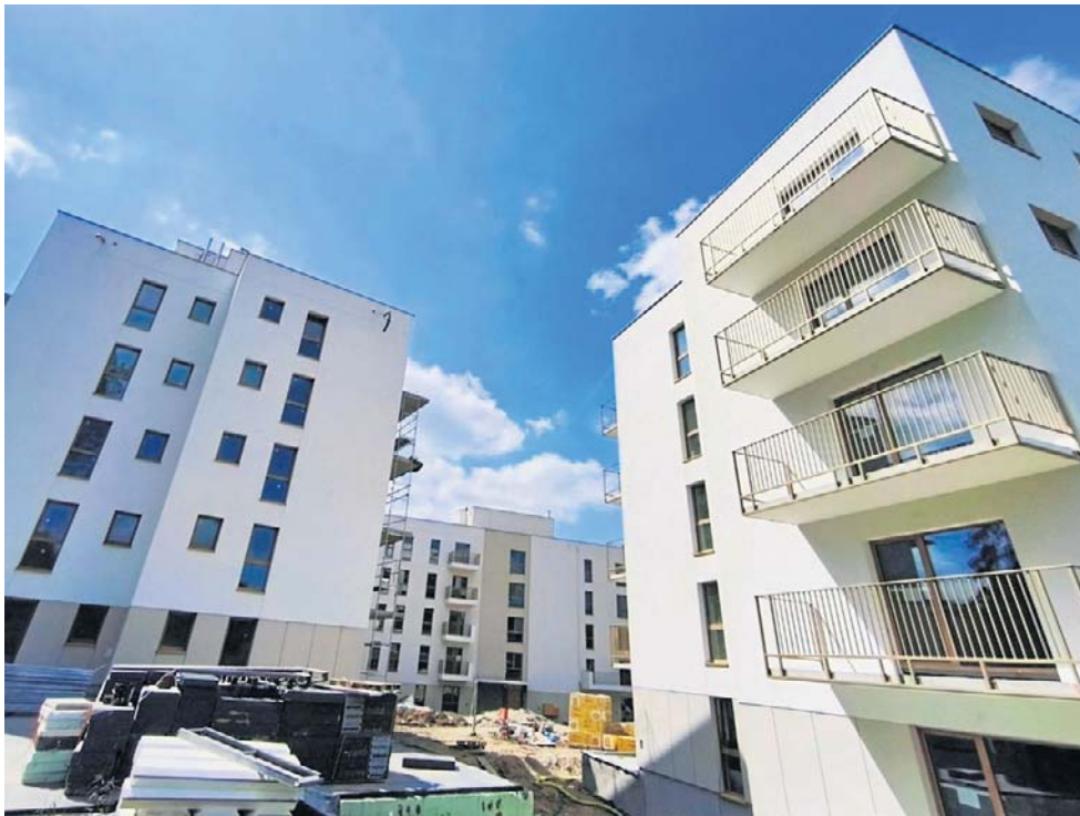
Kątowa Park ma trzy pięciokondygnacyjne budynki. W każdym znajduje się 25 mieszkań.

Zakończony montaż okien i balustrady balkonów oraz tarasów to detale, których osiedle nie miało ubiegłej jesieni. Na tarasach będą jeszcze płytki, a na balkonach pojawią się płyty HPL. Takie wykoń-