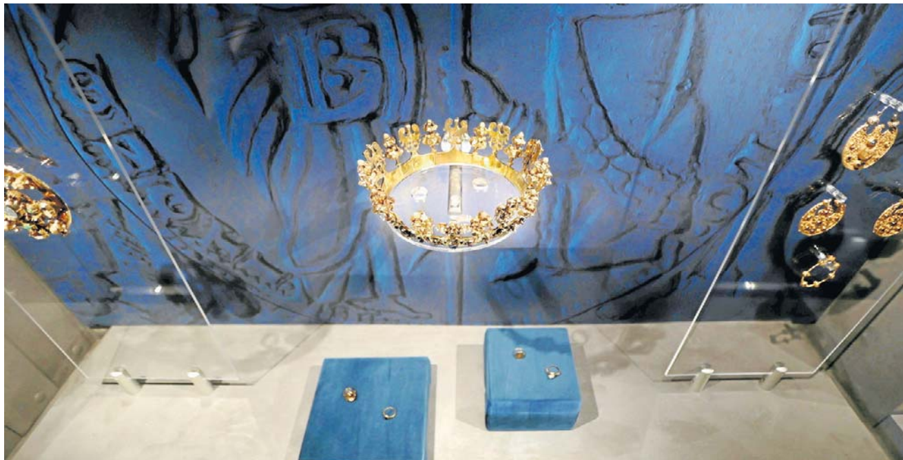
W muzeach we Wrocławiu i Środzie Śląskiej znajdują się odzyskane fragmenty znaleziska: prawie 8 tysięcy monet, gotycka korona ślubna, złote pierścienie i inne elementy j biżuterii. Wszystko jest warte około 250 mln złotych.

Z ruin piwnic domu, zanim zareagowały odpowiednio władze, wyniesiono znaczną część monet i biżuterii. Z czasem pojawiła się także informacja, z której wynikało to, że precjoza pochodzące ze skarbu średzkiego można znaleźć na wysypisku