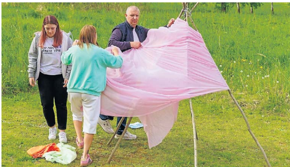
Rozłożenie na wietrze indiańskiego wigwamu wcale nie było łatwym zadaniem.