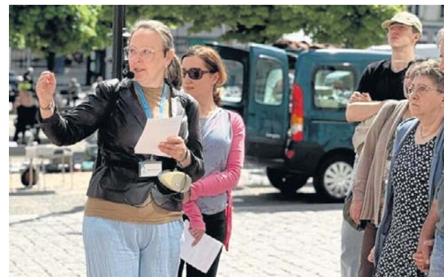
Filmowe Spacerzy w Wałbrzychu ruszyły w sobotę, 23 maja. Chętnych do wysłuchania opowieści nie brakowało.

Cykl bezpłatnych spacerów tematycznych jest elementem projektu „Filmowy Wał-