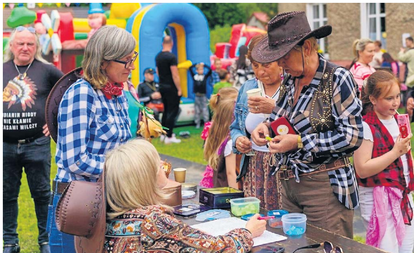
Indian było niewielu. Szeryf pilnował porządku, ale nie było to łatwe. Bo nie brakowało „czarnych charakterów”.