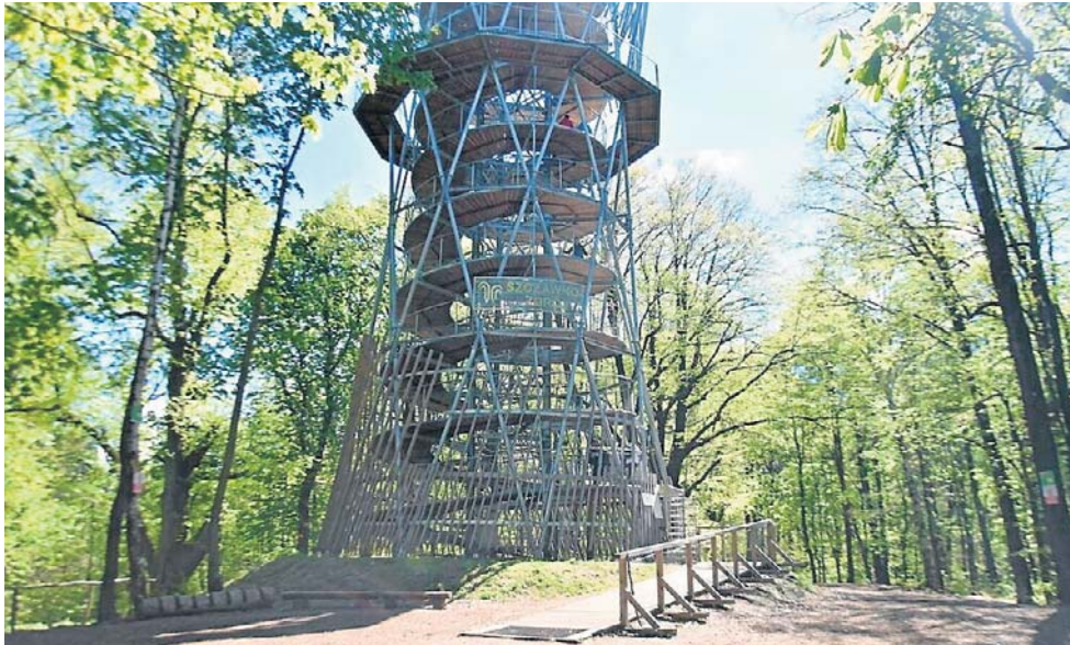
Mieszkańcy Szczawna-Zdroju protestują przeciw asfaltowaniu Wzgórza Gedymina.