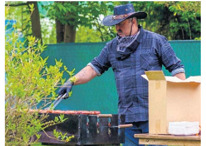
Zabawa zabawą, ale jeść też trzeba. Kielbaski z grilla smakowały w westernowej scenografii znakomicie!