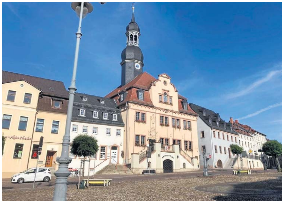
W roku 2025 nasz Czytelnik odwiedził Waldenburg w Szwajcarii. Był nim zachwycony.

- Trudno sobie wyobrazić sobie lepszą okazję, aby ukończyć tę przygodę, niż 600-lecie Wałbrzycha. Dawna niemiecka nazwa mojego rodzinnego miasta, Waldenburg, oznacza dosłownie „Leśny Gród”. Postanowi-