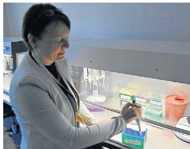
Nowa pracownia uzyskała certyfikat ERIC, potwierdzający najwyższe standardy diagnostyki molekularnej.