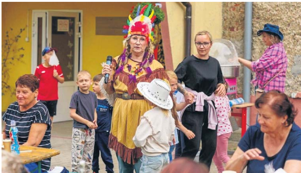
Po terenie przechadzali się kowboje i kowbojki w różnym wieku. Byli też Indianie.