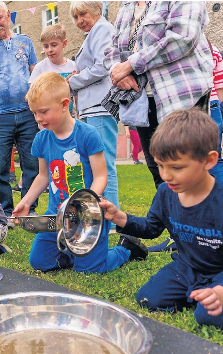
ka godzin w Dzikie Zachód. Było... jak w westernie. Naprawdę!