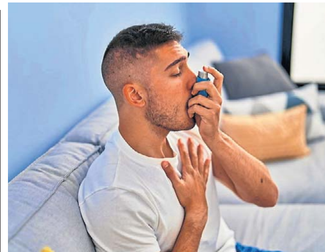
Bardziej sterylne warunki życia i wyższe standardy higieny przyczyniają się do wzrostu częstości alergii

Największym problemem jest czas oczekiwania. Obecnie wynosi on średnio około 8-10 miesięcy, choć w niektórych regionach może być krótszy lub dłuższy. Alternatywą jest wyjazd prywatny. W takim przypadku nie trzeba czekać w kolejce, można samodzielnie wybrać termin i miejsce, a koszty ponosi się w całości samodzielnie. To rozwiązanie często wybierają osoby po świeżych zabiegach kardiologicznych, które nie chcą odkładać rehabilitacji.