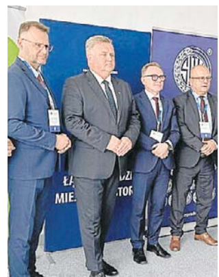
Część uczestników Kongresu Transportowego.

Na kongresie w poniedziałek, 15 czerwca, zjawili się przedstawiciele spółek zarządzających siecią kolejową i drogową oraz portami lotniczymi, a także przedstawiciele wyższych uczelni, które zajmują się komunikacją, w tym naukowcy z Uniwersytetu Radomskiego.