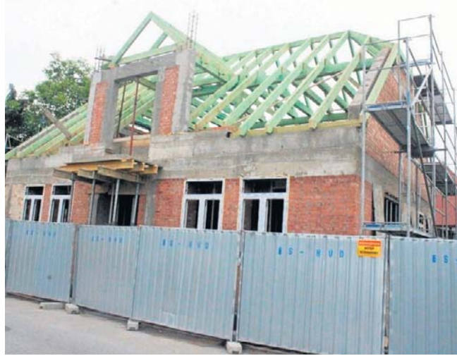
Budynek przy ulicy Piotrówka 19 w Radomiu ma już piętro, trwają prace przy wieżbie dachowej.

Druga część, czyli adaptacja budynku przy ulicy Piotrówka 19 wraz z zagospodarowaniem terenu to koszt ponad 2,1 miliona złotych. Tu przetarg wygrała radomska firma ES-BUD. Na realizację tej inwestycji miasto ma przyznane dofinansowanie z funduszy unijnych w wysokości 5 milionów złotych. ©