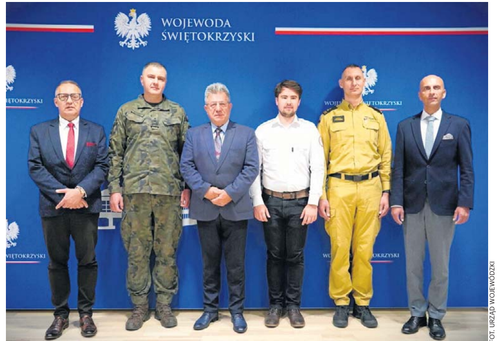
Pikniki Akademii Ochrony Ludności i Obrony Cywilnej odbędą się już w sobotę, 20 czerwca w kilku miejscowościach regionu świętokrzyskiego

Swoje stoiska zaprezentują partnerzy akcji: Państwowa Straż Pożarna, szpital Ministerstwa Spraw Wewnętrznych i Administracji w Kielcach, 10. Świętokrzyska Brygada Obrony Terytorialnej oraz Polski Czerwony Krzyż.