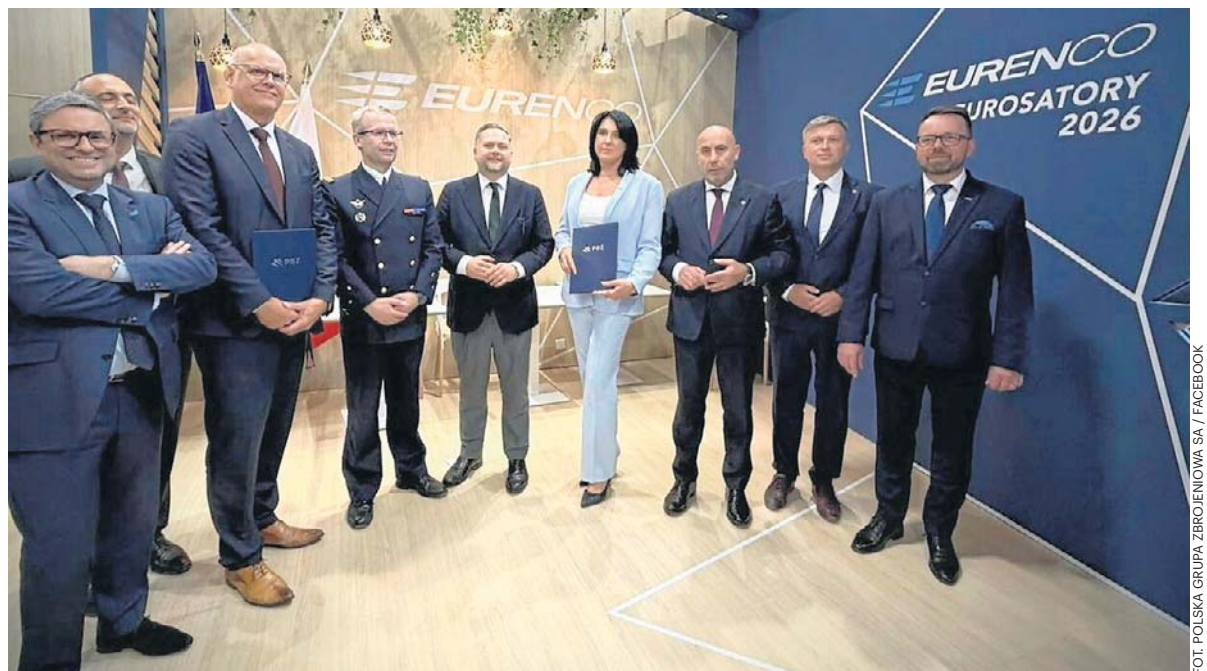
Uczestnicy podpisania umowy w Paryżu w sprawie między innymi fabryki w Pionkach.