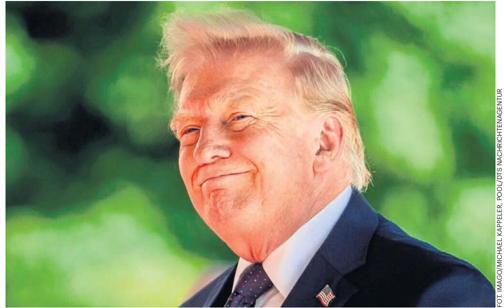
Donald Trump uczestniczy w szczycie G7 we Francji. Kraje europejskie będą zabiegać, by w sprawie wojny w Ukrainie wypracować wspólną linię z prezydentem USA

Powiedział również, że w trakcie rosyjskiej inwazji co miesiąc ginie „dwadzieścia pięć tysięcy osób - głównie żołnierzy”. - A to nie powinno mieć miejsca. Ale wczoraj odbyłem dwie bardzo dobre roz-