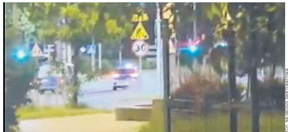
Gdy zapaliło się zielone, oznakowane policyjna auto ruszyło z piskiem opon

Krótki film z telefonu, który pojawił się w poniedziałek na Facebookowym profilu Na Drodze Świętokrzyskie, został nagrany najprawdopodobniej kilkanaście minut przed godziną 1 w nocy z niedzieli na poniedziałek. Widać na nim dwa radiowozy czekające na zmianę świateł na ulicy Źródłowej na skrzyżowaniu z Sandomierską. Gdy zapala się zielone, oznakowana policyjna osobówka rusza z piskiem opon w kierunku Alei Solidarności zostawiając w tyle furgonetkę.