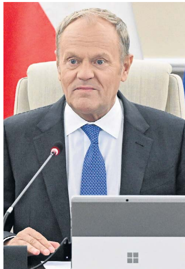
Donald Tusk podkreślił, że rząd nie zamierza biernie oczekiwać na realizację amerykańskich deklaracji