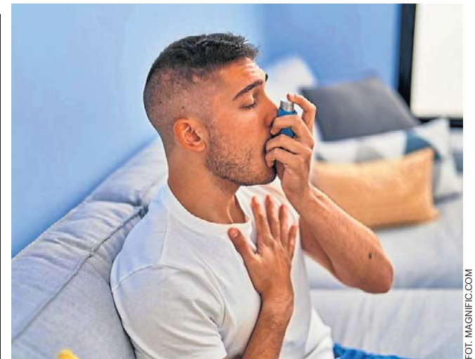
Bardziej sterylne warunki życia i wyższe standardy higieny przyczyniają się do wzrostu częstości alergii

Największym problemem jest czas oczekiwania. Obecnie wynosi on średnio około 8-10 miesięcy, choć w niektórych regionach może być krótszy lub dłuższy. Alternatywą jest wyjazd prywatny. W takim przypadku nie trzeba czekać w kolejce, można samodzielnie wybrać termin i miejsce, a koszty ponosi się w całości samodzielnie. To rozwiązanie często wybierają osoby po świeżych zabiegach kardiologicznych, które nie chcą odkładać rehabilitacji.