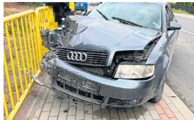
Samochody zderzyły się w na krajowej trasie numer 79 w Złotej (gmina Samborzec w powiecie sandomierskim)