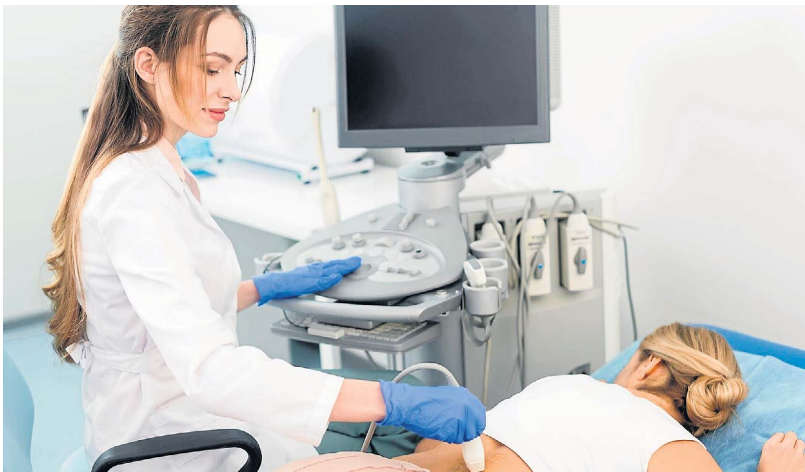
W początkowym stadium rak nerki zazwyczaj nie daje żadnych objawów