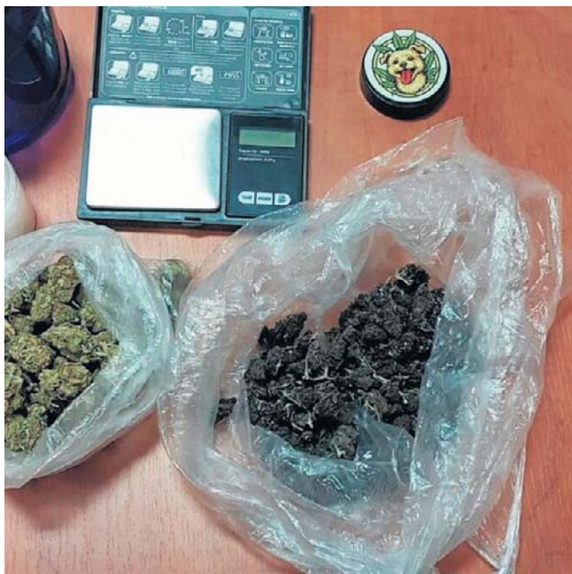
Znaleziono 55 gramów środka wstępnie zidentyfikowanego jako mefedron i 68 gramów najprawdopodobniej marihuany

Przy mężczyźnie oraz pod siedzeniem kierowcy znaleźli łącznie 55 gramów środka wstępnie zidentyfikowanego jako mefedron oraz 68 gramów suszu, najprawdopodobniej marihuany. - 23-latek jest podejrany o posiadanie znacznej ilości narkotyków oraz udzielanie zakazanych środków innym. Może za to grozić nawet 10 lat więzienia - informowała starszy aspirant Joanna Szczepaniak, oficer prasowy Komendy Powiatowej Policji w Staszowie.