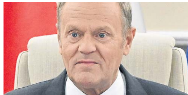
Donald Tusk podkreślił, że rząd nie zamierza biernie oczekiwać na realizację amerykańskich deklaracji

wań do stworzenia warunków, pod stałą bazę amerykańską w Polsce”, a zaproszenie szefa MON jest efektem tych rozmów. Prezydent – jak mówił jego rzecznik – chce porozmawiać z Kosiniakiem-Kamyszem na temat „przygotowań do stworzenia warunków, żeby ta baza funkcjonowała”. PAP