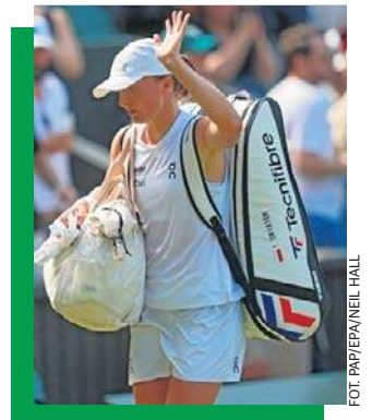
Pokonana i smutna Iga Świątek opuszcza Londyn

W rankingu Polkę na pewno wyprzedzą Amerykanki Jessica Pegula i Coco Gauff oraz Rosjanka Mirra Andriejewa. W sobotę do tego grona mogła dołączyć kolejna reprezentantka USA - Amanda Anisimova. Ubiegłoroczna finalistka również jednak odpadła w 3. rundzie. Dzieją się więc rzeczy bardzo ciekawe.