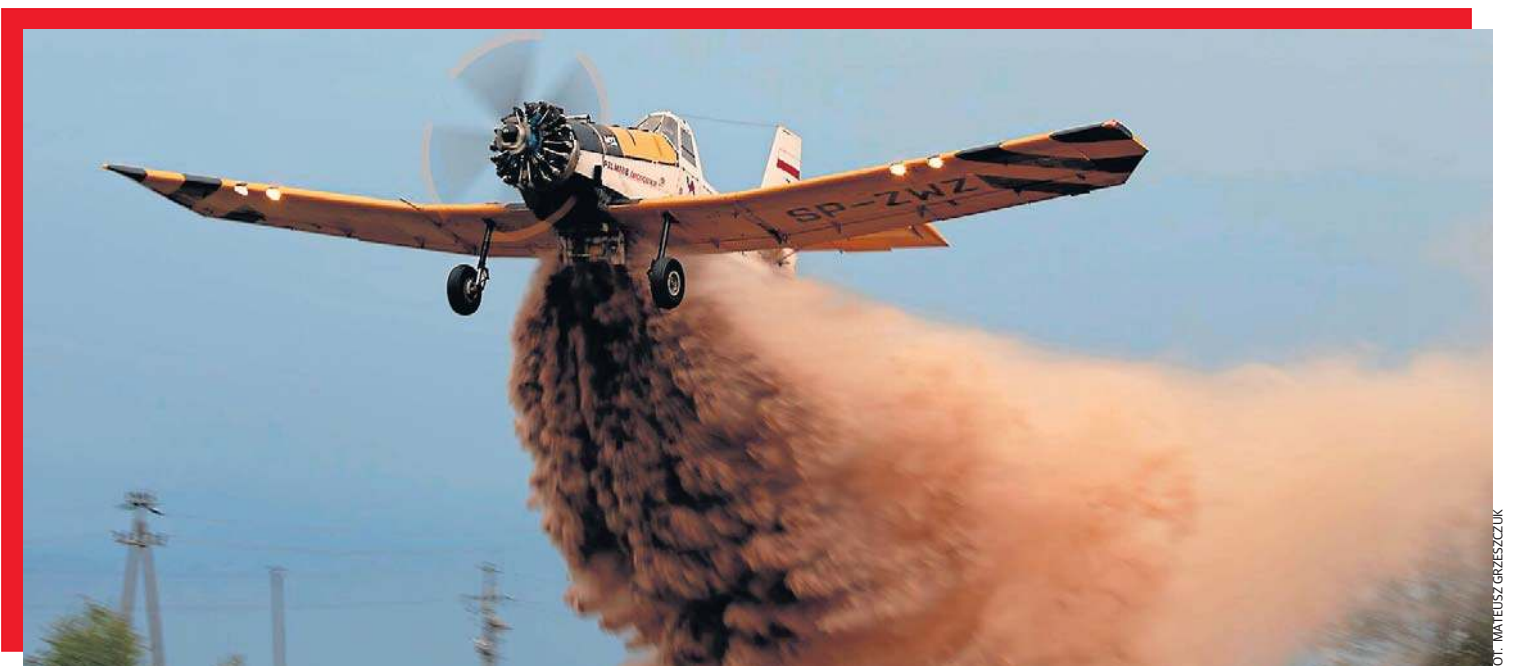
Gdy zrzuca się dwie tony wody, samolot potrafi wyskoczyć kilkadziesiąt metrów w górę.

- Jeśli jednak zrzut zatrzyma ogień w zarodku, zanim wejdzie w zwarty kompleks, oszczędzamy nie tylko drzewa, ale i godziny pracy strażaków, dojazdy, sprzęt - podkreśla pilot z mieleckiej firmy. - Ograniczamy ryzyko dla ludzi, straty przyrodnicze i wszystko, co może stać na drodze ognia.