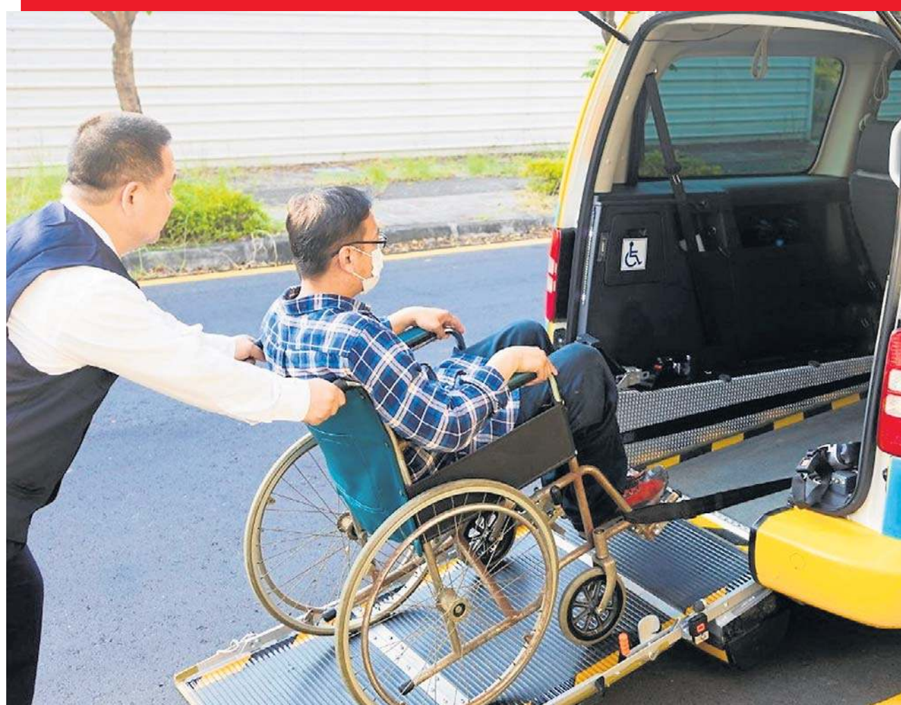
Świadczenie wspierające wypłacane jest przez ZUS w formie przelewu na rachunek bankowy

W całym kraju świadczenie wspierające otrzymuje 354 osób (dane na 30 kwietnia).