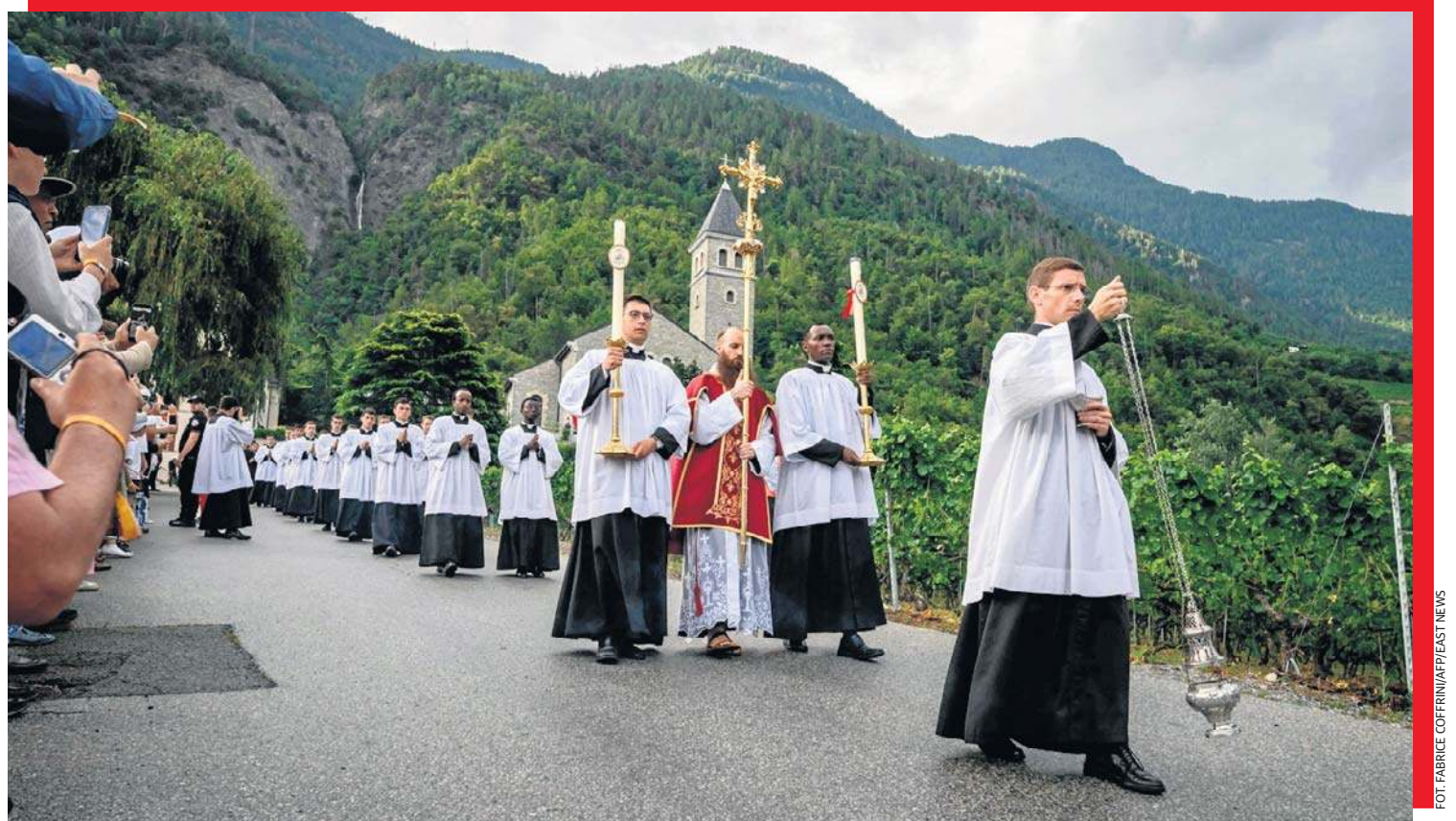
1 lipca 2026 roku. Lefebryści w procesji poprzedzającej schizmatyczną konsekrację biskupów w Écône w zachodniej Szwajcarii. 30 czerwca 2026 roku papież Leon XIV wezwał Bractwo do porzucenia planów.

Odpowiadając na pytanie dziennikarzy w Castel Gandolfo, Leon XIV stwierdził 16 czerwca: „Oczywiście podziały między chrześcijanami są zawsze bolesne, jednak oni odmawiają przyjęcia pewnych fundamentalnych elementów nauczania Kościoła, począwszy od różnych punktów Soboru Watykańskiego II. Jeśli dokonują takiego wyboru, jest mi z tego powodu przykro, ale musimy iść naprzód”.