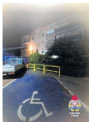
Pożar wybuchł po godz. 22

Ciąg dalszy był dramatyczny. Ludzie ratowali się m.in. skacząc z balkonów. Trzy osoby trafiły do szpitala, w tym jedna ze złamaną nogą. Strażacy z poświęceniem gasili pożar. Straty materialne były znaczne - doszczętnie spaliło się choćby mieszkanie na pierwszym