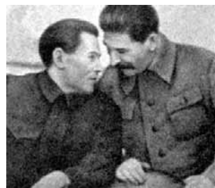
Jeżow i Stalin. Zdjęcie z 1935 r., kiedy Jeżow został sekretarzem KC oraz przewodniczącym komisji kontroli partyjnej

W 1936 r. został mianowany ludowym komisarzem spraw wewnętrznych ZSRR, czyli szefem NKWD. Za jego czasów NKWD stało się machiną do automatycznego mordowania ludzi. Nie chodziło wówczas o prawdę, o zdobywanie dowodów czyjejs winy, a o wyrobienie makabrycznego kontyngentu.