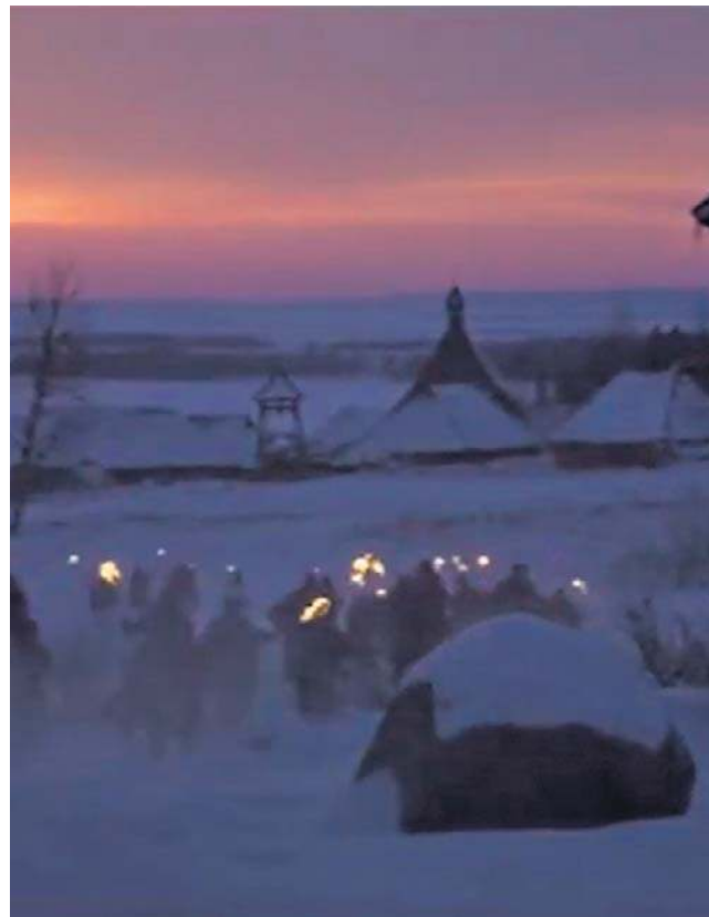
Kmicicowi ludzie pędzą na Wołmontowicze. Kadr z „Potopu” Jerzego Hoffmana z 1974 r.

Oni rzucili się patrzeć; niektórzy nadbiegli z łuczywem i poczęli w oczy świecić nieboszczykom. Po pierwszej chwili zdumienia wszczał się gwar i zamieszanie. Przylecieli i ci, którzy już się byli pokładli w stajniach i oborach. Dom cały zajaśniał światłem, zaroił się ludźmi, a wśród tego zamętu, nawoływań, pytań jedni tylko pobic! leżeli