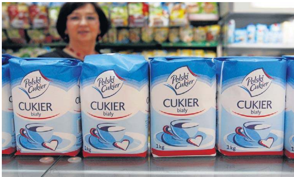
Deflacyjny hit 2025 roku? To na pierwszym miejscu cukier, który potaniał aż o 26,5 proc.

Zacznijmy od miejsca 10., na którym znalazło się masło, które w 2025 roku podrożało o 11,5 proc. (np. w listopadzie 25 kostka kosztowała na Kujawach i Pomorzu średnio 9,21 zł (82,5% za 200 g). Na miejsce 9. trafiła usługa wywozu śmieci, tutaj cena wzrosła o 11,6 proc.; 8. - usługi związane z prowadzeniem gospodarstwa domo-