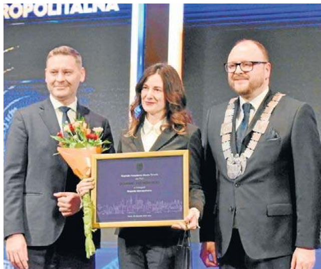
Gala wręczenia Nagród Prezydenta Miasta Torunia za rok 2024 i 2025 odbyła się w Dworze Artusa