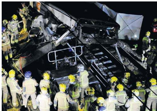
Czarna seria na hiszpańskiej kolei. Doszło do kolejnych wypadków. Zginęła jedna osoba – maszynista pociągu

W tym zdarzeniu nikt nie został poszkodowany.