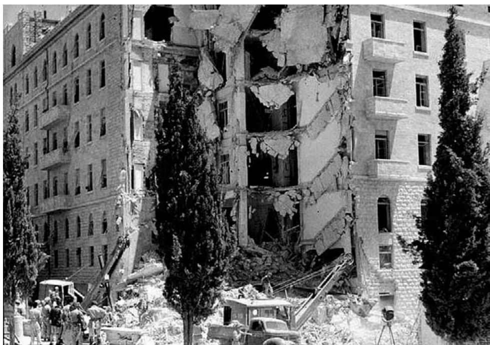
Jerozolimski hotel King David po zamachu Irgunu w 1946 roku. Zginęło wtedy 91 osób, w tym 28 Brytyjczyków, 41 Palestyńczyków i 17 Żydów

Działacze Irgunu wielokrotnie ostrzegali sadystycznego policjanta, że jeśli nadal będzie tak postępował z ich pojmowanymi towarzyszami, to zostanie zabity. Cairns mimo to nie łagodniał, lecz przygotował się na eventu-