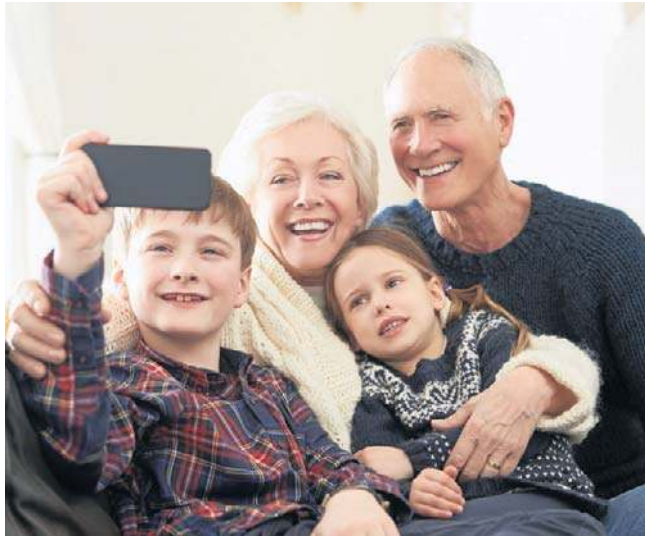
Ekspert obserwuje, że od dłuższego czasu sukcesywnie spada zadłużenie osób, które są na emeryturze.

jętność zarządzania budżetem domowym przez starsze pokolenia, które nierzadko wspierają jeszcze finansowo swoje dzieci i wnuki. Gdzie seniorzy zadłużają się najbardziej? Gdybyśmy chcieli narysować mapę finansowych trosk seniora, najciemniejsze barwy przybrałoby województwo mazowieckie - to tutaj średnie zadłużenie na jedną osobę jest najwyższe w kraju - 55 669 zł -