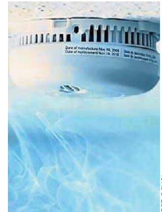
Czujniki trafią do mieszkańców

Beneficjentem projektu będzie marszałkowski Regionalny Ośrodek Zrównoważonego Rozwoju w Przysieku. Działania będą realizowane przy wsparciu Departamentu Bezpieczeństwa i Budowania Odporności Społecznej Urzędu Marszałkowskiego, Departamentu Wdrażania Funduszy Europejskich dla Kujaw i Pomorza Urzędu oraz Kujawsko-Pomorskiego Stowarzyszenia Samorządowego Salutaris. ©