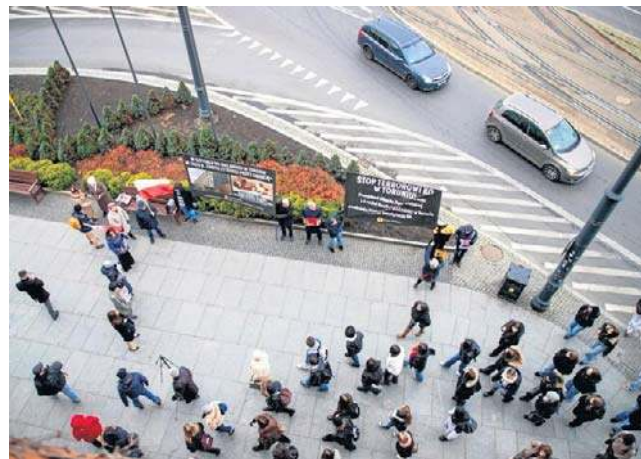
Jednym z powodów odcinania swobodnego dostępu do urzędów były próby okupacji. Na zdjęciu: protest w Toruniu

Ograniczenia w poruszaniu się po urzędach wprowadzono nie tylko w samorządach. W Kujawsko-Pomorskim Oddziale