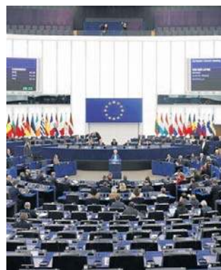
Za głosowało 334 europosłów, przeciw 324, 10 wstrzymało się od głosu

Odrzucono został z kolei drugi wniosek, pod którym podpisała się prawica w PE, w tym PiS. Był on bardzo podobny do pierwszego wniosku. W tym przypadku 225 europosłów było za,