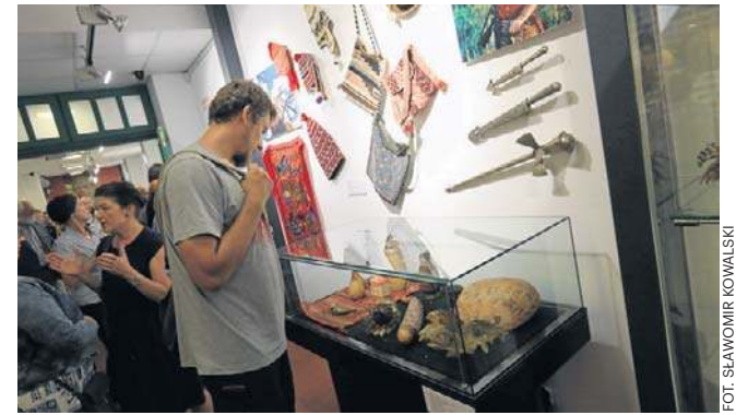
W Muzeum Podróżników znajduje się wiele ciekawych eksponatów związanych z Tonym Halikiem