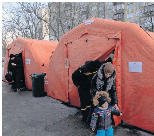
Tysiące kijowian ze swoich mieszkań przeniosło się do ogrzewanych namiotów

Największa prywatna firma energetyczna Ukrainy, DTEK, poinformowała, że rosyjskie