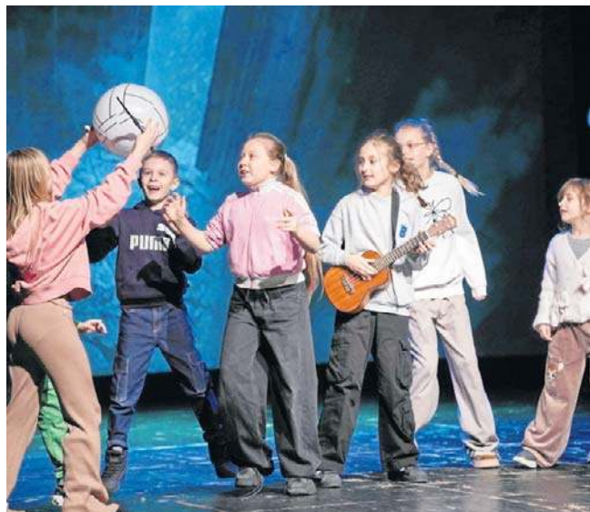
Uczniowie zamiast klasycznych jasełek, stawiają na to, co lubią i już od lat wystawiają nietypowe spektakle

Publiczność ze spektakli wystawianych przez „Edukację” wychodzi zachwycona, choćby dlatego że dzieje się dużo, w nietypowej formie. Bo warto podkreślić, że spektakl łączył w sobie nie tylko historię jasełek i Harry'ego Pottera, ale też muzykę The Beatles. ©