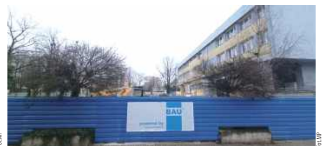
Jeszcze niedawno tu stało północne skrzydło budynku sądu. Zostało wyburzone, a w jego miejsce powstanie nowy obiekt

Docelowo po remoncie pracownicy obu instytucji będą