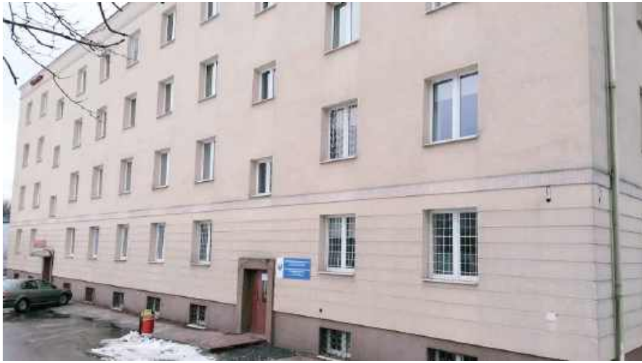
Los przychodni POZ przy ul. Młodzieżowej w Poniatowej stał się jednym z najbardziej emocjonujących tematów końcówki roku

Niepokój, pytania bez jednoznacznych odpowiedzi i ostre głosy sprzeciwu – przyszłość przychodni podstawowej opieki zdrowotnej przy ul. Młodzieżowej 6 w Poniatowej stała się jednym z najgorętszych tematów końcówki 2025 roku. Choć oficjalnie nikt nie mówi o jej likwidacji, mieszkańcy coraz głośniej obawiają się, że placówka może zostać ograniczona lub „po cichu” wygaszona.