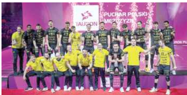
Bogdanka LUK Lublin - triumfatorzy Tauron Pucharu Polski

Po raz pierwszy w historii klubu Bogdanka LUK Lublin sięgnęła po Tauron Puchar Polski. W wielkim finale turnieju w Krakowie żółto-czarni pokonali Asseco Resovię Rzeszów.