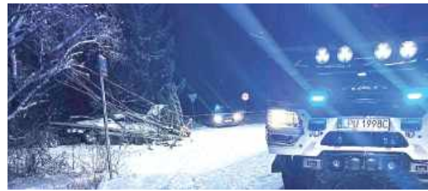
Tego dnia padał śnieg. Kierująca audi kobieta nie dostosowała prędkości do warunków na drodze, wpadła w poślizg i uszkodziła słup energetyczny

Niedostosowanie prędkości do warunków panujących na drodze było przyczyną kolizji, do jakiej doszło w Nowy Rok tuż po północy w Klementowicach