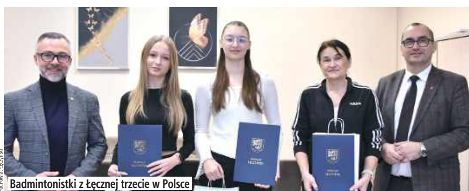
Badmintonistki z Łęcznej trzecie w Polsce