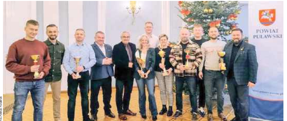
Pracownicy Starostwa Powiatowego zwyciężyli w turnieju piłki siatkowej, który odbył się niedawno w Kocku

Reprezentacja Starostwa Powiatowego w Puławach zwyciężyła w II Bożonarodzeniowym Turnieju Siatkówki Halowej o Puchar Burmistrza Miasta Kock. W zawodach udział wzięło 14 drużyn z województwa lubelskiego. Podczas wydarzenia prowadzono także zbiórkę darów dla Domu Dziecka w Lublinie.