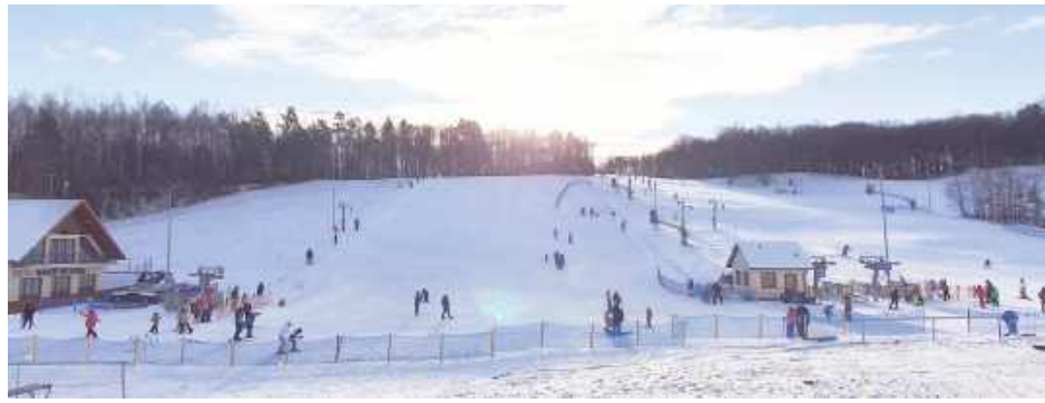
Sezon zimowy rozkręcił się na całego, a stoki w powiecie przeżywają istne oblężenie

Stacja Narciarska Kazimierz w Kazimierzu Dolnym oferuje obecnie 6 czynnych tras zjazdowych oraz 5 wyciągów o długościach od 110 do 590 metrów. Aktualna pokrywa śnieżna wynosi tam około 80 cm. Ceny kartetów to 80 zł za 2 godziny oraz 90 zł za 3 godziny. Koszt przejazdu taśmą wynosi 5 zł, natomiast wyciągiem - 7 zł. Stok czynny jest codziennie w godzinach od 9.00 do 21.00.