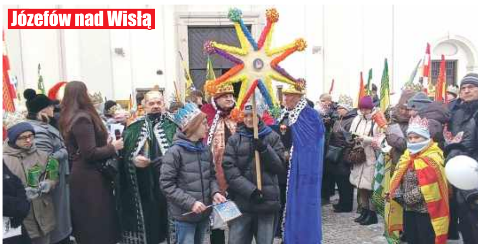
Józefów nad Wisłą

W Opolu Lubelskim nie mogło zabraknąć szopki z żywymi zwierzętami. I - jak co roku - wzbudziła ona wielką radość zwłaszcza wśród najmłodszych mieszkańców gminy