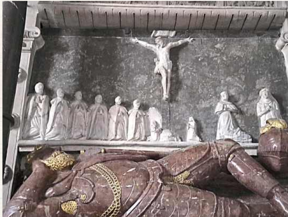
Jednym z najciekawszych zabytków regionu jest nagrobek Mikołaja Mniszcha (młodsze) w kościele Świętej Trójcy w Radzynie Podlaskim. Nad leżącym rycerzem mamy scenę pokazującą innych członków rodu

i czopowego, wykup młynów, doszła mu w r. 1540 dzierżawa królewskiego miasteczka Kozirynka (Radzyń Podlaski) wraz z należącymi doń wsiami. Dn. 1 VIII 1548 Zygmunt August połączył zapisy Mniszcha na Łukowie i Kozimryнку w ogólną sumę 6 462 złp. wliczając w nią gratyfikację z tytułu nakładów poniesionych przez Mniszcha po pożarze miasta i dworu oraz z racji wydatków na lokowanie nowych wsi z folwarkami, a w kilka dni później nadanie to zostało umocnione przyznaniem Mniszchowi oraz jego żonie i najstarszemu synowi dożywocia”. Za nadaniami tymi staje w dużej części świetna relacja z Boną. W 1537 roku królowa wykupiła dobra wokół Łukowa i Radzyna od rodziny Kaznowskich i przekazała je Mikołajowi, co było zresztą niemalym skandalem. Kolejnym jego patronem został Zygmunt August, po którego stronie stanął w czasie konfliktów z matką po śmierci jego ojca. Potrafił też zadbać