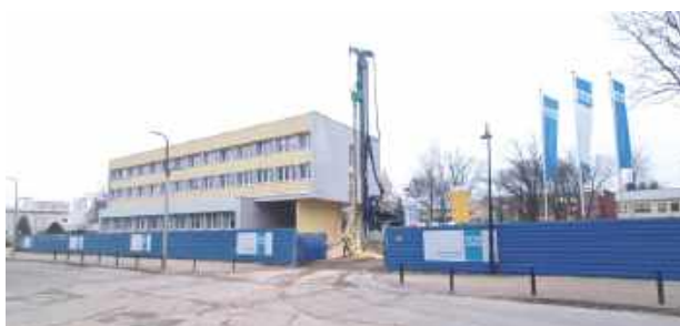
Przebudowa sądu w Puławach ruszyła jesienią. Ciężki sprzęt budowlany i ciężarówki wyjeżdżające z placu budowy to teraz tam częsty widok

Długo oczekiwana przebudowa ruszyła jesienią. Na czas realizacji prac sąd i prokuratura musiały zmienić lokalizację. Biuro podawcze, I Wydział Cywilny, III Wydział Rodzinny i Nieletnich, IV Wydział Pracy oraz I i II Zespół Kuratorskiej Służby Sądowej przeniosły się do budynku sądu przy Al. Partyzantów 6A. Tam też obecnie mieści się czytelnia akty dla Wydziału I Cywilnego, II Karnego i III Rodzinny i Nieletnich, IV Pracy, V Ksiąg Wieczystych. II Wydział Karny pracuje aktualnie w budynku Puławskiego Par-