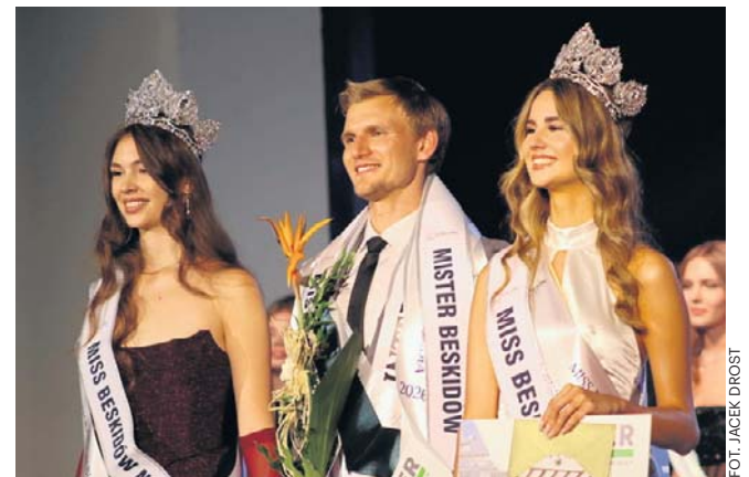
Final wyborów odbył się w Bielskim Centrum Kultury