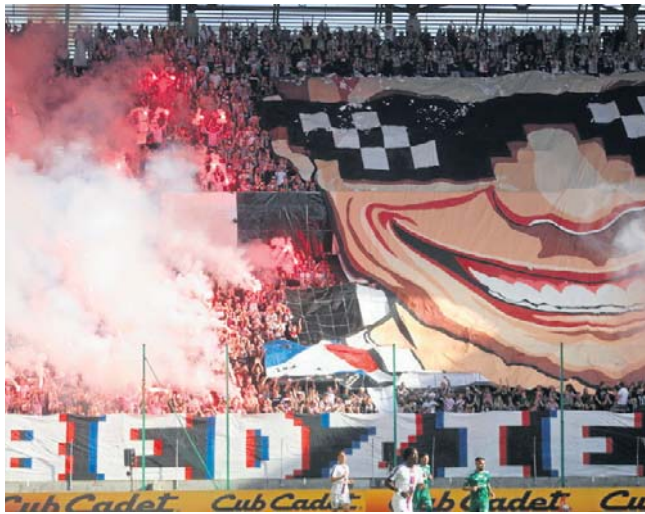
Ekonomiczne realia zmuszają miasta do pełnienia roli głównego sponsora dla klubów piłkarskich