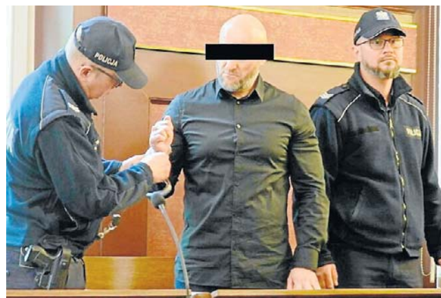
Sąd zmienił część kar, a skruszonych przestępców uznał za wiarygodnych

Proces pierwszej instancji toczył się w latach 2019-2023 przed Sądem Okręgowym w Katowicach. Wówczas orzeczono kary od więzienia w zawieszaniu aż po 15 lat bezwzględnej pozbawienia wolności. Sąd Apelacyjny w Krakowie, rozpatrujący odwołania od marca tego roku, potwierdził, że katowicki proces toczył się obiektywnie, gwarantując oskarżonym prawo do obrony.