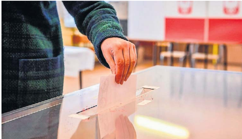
Pojawienie się na listach podpisów nieżyjących osób może rodzić poważne konsekwencje prawne

Ostatecznie wśród dwóch głównych powodów odrzucenia inicjatywy referendalnej w Bę-