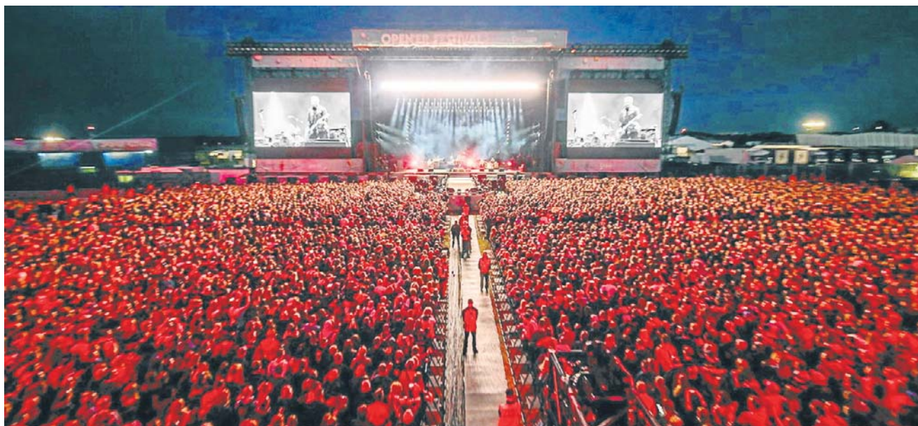
Open'er jest gigantem na europejską skalę i z globalnymi ambicjami. Biznes jest już mniej spektakularny

Polski biznes festiwalowy jest mało – na pierwszy rzut oka – optymalny. Marża netto rzędu 3-10 proc. przy dużej skali to często bardzo dobry wynik, zaś po lekturze sprawozdań finansowych największych graczy w branży odciecia się próbować w tym swoich sił.