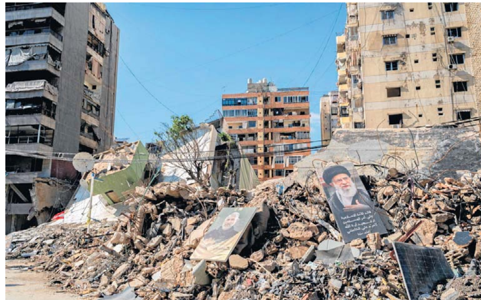
Zniszczone budynki na południowych przedmieściach Bejrutu. Tysiące mieszkańców po atakach trwających od marca zostało zmuszonych do opuszczenia swoich domów

Walki w Libanie były jednym z najbardziej znaczących skutków ubocznych wojny z Iranem - ocenił Reuters. Od 2 marca, kiedy Hezbollah rozpoczął raketowy i dronowy ostrzał Izraela, ponad 1,2 mln Libańczyków musiało opuścić domy w wyniku izraelskich