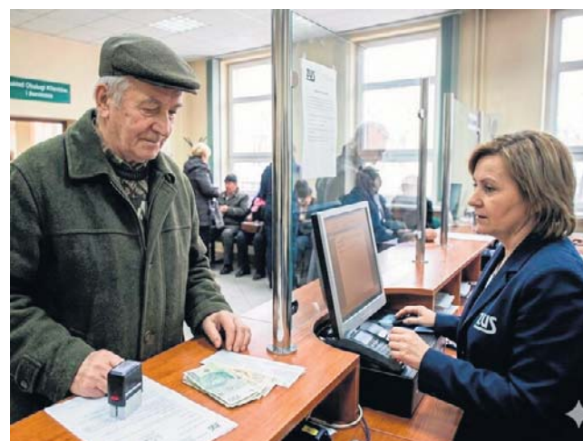
Dane statystyczne wskazują, że polscy emeryci coraz chętniej pozostają na rynku pracy

Średni wiek osób, które łączą pobieranie emerytury z aktywnością zawodową, wynosi obecnie prawie 68 lat (69 lat i 5 miesięcy dla mężczyzn oraz 66