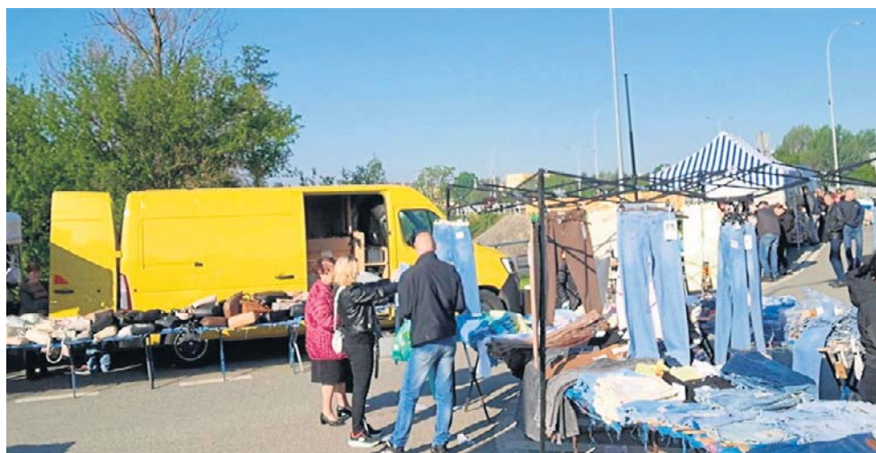
Transport odzieży na bazarach jest pod ścisłym nadzorem fiskusa. System SENT może przyczynić się do likwidacji wielu mikroprzedsiębiorstw

Nowe obowiązki wywołały jednak silną reakcję przedsiębiorców - szczególnie małych