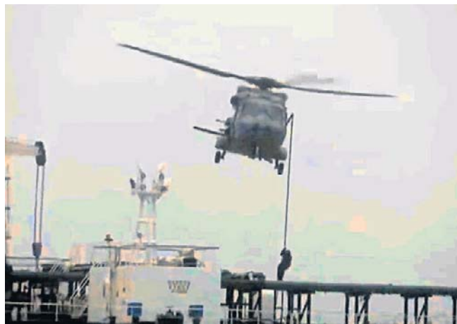
Francuska marynarka wojenna dokonała przejęcia tankowca Tagor na wodach Oceanu Atlantyckiego

W styczniu Francja zatrzymała na Morzu Śródziemnym tankowiec Grinch. W marcu doszło do zatrzymania tankowca Deyna. Oba są zaliczane do rosyjskiej „floty cieni”. PAP