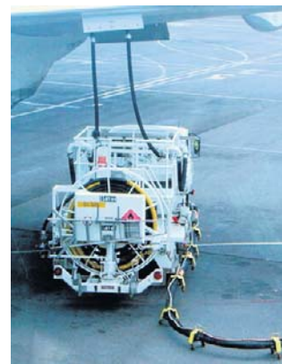
Moskwa zakazała eksportu paliwa lotniczego

W ubiegłym tygodniu Kreml rozważał ograniczenie eksportu oleju napędowego i paliwa lotniczego, o czym pisała we wtorek rosyjska agencja Interfax, powołując się na własne źródła. Z kolei agencja Reutersa poinformowała w piątek, że produkcja oleju napędowego w kraju spadła już o około 20 proc. w kwietniu i maju.