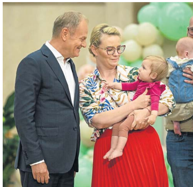
Donald Tusk na spotkaniu z okazji drugiej rocznicy przywrócenia rządowego programu in vitro

- Żeby były bezpieczne, żeby rodzice mieli poczucie bezpie-