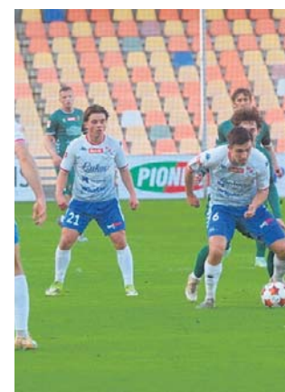
Podbeskidzie będzie dziś faworytem półfinału

Podbeskidzie w półfinale zmierzy się z rezerwami Śląska Wrocław. Początek wtorkowego starcia o godzinie 13. Drugą parą (Olimpia Grudziądz - Sandecja Nowy Sącz) będzie rywalizować od 16. Pora obu meczów, a zwłaszcza bielskiego, wzbudziła wśród kibiców zrozumiałe oburzenie. PZPN twierdzi, że winę ponosi TVP, która później ma w planach transmisję z mistrzostw świata w koszykówce 3x3. Tym nie-