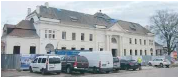
Mężczyzna z rowerem obserwuje kobiety przy Dworcu PKP w Łukowie i w niepokojący sposób dotyka się przez spodnie

Na portalu fejsbukowym Spotted: Łuków pojawił się wpis, w którym autorka ostrzegała kobiety korzystające z parkingu przy dworcu PKP.