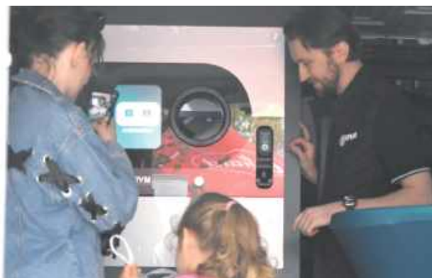
Mieszkańcy zobaczyli, jak korzystać z recykłomatu

Od godz. 10 na rynku pojawił się recykłomat, do którego można było wrzucać niezgniecione butelki i puszki. W zamian każdy uczestnik otrzymywał paczkę z ciastkami od firmy Dr Gerard. Zasada była prosta – im więcej opakowań, tym więcej nagród.