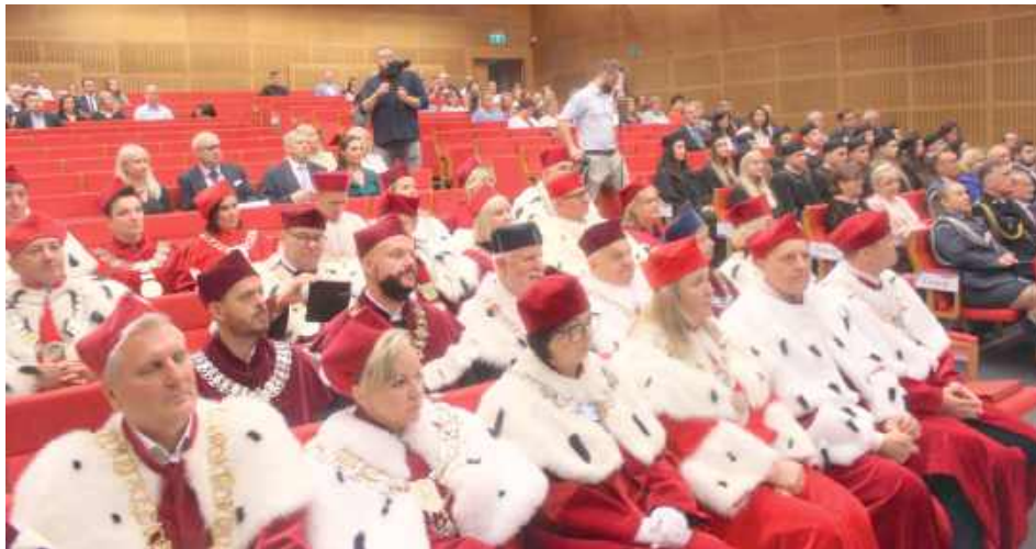
Aula Akademii Białskiej rozbyszła gronostajową bielą od przybyłych gościnnie rektorów wielu polskich uczelni

Kilkudziesięciu rektorów i prorektorów z wielu uczelni zawodowych w kraju przybyło na uroczystości jubileuszowe 25-lecia Akademii Białskiej im. Jana Pawła II. Właściwie świętowanie zaczęło się już 16 października 2024 roku od XXV Inauguracji Roku Akademickiego 2024/2025 i obfituje w wiele imprez, konferencji i koncertów.