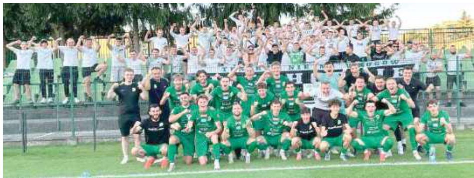
Radość białczan oraz kibiców, którzy przyjechali do Tarnobrzega