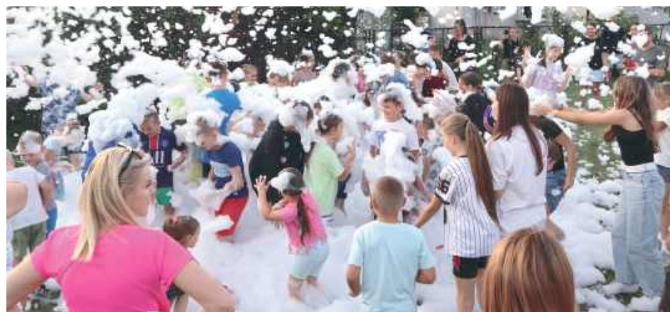
Dzieci chętnie uczestniczyły w niezwyklej atrakcji przygotowanej przez strażaków – piana party

Dzieci mogły korzystać z licznych atrakcji przygoto-