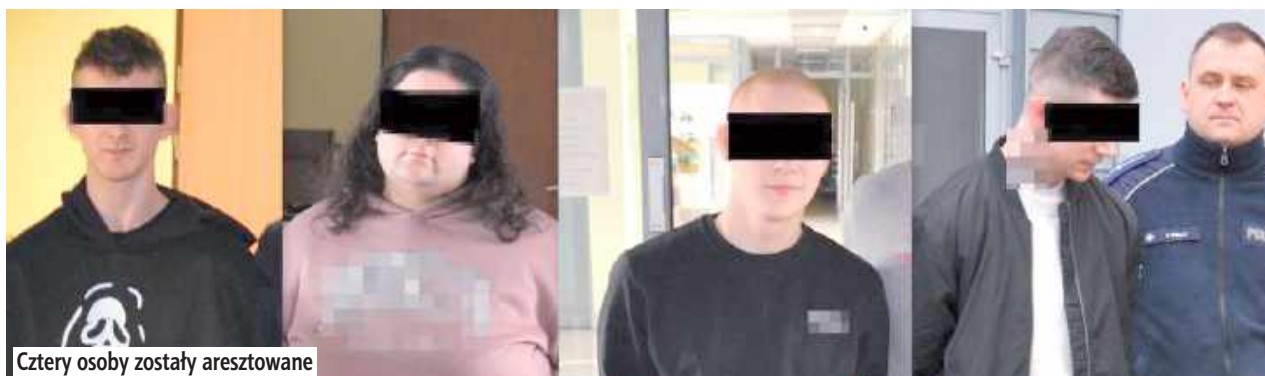
Cztery osoby zostały aresztowane

Do zatrzymań doszło w lutym na terenie Radzyna Podlaskiego. Funkcjonariusze weszli do jednego z mieszkań. Z posiadanych informacji wynikało, że zamieszkująca tam para w wieku 20 i 25 lat może posiadać środki odurzające. W trakcie przeszukania policjan-