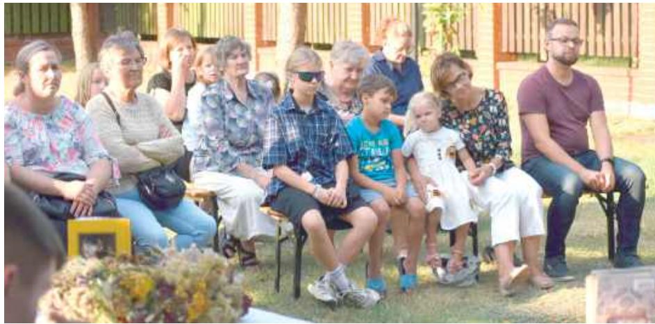
W wydarzeniu chętnie wzięli udział mieszkańcy gminy

W sobotnie popołudnie, 6 września, na terenie zielonym przy Gminnym Centrum Kultury w Drelowie odbyła się kolejna edycja ogólnopolskiej akcji Narodowego Czytania. Wydarzenie poświęcone było poezji Jana Kochanowskiego, jednego z najwybitniejszych twórców polskiego renesansu.