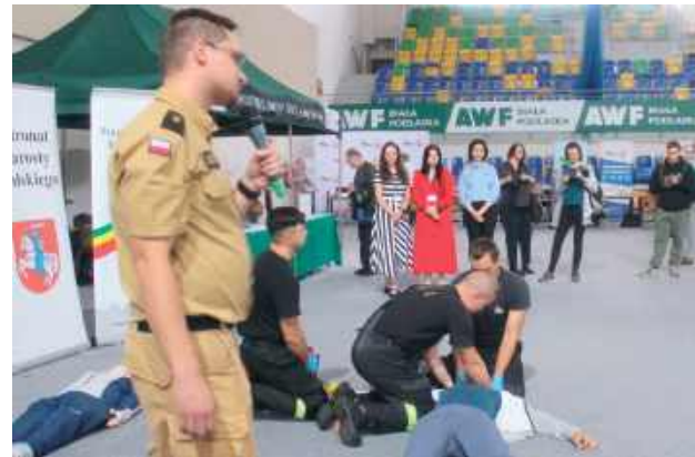
Wielu zwiedzających zainteresował pokaz ratownictwa drogowego przygotowany przez białą Komendę Miejską Państwowej Straży Pożarnej

- Te targi są bardzo ważne przede wszystkim dlatego, że dają możliwość spotkania potencjalnego pracodawcy, który dysponuje miejscami pracy,