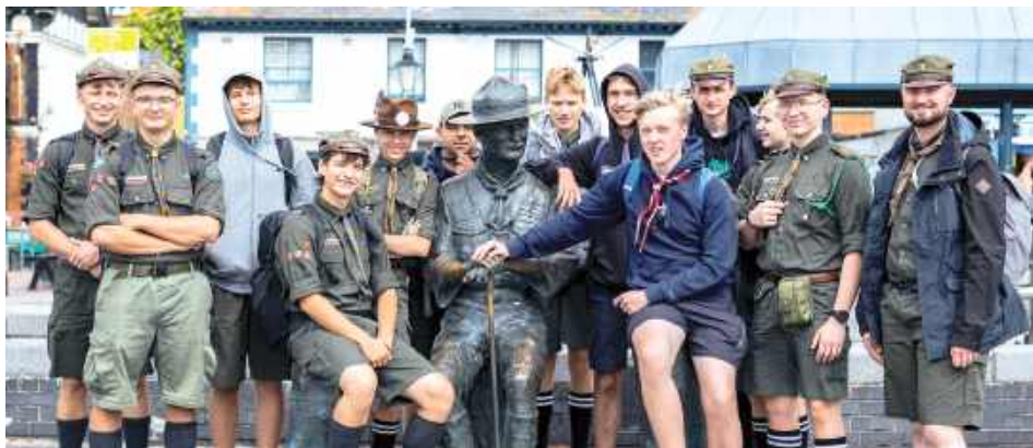
Harcerze przy pomniku Roberta Baden - Powella (założyciela skautingu)