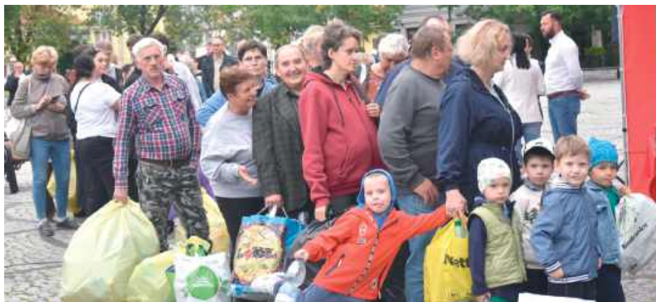
W kolejce do urzędu ustawili się tłum mieszkańców, którzy chętnie wymieniali plastikowe butelki na słodkości

Na skwerku w Międzyrzeczu Podlaskim 19 września mieszkańcy mieli okazję wziąć udział w wyjątkowej akcji ekologicznej połączonej ze słodką niespodzianką.