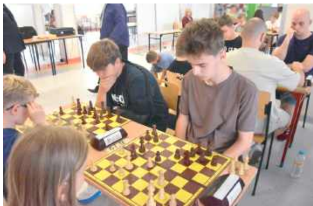
Zawody odbywały się w budynku ZPO nr 3 w Międzyrzeczu Podlaskim