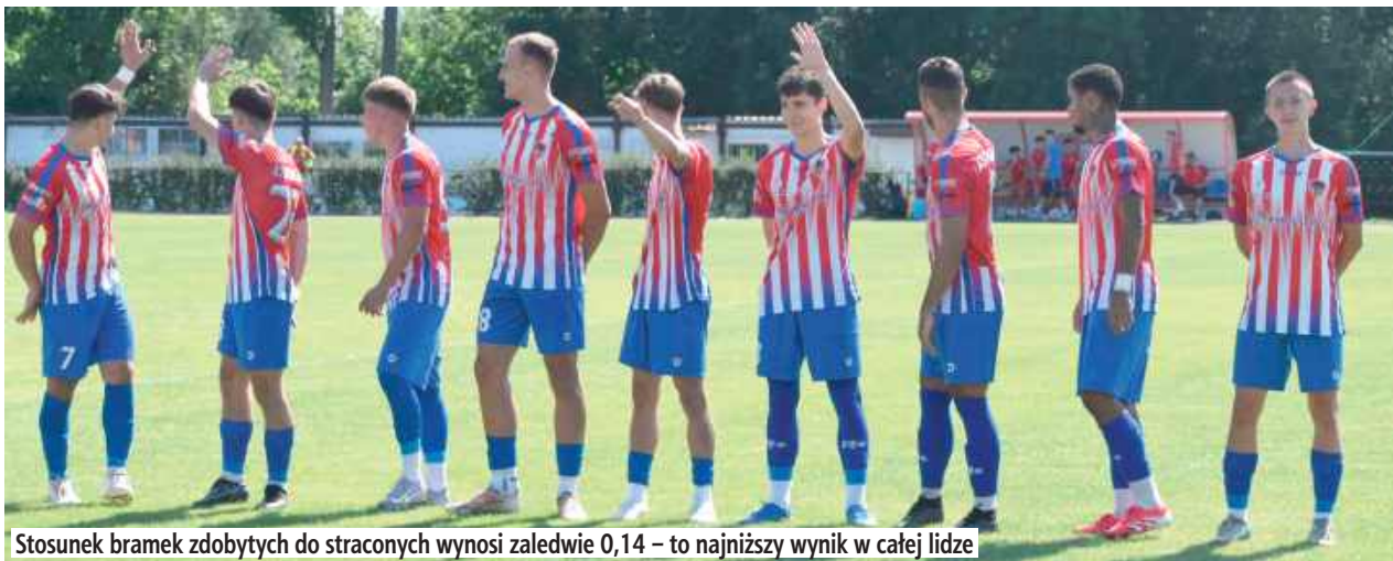
Stosunek bramek zdobytych do straconych wynosi zaledwie 0,14 – to najniższy wynik w całej lidze