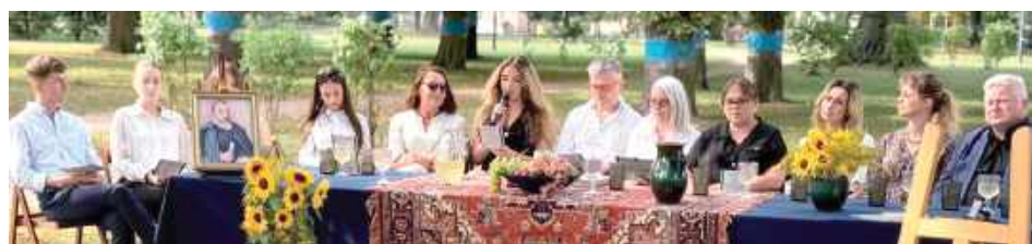
W czytaniu uczestniczyli przedstawiciele różnych środowisk – od samorządowców i duchownych, po uczniów oraz reprezentantów międzyrzeczckich instytucji

Międzyrzeczka odsłona wydarzenia odbyła się pod hasłem „Kto mi dał skrzydła – o żywocie Jana Kochanowskiego”. Na uczestników czekało nie tylko wspólne czytanie, ale również muzyczne interpretacje