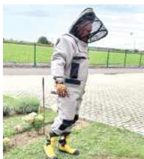
Strażacy musieli pracować przy użyciu pełnych ubrań ochronnych, masek i rękawic, aby zminimalizować ryzyko użądlenia i kontaktu chemikaliów ze skórą

O godzinie 12.47 ratownicy zostali zadysponowani do usunięcia owadów błonkoskrzydłych, które pojawiły się w rejonie uczęszczanym przez dzieci i pracowników. Obecność gniazda tych owadów