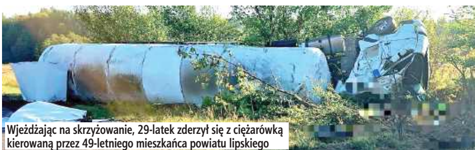
Wjeżdżając na skrzyżowanie, 29-latek zderzył się z ciężarówką kierowaną przez 49-letniego mieszkańca powiatu lipskiego

Kierujący Mazdą 29-letni mieszkaniec powiatu opolskiego, wyjeżdżając z drogi podporządkowanej, nie ustąpił pierwszeństwa przejazdu i uderzył w bok naczepy samochodu ciężarowego marki DAF.