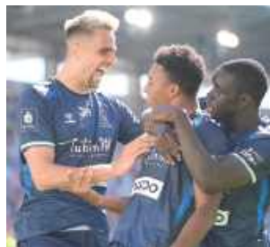
Radość Motoru z gola na 1:2

Spotkanie nie rozpoczęło się dobrze dla defensywy Motoru. Już w 6. minucie rywale otworzyli bowiem wynik, po tym, jak