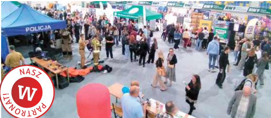
Młodzi gromadziła się głównie przy namiotach służb mundurowych: Wojska Polskiego, Policji, Służby Więziennej i Straży Granicznej

Aż 89 wystawców gościło na III Białskich Targach Pracy w hali sportowo-widowiskowej. W tym gronie pojawili się nawet przedstawiciele kilku firm z woj. mazowieckiego. Najbardziej zadowolona z odwiedzenia tej imprezy była młodzież z kilku szkół.