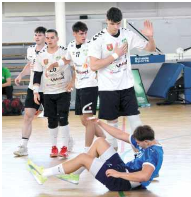
Bialczanie zaczęli sezon od wysokiej porażki z Anilaną. W piątek u siebie zagrają z Padwą Zamość