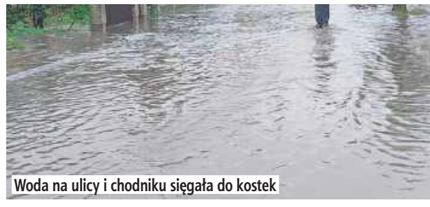
Woda na ulicy i chodniku sięgała do kostek

Najbardziej cierpią rodzice z dziećmi i osoby starsze. Przejście chodnikiem staje się praktycznie niemożliwe, a kałuże utrzymują się długo po zakończeniu opadów.