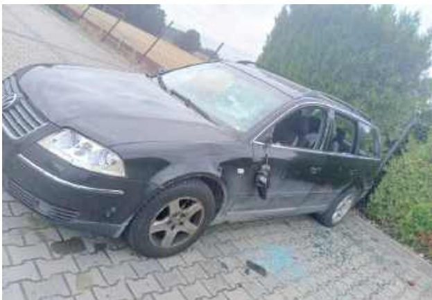
Samochód jest zniszczony całkowicie - ma pourywane lusterka, wybite szyby i lampy czy ślady uderzeń ciężkiego, ostrego narzędzia na karoserii. Koszt jego naprawy znacznie przewyższa wartość ruchomości

- Prowadzimy takie postępowanie w kierunku artykułu 288