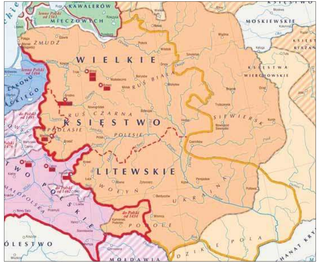
Wielkie Księstwo Litewskie

W ieszcz Adam Mickiewicz zapewne nie zdawał sobie sprawy z tego, ile zamieszania wywoła rozpoczynając naszą narodową epopeję od słów: „Litwo, Ojczyzno moja...” Zapewne nie miał poety niczego złego na myśli ani też złych intencji, jednak zamieszanie snuje się za nami po dziś dzień. Jak to więc jest z tą Litwą, z Ojczyzną Mickiewicza i macierzą tych wszystkich, którzy składają się na nieprzebrane dziedzictwo Wielkiego Księstwa Litewskiego?