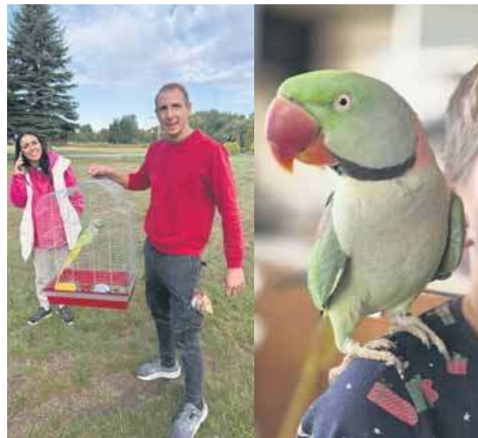
Papuga Mango

Papuga o imieniu Mango z Mikołowa, która przez sześć dni była poza domem, odnalazła się aż w Jaworznie, czyli aż 40 kilometrów od swojego domu. Jej właściciele trzy razy przyjeżdżali do miasta, aby ją odnaleźć. Mimo niepowodzeń, nie tracili nadziei, że odnajdą swoje zwierzę. W poszukiwaniach ogromnie pomogli mieszkańcy Jaworzna. Cała historia zakończyła się szczęśliwie i ukazuje ogromną moc internetu oraz ludzką solidarność i empatię.