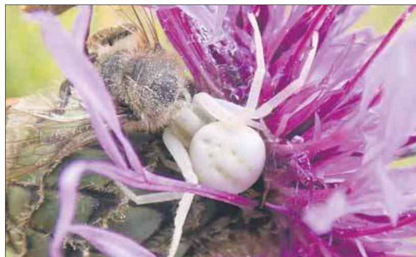
Kwietnik namiastek i pszczoła

Na początku lipca w tej okolicy najbardziej kwitnąco wyglądał gorzysz pagórkowy. Teraz te rośliny już owocują. Obecnie w skupiskach białych baldachów dominuje żebrzyca roczna o blaszkach liściowych po-