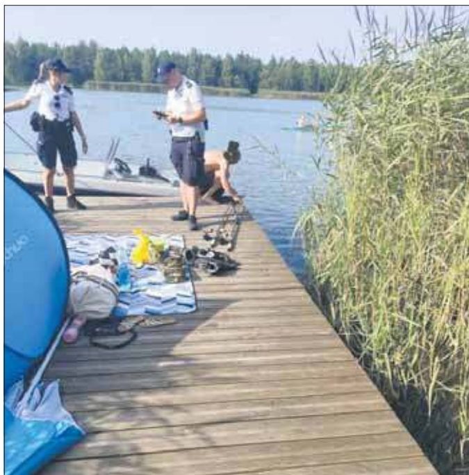
Interwencja policji

Łącznie przeprowadzanych jest około 170 kontroli rocznie. Podczas jednej kontroli sprawdzanych jest od 12 do nawet 50 wędkarzy. Wykroczeń jest stosunkowo niewiele w porównaniu z liczbą kontroli,