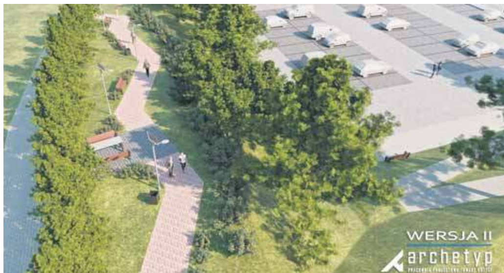
Projekt placu przy ulicy 3 Maja

Trwają prace nad projektem nowej przestrzeni miejskiej przy ulicy 3 Maja w Jaworznie. Miasto przygotowało już pierwsze wizualizacje placu, a teraz do głosu zaprasza mieszkańców, którzy mogą zgłosić uwagi oraz propozycje.